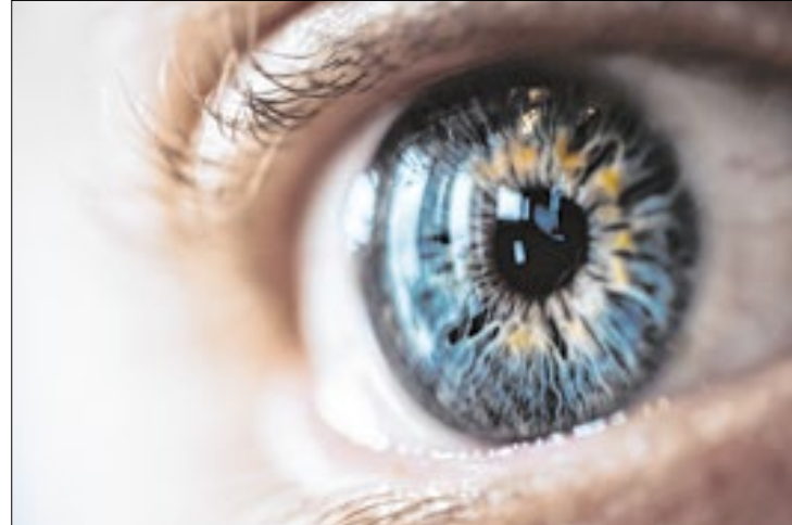
As orientações essenciais para cuidar da saúde ocular

Coçar os olhos pode parecer inofensivo, mas a prática repetida pode prejudicar a estrutura ocular e aumentar o risco de doenças como o ceratocone e danos a estruturas internas do olho. Além disso, as mãos podem transmitir bactérias,