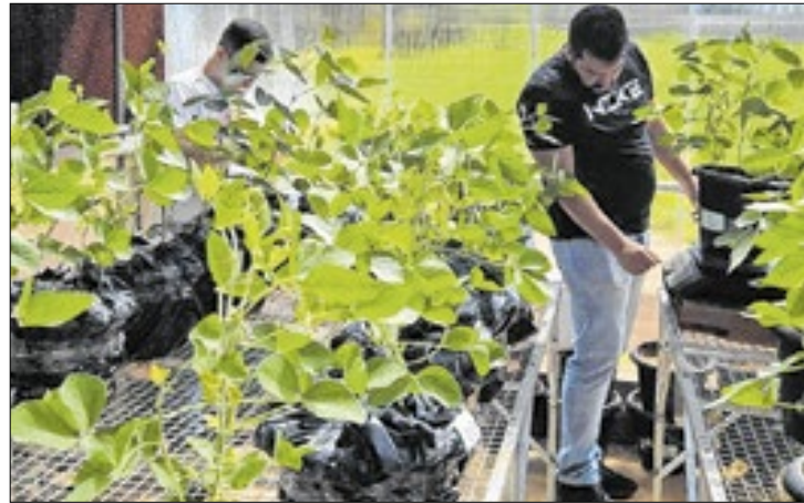
Estudos científicos beneficiam o agronegócio na região