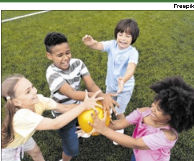
Semana de prevenção da violência