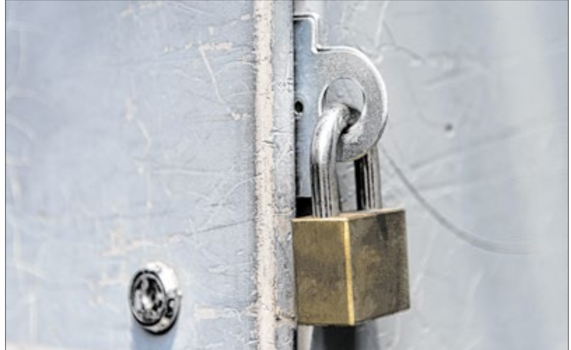
A informação foi divulgada esta semana no Relatório de Informações Penais

São Paulo é o estado com o maior número de presos, com 200.178 encarcerados. Em seguida vem Minas Gerais, com