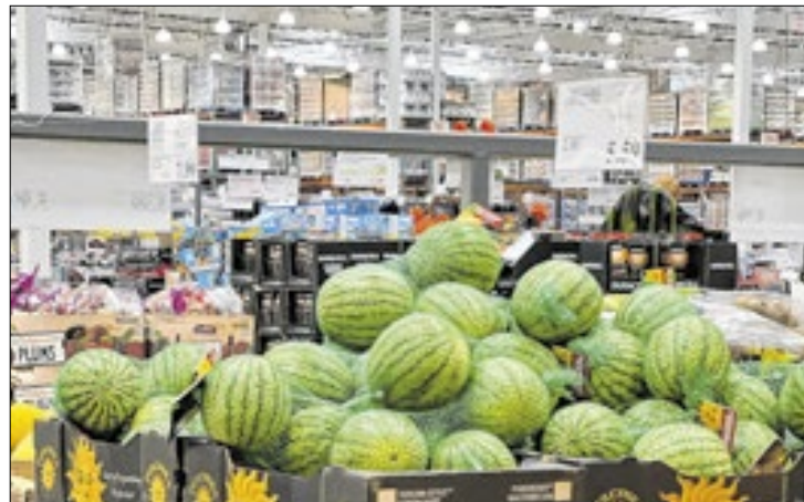
Em agosto, vendas do varejo baiano cresceram 1,3%