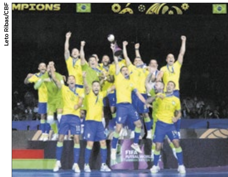
Campeões voltaram no mesmo voo que os vice-campeões