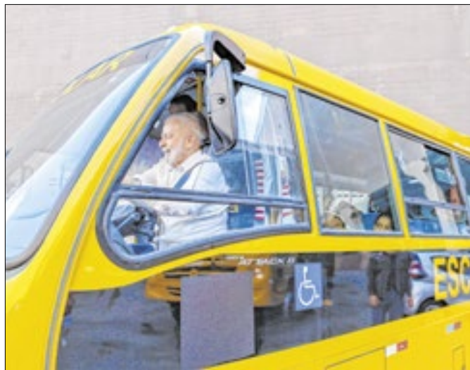
Lula admite: PT precisa rediscutir seu rumo