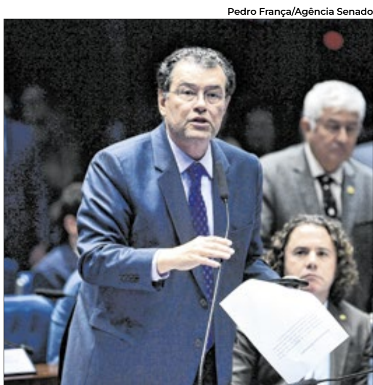
Braga deve apresentar esta semana plano de trabalho

Na última terça-feira (8), a CCJ também iria votar o projeto de lei que anistia os presos dos atos antidemocráticos que atacaram às sedes dos Três Poderes, em 8 de janeiro de 2023. O projeto foi adiado pela segunda vez e a comissão tem não agenda marcada para esta semana.