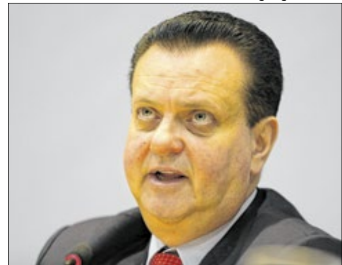
Presidente do partido olha para 2026, 2028, 2030...