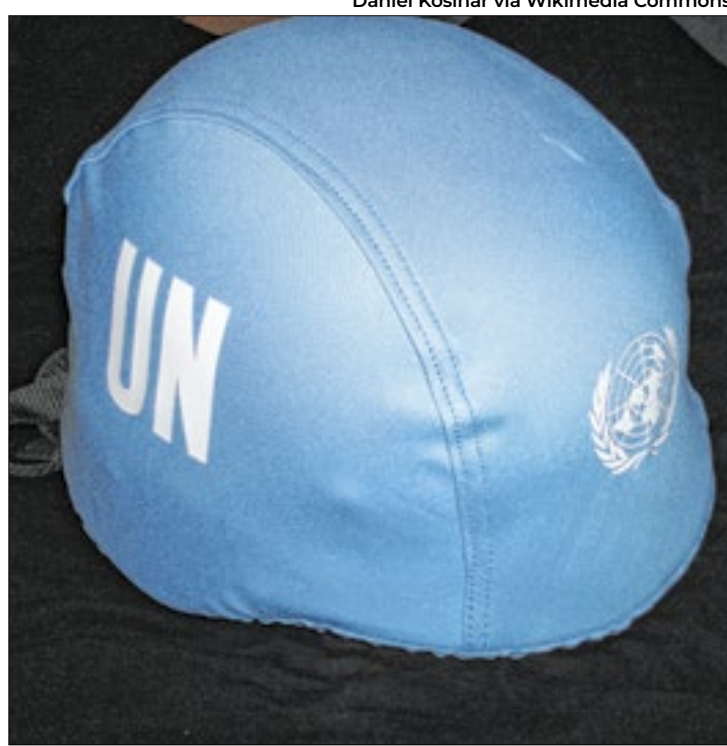
Ataques de Israel estão afetando os 'Capacetes Azuis' da ONU

Em conversa com o ministro da Defesa dos Estados Unidos, Lloyd Austin, Gallant disse que seu país vai continuar tomando medidas para proteger as tropas da ONU no Líbano. Washington é o principal aliado e fiador militar e diplomático