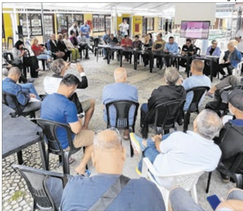
Encontro da Associação Comercial, Empresarial e Turística do Peró, em Cabo Frio

Preocupados com o caos anunciado na alta temporada, empresários, comerciantes e a sociedade civil do Peró se uniram e criaram uma entidade para representar o destino. Pediram para participar do processo de transição de governo e serem ouvidos pelo prefeito eleito, Dr. Serginho. As preocupações: ordenamento, segurança, trânsito e cumprimento das normas da Bandeira Azul. A administração que está saindo assinou um TAC com o Ministério Público para ordenar e reformar a Praça do Moinho (a principal do local), mas não cumpriu. Na última semana, pediram ajuda também ao secretário estadual de Turismo, Gustavo Tutuca.