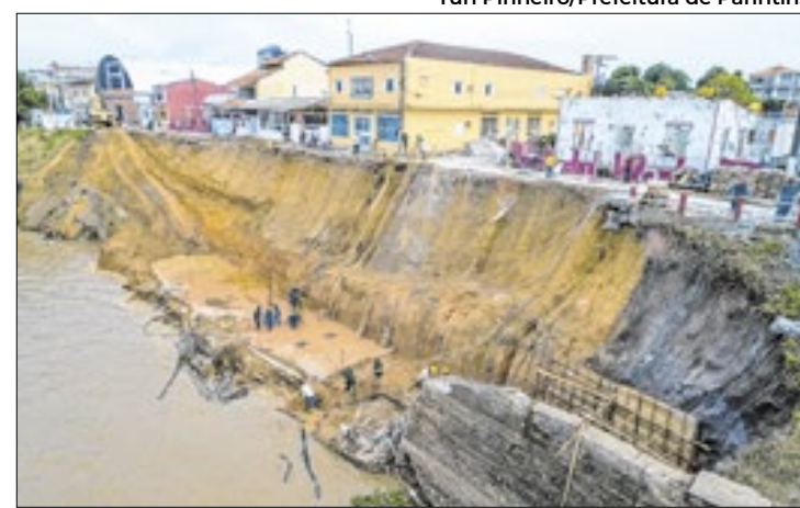
Orla de Parintins já desmoronou devido à erosão, em 2020

Com a decisão, Genilson foi solto após quatro dias detido na Penitenciária Agrícola de Monte de Cristo. Ele foi preso após a PF realizar buscas em sua residência, onde encontrou parte dos R$ 26 mil, além de listas rasgadas com nomes de possíveis eleitores e 1,7 gramas de ouro em estado bruto, que foi avaliado em cerca de R$ 797, considerado relevante devido à suspeita de ligação com o garimpo ilegal na Terra Indígena Yanomami. Segundo a PF, denúncias indicaram que eleitores teriam recebido R$ 100 e materiais de campanha relacionados ao vereador.