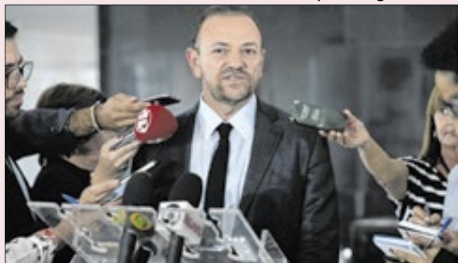
Edinho Silva perdeu a eleição em Araraquara