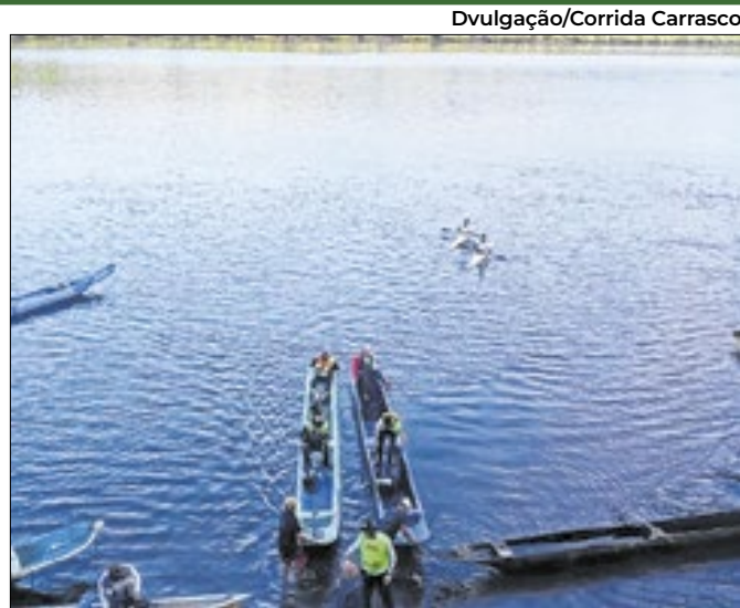
Ao todo, serão sete modalidades em disputa

Junta Comercial registra aumento de 4,7% no estado