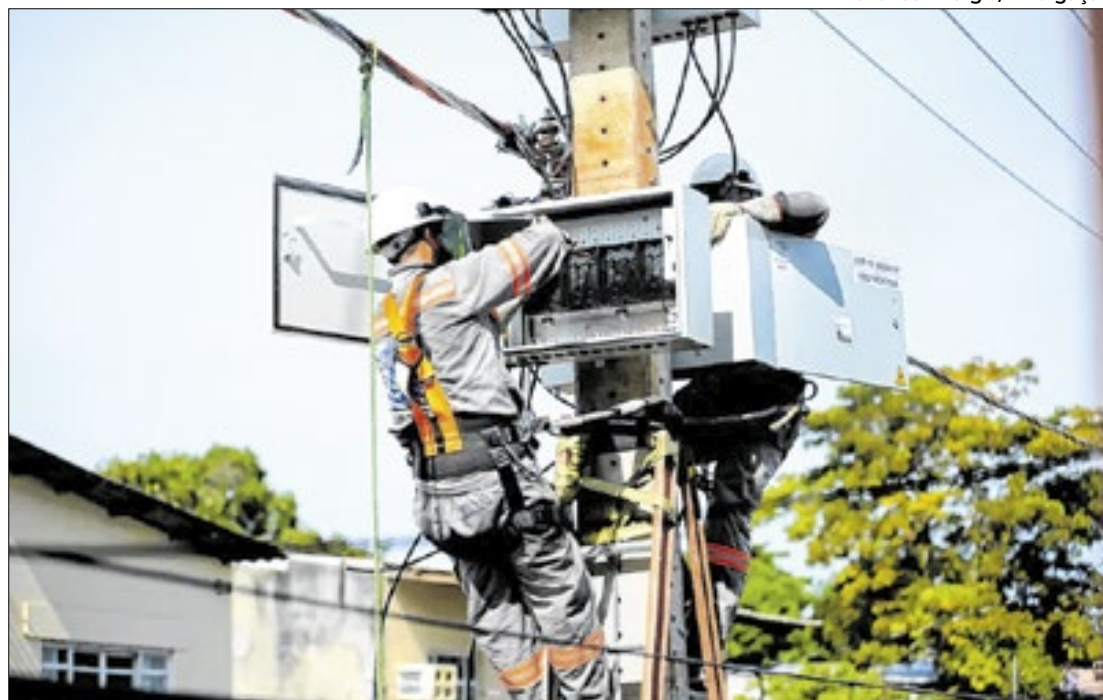
A questão continua em discussão e novas decisões judiciais podem influenciar o contrato

No início de outubro, a Aneel aprovou um plano de transferência com custos meno-