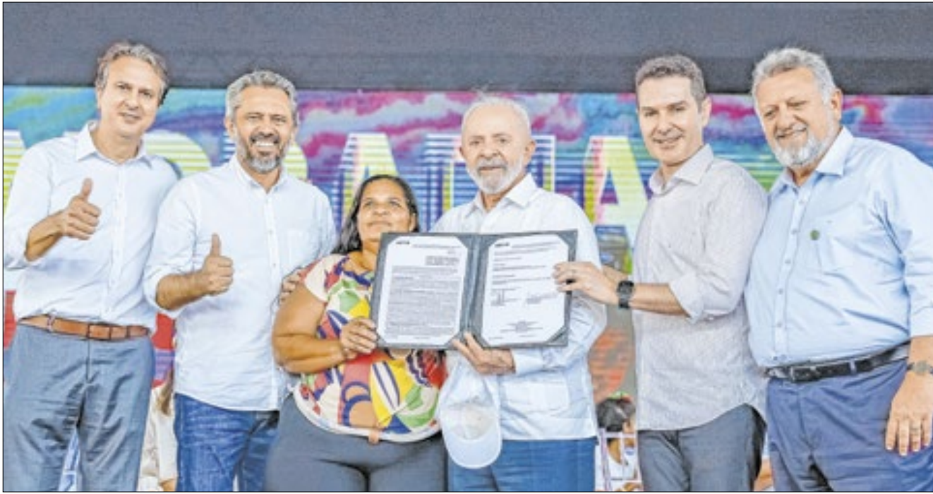
Cerimônia de entrega de unidades habitacionais do Minha Casa, Minha Vida