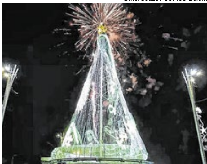
Monumento temporário marca o início do Círio