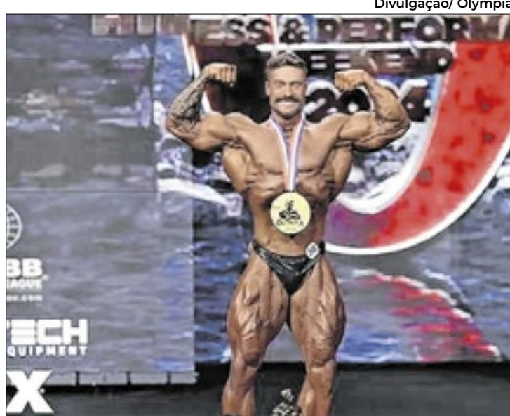
CBum venceu o Mr. Olympia e anunciou sua aposentadoria

No discurso de vitória, Cbum anunciou sua aposentadoria como atleta. "Essa foi minha última vez nos palcos". Bumstead ainda reforçou a importância dos amigos e equipe em sua jornada. Agora, o mais recente hexacampeão deve focar em sua marca de suplementos e na família - Cbum se tornara pai este ano da pequena Bradley, de cinco meses.