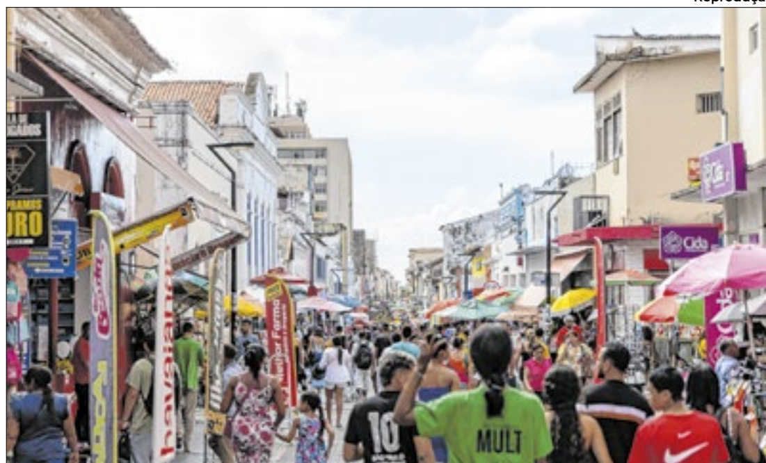
Em setembro o Maranhão também alcançou a marca de 438 mil empresas ativas.

Alagoas receberá a oficina territorial do novo Plano Nacional de Cultura (PNC), promovida pelo Ministério da Cultura, nos dias 6 e 7 de novembro. O evento, que será realizado em Maceió, faz parte de uma série de encontros presenciais que percorrem todas as capitais.