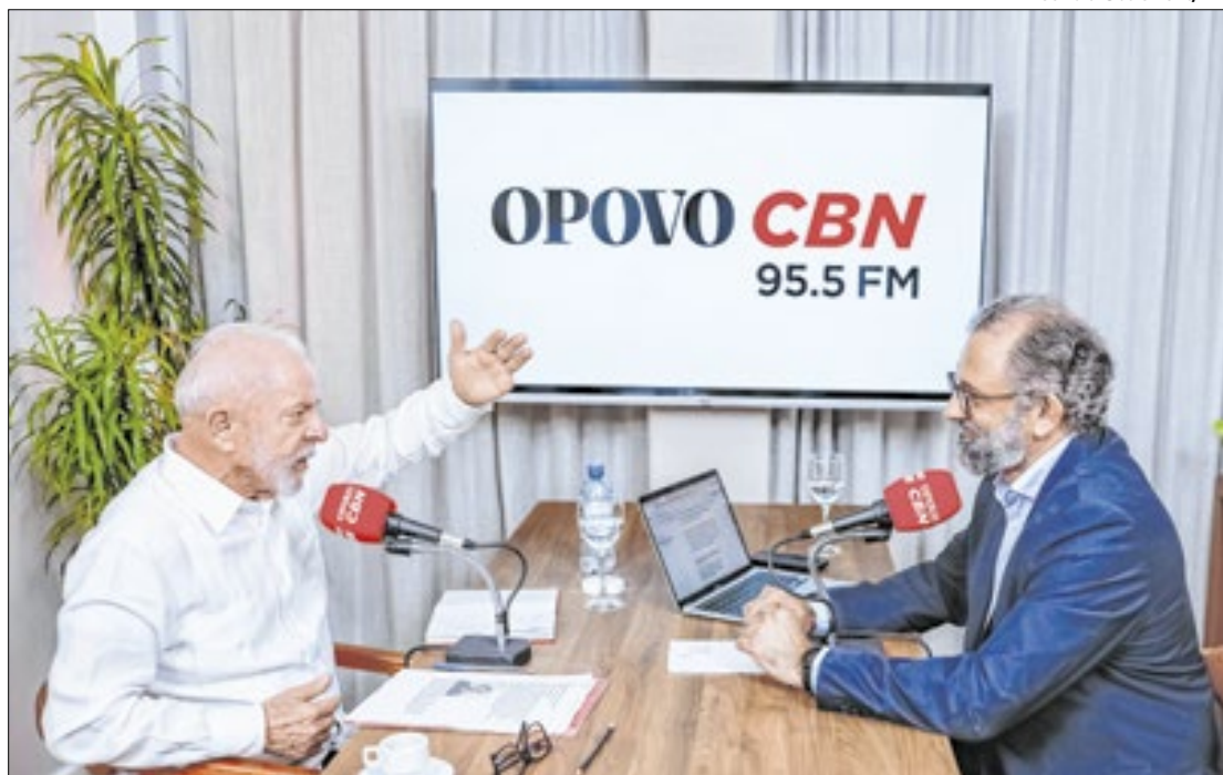
Lula avalia que partido vai precisar rediscutir suas estratégias

“Precisamos adequar o nosso discurso ao mundo do trabalho, que não é só a carteira profissional assinada. É o cara que quer trabalhar em home office, é o cara que quer ser um pequeno empreendedor, é o cara que quer ter um pequeno comércio, é o cara que quer trabalhar por