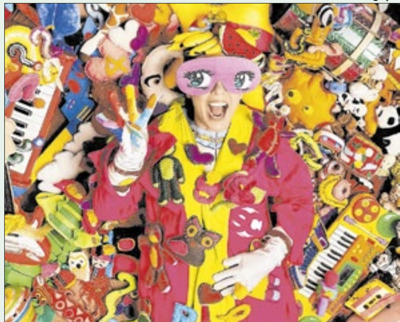
Partimpim, personagem de Calcanhotto voltado ao público infantil