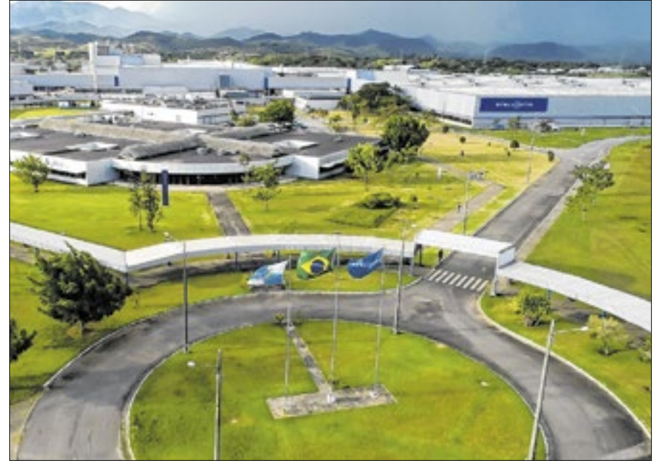
Fábrica da Stellantis, em Porto Real, já produziu modelos das marcas Citroën e também Peugeot e agora parte para versão SUV compacto estilo cupê na tentativa de popularizar carro

O Basalt mais em conta é equipado com quatro airbags,