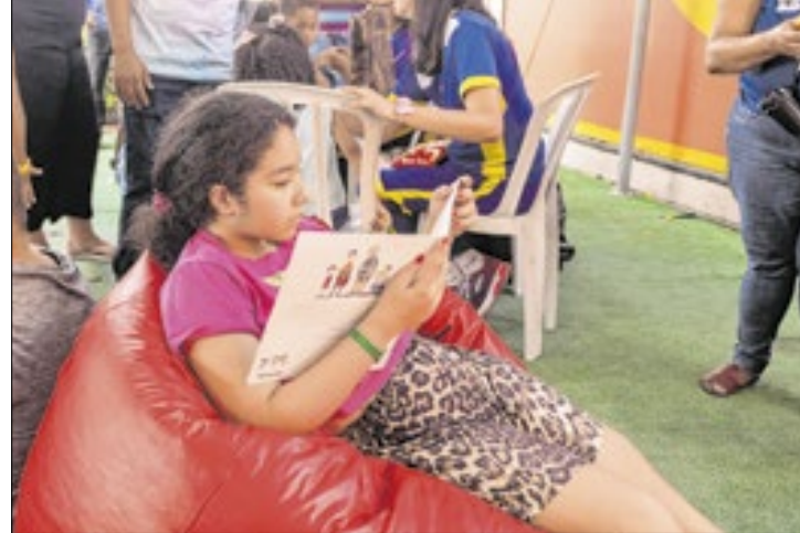
Nas unidades de Nova Friburgo, Teresópolis e em Petrópolis - Nogueira, haverá atividades

Em 2024, com intuito de valorizar a diversidade cultural