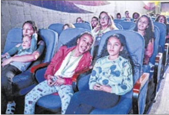
Belford Roxo realizou mais uma edição do "Cine Capsi"