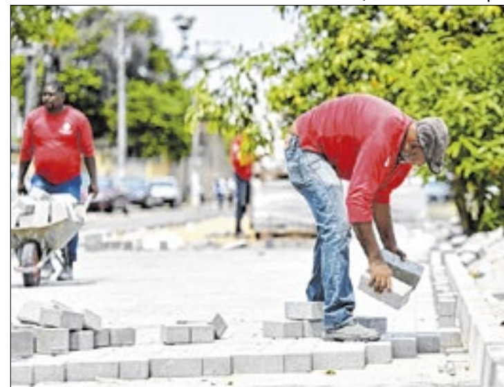
Obras já mudaram o aspecto do local em Campos