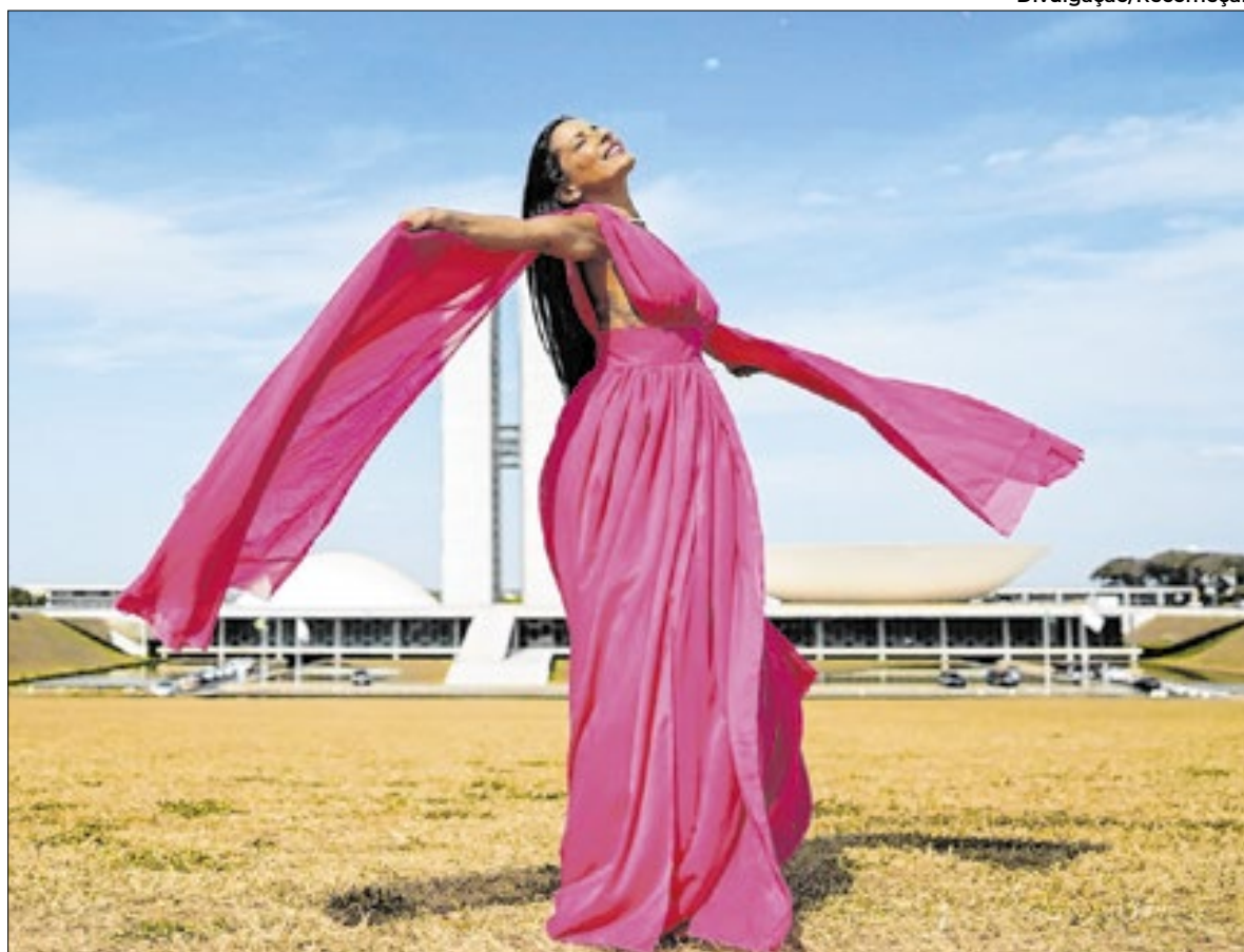
Exposição atenta para a necessidade da prevenção

futuro diferente do passado”, compartilhou.