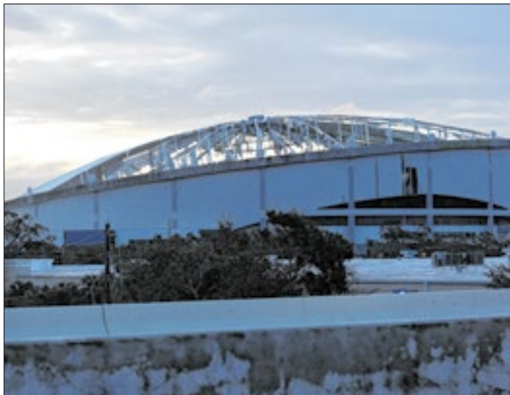
Tropicana Field Stadium teve a cobertura arrancada

O fenômeno chegou à costa por volta das 20h40 no horário local (21h40 de Brasília), quando tinha ventos de até 195 km/h. Entrou em terra pela pequena Siesta Key, a cerca de 180 km a sudoeste da turística Orlando.