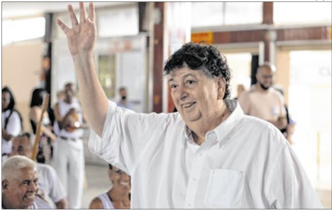
Novos cargos serão voltados para candidatos que não foram eleitos nesta eleição