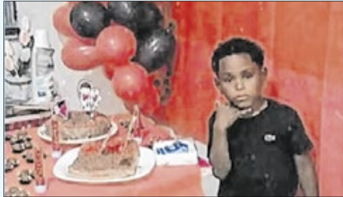
Após dez dias de agonia, menino 'mais velho' não resistiu