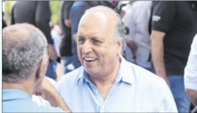
Pezão diz que pedirá verbas federais para Piraí