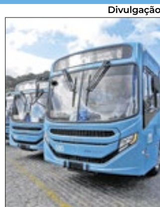
Divulgação Ônibus gratuito no dia 12

Atendendo à solicitação da Prefeitura de Nova Friburgo, a concessionária FAOL disponibilizará, durante o dia 12 de outubro, passe livre para crianças até 13 anos. O benefício se estende a todas as linhas da cidade e é válido somente para este dia, sem restrição de horário. O embarque das crianças será feito pela porta traseira e os responsáveis passarão normalmente pela roleta. Assim, os acompanhantes permanecem na obrigação de pagar a passagem, mesmo se entrarem acompanhando as crianças.