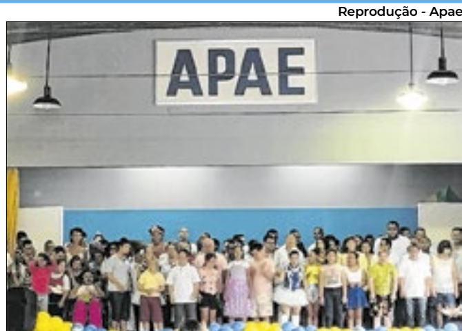
Evento celebrará a reinauguração da quadra da Apae