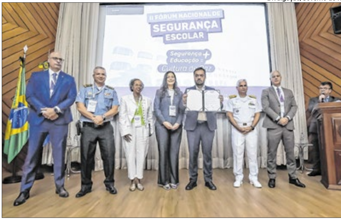
Assinatura da carta compromisso pela segurança nas escolas do Estado do Rio

o dia 07 de novembro e podem ser realizadas pela internet, no site da Avaliação, instituído organizadora do certame: www.avalia.org.br . Para os candidatos que não têm acesso à internet, serão disponibilizados três Postos de Inscrição Presencial, localizados no SINE.