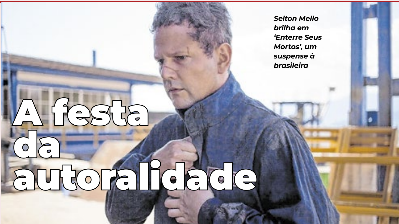
Selton Mello brilha em ‘Enterre Seus Mortos’, um suspense à brasileira

Com uma seleção vigorosa de expressões autorais, na ficção e no documentário, a Première Brasil do Festival do Rio termina embalada nas raias do espan-to com ‘Enterre Seus Mortos’