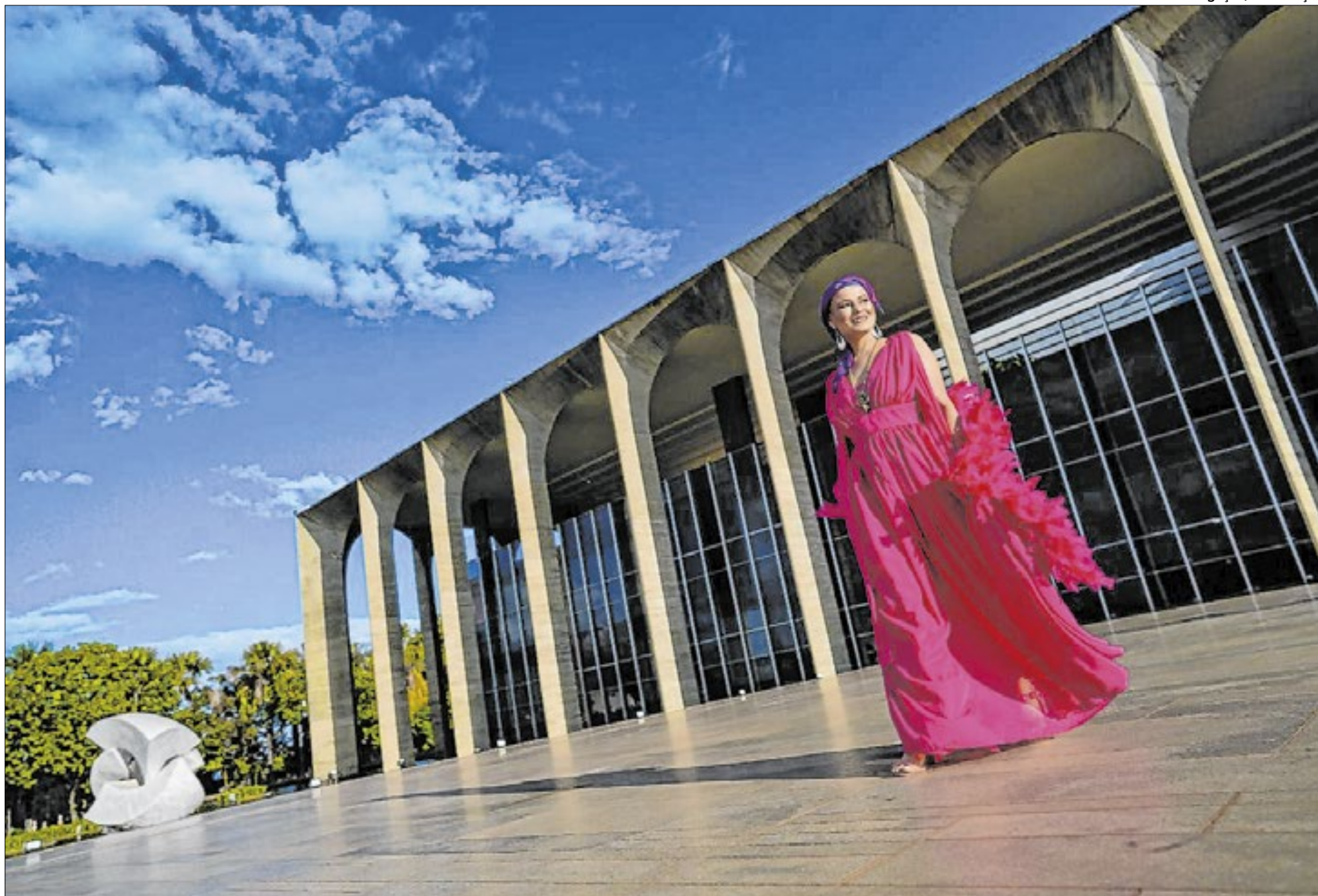
O ensaio uniu as obras de Niemeyer e as mulheres que tiveram câncer de mama