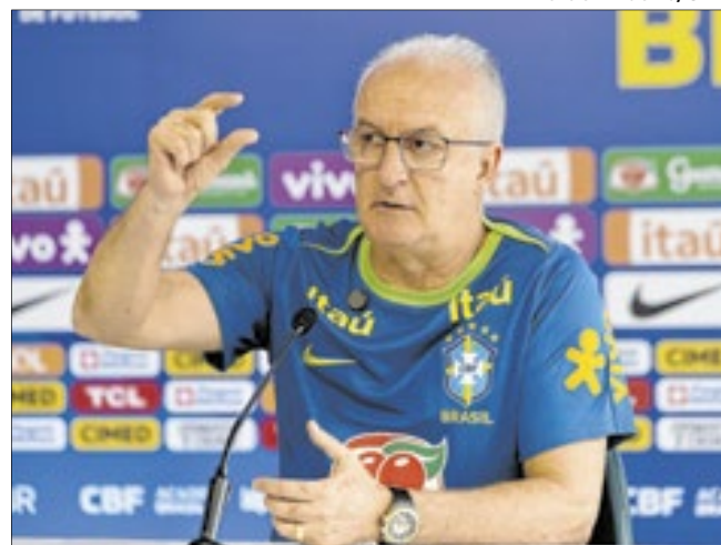
Dorival Júnior busca rumo para a Seleção Brasileira

Jogando no limite da classificação para a Copa do Mundo FIFA 2026, a Seleção Brasileira já convocou mais de 70 jogadores diferentes desde o Mundial do Qatar, sendo que 48 foram só na ‘Era Dorival Júnior’. Testes são necessários, mas o time segue sem rumo e ‘espinha dorsal’.