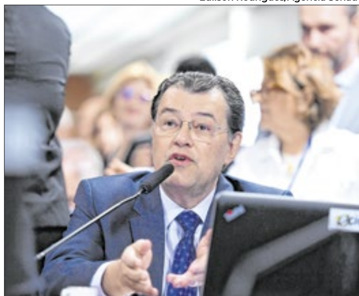
Braga quer votar tributária no início de novembro

Apesar de o projeto já ter recebido 1.300 emendas, segue a expectativa de que o texto seja votado no plenário do Senado na primeira semana de novembro.