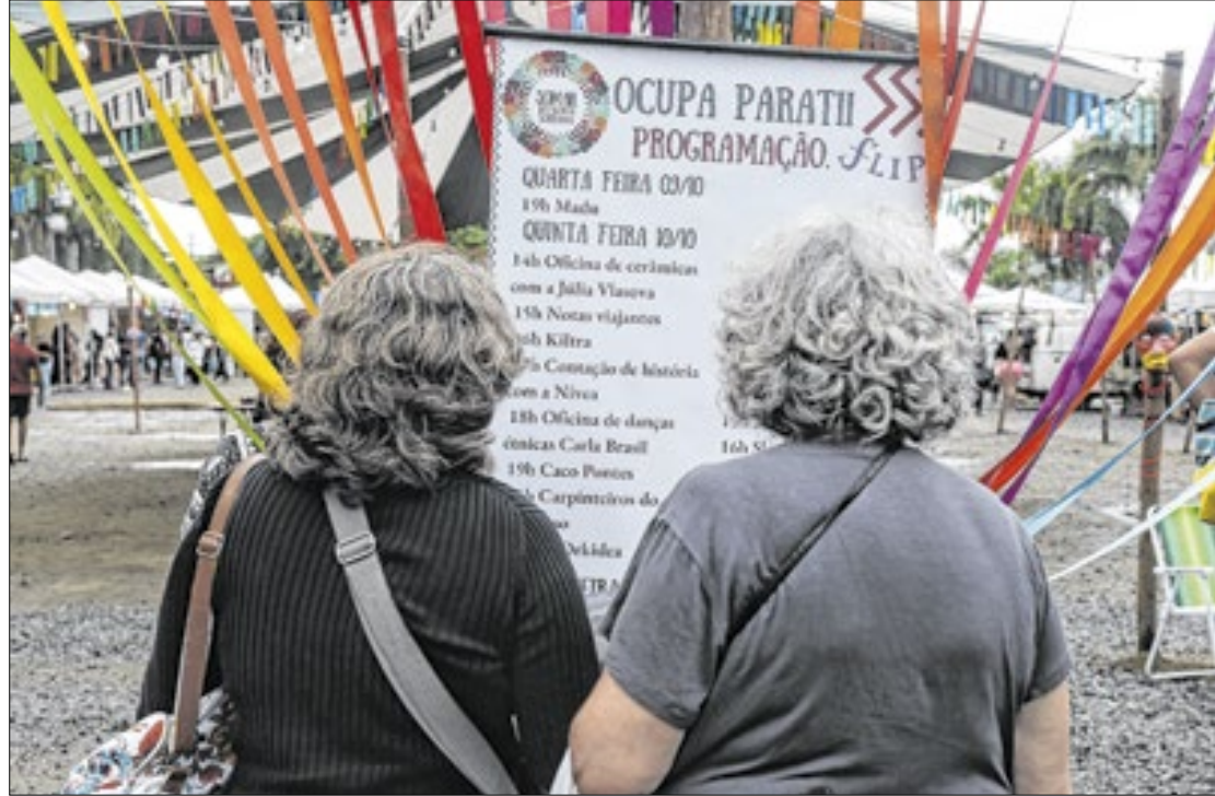
O evento começou na última quarta-feira (9), homenageando o escritor João do Rio

Neste ano, os autores e atrações escalados para o evento pretendem debater as diferentes perspectivas do mundo contemporâneo. Haverá mesas de discussão sobre temas como o impacto das queimadas, racismo e misoginia, emergências climáticas, inteligência artificial e violência contra os povos indígenas.