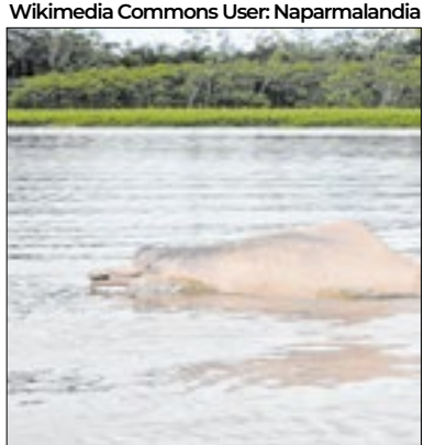
Boto Rosa foi muito afetado

De acordo com a organização ambientalista World Wide Fund for Nature (WWF), o número de animais selvagens - ou seja, na natureza - reduziu em 73% no planeta nos últimos 50 anos. Na América Latina, porém, esse