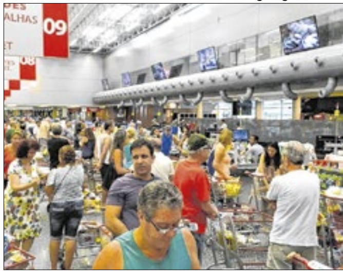
Dia das Crianças movimentou o comércio varejista