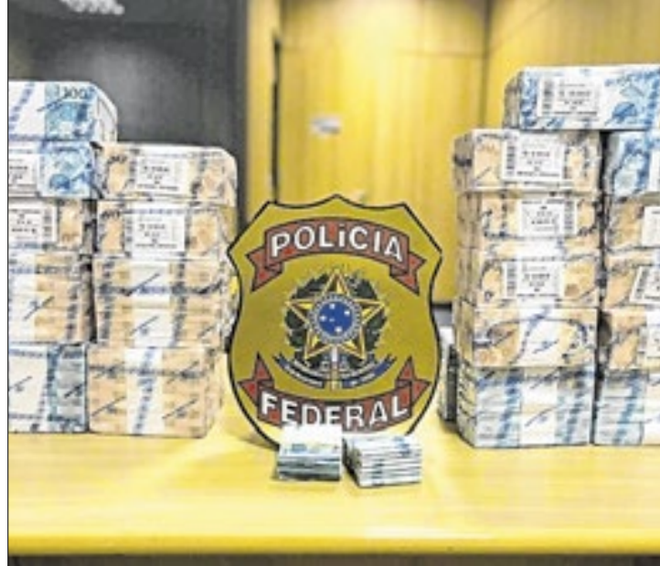
Compra de votos é um dos crimes eleitorais recorrentes

Título nada honroso para o estado, o Rio de Janeiro é o 'campeão' nacional, em número de ilícitos eleitorais neste ano, apontam dados divulgados, nessa quinta-feira (10), pela Polícia Federal (PF), ao contabilizar, desde o início do primeiro turno das eleições municipais de 2024, 3135 ocorrências, a maior parte, vinculada à propagação irregular e à compra de votos. Atualmente, com 10,3 milhões de eleitores, o RJ é o terceiro maior colégio eleitoral do país.