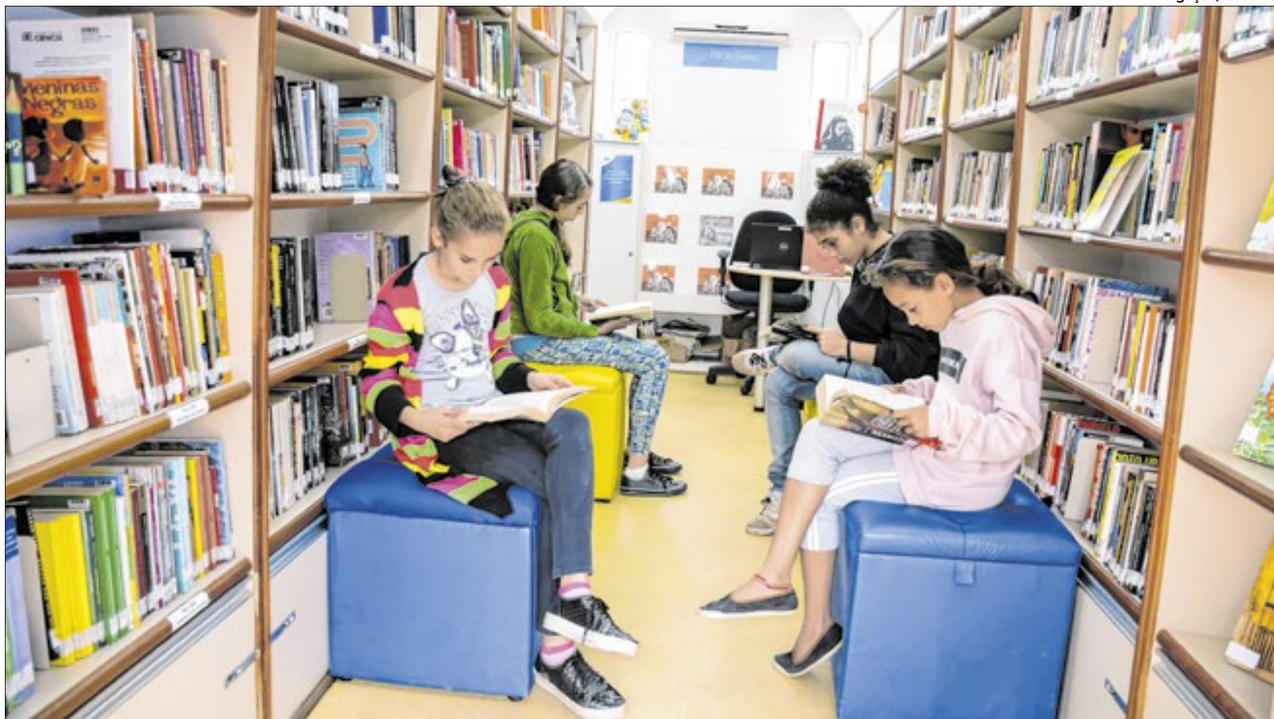
Jovens e adultos poderão ler vários livros da coleção do Sesc

A Cia Trilhos traz o projeto “Histórias Brincantes” (Som ao pé do Ouvido) para abrilhantar com muita alegria a FLIP, pensando em um mundo plural e acessível de troca e afeto. Trazemos para cena a palavra narrada, através da troca de saberes entre o público presente e os personagens das histórias. Trabalhando