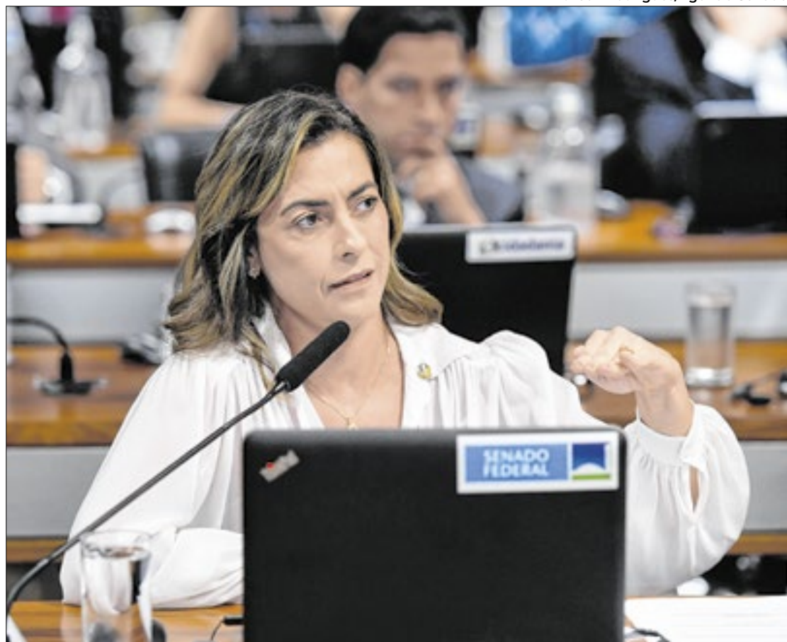
Soraya: CPI terá efeito pedagógico e informativo

Segundo a ementa, a CPI terá 130 dias para concluir seus trabalhos, será composta por 11 membros titulares e sete suplentes.