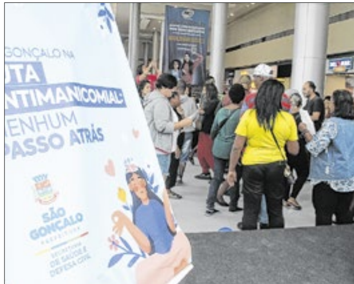
Iniciativa promoveu integração com os pacientes