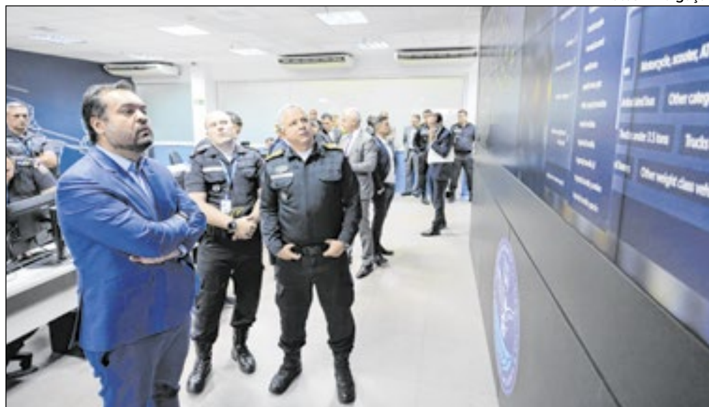
Governador Cláudio Castro durante visita ao Centro Integrado de Comando e Controle

Para o secretário de Segurança Pública, Victor dos Santos, a redução da criminalidade está estreitamente relacionada ao uso da inteligência. "A inteligência é fundamental para definirmos momentos e locais mais acertados para o empre-