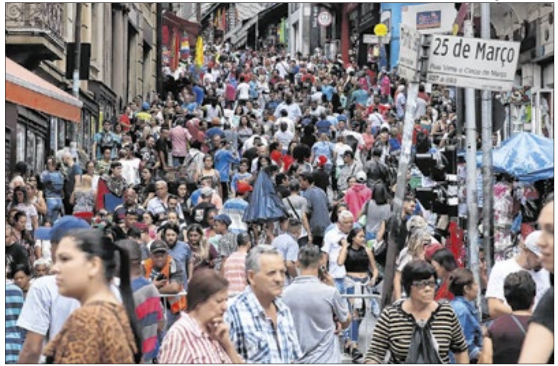
Rovena Rosa - Agência Brasil

Ao levar em conta dados do IBGE (Instituto Brasileiro de Geografia e Estatística), o Ipea assinalou que a força de trabalho nacional atingiu, no segundo trimestre deste ano (2T24), ao montante de 190,4 milhões de pessoas, do qual, 101,8 milhões corresponderiam à população ocupada. Já no trimestre seguinte (3T24), esse total subiu para 102,5 milhões de pessoas ocupadas no país.