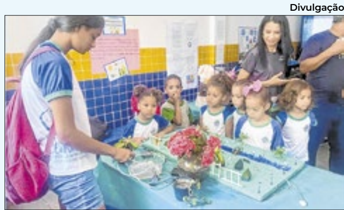
Finalistas foram indicados para a etapa seguinte

cioambiental, busca promover o protagonismo comunitário na busca por soluções para os desafios socioambientais locais, mobilizando jovens, líderes comunitários, educadores e moradores para a causa. Após três anos de atuação em localidades do município.