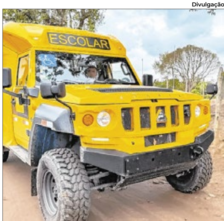
Novo veículo faz parte da nova frota do transporte escolar

"Quando assumi a Prefeitura, em 2021, a cidade não contava com nenhum veículo disponível para o transporte escolar. Adquirimos novos veículos e, além disso, reformulamos as rotas para atender todas as escolas. Um exemplo