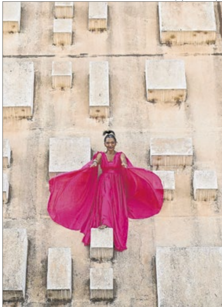
Todas as mulheres têm menos de 50 anos