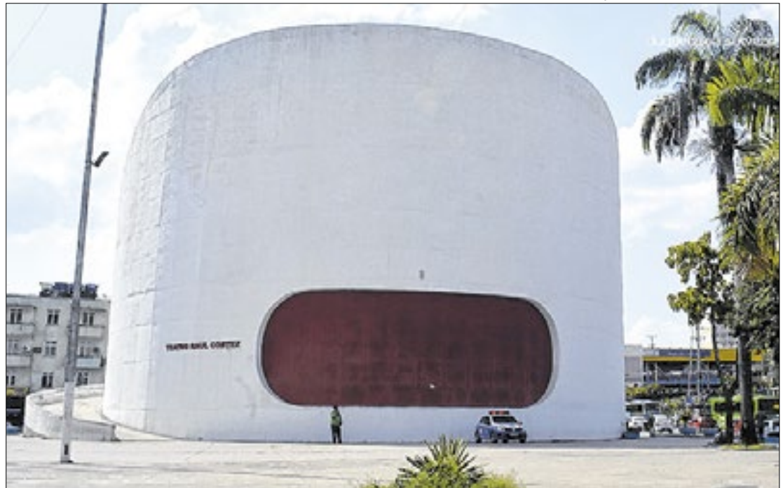
Teatro Raul Cortez, localizado na Praça do Pacificador, no Centro de Duque de Caxias

Dia do teatro municipal é comemorado nesta sexta-feira (11) e Duque de Caxias celebra a grandiosidade do Raul Cortez