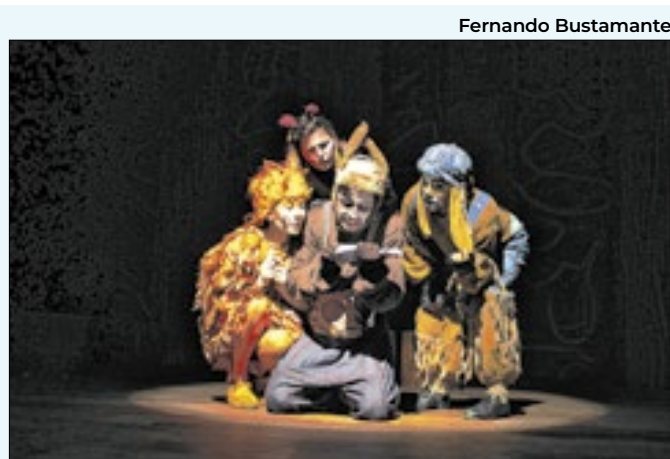
Apresentações acontecerão neste fim de semana

atrações musicais serão o duo Cyberkills e os DJs Lis, Genesttra e Harajuice. O evento acontecerá no Auê House, a partir das 22h30, com ingressos a venda pela plataforma Sympla.