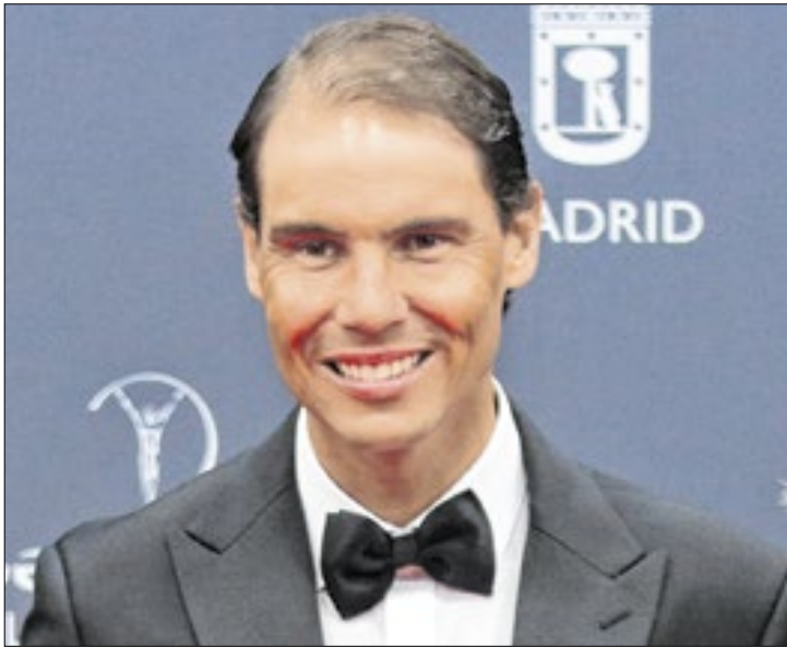
Nadal é um dos maiores tenistas de todos os tempos

Rafael Nadal, da Espanha, que conquistou 22 títulos de Grand Slam em simples, anunciou na última quinta-feira (10) que está encerrando sua carreira profissional no tênis, uma decisão que será efetivada após a final da Copa Davis, em novembro.