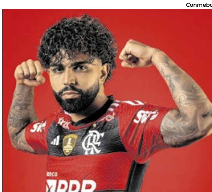
Gabigol voltou a ser aproveitado com a vinda de Filipe Luís

Nos últimos momentos de Tite, Gabi só foi titular uma vez. No total, o camisa 99 só iniciou uma partida quatro vezes sob o comando do antigo treinador.