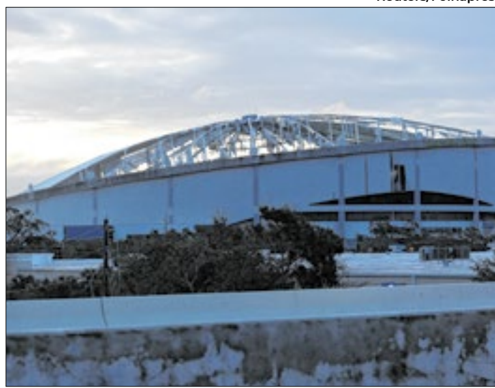
Tropicana Field Stadium teve a cobertura arrancada

O fenômeno chegou à costa por volta das 20h40 no horário local (21h40 de Brasília), quando tinha ventos de até 195 km/h. Entrou em terra pela pequena Siesta Key, a cerca de 180 km a sudoeste da turística Orlando.