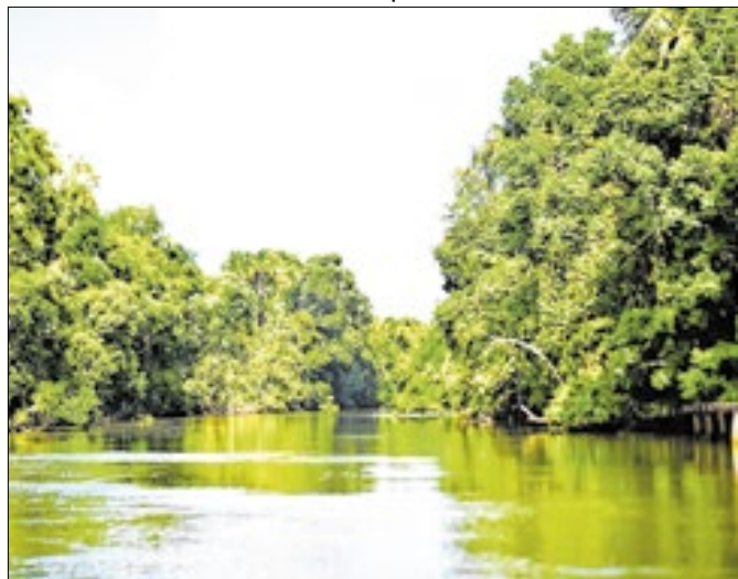
Pesquisadores vão criar banco de dados da reserva