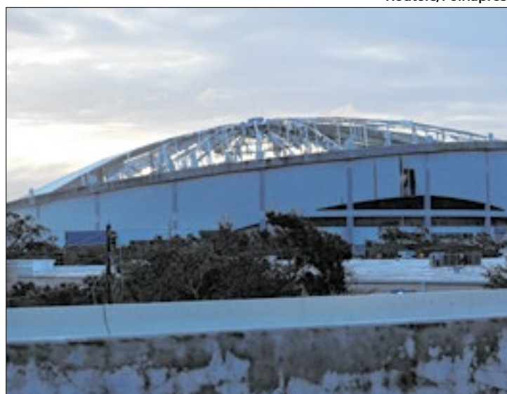
Tropicana Field Stadium teve a cobertura arrancada

O fenômeno chegou à costa por volta das 20h40 no horário local (21h40 de Brasília), quando tinha ventos de até 195 km/h. Entrou em terra pela pequena Siesta Key, a cerca de 180 km a sudoeste da turística Orlando.