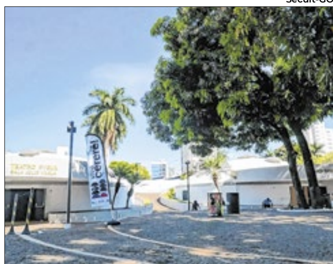
Evento tem atrações gratuitas e acessíveis