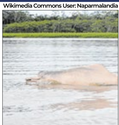
Boto Rosa foi muito afetado

De acordo com a organização ambientalista World Wide Fund for Nature (WWF), o número de animais selvagens - ou seja, na natureza - reduziu em 73% no planeta nos últimos 50 anos. Na América Latina, porém, esse