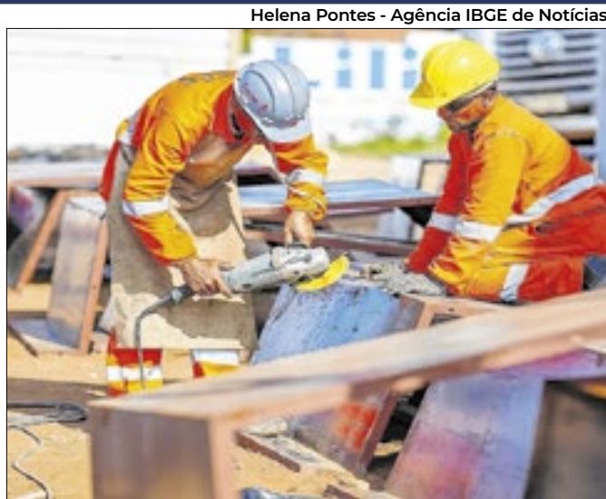
Helena Pontes - Agência IBGE de Notícias

Segundo instituto, país possui 101,8 milhões de pessoas nessa condição