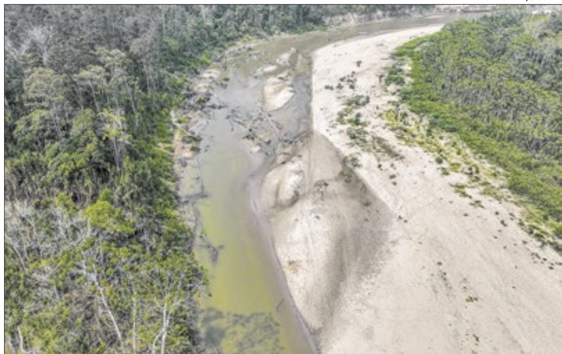
Nível baixo do rio afeta a navegabilidade e o abastecimento da cidade isolada.

O município de Jordão (AC), que não tem acesso terrestre a outras cidades, enfrenta uma grave crise de abastecimento de gás devido à seca extrema. A situação tem feito com que os moradores paguem até R$ 250 por um botijão de 13 kg, uma alta significativa de 56,5% em comparação aos R$ 160 cobrados anteriormente.