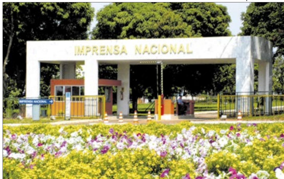
Vai deixar o transformador explodir, Imprensa Nacional?

substituição do transformador com vazamento, o processo licitatório ainda não foi sequer iniciado, o que retarda a resolução dessa situação emergencial. Diante desse cenário, a frota de veículos da presidência da República, que anteriormente utilizava o espaço da Imprensa Nacional para estacionamento, já foi transferida para outra localidade.