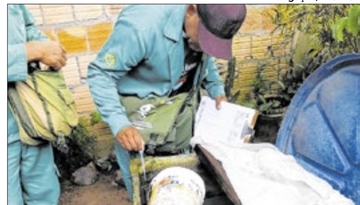
Vírus que não era registrado desde 2009 preocupa