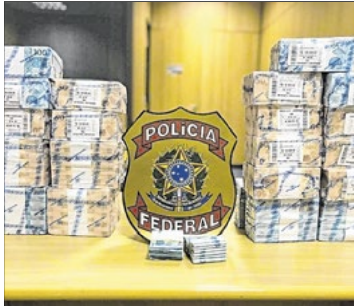
Compra de votos é um dos crimes eleitorais recorrentes

Título nada honroso para o estado, o Rio de Janeiro é o 'campeão' nacional, em número de ilícitos eleitorais neste ano, apontam dados divulgados, nessa quinta-feira (10), pela Polícia Federal (PF), ao contabilizar, desde o início do primeiro turno das eleições municipais de 2024, 3135 ocorrências, a maior parte, vinculada à propagação irregular e à compra de votos. Atualmente, com 10,3 milhões de eleitores, o RJ é o terceiro maior colégio eleitoral do país.