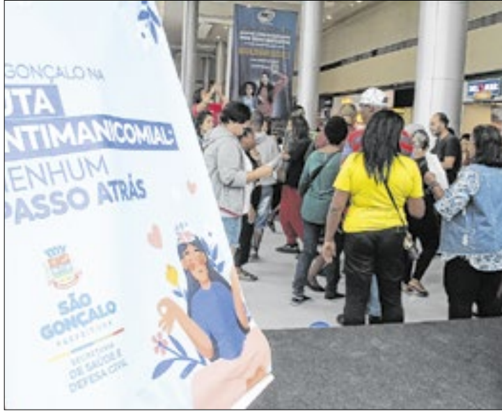
Iniciativa promoveu integração com os pacientes