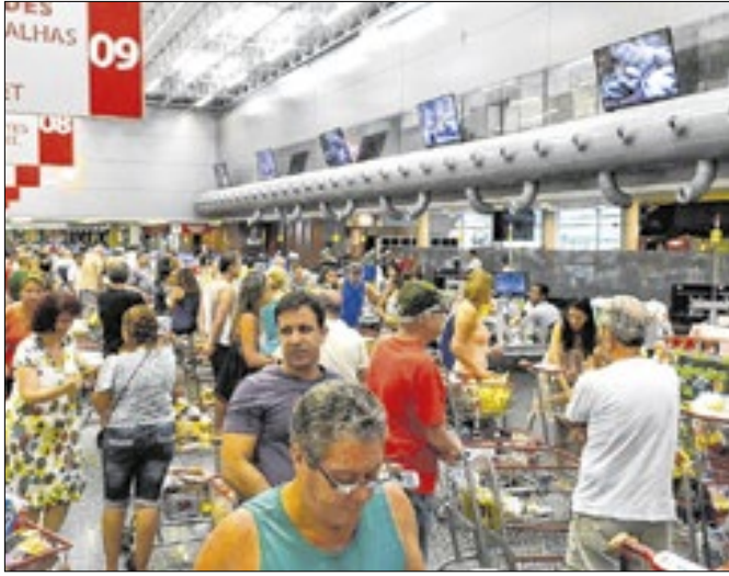
Dia das Crianças movimentou o comércio varejista