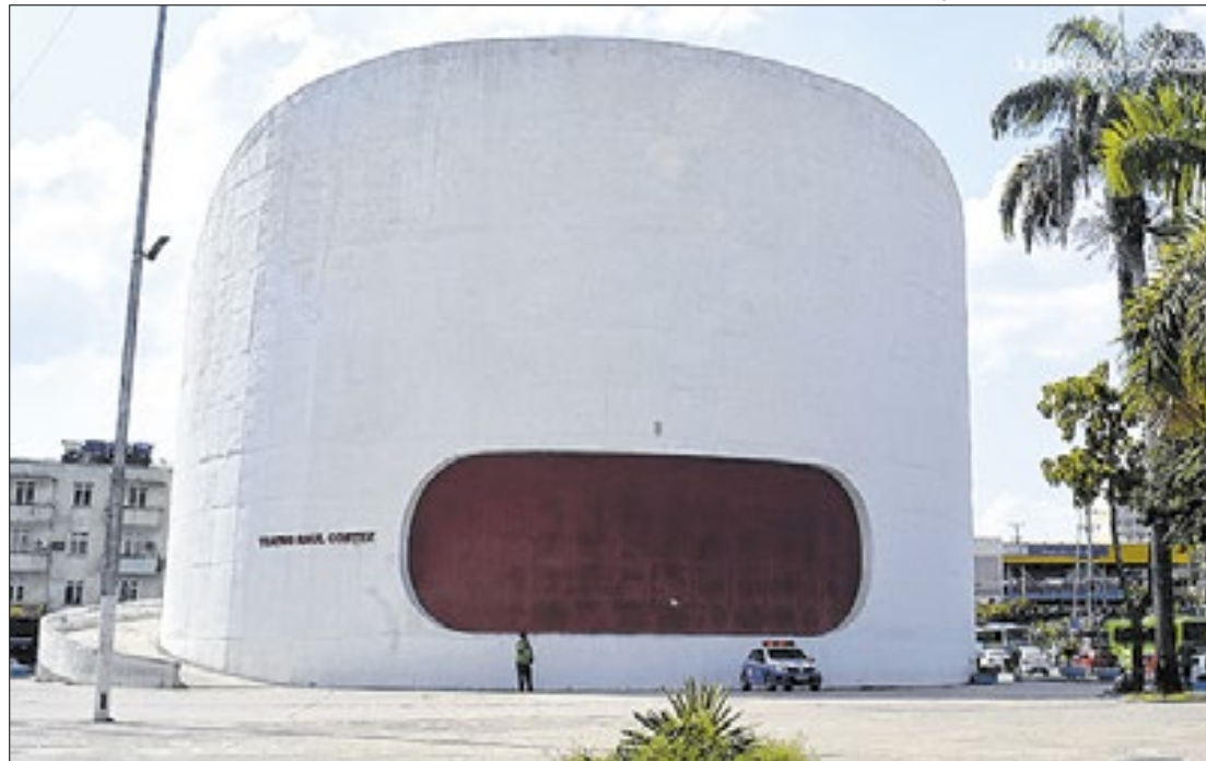
Teatro Raul Cortez, localizado na Praça do Pacificador, no Centro de Duque de Caxias

Dia do teatro municipal é comemorado nesta sexta-feira (11) e Duque de Caxias celebra a grandiosidade do Raul Cortez