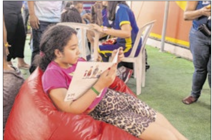
Nas unidades de Nova Friburgo, Teresópolis e em Petrópolis - Nogueira, haverá atividades

Em 2024, com intuito de valorizar a diversidade cultural