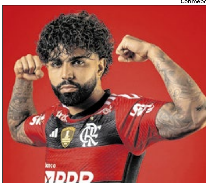
Gabigol voltou a ser aproveitado com a vinda de Filipe Luís

Nos últimos momentos de Tite, Gabi só foi titular uma vez. No total, o camisa 99 só iniciou uma partida quatro vezes sob o comando do antigo treinador.