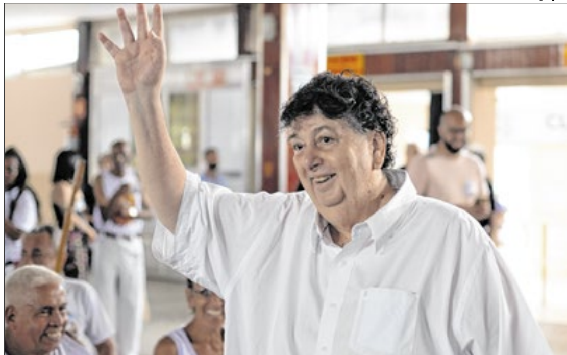
Novos cargos serão voltados para candidatos que não foram eleitos nesta eleição