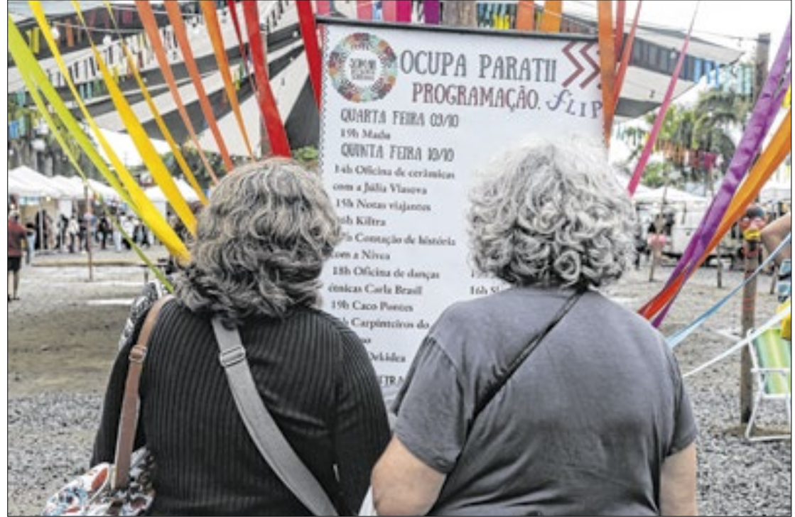
O evento começou na última quarta-feira (9), homenageando o escritor João do Rio

Neste ano, os autores e atrações escalados para o evento pretendem debater as diferentes perspectivas do mundo contemporâneo. Haverá mesas de discussão sobre temas como o impacto das queimadas, racismo e misoginia, emergências climáticas, inteligência artificial e violência contra os povos indígenas.