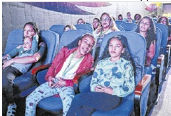
Belford Roxo realizou mais uma edição do "Cine Capsi"