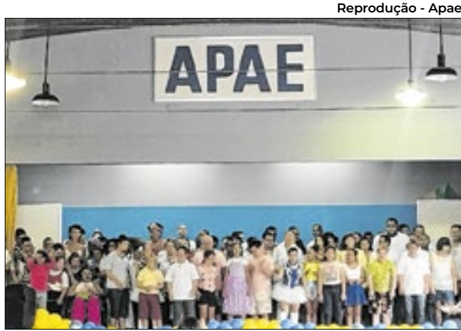
Evento celebrará a reinauguração da quadra da Apae