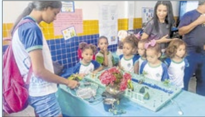
Finalistas foram indicados para a etapa seguinte