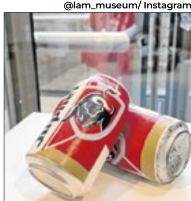
Obra de arte foi jogada no lixo

Um museu holandês conseguiu resgatar a obra de arte que foi acidentalmente descartada por um funcionário, que a confundiu com lixo. A escultura "All The Good Times We Spent Together", do francês Alexandre