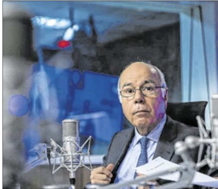
Vieira tem esperança na conversa entre Biden e Netanyahu

De acordo com a agência de notícias Reuters, Biden deve telefonar para o primeiro-ministro de Israel, Benjamin Ne-