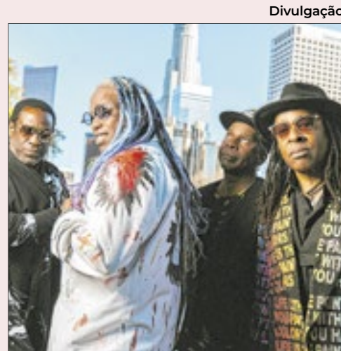
Formada apenas por músicos negros na Nova York dos anos 1980, o Living Colour abre turnê latino-americana com show nesta quinta (10), no Sacadura, na Zona Portuária