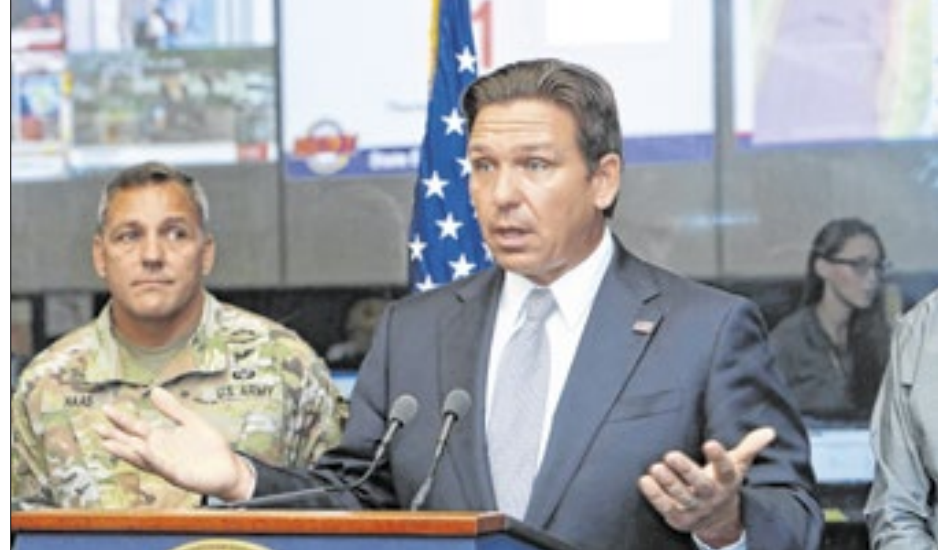
O Governador da Flórida, Ron DeSantis, emitiu ordens de evacuação por precaução

O presidente Joe Biden cancelou uma viagem programada à Alemanha e Angola para acompanhar de perto os desdobramentos do fenômeno. “Simplemente não acho que posso sair do país neste momento”,