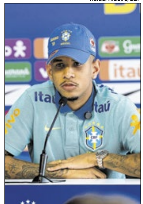
Savinho joga no Manchester City