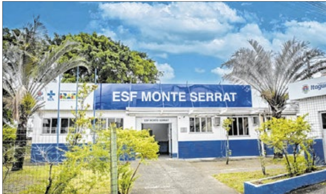
Unidades de saúde ficam localizadas nos bairros Monte Serrat e Coroa Grande

Os Agentes Comunitários de Saúde (ACS) também estarão presentes, garantindo um atendimento mais próximo e humanizado. A unidade funcionará das 8h às 17h, proporcionando um ambiente acolhedor e equipado com macas e leitos novos.