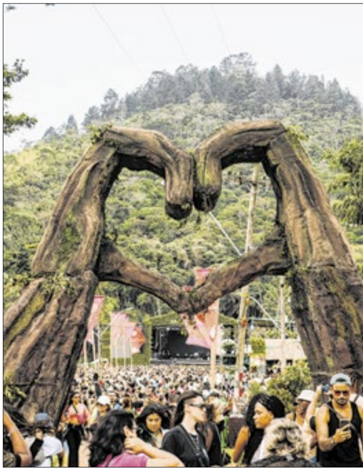
Evento reúne arte, gastronomia e sustentabilidade

do Rio, como Selvagem, Carnageralda e V de Viadão, também marcarão presença nos diversos espaços temáticos do evento, assim como o grupo Samba que elas querem, formado só por mulheres, que estará no Palco Samba.