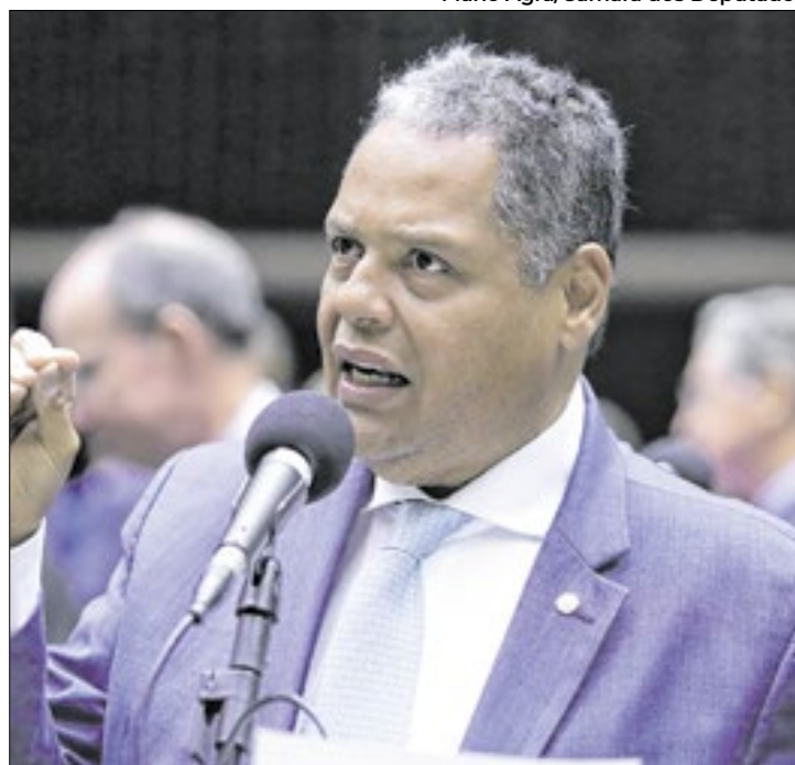
Força eleitoral do PSD recoloca Brito no jogo

No início, o preferido de Lira era Elmar Nascimento. Mas, avaliando que ele não teria chances, Lira passou a apostar no líder do Republicanos, Hugo Motta, como solução de consenso, após a desistência do vice-presidente da Câmara, Marcus Pereira (SP), também