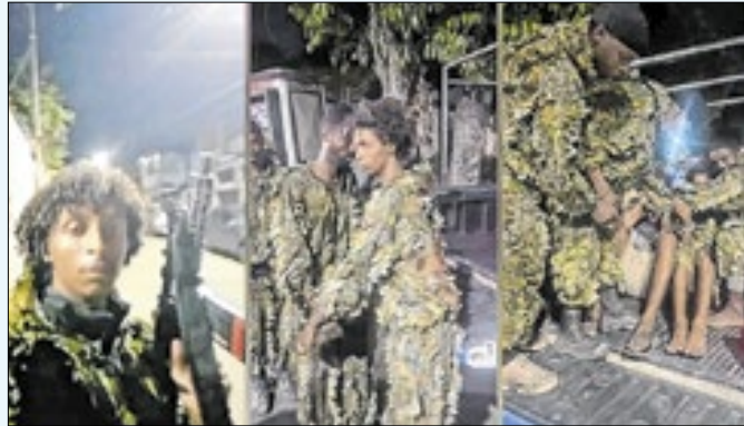
Cinco suspeitos foram presos ao tentarem invadir o Catiri