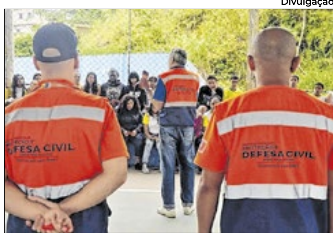
Ação será na comunidade do 2º distrito