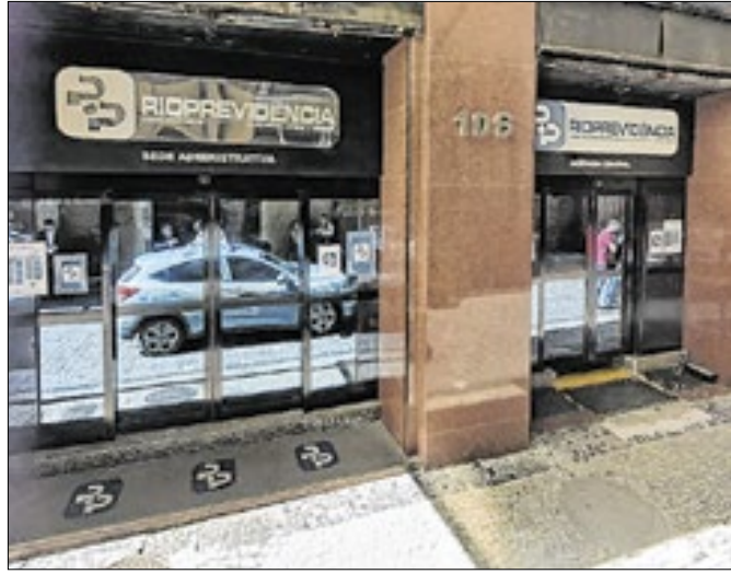
Recenseamento pode ser feito em uma das agências