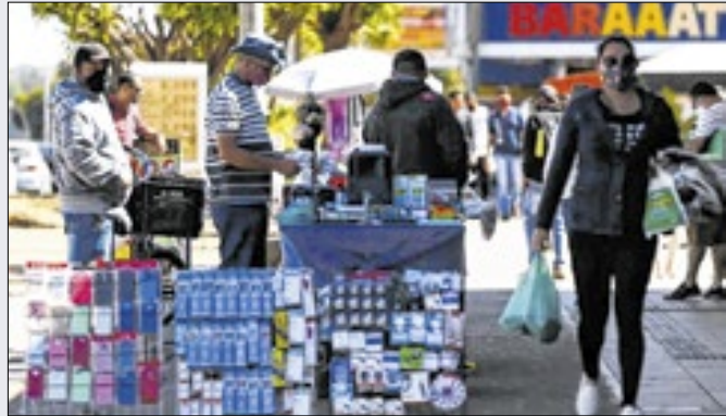
Aperto monetário pressionou atividade comercial