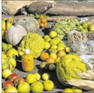
Curso terá cinco encontros

A partir do dia 15 de outubro, o SENAR Rio, em parceria com o Sindicato Rural de Paraíba do Sul e com o apoio da Prefeitura de Areal, realizará o curso "Mulheres em Campo", voltado exclusivamente para mulheres rurais que desejam aprimorar suas competências em empreendedorismo e gestão de empresas rurais. O curso será dividido em 5 encontros gratuitos, com carga horária total de 40 horas.