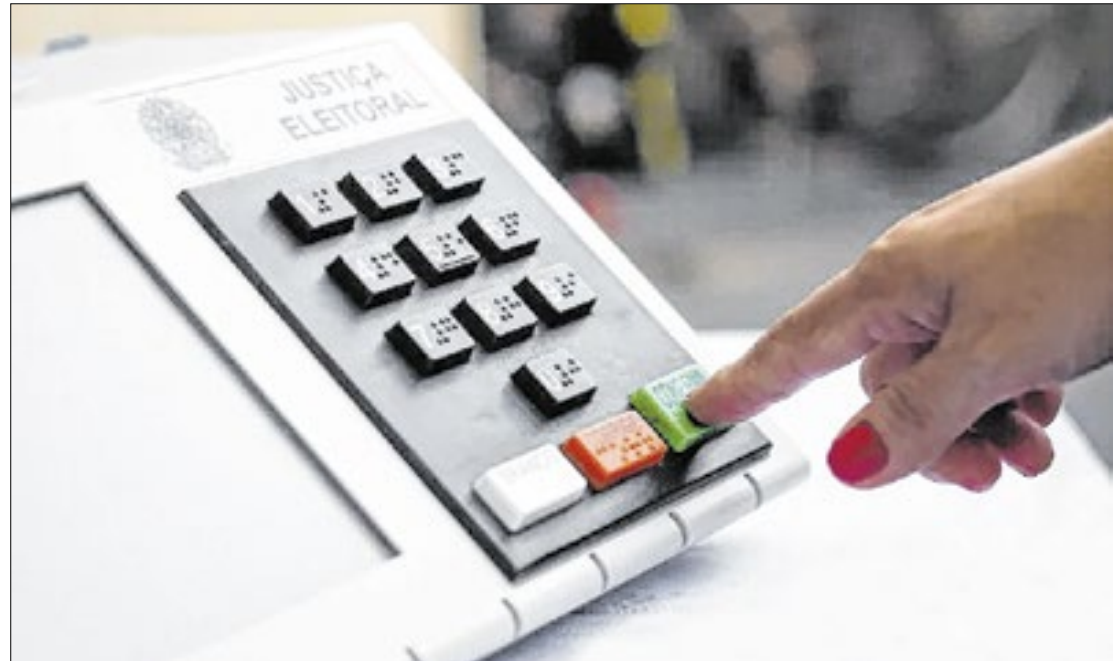
Cachoeiras de Macacu foi a cidade com maior número de candidatos do PP eleitos

Em Cordeiro, o PP também conseguiu garantir três vagas no Legislativo, no entanto, não foi a maior bancada da cidade, já que o Partido Liberal (PL) e União Brasil (UNIÃO) também obtiveram