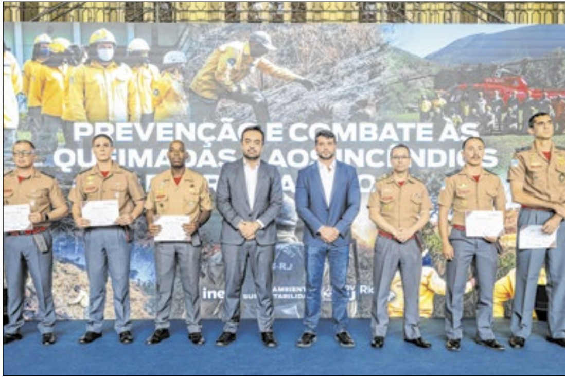
Apresentação de novas medidas para combate a incêndios florestais no estado