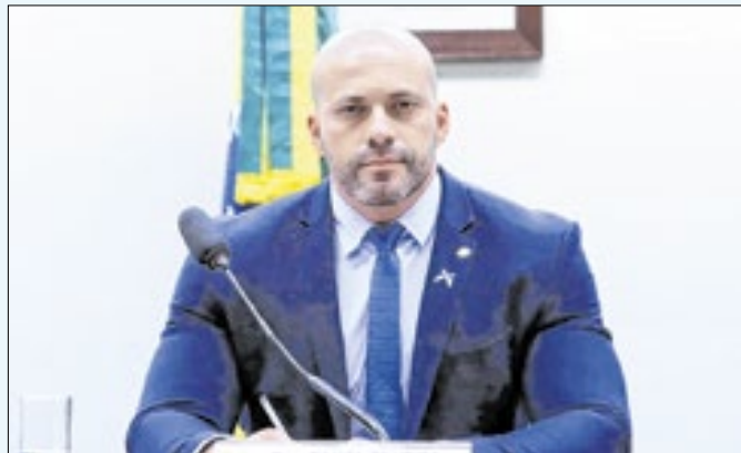
Ex-deputado Daniel Silveira está preso desde 2023