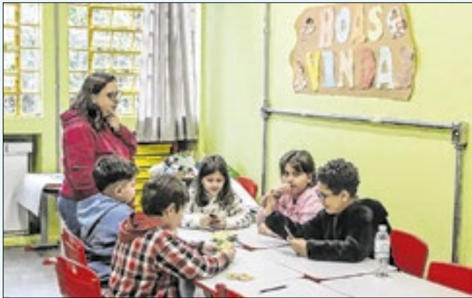
Inscrições vão até o dia 14 de novembro