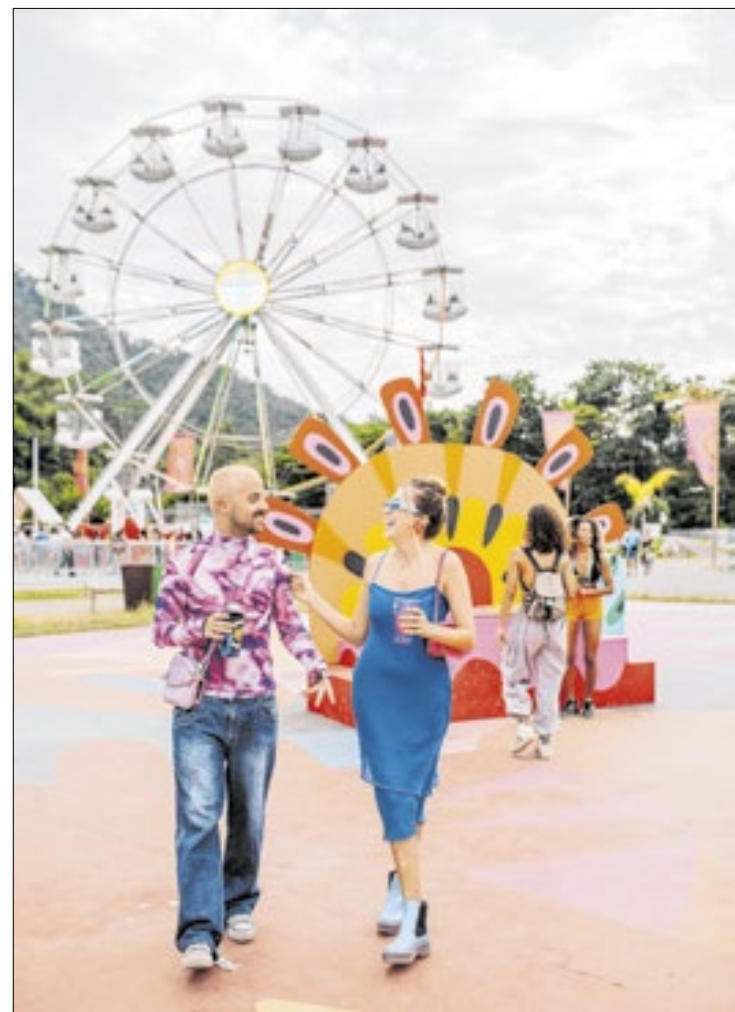
RTM é considerado o segundo maior festival de música do RJ