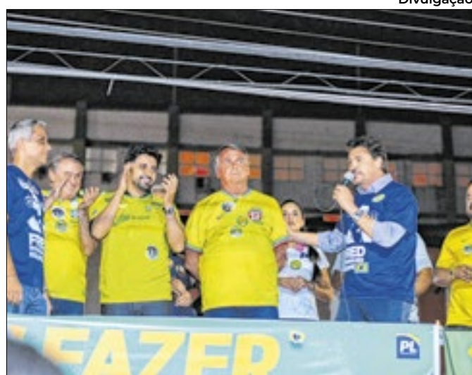
Bolsonaro em comício em Goiânia