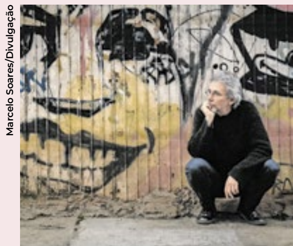
Ramil musicou 15 poemas do escritor e poeta