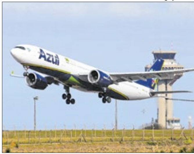
Anúncio de acordo 'turbinou' ações de cia. aérea