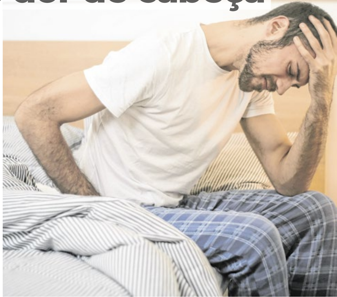
A sensação de latejamento e localização da dor em um dos lados da cabeça também dão pistas do diagnóstico

Mas as crises têm gatilhos específicos para cada pessoa alguns relatam que o excesso de café ou de certos alimentos, como comidas condimen-