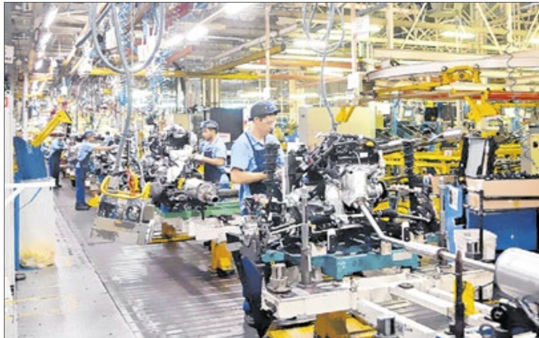
Produção da indústria dá sinais de ter perdido 'tração', nos últimos meses

Considerando o período acumulado nos últimos 12 meses, a expansão chega a 2,4%, com avanço em 17 dos 18 locais pesquisados e alta acumulada