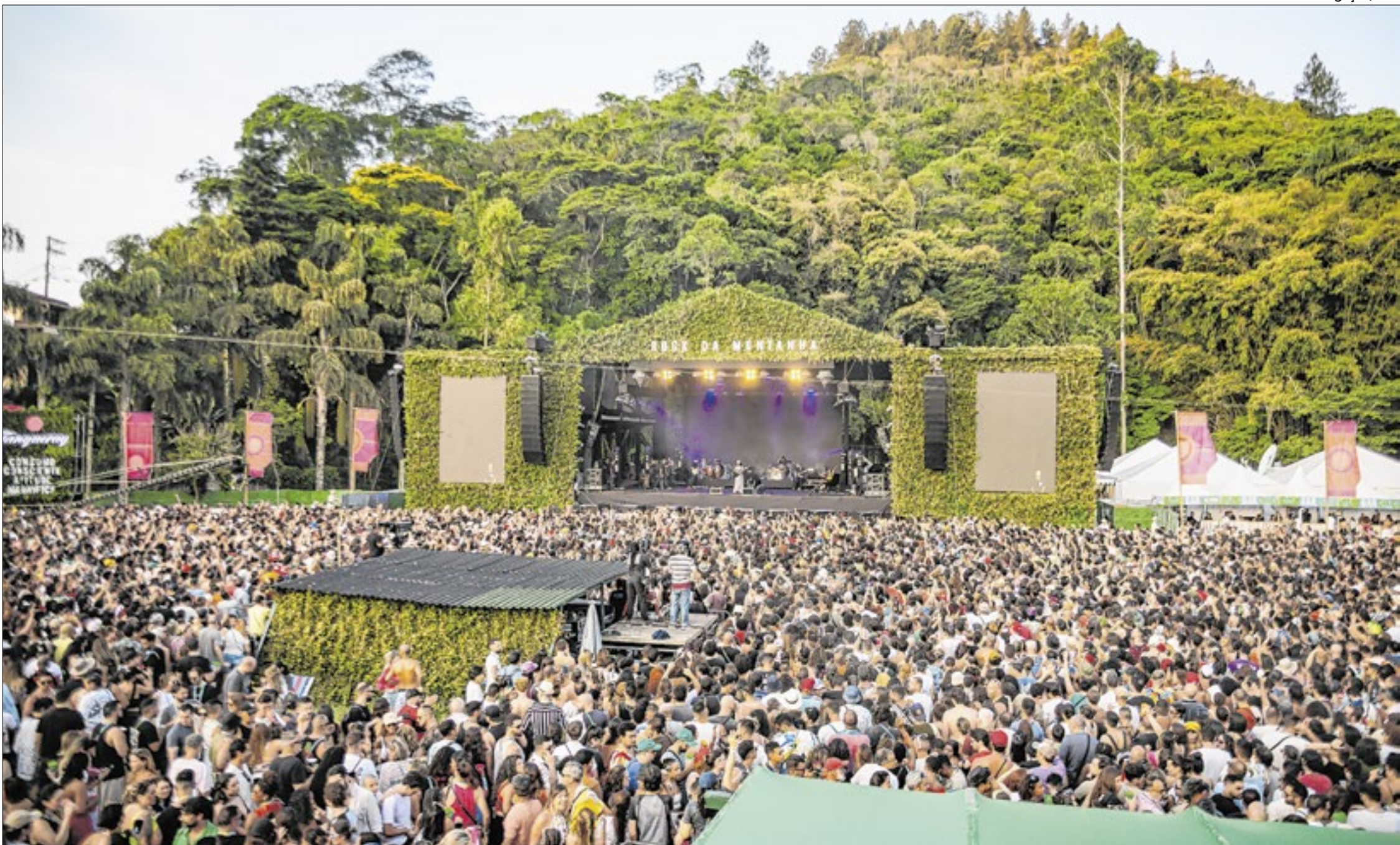
Última edição do Rock The Mountain reuniu cerca de 100 mil pessoas nos dois fins de semana de festival em Itaipava