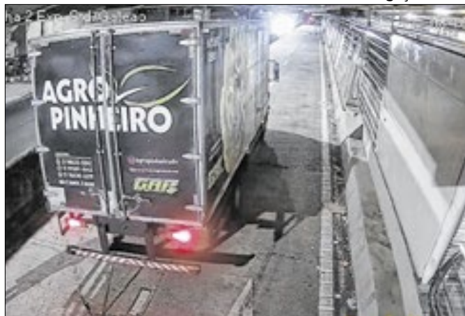
Furto de cabos deixou estação Penha inoperante