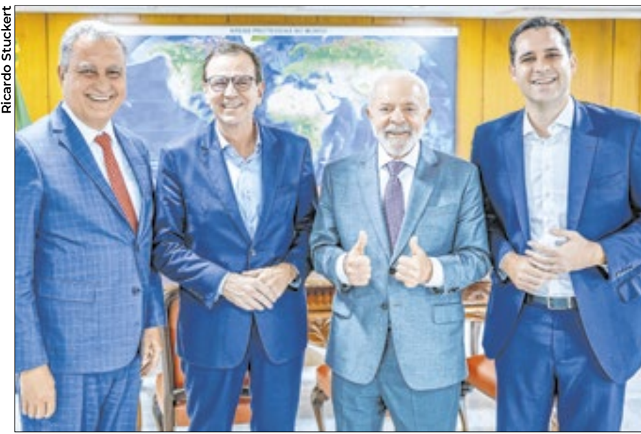
Na sequência: o ministro Rui Costa, Paes, Lula e o vice Eduardo Cavaliere

Reeleito prefeito do Rio de Janeiro, Eduardo Paes tomou um avião e desembarcou na terça (8) em Brasília, para agradecer pessoalmente ao presidente Lula o apoio recebido. Embora Paes nunca tenha sido filiado ao PT, ele e Lula se dão muito bem. "Certamente, você vai continuar sendo o melhor prefeito que o Rio de Janeiro já teve", disse Lula a Paes. O prefeito respondeu: "Vim te agradecer porque o senhor é o presidente da República, o político de dimensão nacional, o único que compreende as coisas do Rio de Janeiro".