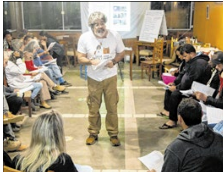
Objetivo é promover melhorias das condições sanitárias e do manejo das águas

A Fiocruz iniciou no segundo semestre deste ano um projeto de saneamento ecológico para promoção da saúde no Brejal, em Petrópolis. Realizado por meio de edital da Financiadora de Estudos e Projetos (Finep), o projeto é voltado para agricultores familiares orgânicos e agroecológicos com o objetivo de promover melhorias das condições sanitárias e do manejo das águas por meio de soluções baseadas em ferramentas de Tecnologia Social.