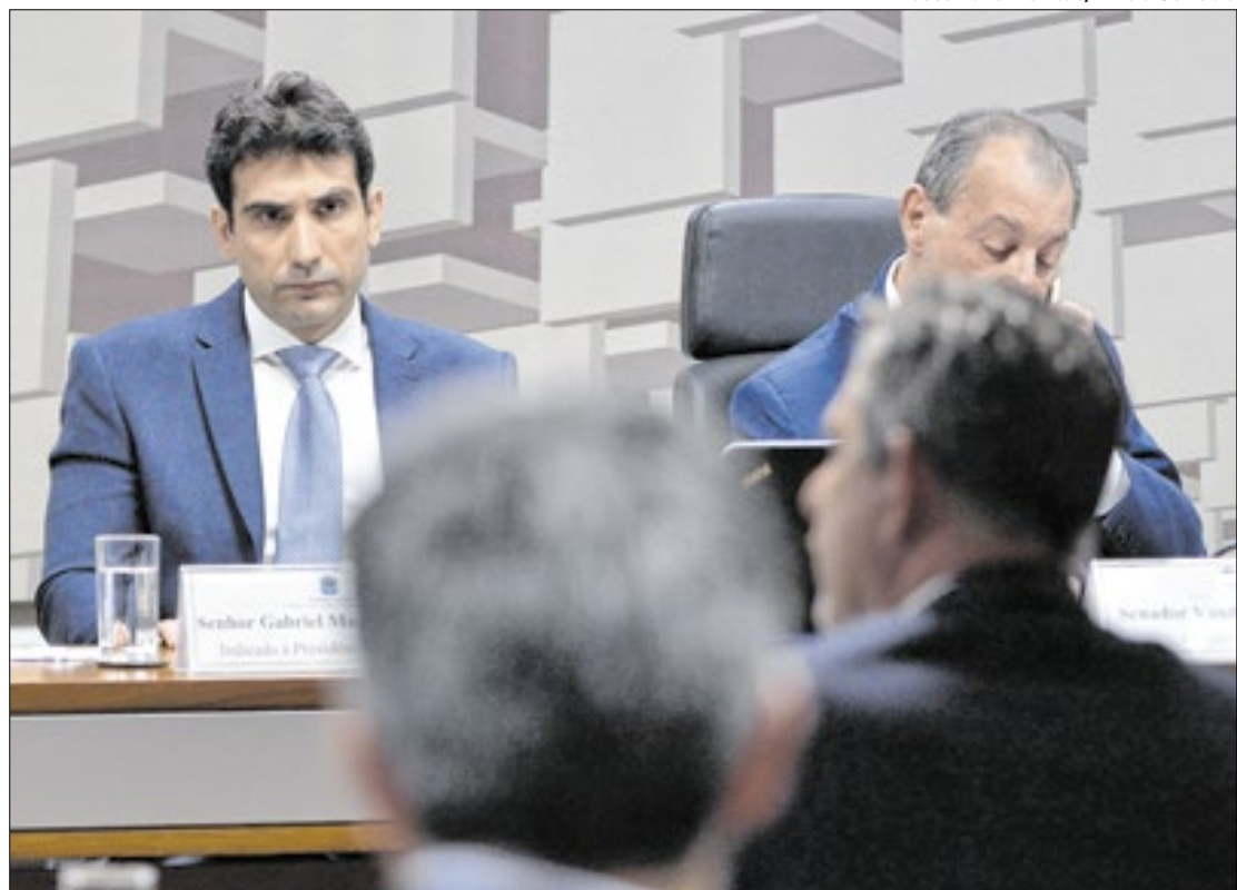
Galípolo afirmou que Lula lhe garantiu autonomia no BC

Indicado por Lula, a aprovação de Galípolo era esperada, devido a seu histórico dentro do próprio Banco Central. Embora tenha a confiança do governo, Galípolo é oriundo do mercado financeiro, e contava, assim, com simpatia mesmo