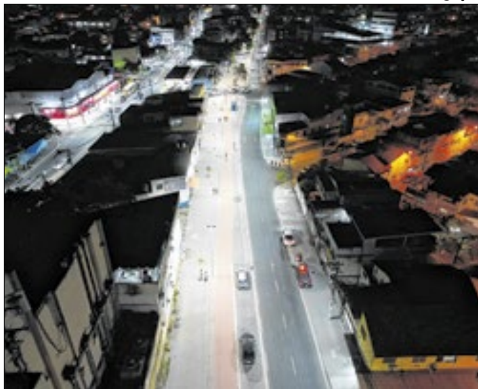
MUVI é o corredor viário da cidade de São Gonçalo

ção, combate aos incêndios e para a recuperação das áreas degradadas. Com o uso do aplicativo, todos terão acesso digital aos focos", explicou Bernardo Rossi, secretário de Estado do Ambiente.