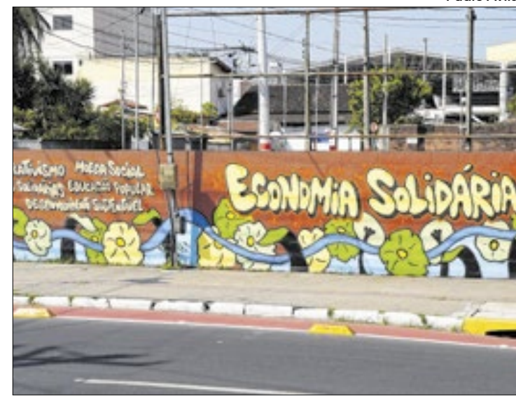
Programação inclui palestras e oficinas