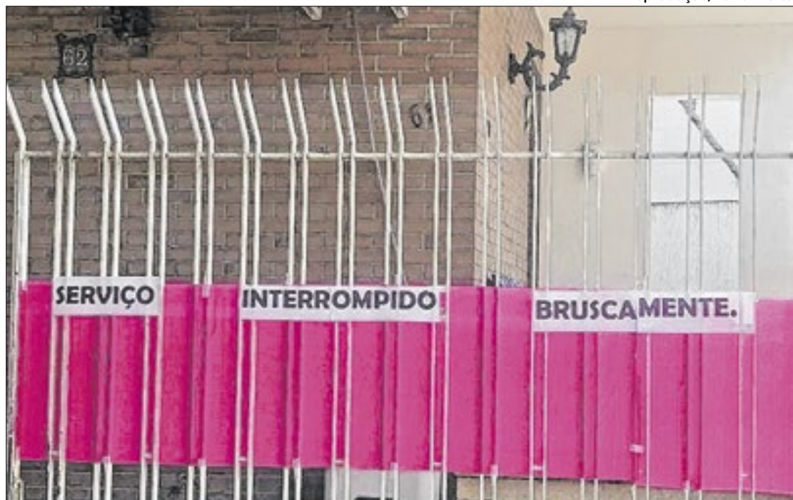
Diversas placas foram colocadas nas grades da unidade de saúde, localizada no Centro