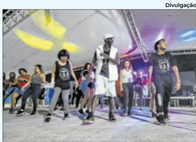
Lona promove festa black para os charmeiros de Mesquita

Na reunião serão apresentados a segurança da barragem do açude grande e o protocolo de emergência caso seja necessária a evacuação da comunidade para os pontos de encontro. No dia 29 de novembro, Dia Estadual de Redução de Risco e Desastres, será realizado um exercício simulado de evento adverso com a mesma comunidade no qual será treinada a evacuação em cenário de rompimento da barragem.