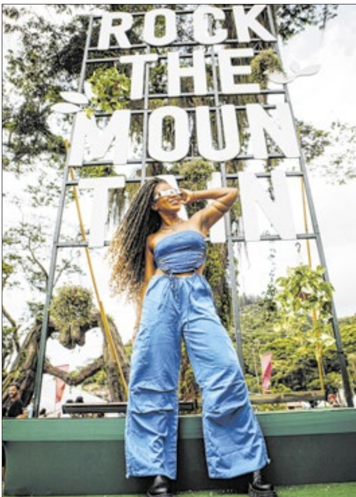
Rock The Mountain acontece na Região Serrana do Rio