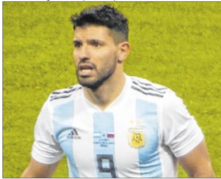
Aposentado, Aguero cobra dívida de salários do Barcelona