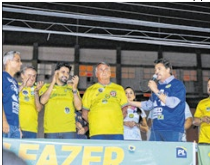
Bolsonaro em comício em Goiânia