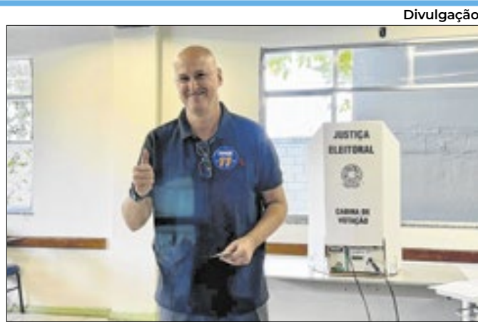
Tande Vieira assume prefeitura de Resende em 2025