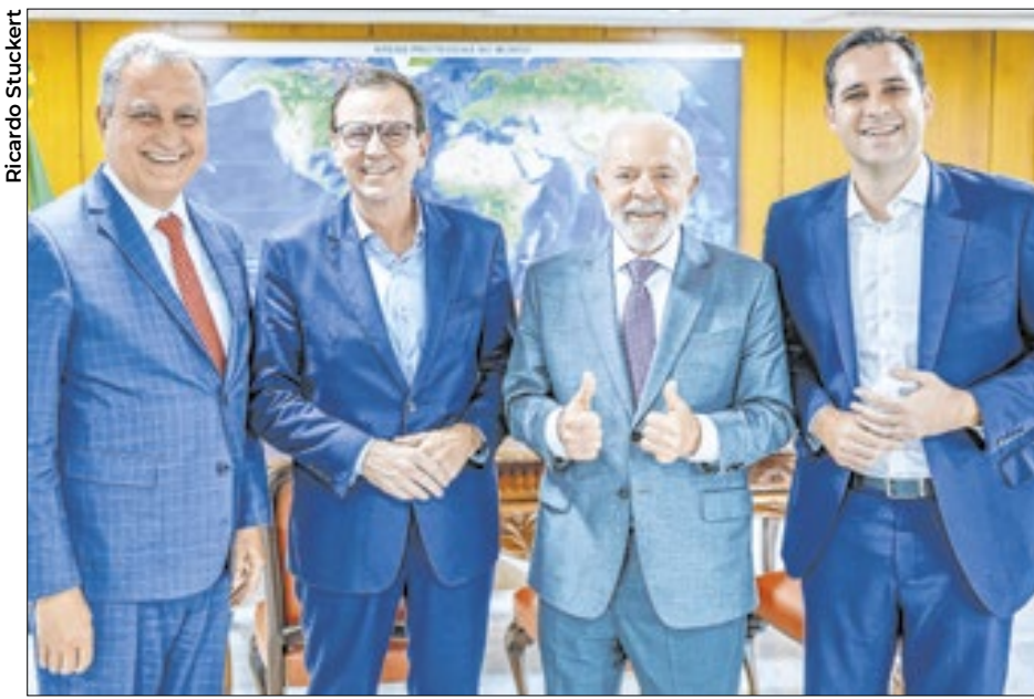
Na sequência: o ministro Rui Costa, Paes, Lula e o vice Eduardo Cavaliere

Reeleito prefeito do Rio de Janeiro, Eduardo Paes tomou um avião e desembarcou na terça (8) em Brasília, para agradecer pessoalmente ao presidente Lula o apoio recebido. Embora Paes nunca tenha sido filiado ao PT, ele e Lula se dão muito bem. "Certamente, você vai continuar sendo o melhor prefeito que o Rio de Janeiro já teve", disse Lula a Paes. O prefeito respondeu: "Vim te agradecer porque o senhor é o presidente da República, o político de dimensão nacional, o único que compreende as coisas do Rio de Janeiro".