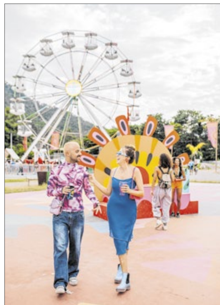
RTM é considerado o segundo maior festival de música do RJ