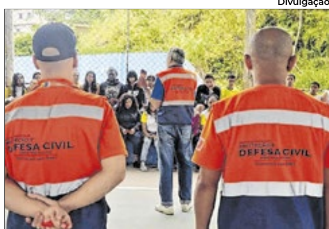
Ação será na comunidade do 2º distrito