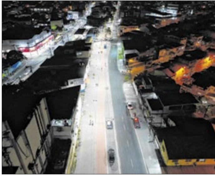
MUVI é o corredor viário da cidade de São Gonçalo