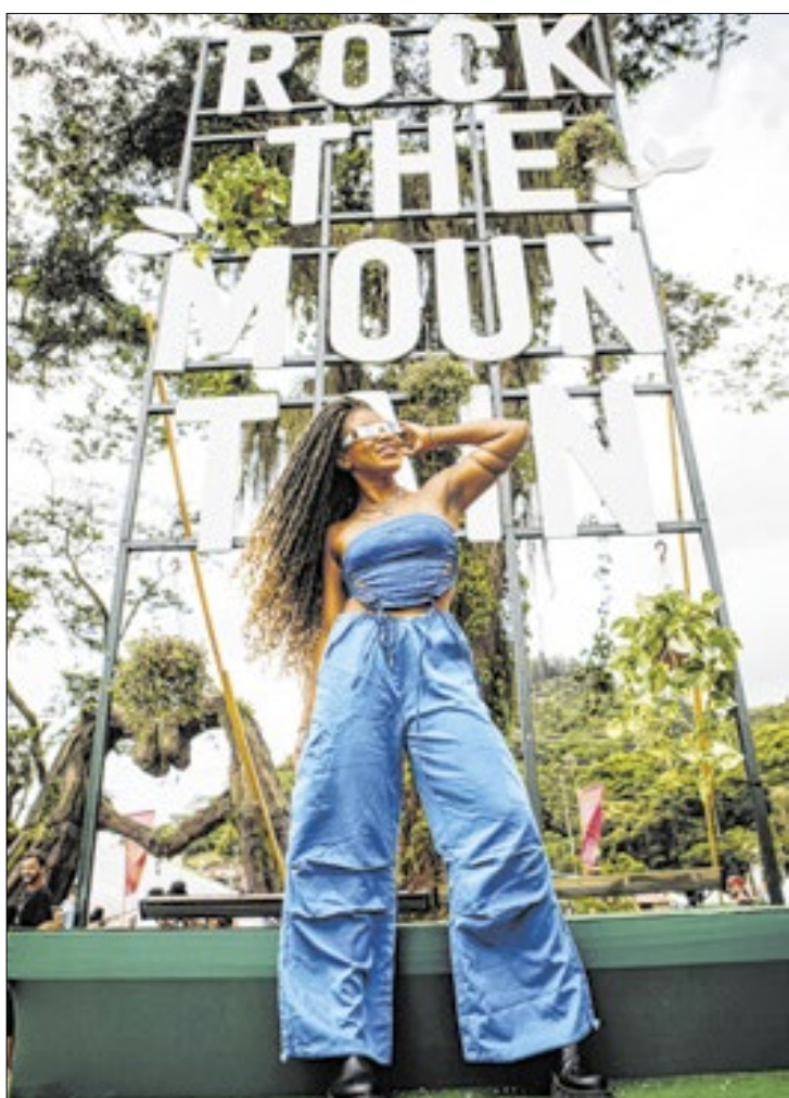
Rock The Mountain acontece na Região Serrana do Rio