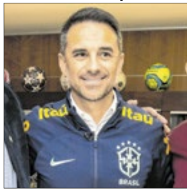
Lesley Ribeiro / CBF

O coordenador da seleção brasileira, Rodrigo Caetano, negou que esteja em negociações com o Atlético-MG para deixar a CBF. O dirigente reforçou que tem contrato até 2026, quando acontece a Copa do Mundo, e espera cumprir esse prazo.