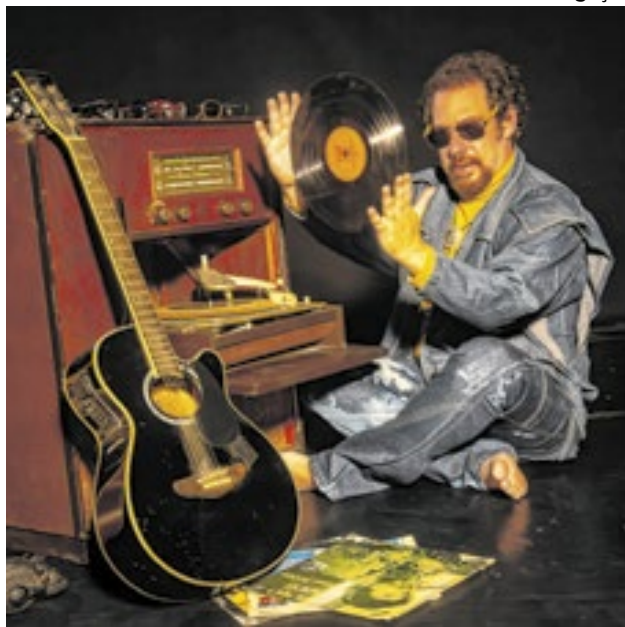
Raul Seixas, O Musical