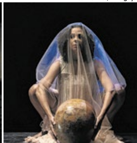
Em Nome da Mãe