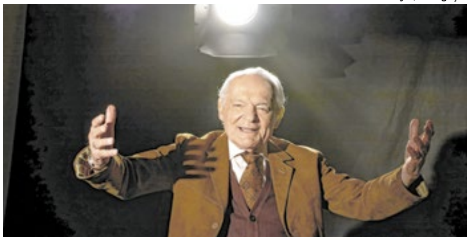
Eu Não me Entrego Não