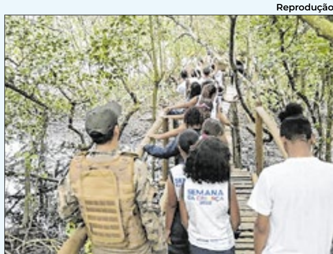
Evento acontecerá no dia 9 de novembro em Magé

clínica médica, pediatria, odontologia e ginecologia. Além disso, a unidade oferece os serviços de sala de coleta, sala de curativo e sala de vacina. A unidade de saúde está localizada na Avenida general Sólton Ribeiro com a Rua Raul Pompeia e ocupa uma área de 269,57 m²