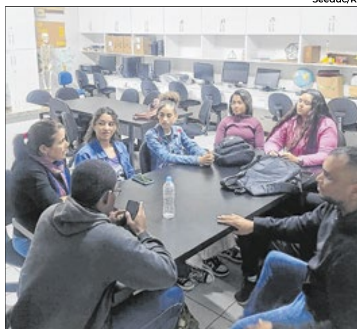
Iniciativa mistura tecnologia e arte e faz sucesso em N.Iguaçu

O Comitê Climatec é um grupo de estudos, que utiliza tecnologia (arduíno e seus componentes) e arte, fazendo protótipos a partir de papelão e outros recicláveis, com senso-