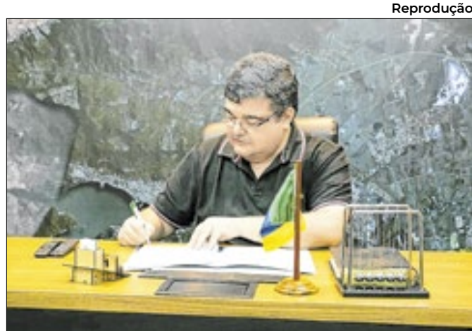
O prefeito de Itaguaí, Dr. Rubão (Podemos)