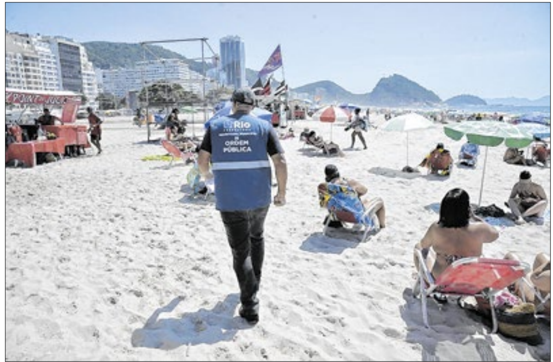
Operação chega ao primeiro mês de vigência reforçando ações na orla da cidade

Levando em conta ação conjunta com a Assistência Social, foram apreendidos 375 objetos perfurocortantes e facas e 274 materiais para con-