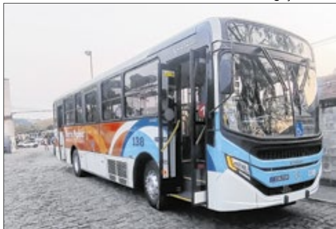
Novos coletivos visam prestar melhor atendimento