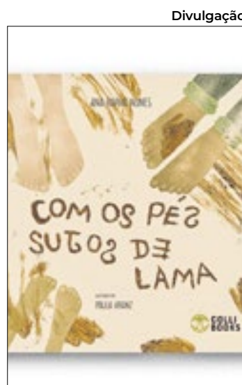
Com os pés sujos de lama

Além disso, a personagem brilha por meio de seu talento musical, mostrando que, com dedicação, trabalho e profissionalismo, é possível transcender barreiras, conquistando reconhecimento pessoal e profissional. Ao longo de sua trajetória,