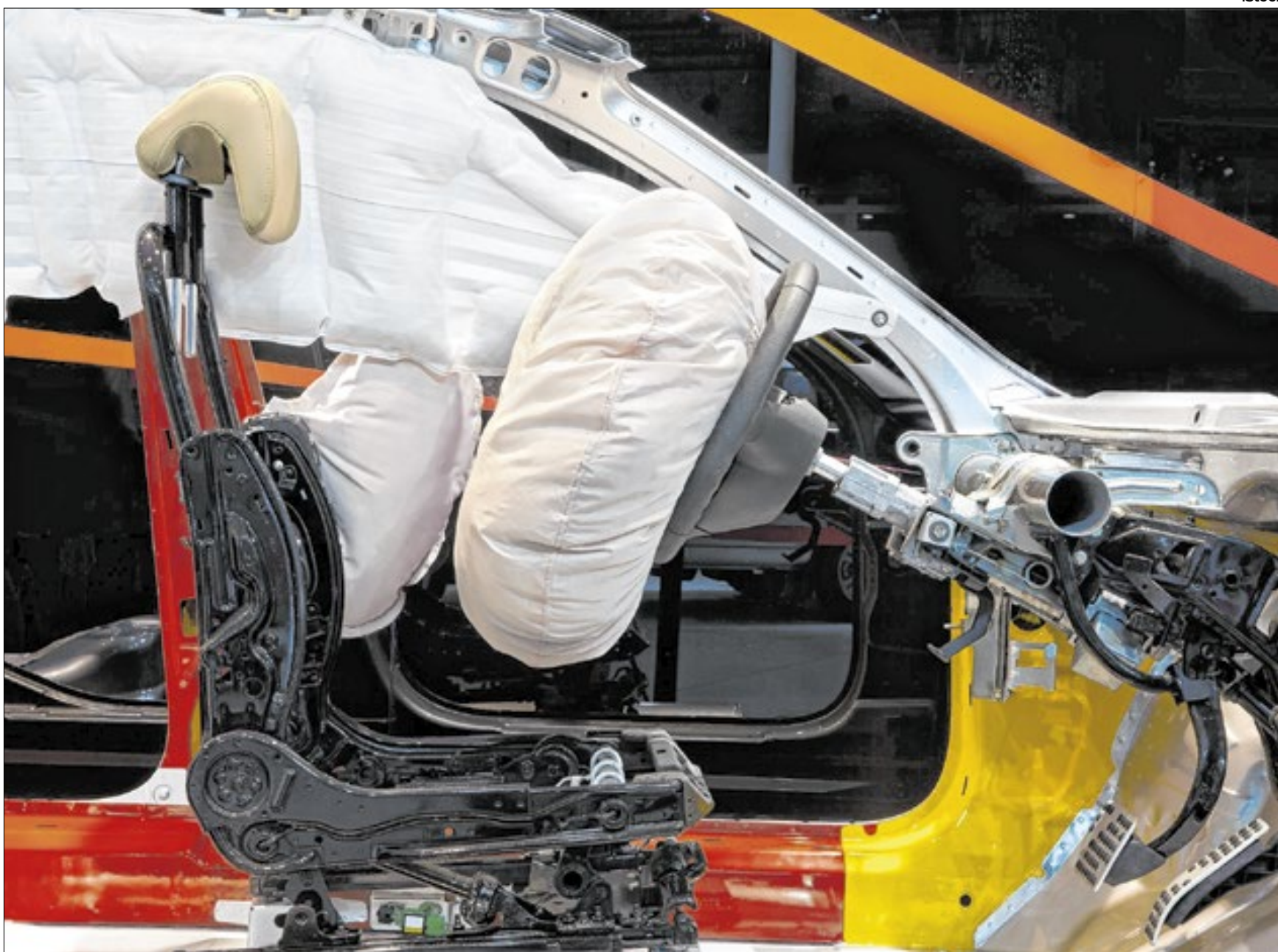
Casos de recall no airbag podem gerar ressarcimento às vítimas