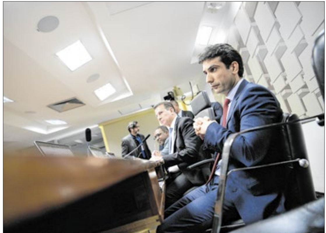
Indicação de Galípolo deve ser aprovada pelo Senado

Primeiramente, Gabriel Galípolo será sabatinado na Comissão de Assuntos Econômicos (CAE) do Senado, em sessão marcada para as 10h. Se aprovado, ele seguirá para votação no plenário da Casa. Em suas sabinas, ele terá de responder perguntas dos senadores quanto à sua indicação, com respostas de tempo estipulado de dez minutos.