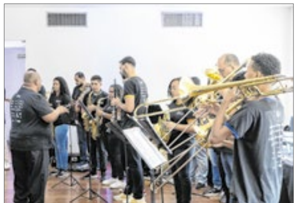
Orquestra da Escola de Música da Rocinha