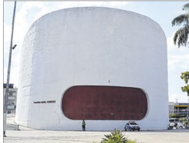
Teatro Raul Cortez, localizado na Praça do Pacificador

A programação de outubro ainda conta com os espetáculos "O Mágico de Oz" e "Divertidamente, o Show".