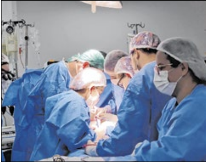
Processo ganhou rapidez com a instalação de heliponto