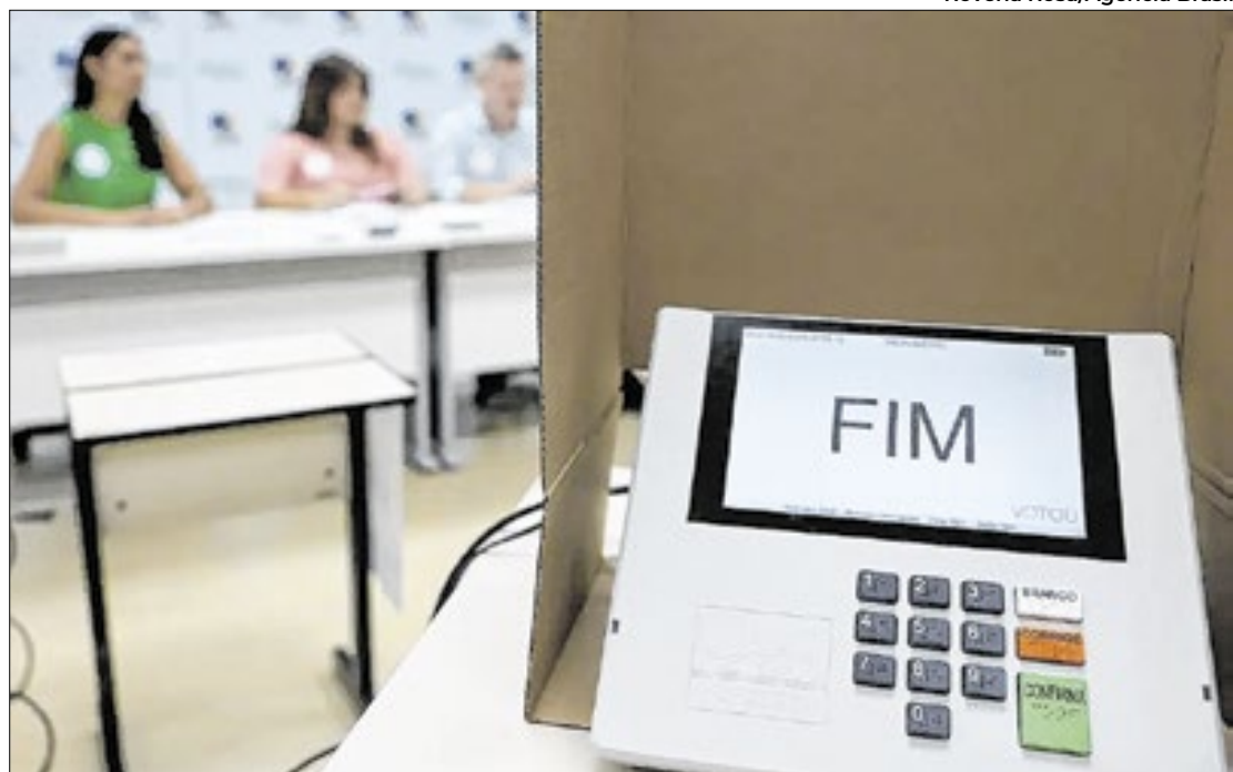
Petrópolis terá segundo turno; e Três Rios resultado da eleição será definido pelo TSE