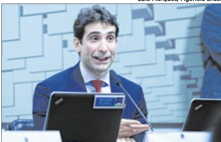
Lula indica Galípolo suceder Campos Neto no BC