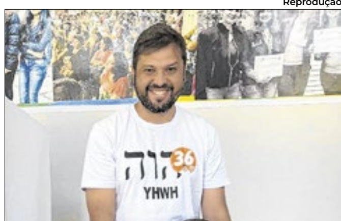
Candidatos dizem ter saído da disputa com cabeça erguida