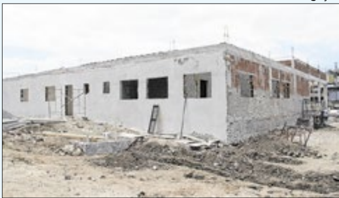
Unidade vai atender 24 mil usuários