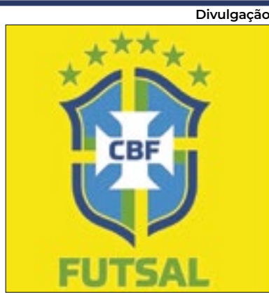
Escudo do Futsal tem seis estrelas

Após a conquista do hexacampeonato de futsal, atletas e membros da comissão da Seleção Brasileira cobraram publicamente para que a CBF fizesse a alteração no escudo das camisas da modalidade para que viessem com suas conquistas devidamente retratadas. E, felizmente, a entidade atendeu ao pedido e atualizou o escudo com a inclusão da tão sonhada sexta estrela. Agora, os torcedores do futebol já sonham com ela no Mundial de 2026.