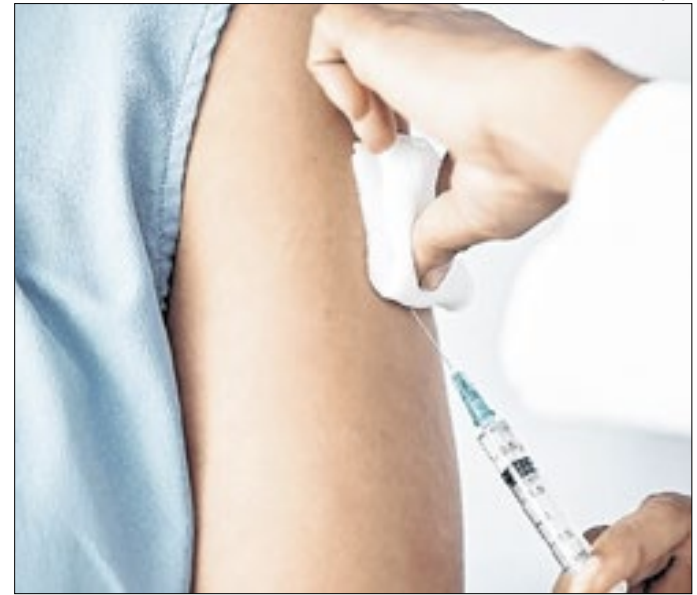
Estado pode ter multa por falsificação de vacina