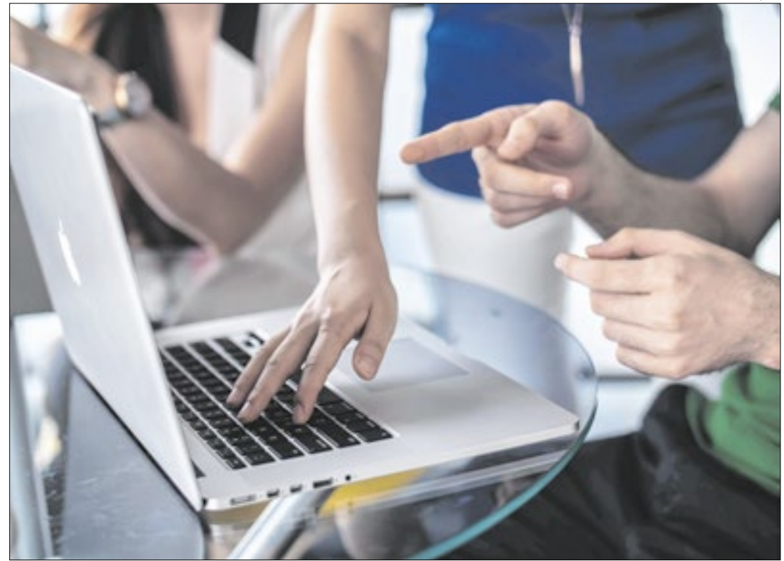
Pedidos realizados no terceiro trimestre foi de 400 mil, um montante 50% maior que em 2023