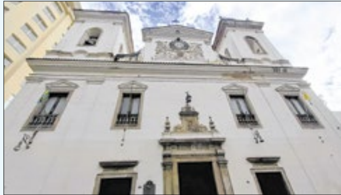
Suspeita é de que ladrão agiu com a igreja fechada