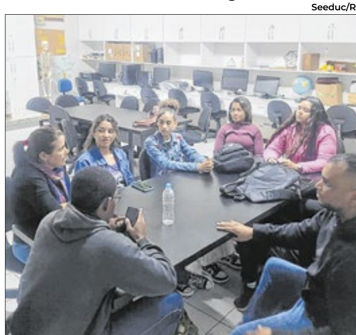
Iniciativa mistura tecnologia e arte e faz sucesso em N.Iguaçu

O Comitê Climatec é um grupo de estudos, que utiliza tecnologia (arduíno e seus componentes) e arte, fazendo protótipos a partir de papelão e outros recicláveis, com senso-