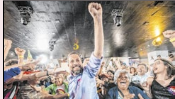
Candidato do Psol topa até nove confrontos