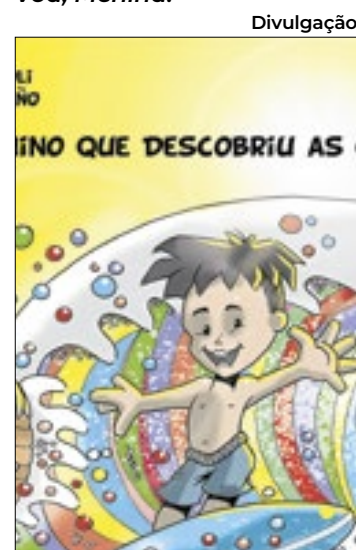
Menino que descobriu cores

ética nas relações, incentivando o leitor a buscar uma vida mais equilibrada e conectada com o que realmente importa: as relações humanas e o contato direto com o mundo ao nosso redor.