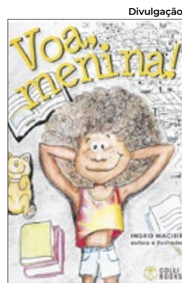
Divulgação Voa, Menina!

Ao abordar esses temas transversais, o livro toca em questões fundamentais como cidadania, saúde emocional e