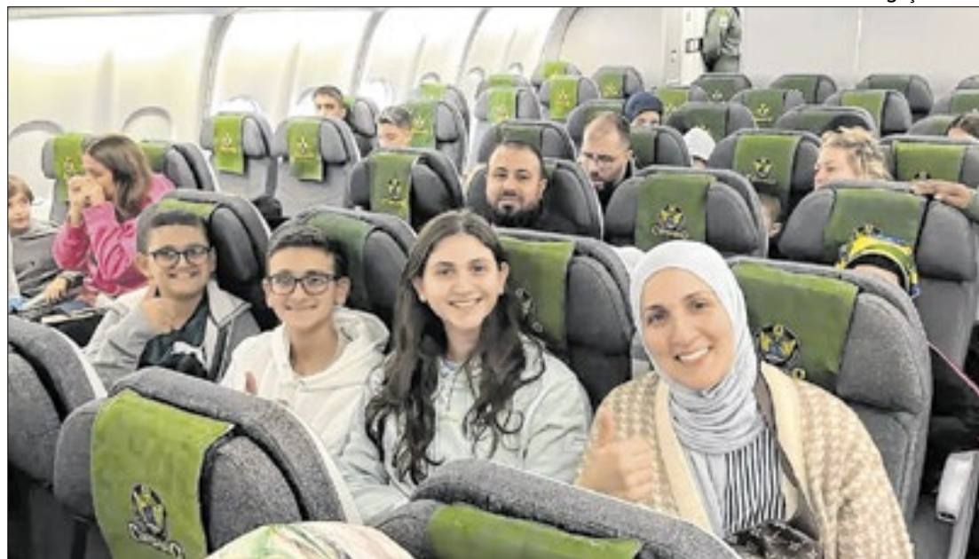
Aeronave deixou o Líbano e vai pousar em São Paulo na manhã desta terça-feira (8)

Estima-se que 20 mil brasileiros morem em território libanês. O Ministério das Relações Exteriores (MRE) contabiliza cerca de 3 mil brasileiros que