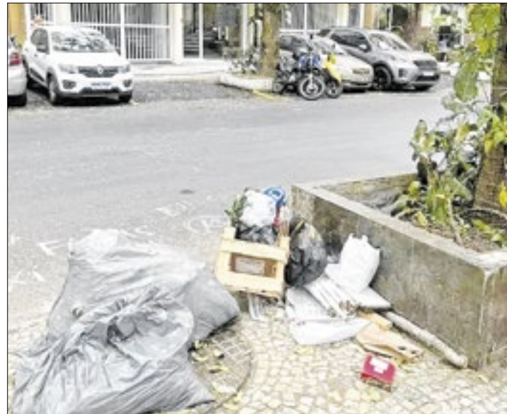
Moradores temem surto de doenças, por conta da sujeira

Ironia do destino, ou não, o bairro mais famoso do mundo se tornou sinônimo de sujeira e descaso público com o cidadão. É o que o carioca ou turista pode encontrar, ao cruzar a esquina da rua Constante Ramos com Leopoldo Miguez, na altura do Posto 4 de Copacabana, agora guindada à condição de depósito de lixo clandestino. O pior de tudo é que, além de haver qualquer providência para eliminar essa vergonha no cartão postal da cidade, a cada dia, o volume de entulho só aumenta, aponta moradores indignados.