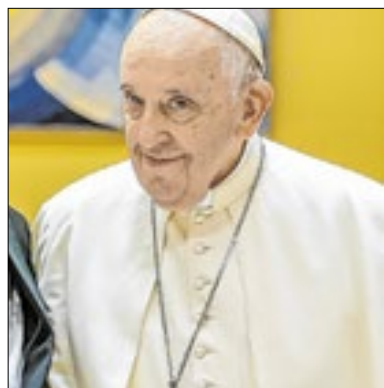
Papa pediu o fim da guerra

No domingo (6), o Papa Francisco fez um novo apelo na guerra entre Israel e Hamas para que cessem os confrontos imediatamente. A guerra está no centro dos debates mundiais após completar um ano de duração na segunda (7).