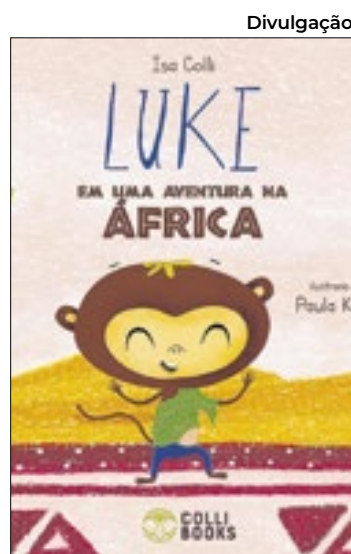
Luke na África