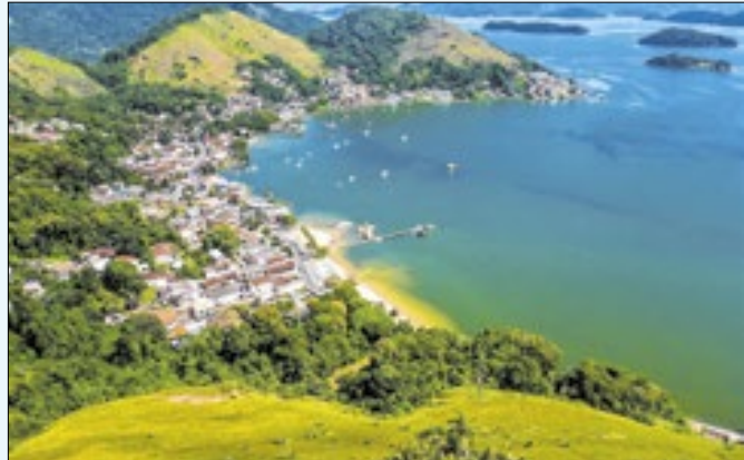
Agenda inclui “Dia D para o combate ao Câncer de Mama”