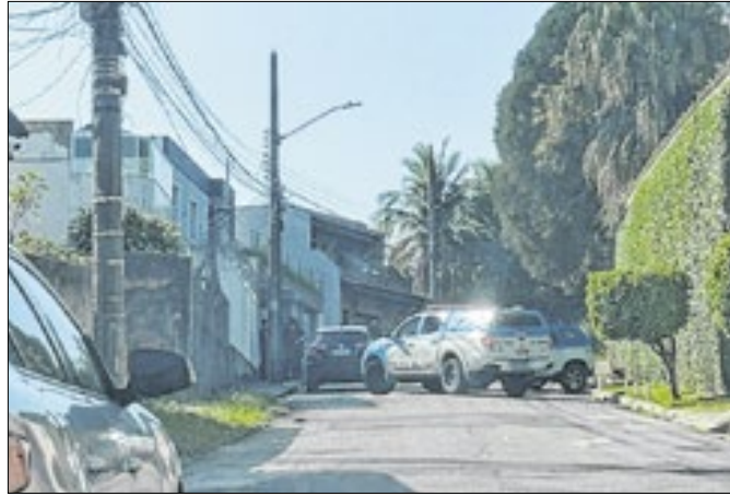
Ex-PM envolvido com máfia de caça-níqueis é executado