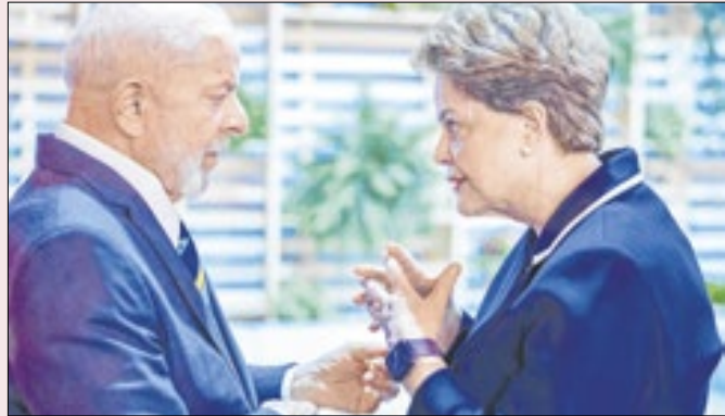
As vésperas do impeachment de Dilma, o PT despenca