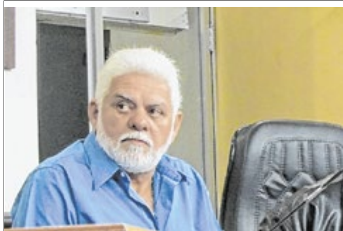
Zoinho retorna à Câmara Municipal de Volta Redonda