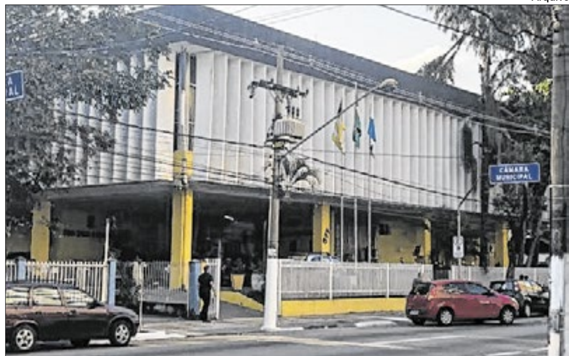
Câmara de Volta Redonda aumenta a bancada do PP e fica com 4 vereadores do partido