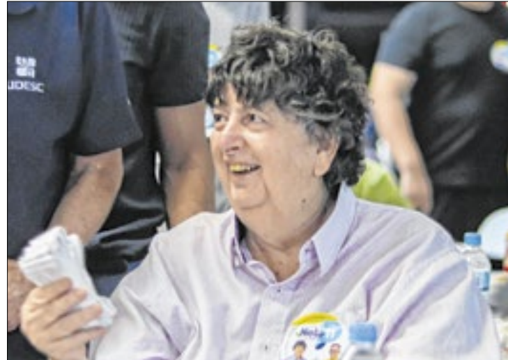
Prefeito quer aproveitar candidatos com maior expressão