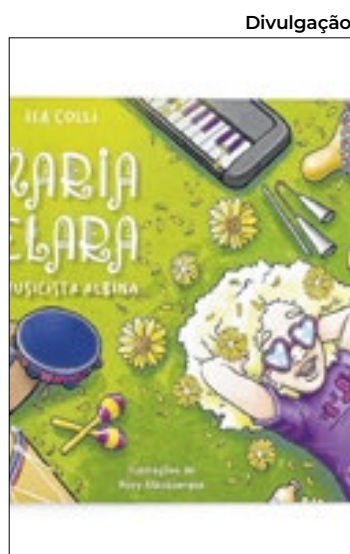
A Musicista Albina