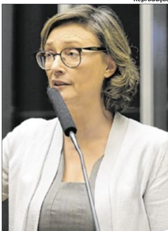
Candidata do PT teve 26,28 % dos votos

Candidato do MDB saiu na frente na disputa em Porto Alegre