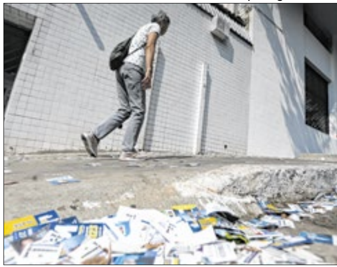
Se não for coibida, violência jogará democracia no lixo