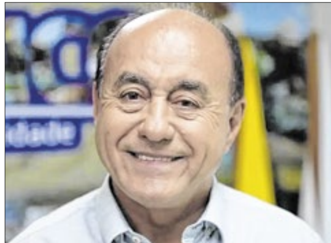
Candidato do PL venceu com quase 55% dos votos