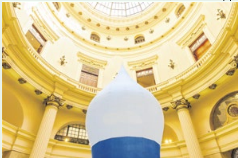
Instalação em forma de balão gigante domina o saguão do CCBB