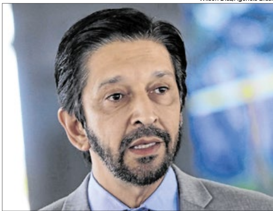
Prefeito quer evitar nacionalização da disputa

Assumiu o protagonismo político na cidade de São Paulo ao