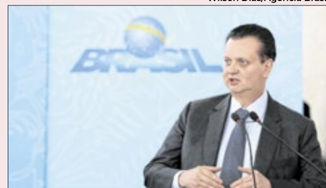
Gilberto Kassab, presidente do PSD