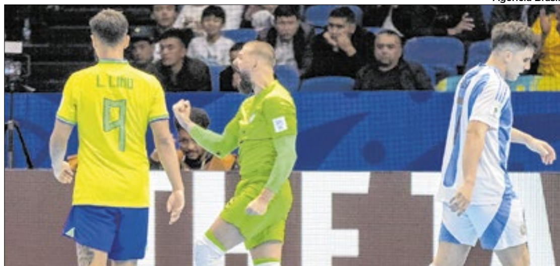
Seleção Brasileira conquista o hexa da Copa do Mundo de Futsal

O Brasil ampliou a hegemonia no futsal e acabou com o jejum de mais de uma década sem conquistar o cobiçado troféu. Antes de se sagrar campeão no Uzbequistão, o Brasil venceu em cinco ocasiões: 1989, 1992, 1996, 2008 e 2012.