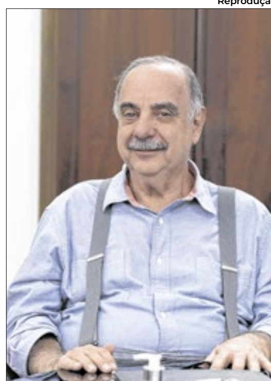
Fuad Noman tenta a reeleição

Os candidatos Bruno Engler (PL) e Fuad Noman (PSD) vão disputar o segundo turno das eleições em Belo Horizonte. Ao final da apuração, Engler obteve 34,39% dos votos válidos, enquanto Noman teve 26,54%.