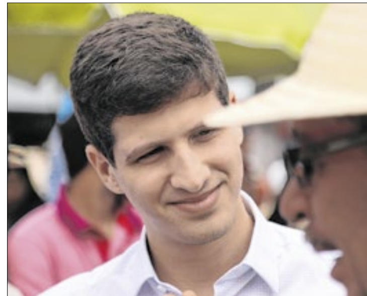
O socialista obteve alcançou marca histórica no Recife