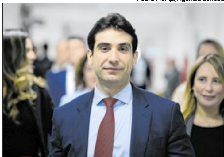
Com a pauta destravada, Galípolo será sabatinado

A sabatina de Galípolo será possível porque, na última sexta-feira (4), o presidente Luiz Inácio Lula da Silva (PT) retirou a urgência do primeiro projeto que regulamenta a reforma tributária (PLP 68/2024) no Senado. A medida foi publicada no Diário Oficial da União (DOU) de sexta-feira. A pedido do presidente do Senado, Rodrigo Pacheco (PSD-MG), a retira-