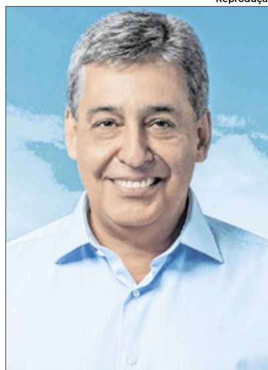
Candidato recebeu 49,72 % dos votos