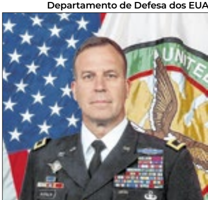
Departamento de Defesa dos EUA

O general Michael Erik Kurilla, líder do Comando Central do exército dos Estados Unidos da América chegou a Israel, no sábado (5), de acordo com o jornal israelense Haaretz, para integrar a comissão