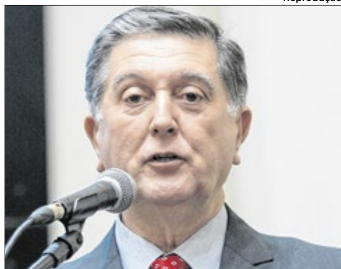
Essa foi sua estreia como cabeça de chapa