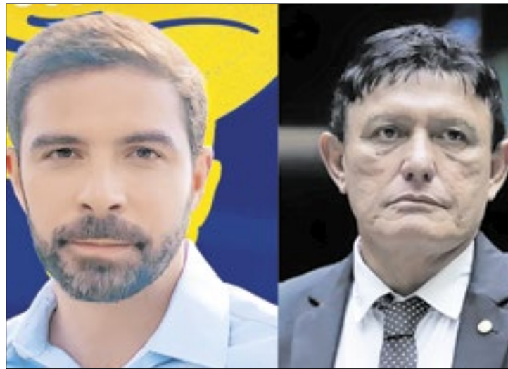
Belém foi a primeira capital a consolidar resultados