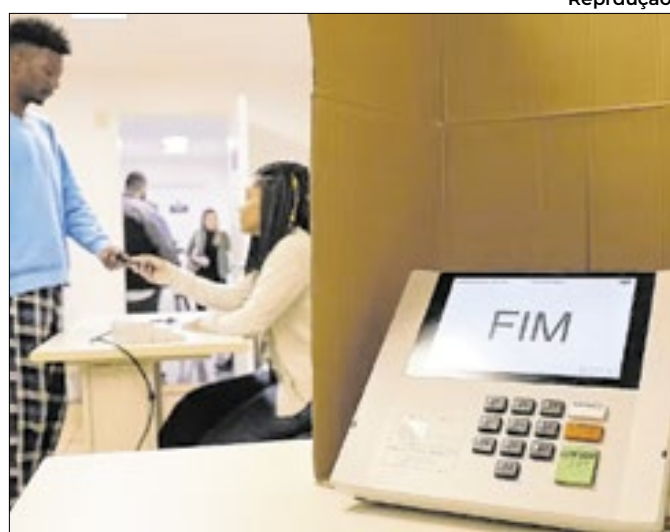
As urnas apresentaram lentidão por horas