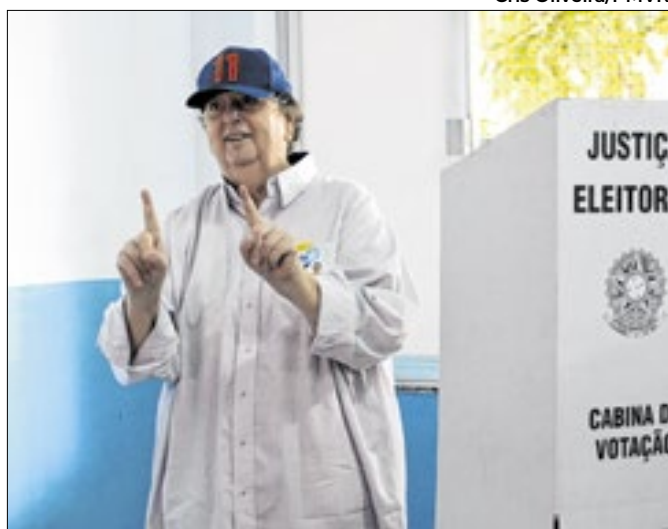
O prefeito votou em um colégio no bairro Laranjal