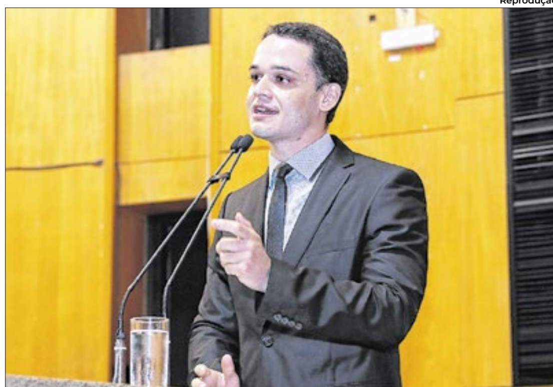
Candidato teve folga nas pesquisas desde o início da campanha