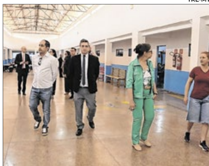
Comitiva do TRE-MT em visita aos locais de votação

Disputa pela prefeitura será em 27/10 entre PL e União