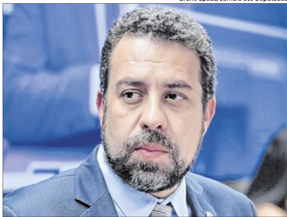
Guilherme Boulos lidera a nova pesquisa

Em 2020 chegou a disputar o segundo turno das eleições, mas foi derrotado pelo então prefeito Bruno Covas, que faleceu em 2021. À época, o vice Ricardo Nunes assumiu o comando da prefeitura da capital.