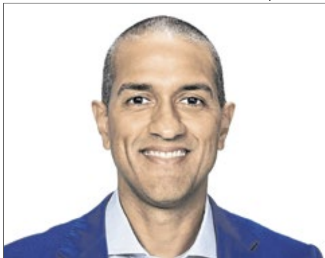
Arthur recebeu mais de 130 mil votos