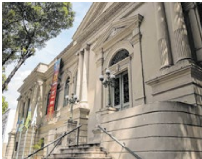
Palácio da Cidade de Teresina, sede da Prefeitura