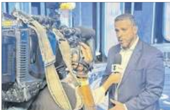
O candidato Rodrigo Amorim durante entrevista nos estúdios Globo