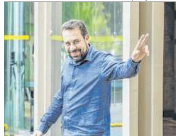
Candidato prefere enfrentar Marçal no segundo turno