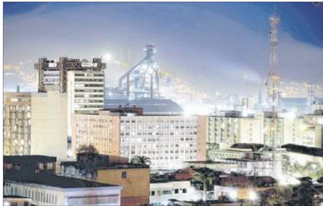
Volta Redonda possui o maior colégio eleitoral e é a única cidade que pode ter 2º turno