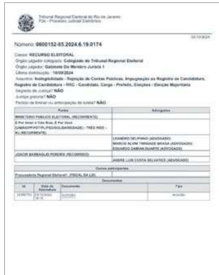
Reprodução do acórdão do TRE-RJ