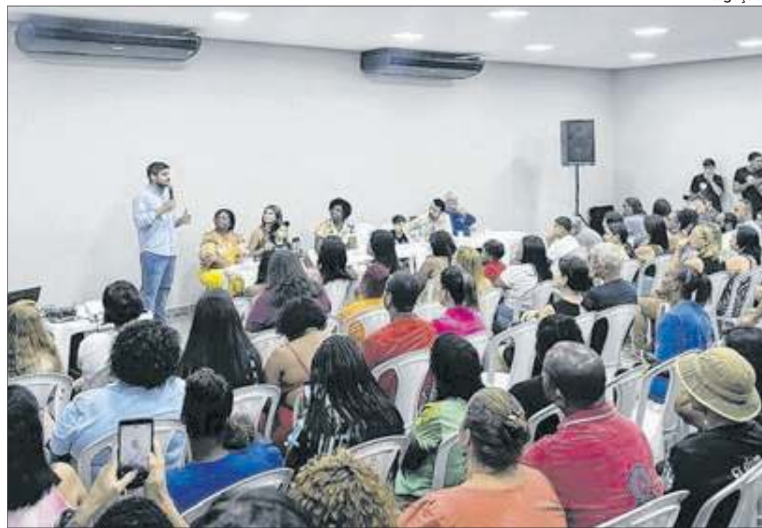
Encontro com lideranças evangélicas foi realizado na noite de quarta-feira (02)