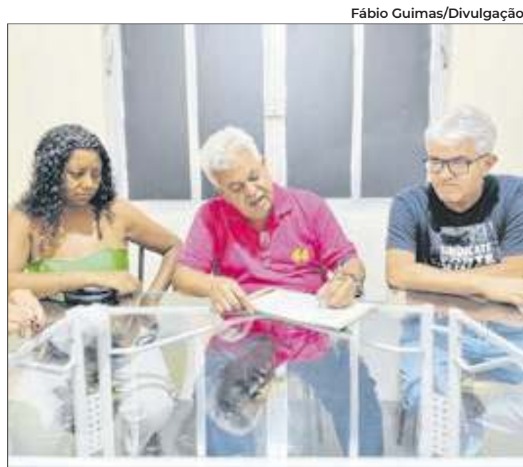
No documento, Cabeleireiro garante direitos à classe

O retorno da regência no percentual de 95% para os professores foi outro compromisso firmado com representantes do