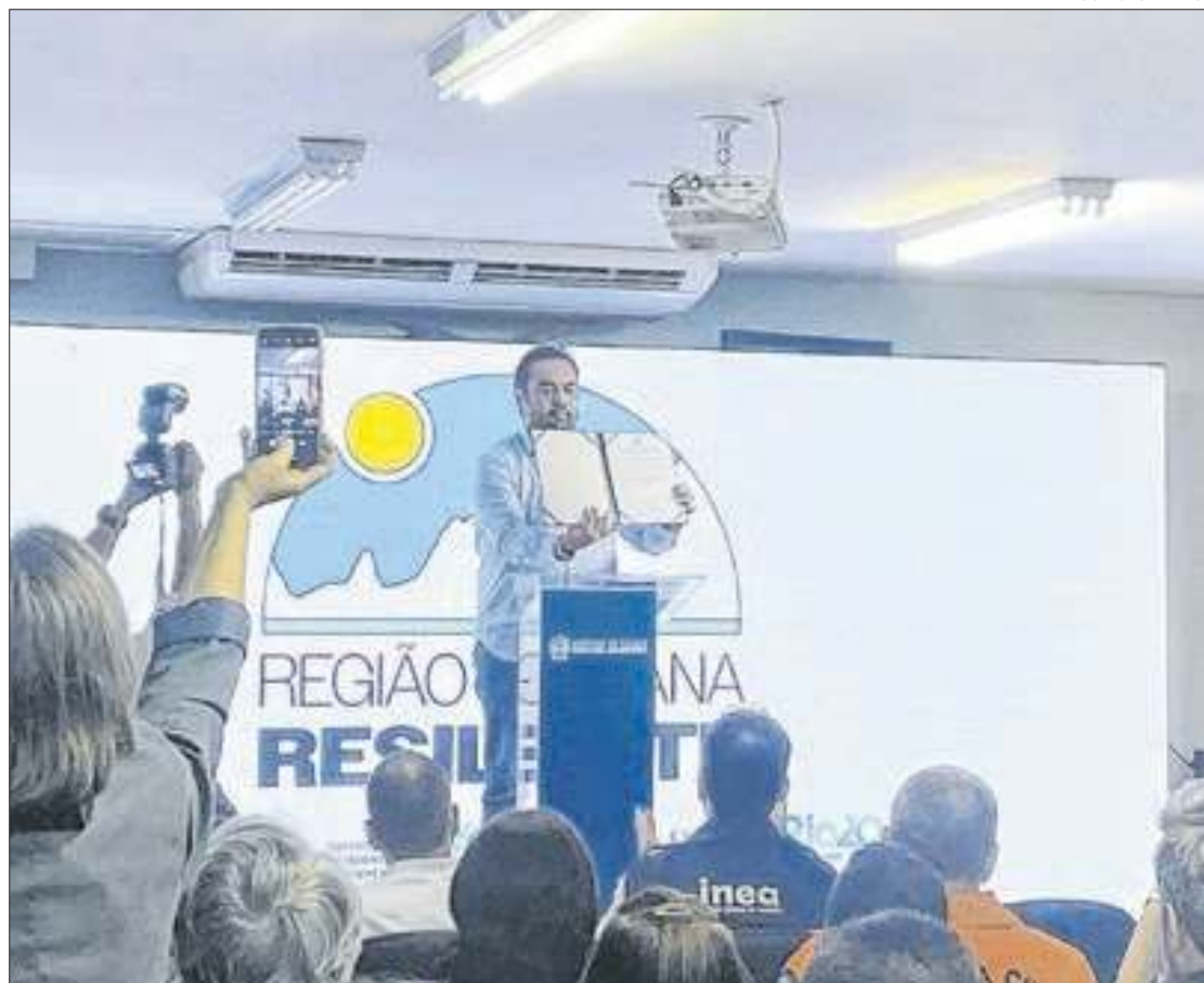
Governador Cláudio Castro esteve na cidade para anunciar a implantação do programa

"Esse é um programa que visa salvar vidas, salvar patrimônio, salvar aquilo que se perde quando você não tem um planejamento adequado na época de tragédia. A gente já viu que não adianta imaginar que não vai acontecer chuva aqui outra vez. Esse tipo de promessa à população já não acredita mais. O que nós precisamos aqui em Petrópolis é esse processo de resiliência. Fazer a contenção de