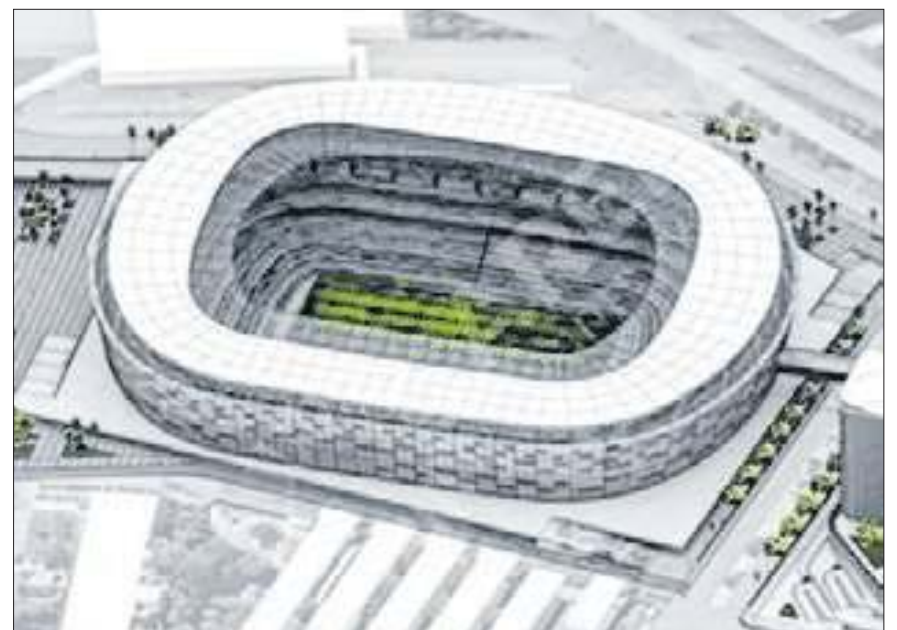
Previsão é de que estádio fique pronto em 2029