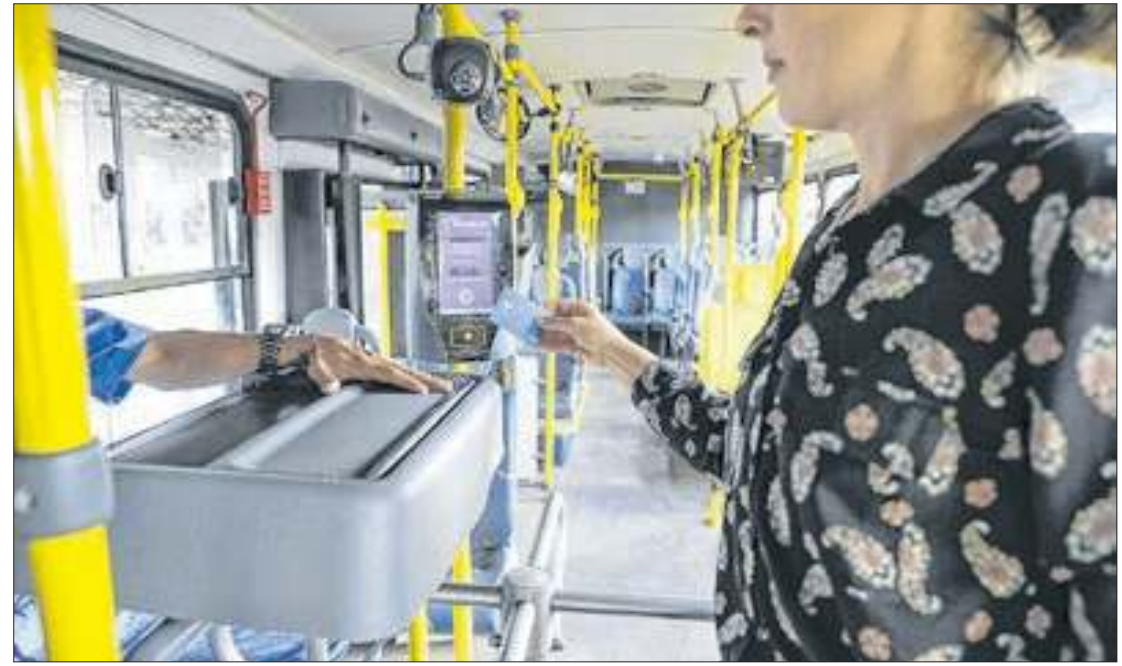
Transporte coletivo será gratuito de 8h às 17h, durante o horário de votação

Os municípios foram questionados pelas Zonas Eleitorais e responderam com ofícios, informando linhas, horários e itinerários, que podem ser consultados aqui. O espaço será atualizado com novas co-