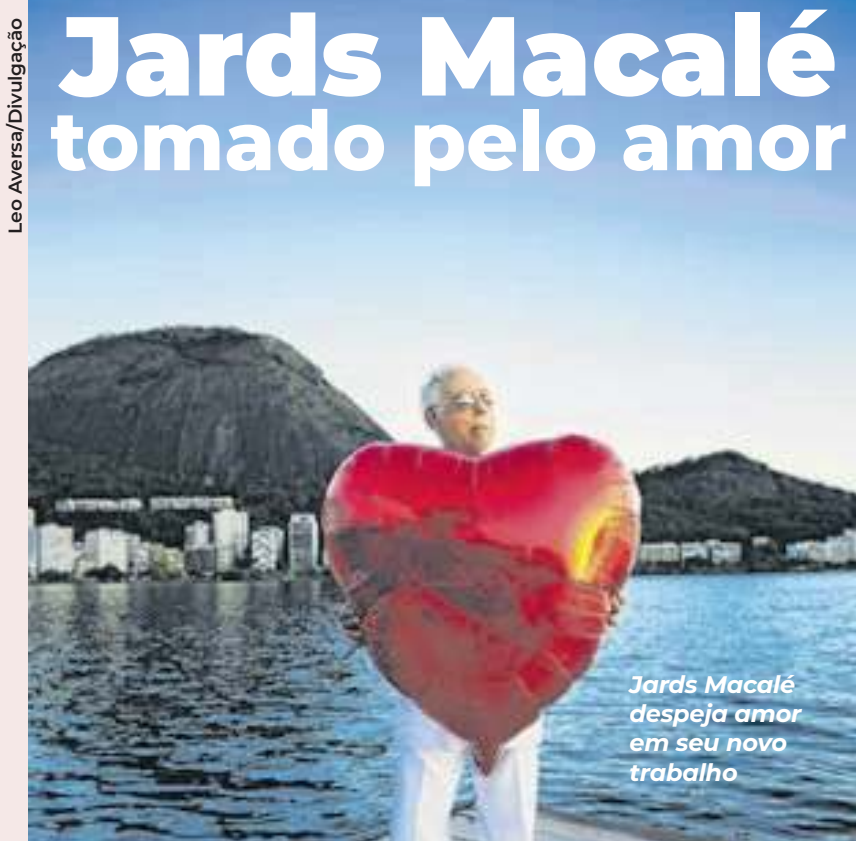
Jards Macalé despeja amor em seu novo trabalho

O cantor e compositor Jards Macalé volta ao palco do Tetro Rival Petrobras para apresentar neste sábado o repertório de 'Coração Bifurcado', álbum que saiu consagrado da cerimônia do Prêmio da Música Brasileira em junho