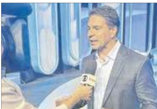
Ramagem fazendo a sua avaliação do último debate antes as eleições