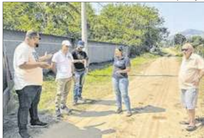
Candidata do NOVO esteve no bairro Ipiranga