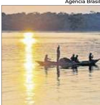
Cooperação em energia

Brasil e EUA discutem a cooperação em hubs de energia limpa, por meio de parcerias entre os governos e com participação do setor privado. Os centros de compartilhamento vão operar hidrogênio e os chamados CCUS (Carbon Capture, Utilization and Storage, ou captura, uso e armazenamento de carbono, em tradução livre).O tema foi discutido entre o ministro de Minas e Energia, Alexandre Silveira e a secretária de Energia dos EUA, Jennifer Granholm.