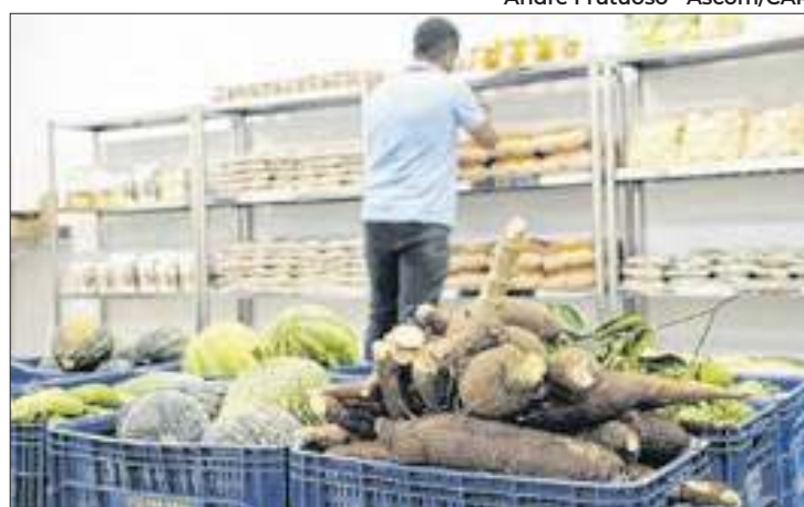
Dos 25 produtos da Cesta Básica, 13 registraram redução