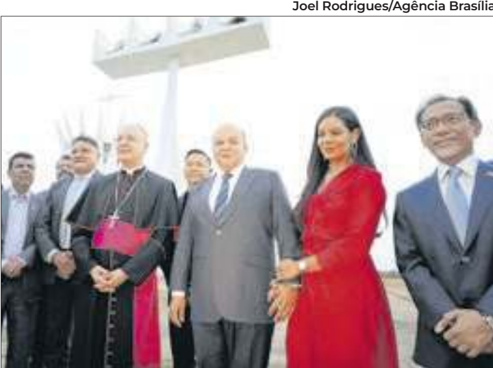
O governador Ibaneis Rocha durante a entrega da restauração do campanário da Catedral, ontem

Segundo a Arquidiocese de Brasília, a Catedral recebe cerca de 3 milhões de turistas por ano. Tanto a igreja quanto o campanário são