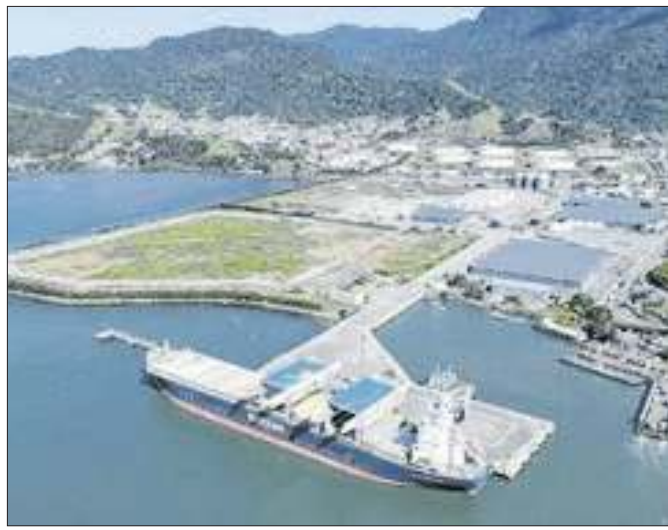
Porto passará a ter maior capacidade de movimentação