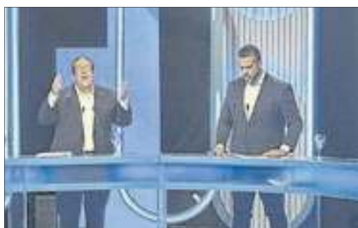
Do outro lado da bancada, os candidatos Tarcísio Motta e Rodrigo Amorim