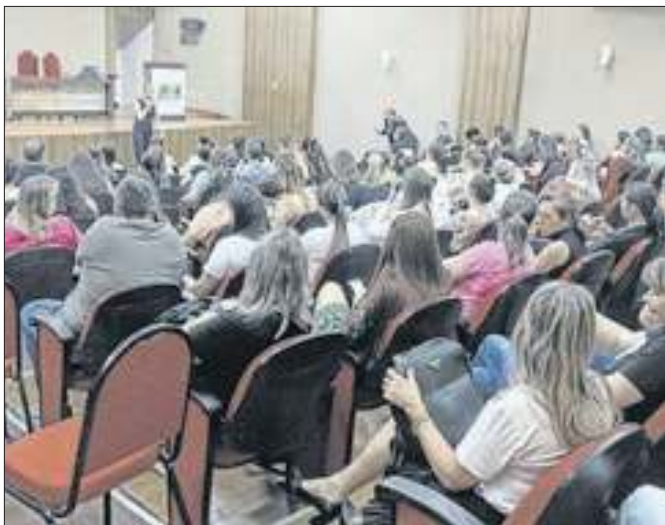
"Sinais de Alerta para o Autismo" foi o tema