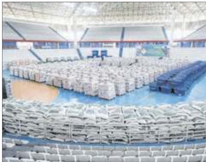
Alimentos doados para ajuda humanitária