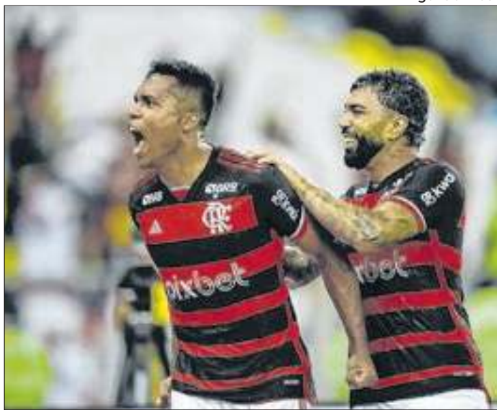
Flamengo perto do sonho do estádio próprio

Após assinatura de acordo, a Prefeitura do Rio e o governo federal realizaram na quinta (3) uma cerimônia de entrega das chaves do terreno do Gasômetro para o Clube de Regatas do Flamengo.