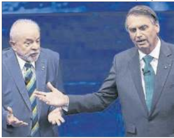
Influências de Lula e Bolsonaro turbinam candidaturas