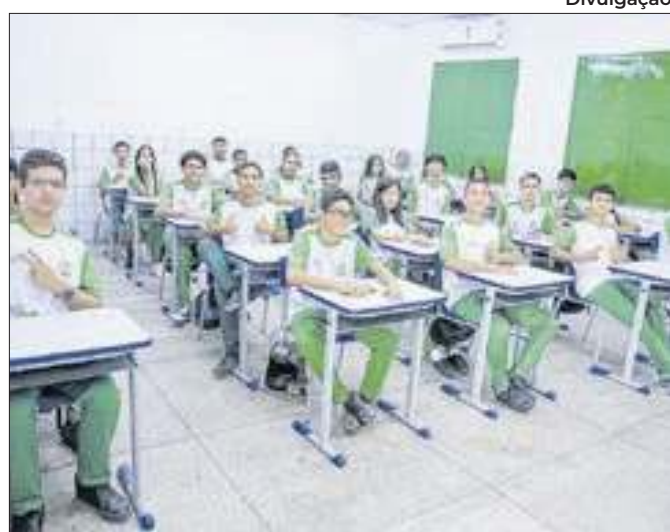
As obras e outros serviços já serão iniciadas, nesse mês