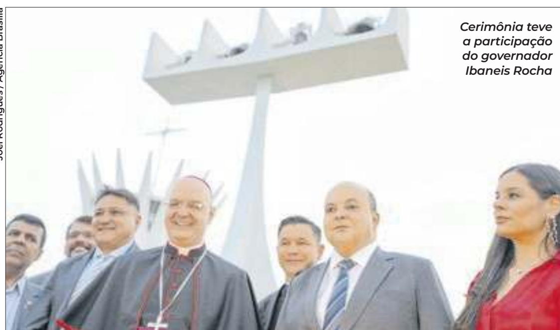
Cerimônia teve a participação do governador Ibaneis Rocha

Após seis anos de silêncio, os sinos do Campanário da Catedral Metropolitana de Brasília voltaram a badalar. Oficialmente, coube ao governador Ibaneis Rocha (MDB) acompanhar a estreia do novo sistema, que conta agora com acionamento remoto. A restauração foi orçada em R$ 126 mil reais e a verba foi doada em junho pela Embaixada de Taiwan, representada no Brasil pelo embaixador Bento Liao. Após essa manutenção, será possível ouvir os sinos nos horários tradicionais: às 6h, às 12h e às 18h. Os quatro sinos de bronze que estão no alto da estrutura, a 20 metros de altura, foram doados pelo governo da Espanha e inaugurados em 1977.