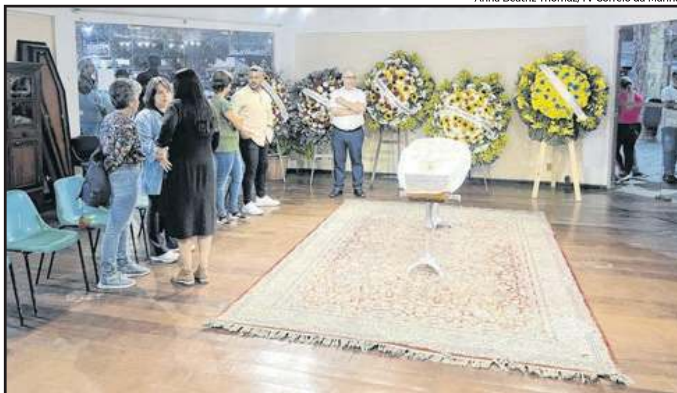
Primeiro velório do corpo do jornalista foi realizado em Petrópolis

Consagrado na televisão brasileira, Cid por dezenas de anos apresentou o Jornal Nacional e o Fantástico, da TV Globo. Atualmente, o jornalista mostrava sua vida através das redes sociais. Em um dos posts, o Cid brincalhão, com uma casca de Lima da Pérsia na boca