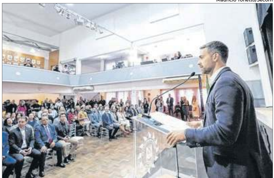
Governador ressaltou avanço na qualificação do atendimento ao cidadão

O portal permite a abertura de uma ocorrência a partir de qualquer lugar, diretamente de um computador, tablet ou smartphone, acessando a DOL Diversidade.