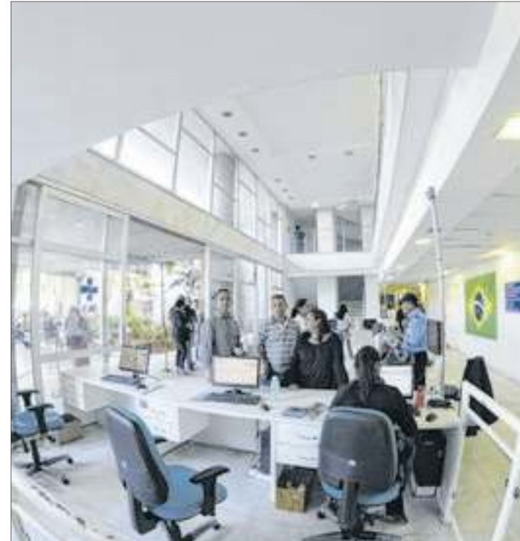
Entrada do Hospital de Base, gerido pelo Iges-DF

Em resposta, o Iges divulgou uma nota. “Logo que foi deflagrada a 1ª fase da operação Escudero, os dois diretores envolvidos foram afastados e, posteriormente, desligados. Na 2ª fase, que teve como alvo a chefe de gabinete, assim que tivemos acesso ao processo, realizou-se o desligamento imediato da colaboradora. O Instituto identificou a necessidade de reforçar e implementar novas medidas, decidindo pela reestruturação da Diretoria de Administração e Logística, com a criação de uma superintendência voltada exclusivamente para contratar, gerenciar e fiscalizar os contratos no âmbito do Instituto”, ressalta.