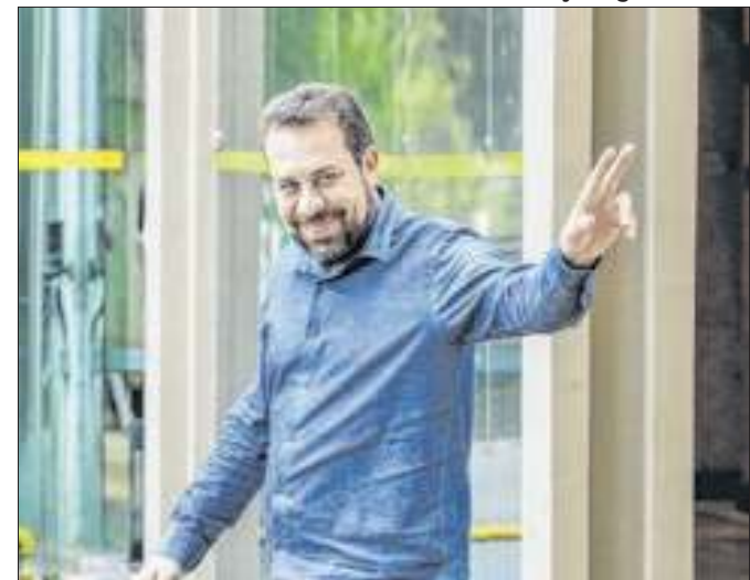
Candidato prefere enfrentar Marçal no segundo turno