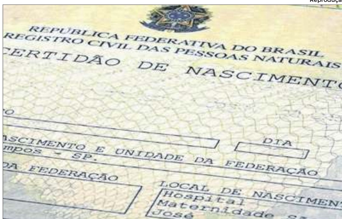
Reprodução A maior redução no número de registros entre 2023 e 2024 foi observada em Ocara

Redução foi em 146 municípios, chegando a quase 80% do total