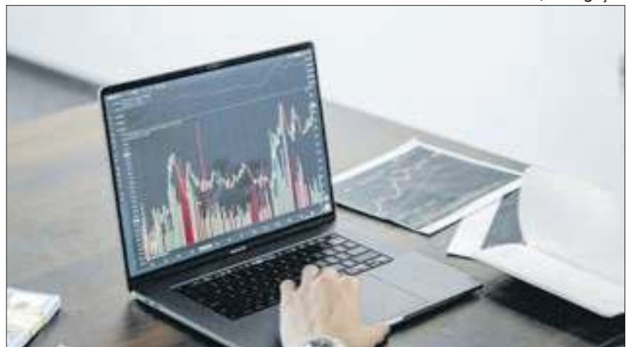
Acumulado anual bate R$ 100 bi, bem acima dos R$ 29 bi projetados