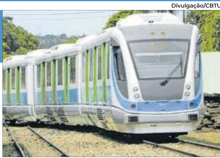
Trem urbano operado pela CBTU em Maceió, semelhante ao que a empresa pretendia operar no Entorno do DF

O documento prevê que a União repassaria R$ 8,4 milhões para o financiamento do estudo de viabilidade técnica e ambiental, que reaproveitará a linha férrea de carga para o transporte de passageiros. Esse recurso já está dispo-