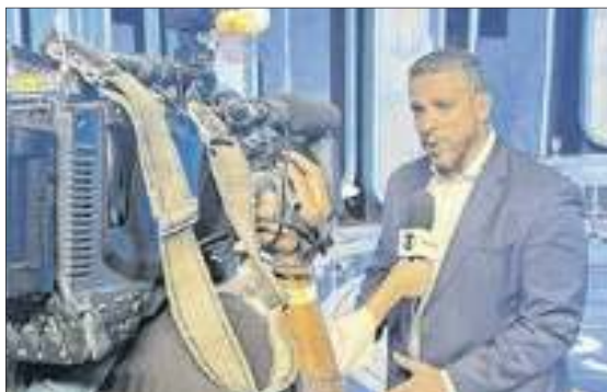
O candidato Rodrigo Amorim durante entrevista nos estúdios Globo