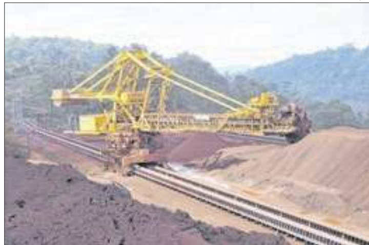
Assunto será apreciado em sessão do tribunal no dia 9

Auditoria do Tribunal de Contas da União (TCU) revelou que o setor mineral tem sonegado fatia considerável da compensação financeira pela exploração de recursos minerais (Cfem), conhecida como royalties da mineração.