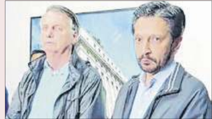
Bolsonaro e Nunes: aproximação não deu liga