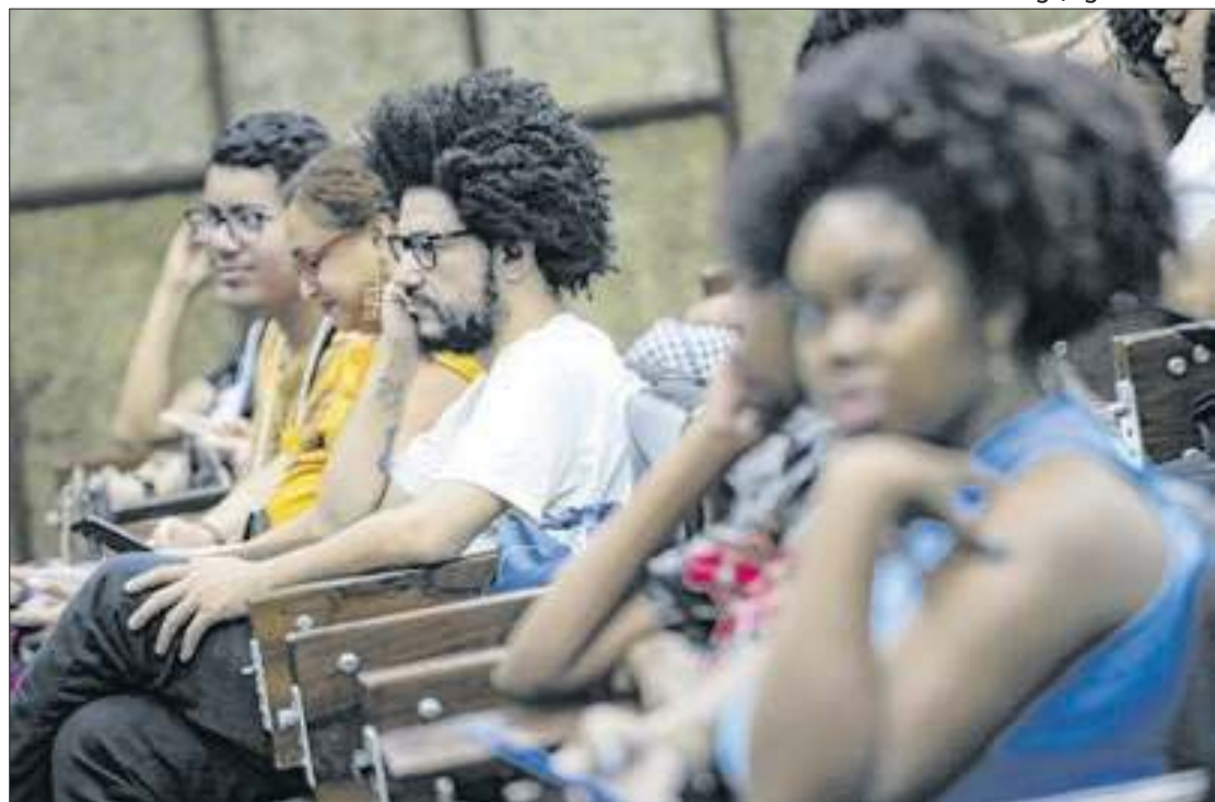
Segundo o MEC, com base no Censo, são 9,9 milhões de alunos matriculados

As instituições privadas respondem pela ampla maioria