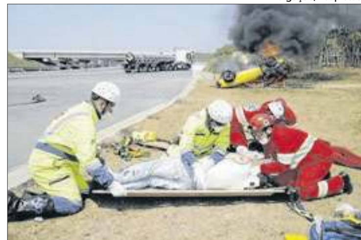
Simulado de acidente e socorro em rodovia de SP

No dia 11 de março deste ano, foi realizado um parto no acostamento da Rodovia Ayrton Senna, região de Itaquaquecetuba. Já era fim de tarde quando um motorista parou o carro na base de Serviço de Atendimento ao Usuário (SAU) da concessionária Ecopistas, no km 28, para pedir ajuda à esposa que estava em trabalho de parto no banco do passageiro. Imediatamente, as equipes de socorro médico e tráfego deram suporte ao casal.