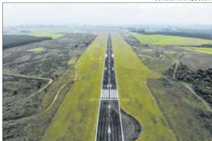
Foram investidos R$ 368 mil na nova sinalização

O governador Jorginho Mello inaugurou nesta quinta-feira, 3, a nova sinalização do Aeroporto da Serra Catarinense, em Correia Pinto. O Governo do Estado investiu, por meio da Secretaria de Portos, Aeroportos e Ferrovias (SPAF), R$ 368 mil nos serviços de pintura, sinalização horizontal na pista de pouso e decolagem, contemplando também o pátio de aeronaves e as taxiways. O investimento foi necessário para que o aeroporto cumpra os padrões técnicos e normativos, garantindo a segurança dos passageiros e aeronaves.