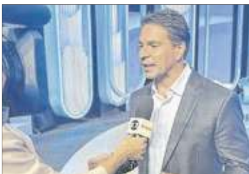
Ramagem fazendo a sua avaliação do último debate antes as eleições