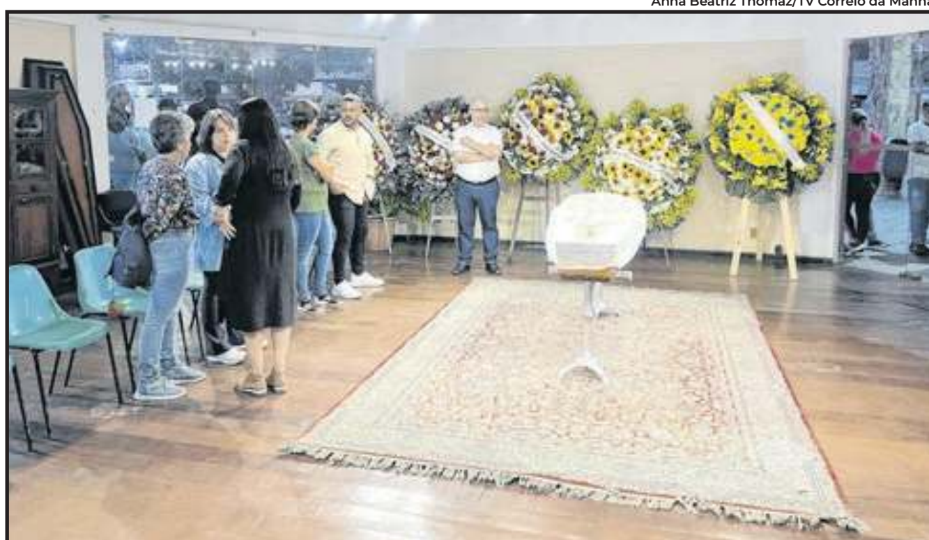
Primeiro velório do corpo do jornalista foi realizado em Petrópolis

Consagrado na televisão brasileira, Cid por dezenas de anos apresentou o Jornal Nacional e o Fantástico, da TV Globo. Atualmente, o jornalista mostrava sua vida através das redes sociais. Em um dos posts, o Cid brincalhão, com uma casca de Lima da Pérsia na boca