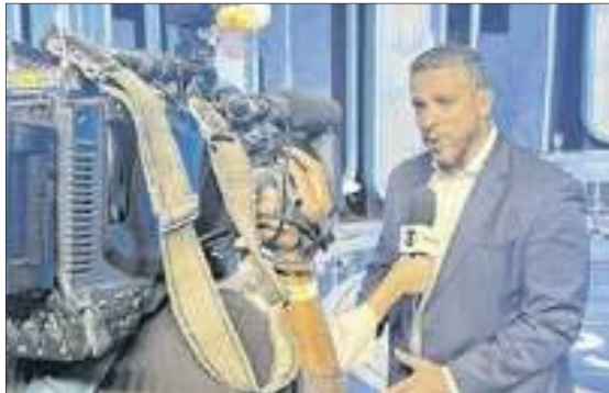
O candidato Rodrigo Amorim durante entrevista nos estúdios Globo