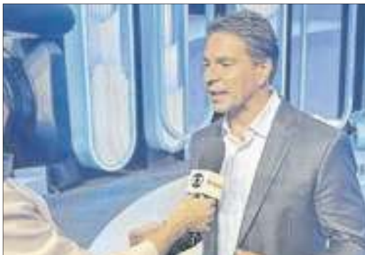
Ramagem fazendo a sua avaliação do último debate antes as eleições