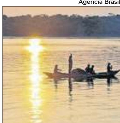
Cooperação em energia

Brasil e EUA discutem a cooperação em hubs de energia limpa, por meio de parcerias entre os governos e com participação do setor privado. Os centros de compartilhamento vão operar hidrogênio e os chamados CCUS (Carbon Capture, Utilization and Storage, ou captura, uso e armazenamento de carbono, em tradução livre).O tema foi discutido entre o ministro de Minas e Energia, Alexandre Silveira e a secretária de Energia dos EUA, Jennifer Granholm.