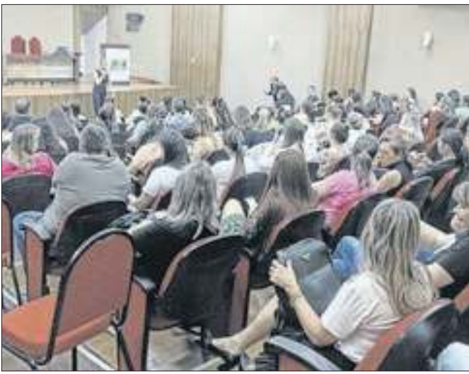
"Sinais de Alerta para o Autismo" foi o tema