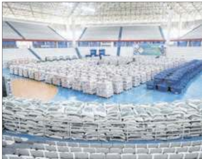
Alimentos doados para ajuda humanitária