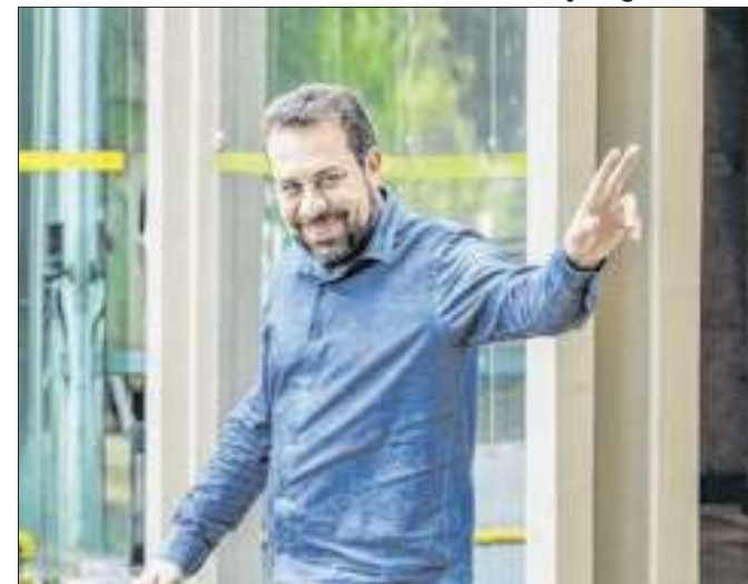
Candidato prefere enfrentar Marçal no segundo turno