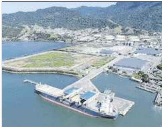
Porto passará a ter maior capacidade de movimentação