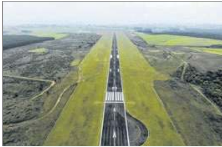
Foram investidos R$ 368 mil na nova sinalização

"Estamos trazendo, com muito capricho, muitos avanços para a região Serrana. E aqui no aeroporto vamos deixar ele em condições, aumentando os voos e a segurança com o balizamento noturno, o equipamento dos bombeiros que produz espuma, enfim, arrumando tudo para quem tomar um voo aqui. Então eu fico muito feliz, quando a gente faz com que as ações que o governo tem que