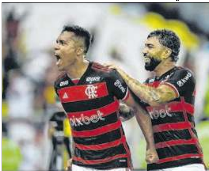
Flamengo perto do sonho do estádio próprio

Após assinatura de acordo, a Prefeitura do Rio e o governo federal realizaram na quinta (3) uma cerimônia de entrega das chaves do terreno do Gasômetro para o Clube de Regatas do Flamengo.