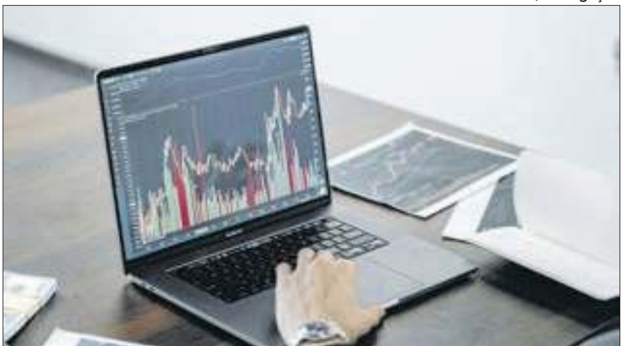
Acumulado anual bate R$ 100 bi, bem acima dos R$ 29 bi projetados