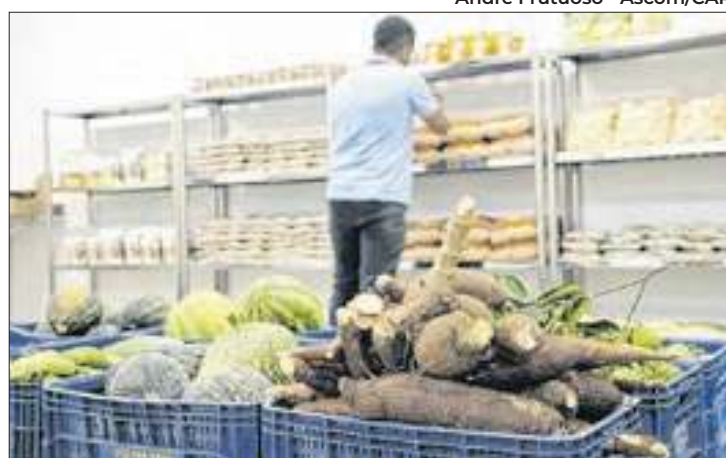
Dos 25 produtos da Cesta Básica, 13 registraram redução