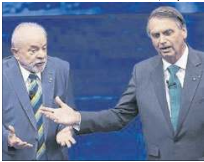
Influências de Lula e Bolsonaro turbinam candidaturas