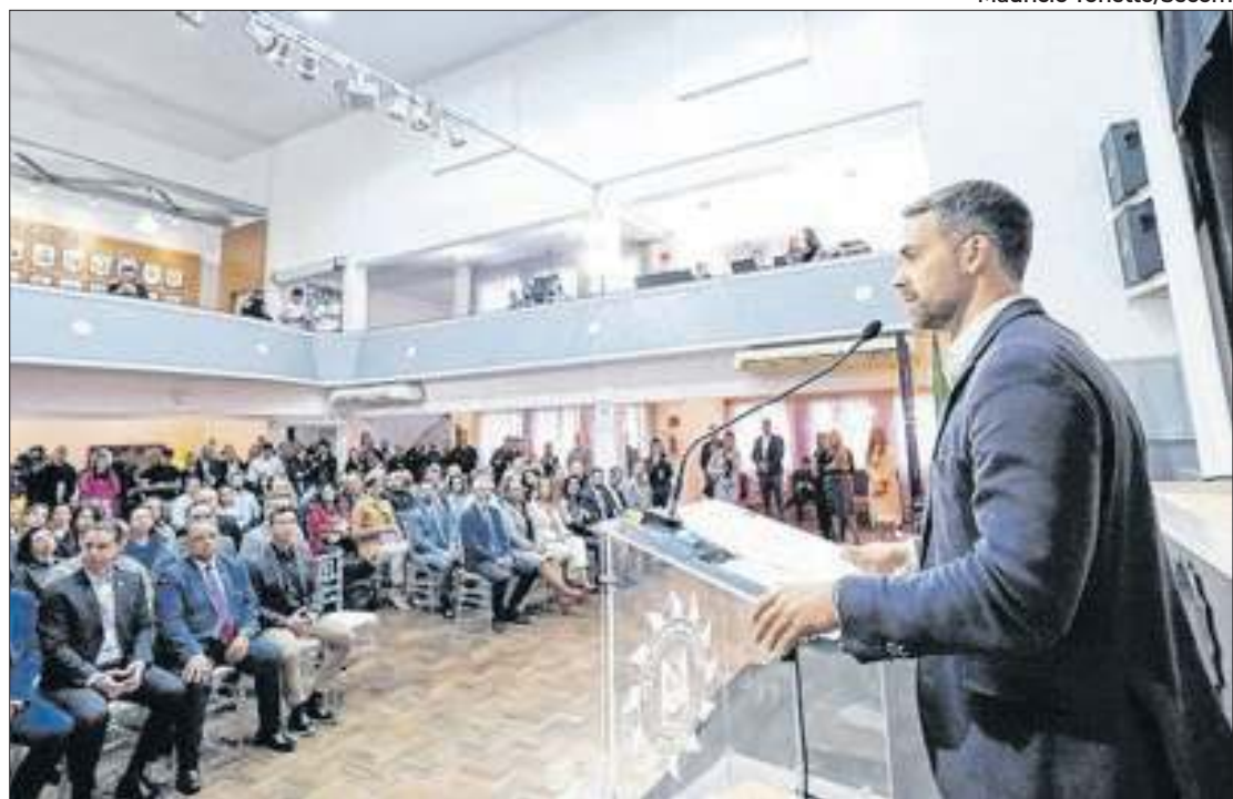
Governador ressaltou avanço na qualificação do atendimento ao cidadão

O portal permite a abertura de uma ocorrência a partir de qualquer lugar, diretamente de um computador, tablet ou smartphone, acessando a DOL Diversidade.