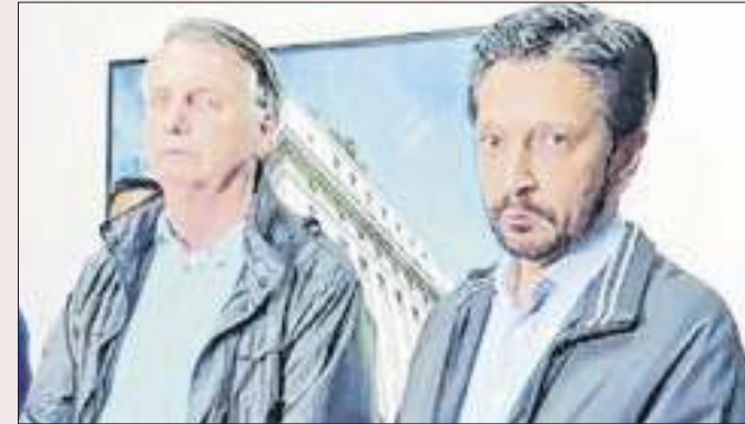
Bolsonaro e Nunes: aproximação não deu liga