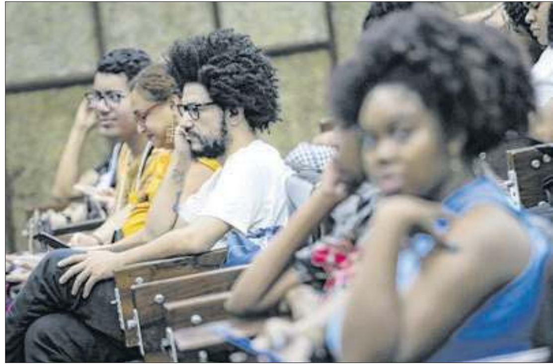
Segundo o MEC, com base no Censo, são 9,9 milhões de alunos matriculados

As instituições privadas respondem pela ampla maioria