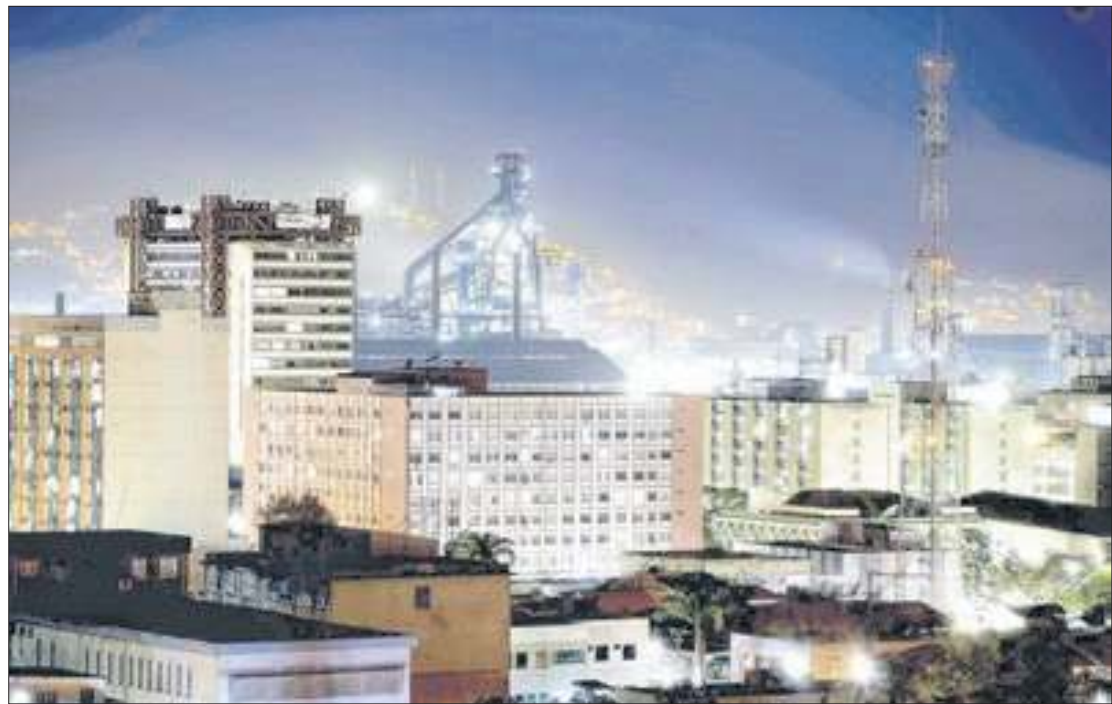
Volta Redonda possui o maior colégio eleitoral e é a única cidade que pode ter 2º turno