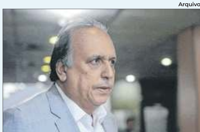
Inquérito contra ex-governador Pezão é encerrado