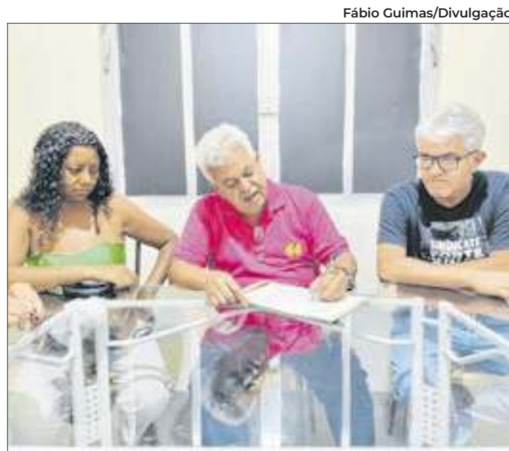
No documento, Cabeleireiro garante direitos à classe

O retorno da regência no percentual de 95% para os professores foi outro compromisso firmado com representantes do