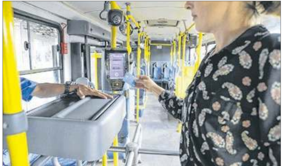
Transporte coletivo será gratuito de 8h às 17h, durante o horário de votação

Os municípios foram questionados pelas Zonas Eleitorais e responderam com ofícios, informando linhas, horários e itinerários, que podem ser consultados aqui. O espaço será atualizado com novas com