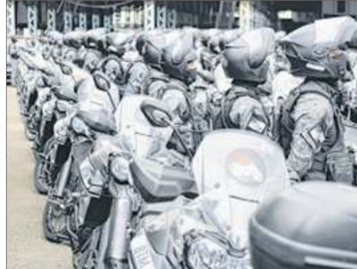
Governador inaugura Batalhão Tático de Motociclistas