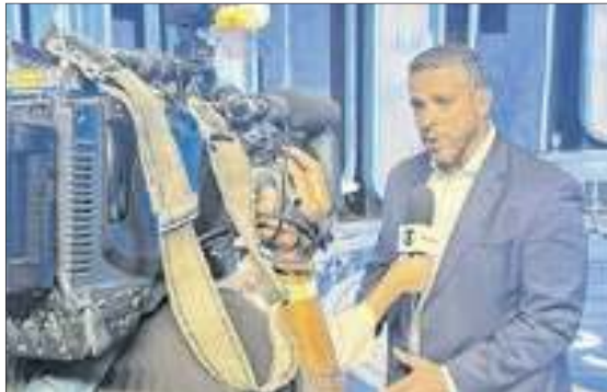
O candidato Rodrigo Amorim durante entrevista nos estúdios Globo