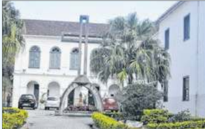
Terra Santa terá missa e comemoração