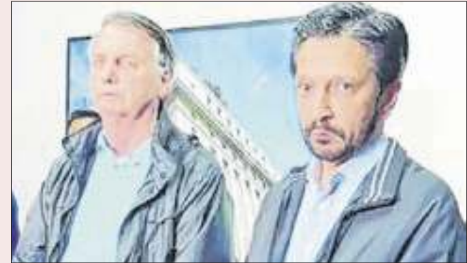
Bolsonaro e Nunes: aproximação não deu liga