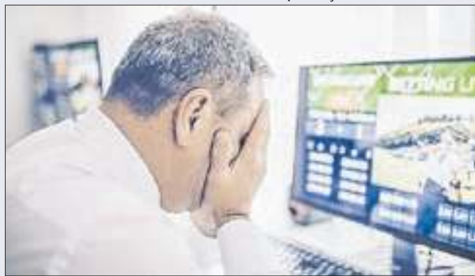
Febraban quer força-tarefa para avaliar impacto das bets