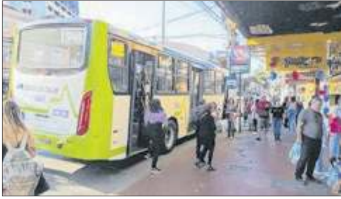
Transporte público será gratuito no domingo