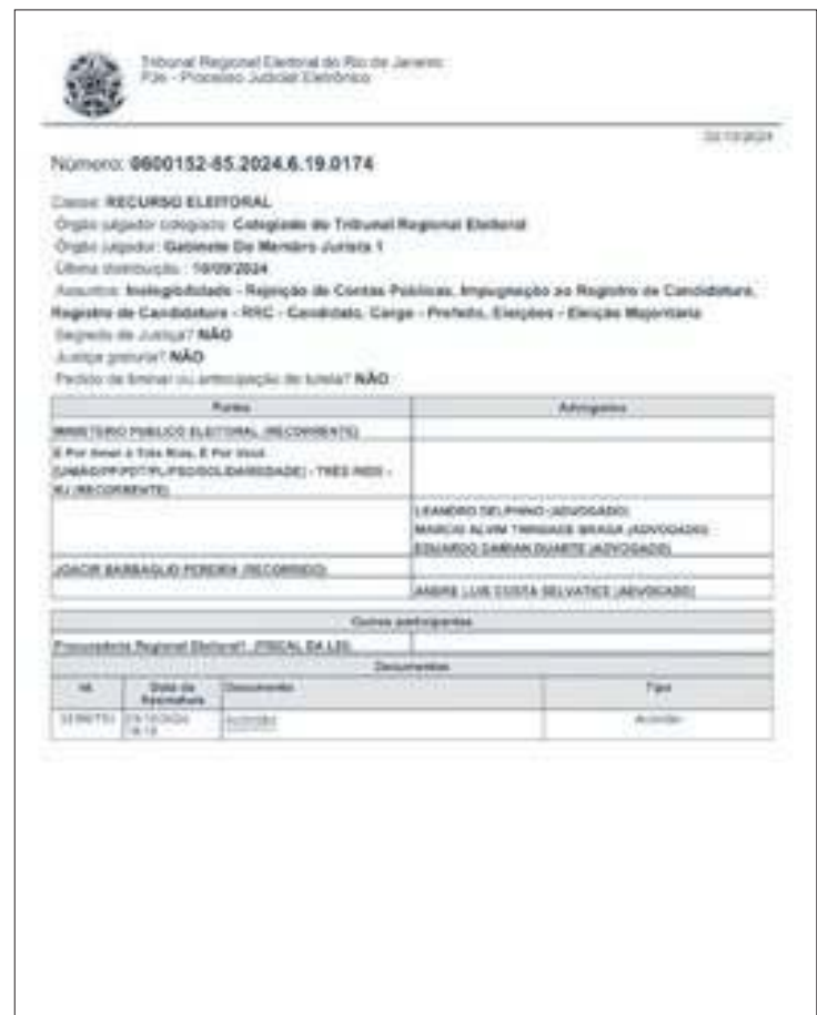
Reprodução do acórdão do TRE-RJ