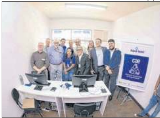
JUCERJA inaugura novo Centro do Empreendedor