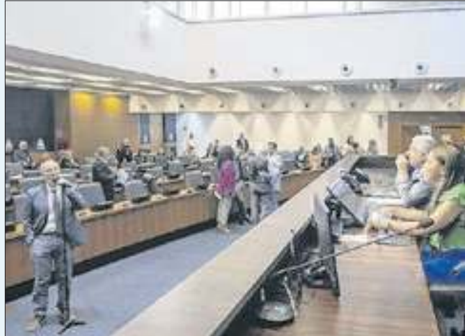
Plenário da Assembleia Legislativa do Rio