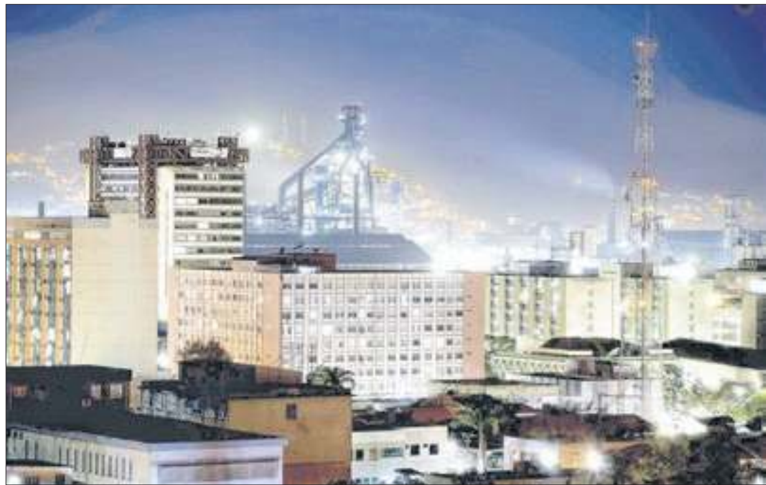
Volta Redonda possui o maior colégio eleitoral e é a única cidade que pode ter 2º turno