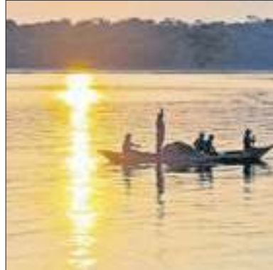
Cooperação em energia

Brasil e EUA discutem a cooperação em hubs de energia limpa, por meio de parcerias entre os governos e com participação do setor privado. Os centros de compartilhamento vão operar hidrogênio e os chamados CCUS (Carbon Capture, Utilization and Storage, ou captura, uso e armazenamento de carbono, em tradução livre).O tema foi discutido entre o ministro de Minas e Energia, Alexandre Silveira e a secretária de Energia dos EUA, Jennifer Granholm.