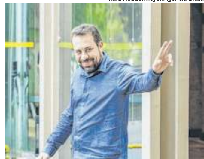
Candidato prefere enfrentar Marçal no segundo turno