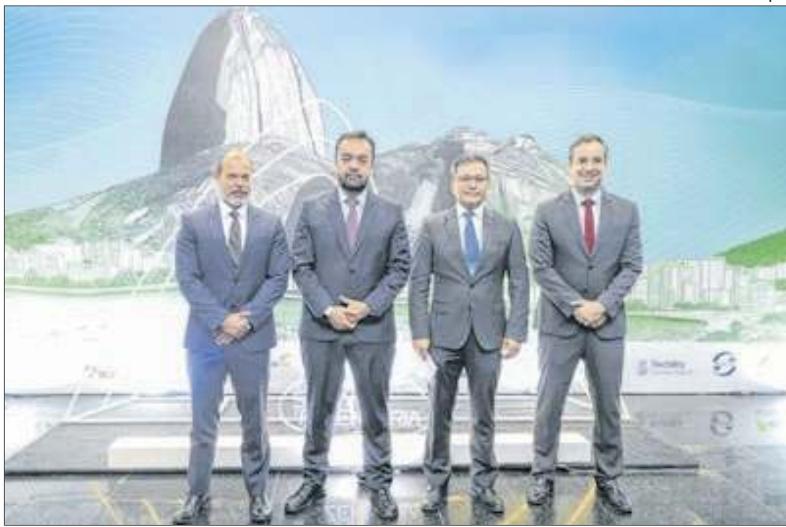
Governador Cláudio Castro participou do encerramento da Semana Fazendária 2024

vuna e Botafogo, e a transferência entre as linhas 1 e 2 poderá ser feita no trecho entre as estações Central do Brasil/Centro e Botafogo. Para oferecer mais comodidade e facilidade aos clientes, a concessionária vai disponibilizar trens extras e reforço no efetivo das equipes no domingo.