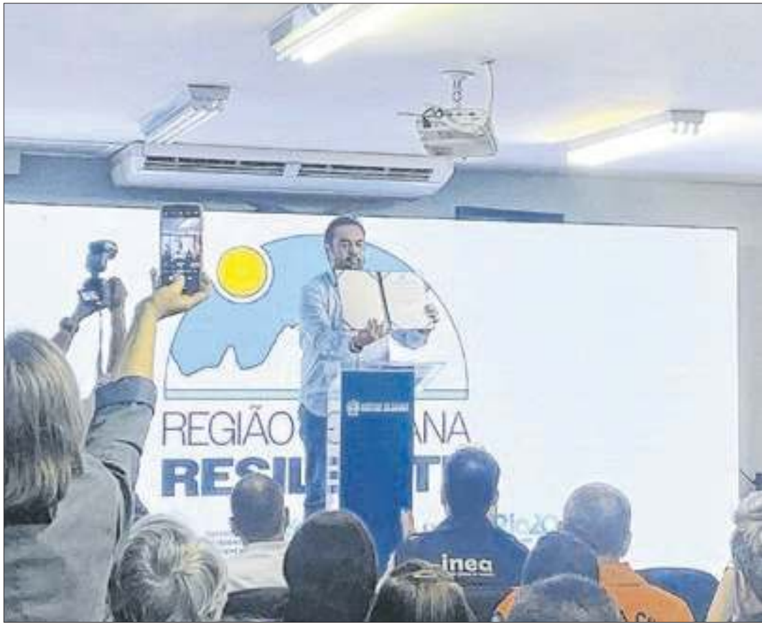
Governador Cláudio Castro esteve na cidade para anunciar a implantação do programa

"Esse é um programa que visa salvar vidas, salvar patrimônio, salvar aquilo que se perde quando você não tem um planejamento adequado na época de tragédia. A gente já viu que não adianta imaginar que não vai acontecer chuva aqui outra vez. Esse tipo de promessa à população já não acredita mais. O que nós precisamos aqui em Petrópolis é esse processo de resiliência. Fazer a contenção de