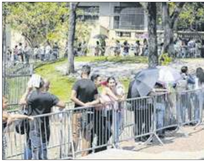
Após três altas seguidas, indicador de emprego recua