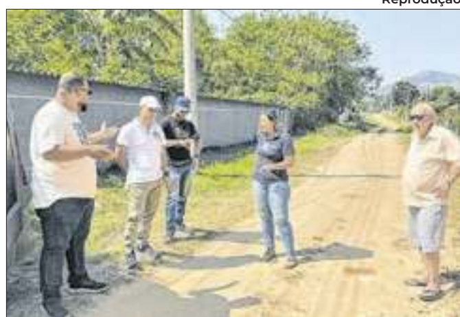
Candidata do NOVO esteve no bairro Ipiranga