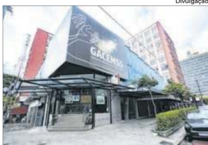
Entrada está aberta ao público e a agendamento de escolas