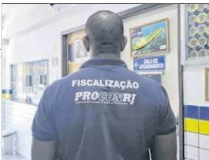
Operação do Procon-RJ autua 17 escolas