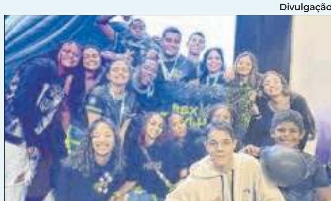
Alunos do Colégio Estadual Maria Justiniano Fernandes

documentos foram encaminhados à Superintendência Regional da PF no Rio de Janeiro, onde será instaurado inquérito para dar prosseguimento à investigação. O preso poderá responder por corrupção eleitoral e lavagem de dinheiro.