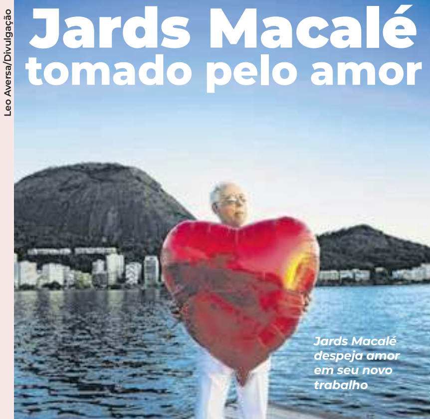
Jards Macalé despeja amor em seu novo trabalho

O cantor e compositor Jards Macalé volta ao palco do Tetro Rival Petrobras para apresentar neste sábado o repertório de 'Coração Bifurcado', álbum que saiu consagrado da cerimônia do Prêmio da Música Brasileira em junho