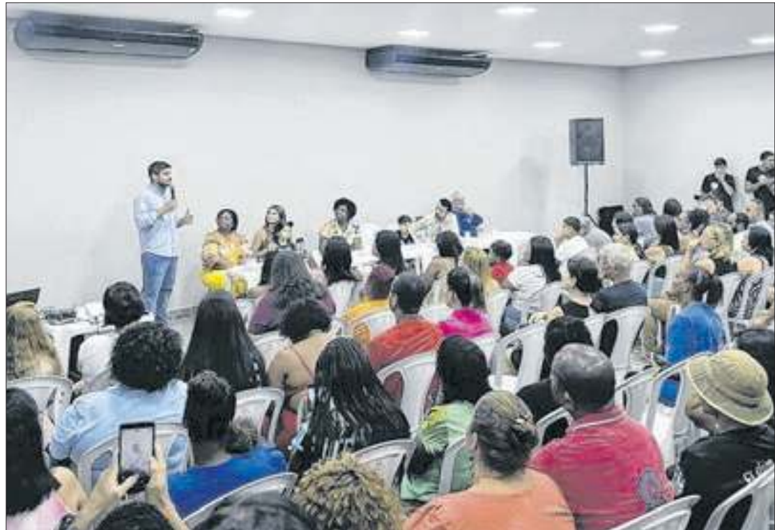
Encontro com lideranças evangélicas foi realizado na noite de quarta-feira (02)