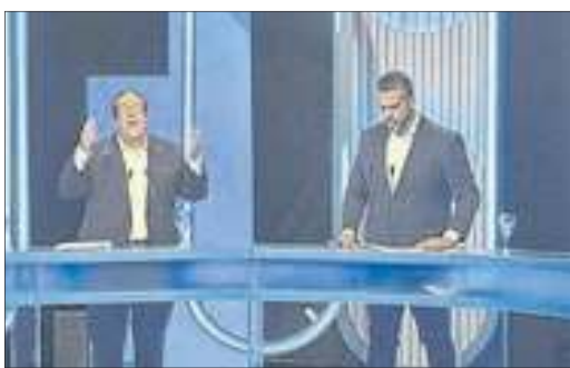
Do outro lado da bancada, os candidatos Tarcísio Motta e Rodrigo Amorim