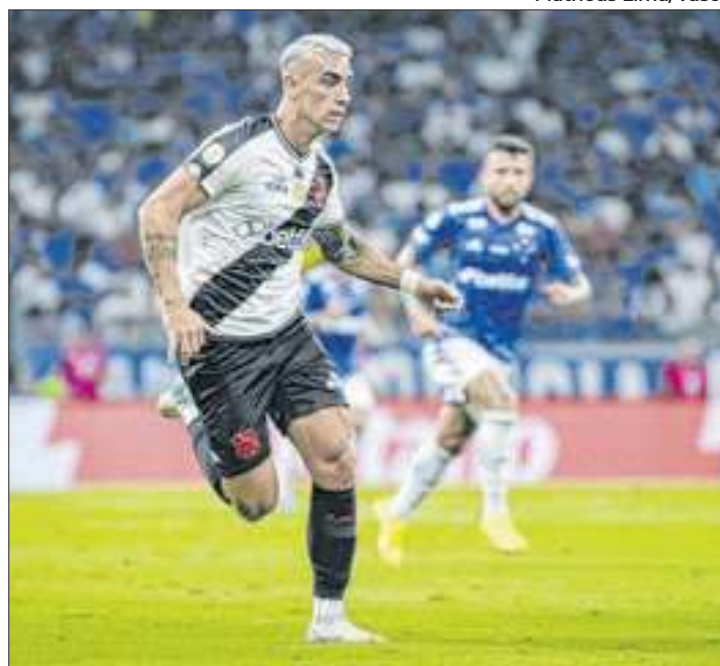
Brasileirão e Copa do Brasil são paixões nacionais

Times como Vasco, Flamengo e Botafogo sofreram no Brasileirão do início dos anos 2000, ainda acostumados ao formato 'varzeano' que perdurou no país em todo século XX.