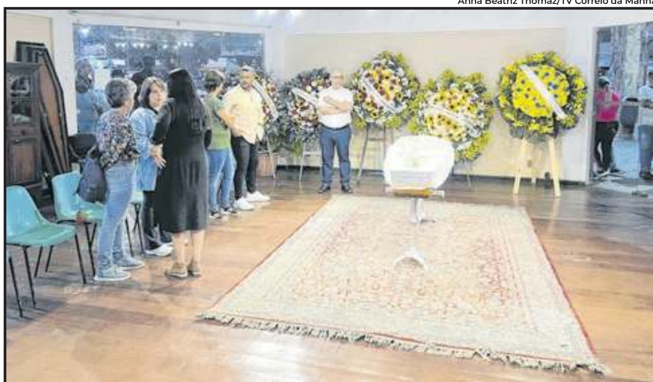
Primeiro velório do corpo do jornalista foi realizado em Petrópolis

Consagrado na televisão brasileira, Cid por dezenas de anos apresentou o Jornal Nacional e o Fantástico, da TV Globo. Atualmente, o jornalista mostrava sua vida através das redes sociais. Em um dos posts, o Cid brincalhão, com uma casca de Lima da Pérsia na boca