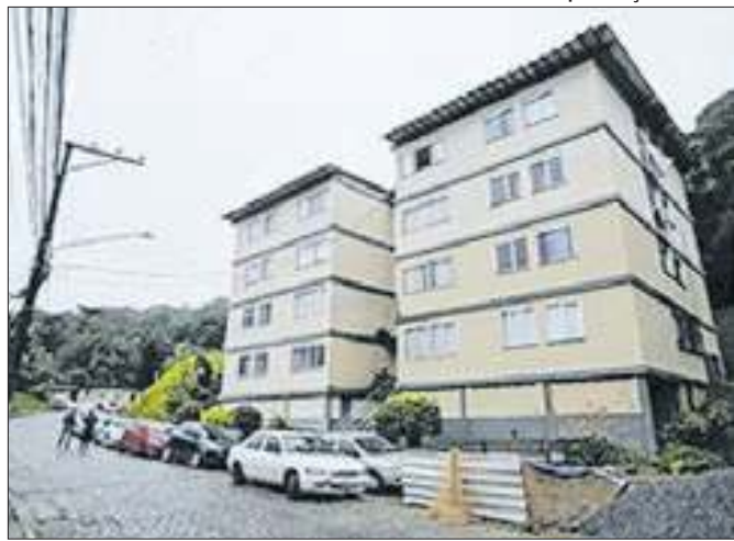
Condomínio possui 600 apartamentos