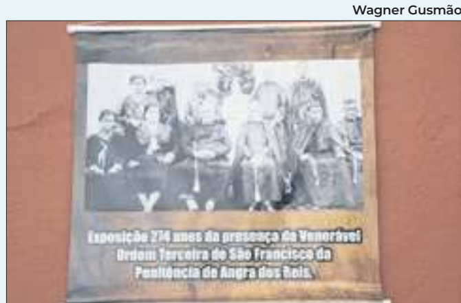
Mostra estará disponível até o dia 16 de outubro

outros DJs da cena local, como Harajuice, YGR, Dirty Death e Laco, além de um set do próprio aniversariante. O evento acontecerá no Jardim Colina, a partir das 18h, e será gratuito.