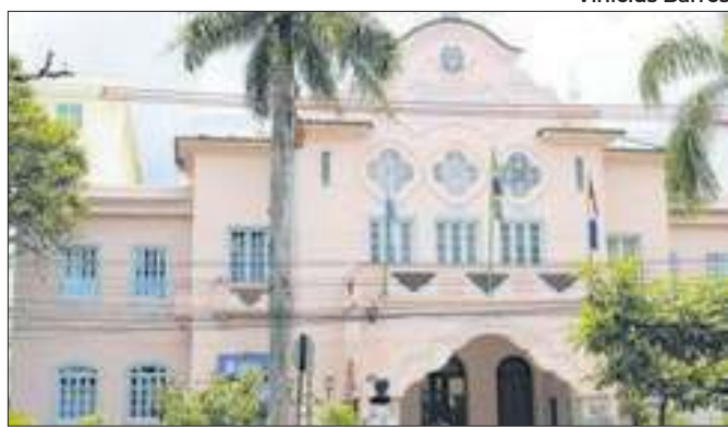
Unidade vai atender demandas dos produtores rurais