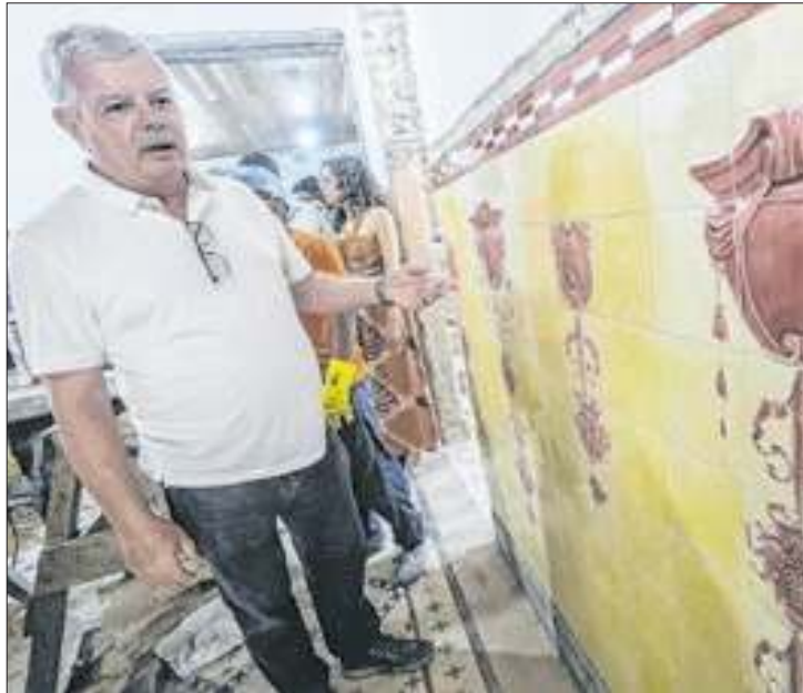
Prefeito Axel Graef durante a vistoria das obras