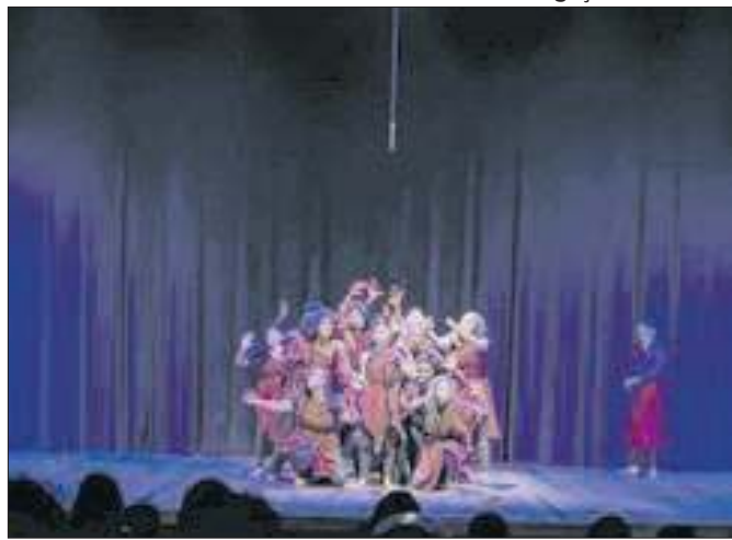
Apresentações de alunos do Ciep 413 Adão Pereira Nunes