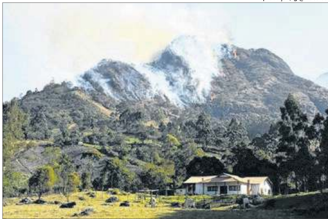
Parque Estadual Três Picos foi gravemente afetado pelos incêndios florestais

Cleitinho destaca que a legislação atual não trata de forma suficiente os crimes de poluição, especialmente em casos que envolvem a destruição de ecossistemas ou o uso de fogo. "O projeto de lei que apresentamos também comina penas mais duras para aqueles que cometem tais crimes,