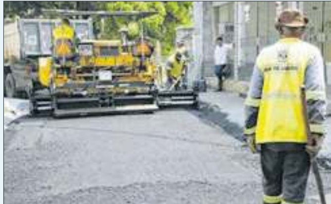
Serviço ocorrerá em 127 ruas, totalizando 63 km