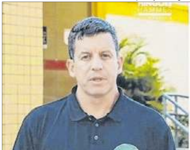
Candidato a prefeito de Petrópolis Hingo Hammes