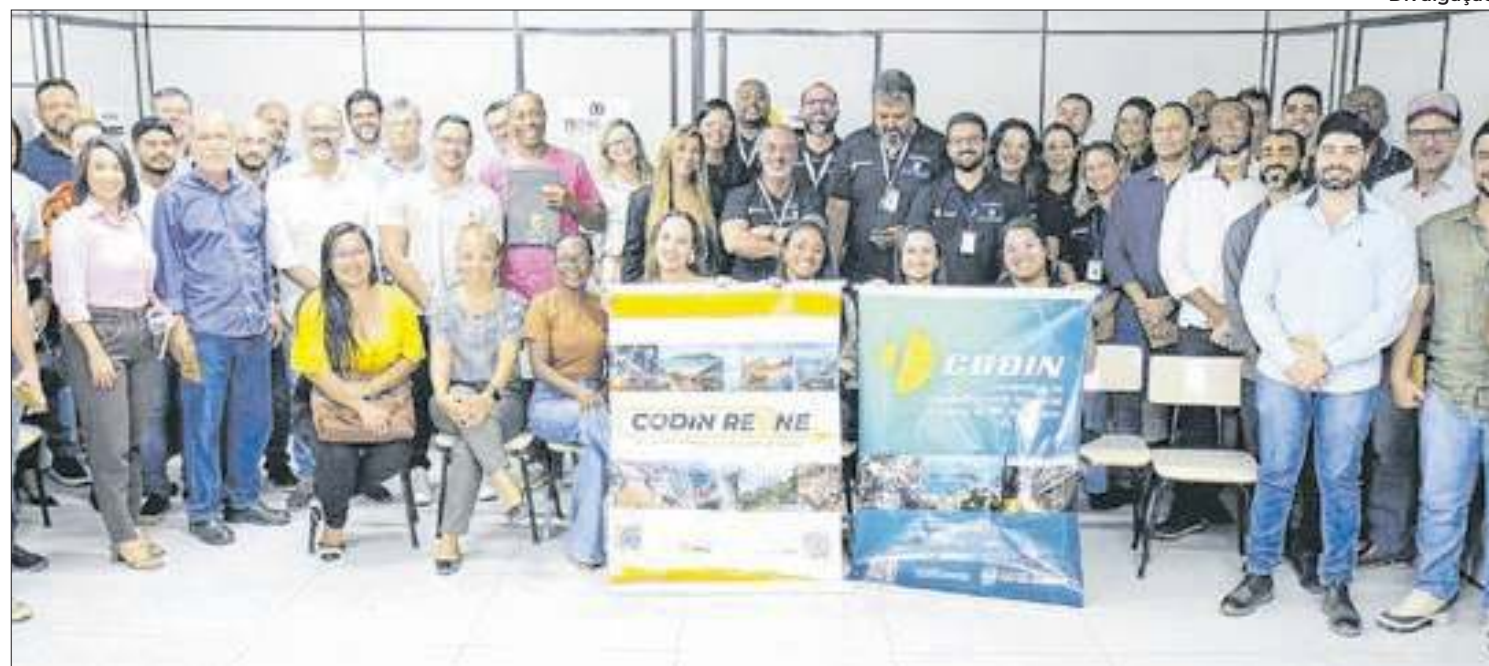
Evento foi Campos dos Goytacazes