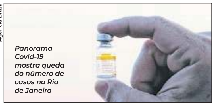
Panorama Covid-19 mostra queda do número de casos no Rio de Janeiro