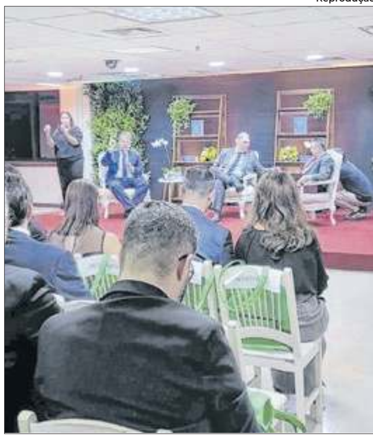
Evento teve a presença de muitos estudantes