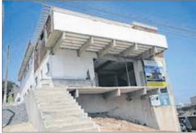
Construção está com as instalações elétricas adiantadas