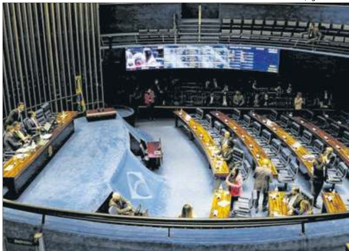
Senado mantém cronograma da reforma tributária

O PLP 68/2024 já recebeu mais de mil emendas ao chegar