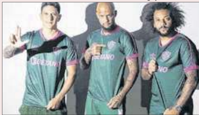
Maioria chegou às bets pelos times de futebol