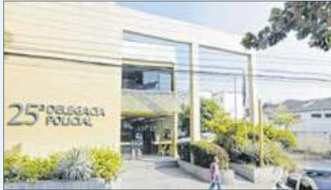
Ataque à bebe foi registrado na 25ª DP (Engenho Novo)