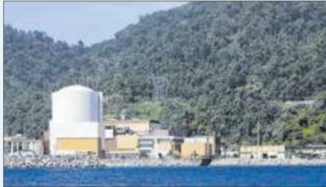
Evento não causou danos, nem prejuízo ao ambiente