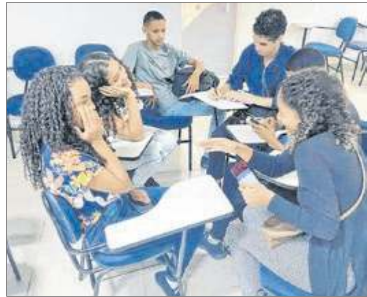
Evento terá cinco turmas em bairros distintos da cidade

Feira virtual - A Estácio está prestes a realizar um dos maiores eventos de empregabilidade do Brasil: a 8ª Edição da Feira Virtual de Estágios e Empre-