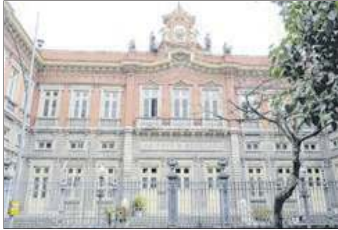
Colégio do Catete decidiu honrar seu aluno mais ilustre