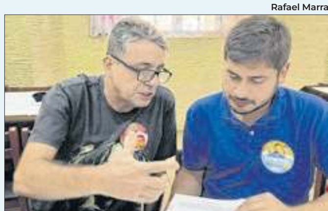
Candidato assinou carta-compromisso com instituto

mo bairro do município. A ação é executada pela Secretaria de Estado das Cidades. Os investimentos no local são de R$8.112.213,35. Na rua França Leite, os serviços vão passar por cerca de 434 metros da via. Já a estrada Elizeu de Alvarenga vai receber intervenções em 350 metros do local.