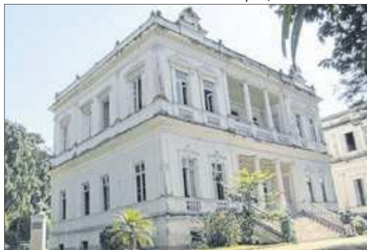
Escritório foi contratado com dispensa de licitação