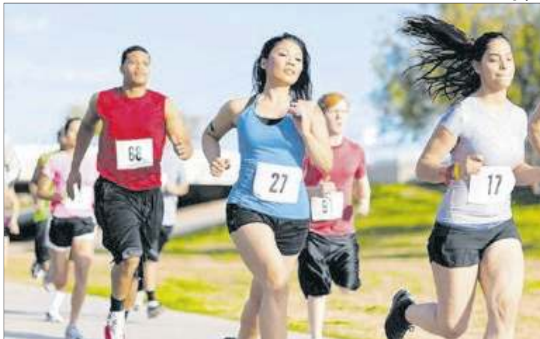
A 5ª edição da corrida de combate à doença será no dia 26

A corrida tem como objetivo principal conscientizar a população sobre a prevenção do acidente vascular cerebral. A inscrição vai até o dia 21 de outubro, com vagas limitadas, e oferece opções de kits básicos com camiseta, chip, número e medalha e também tem o kit participação sem a camiseta. O valor arrecadado é destinado à SNCRJ, instituição sem fins lucrativos que promove ações de conscientização de combate ao AVC e outras doenças. O evento também possui responsabi-