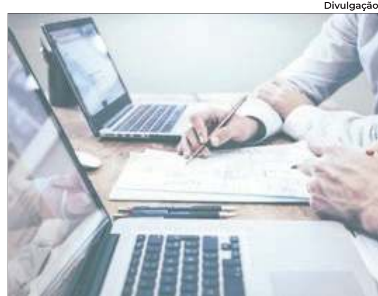
Estado registrou a abertura de 57.683 empresas neste ano