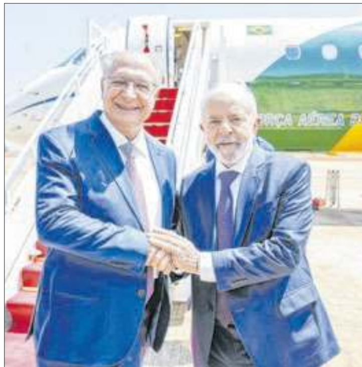
Lula na chegada em Brasília após o susto no México

Ao deixar o Aeroporto Internacional Felipe Ángeles, na Cidade do México, às 17h10 (horário de Brasília) nesta terça-feira (1º), o avião presidencial VC-1 apresentou um problema técnico após a decolagem e precisou ficar cerca de cinco horas sobrevoando em círculos para pousar com segurança no mesmo terminal. Isso porque o tanque precisava conseguir despejar combustível para ficar mais leve antes do