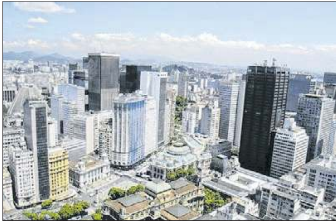
Pujança comercial do centro carioca está evidenciada por pesquisa

Tal tendência positiva também se verifica em outros indicadores do estudo, tanto no que toa à 'situação presente' quanto 'futura', com avanços, no comparativo mensal. Enquanto a situação presente cresceu de 96,6 pontos para 100 pontos (com destaque para o subitem negócio, com alta de 95,6 pontos para 99,8 pontos), a situação futura subiu de 125,6 pontos, em agosto, para 133,7 em setembro, como reflexo da crescente confiança dos empresários no futuro.