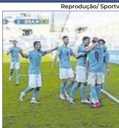
Israel pode sofrer sanção

Segundo o BBC Sport, a Associação Palestina de Futebol solicitou à FIFA, em março deste ano, que sancione a Federação de Futebol de Israel por conta das atrocidades que estão sendo cometidas na Faixa de Gaza. Agora, o Conselho da FIFA se reunirá nesta quinta (3) para debater o pedido palestino. Eles alegam que "toda a infraestrutura de futebol em Gaza foi destruída" pelos israelenses, o que contraria o regulamento e ideais da FIFA.