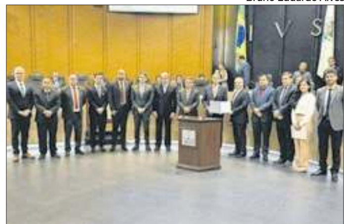
Documento foi assinado na sede do TJRJ