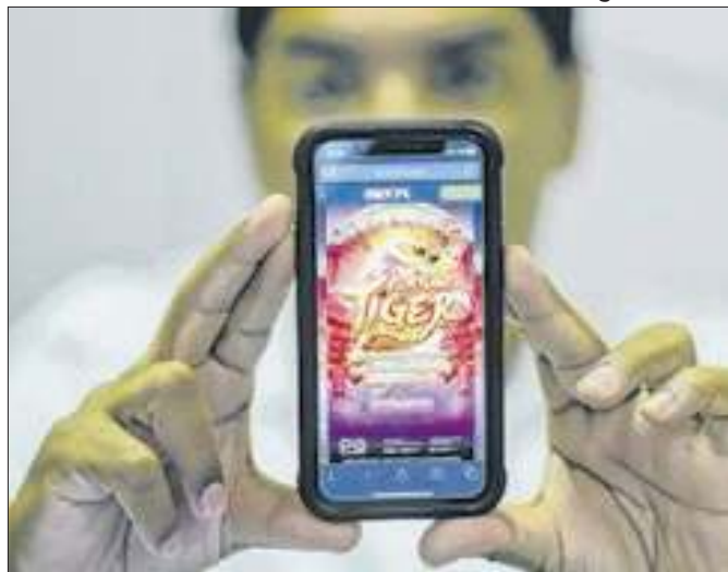
Brasileiros e bets: viciados e endividados