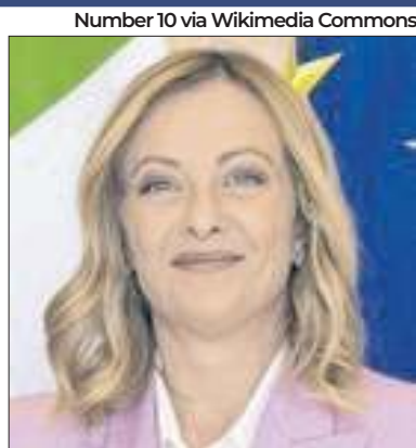
Meloni convocou reunião do G7

Giorgia Meloni, primeira-ministra da Itália e presidente temporária do G7, convocou o grupo de líderes de Estados Unidos, Canadá, Reino Unido, França, Alemanha e Japão para debaterem medidas de conciliação sobre a crise que se desenrola no Oriente Médio. Ela afirmou que a Itália não abrirá mão de uma alternativa de resolução por meios diplomáticos. A ideia é estabilizar a crise na fronteira entre Israel e Líbano, que vem sendo palco do confronto.