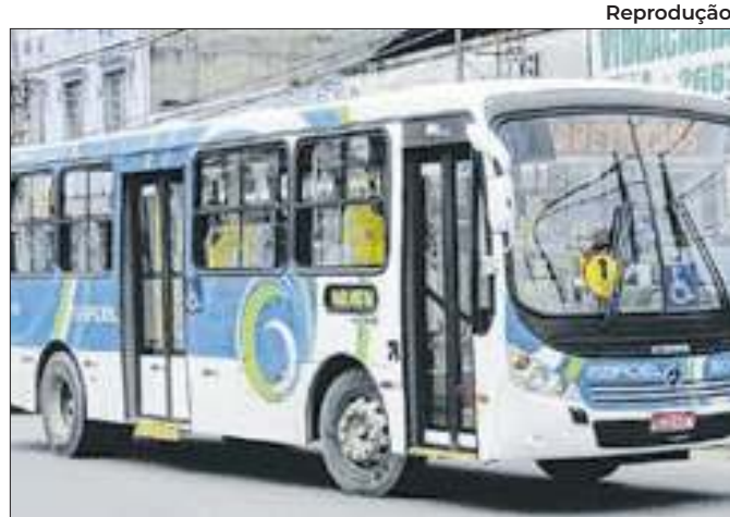
Ônibus vão circular gratuitamente na eleição