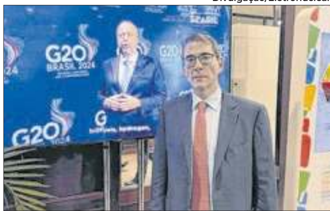
O evento discutiu sobre o futuro energético no mundo