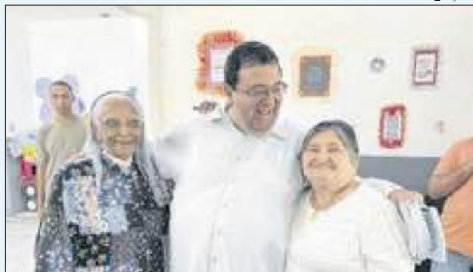
Deputado aproveitou data para reforçar campanha