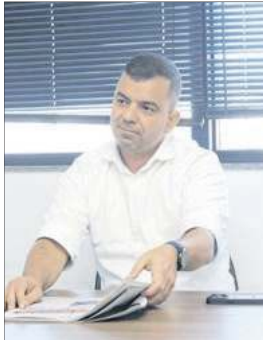
Furlani é candidato a prefeito de B. Mansa