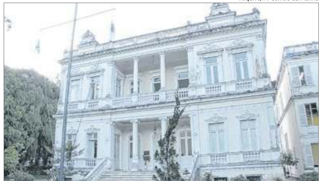
Aumento da dívida municipal preocupa vereadores para a próxima gestão

De acordo com os documentos apresentados, o caixa da Prefeitura registrou queda de cerca