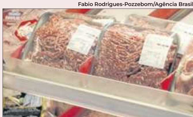
Carne na cesta básica já fez subir alíquota

Uma das principais discussões é sobre como ficará o Simples. Como os novos impostos são da valor agregado, pagos no destino, poderá haver risco para o atual sistema simplificado. “Pode ter prejuízo para o Simples. Não podemos deixar isso”, disse Izalci.