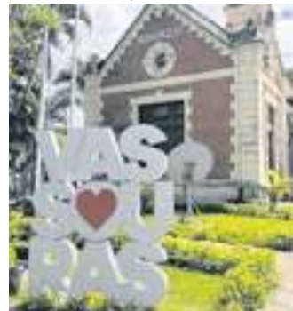
Centro de Vassouras