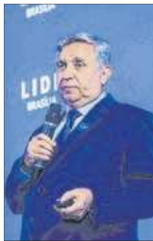
O senador Izalci Lucas enquanto apresentava os principais pontos da Tributária em discussão no Senado