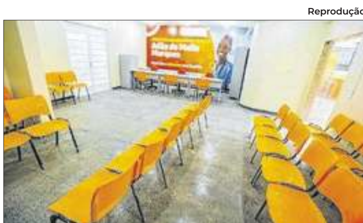
Unidade de Saúde da Família (USF) Adão de Mello Marques, no Apolo XI