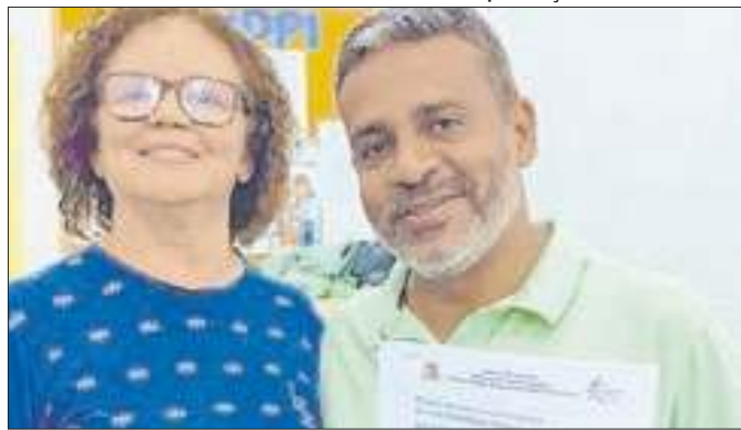
Centro visa o acolhimento da pessoa idosa