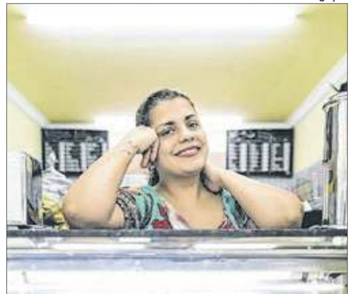
Senac realiza o evento "Do Sonho ao Negócio"