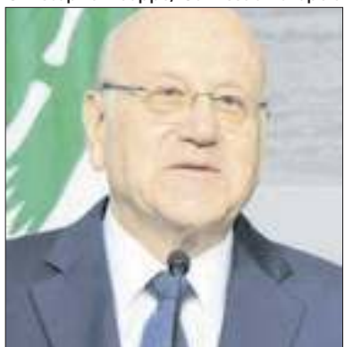
Najib Mikati pediu ajuda à ONU