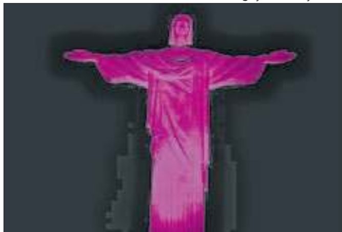
Redentor 'rosa' visa chamar a atenção para a enfermidade