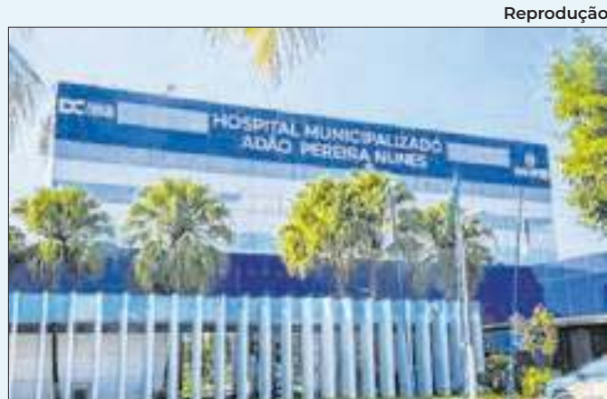
Hospital Municipalizado Adão Pereira Nunes, em Caxias

hidrômetro de grande porte. Para realizar os serviços, será preciso retirar a unidade de operação, interrompendo a produção de água. O abastecimento será retomado assim que as intervenções forem concluídas. A concessionária Águas do Rio, responsável pela distribuição, já foi comunicada.