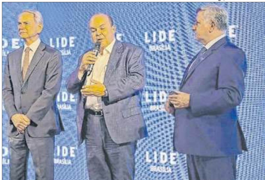
Governador do DF, Ibaneis alertou para risco de queda na renda e consumo

Muito provavelmente, Eduardo Braga, diante do que receberá, fará alterações no projeto que foi aprovado no primeiro semestre na Câmara dos Deputados. Havendo alterações, o projeto terá que voltar para nova