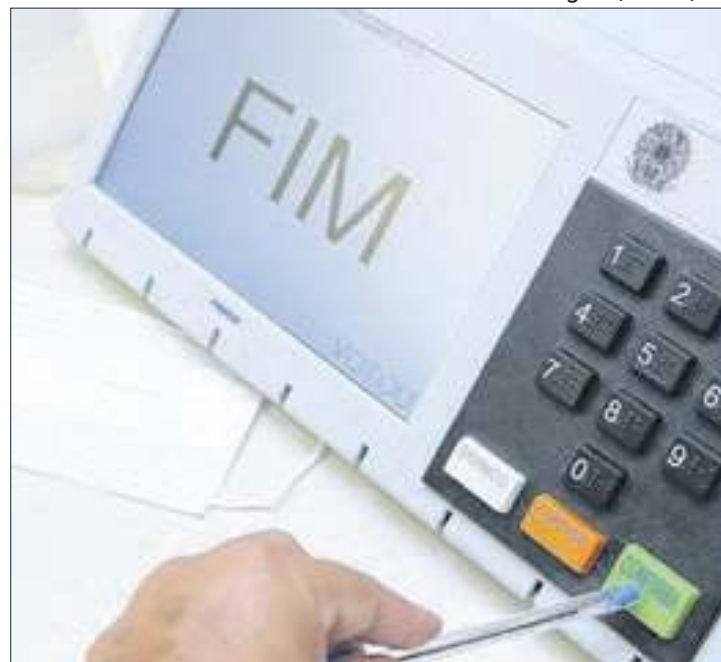
Eleitores vão escolher prefeito e vereadores no domingo

Este ano, o voto é direcionado para a escolha de candidatos a prefeito, vice e vereadores municipais. O ato é obrigatório para mulheres e homens, com idades entre 18 e 70 anos, e facultativo para jovens de 16 e 17 anos e idosos com mais de 70 anos. Ou seja, no dia 6 de outubro, o grupo especificado deve comparecer a uma zona eleitoral, das 8h às 17h, para exercer a ação. Caso o indivíduo não consiga comparecer no dia oficial do pleito, o mesmo terá um prazo de 60 dias para justificar a ausência à Justiça Eleitoral, se não for justificada a pessoa pode adquirir multas, que se não quitadas levam o título à irregularidade.