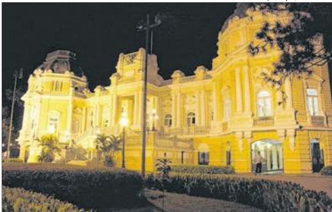
Palácio Guanabara, sede oficial do governo do estado do Rio de Janeiro

nove emendas, a proposta terá de ser avaliada novamente em comissões para votação em plenário. O projeto obriga as empresas de aplicativos de entrega a instalarem pontos de apoio aos entregadores em locais de alta demanda de pedidos, com infraestrutura adequada.