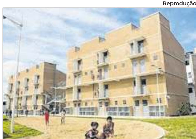
Unidades serão nos bairros Santa Amélia e Mucajá