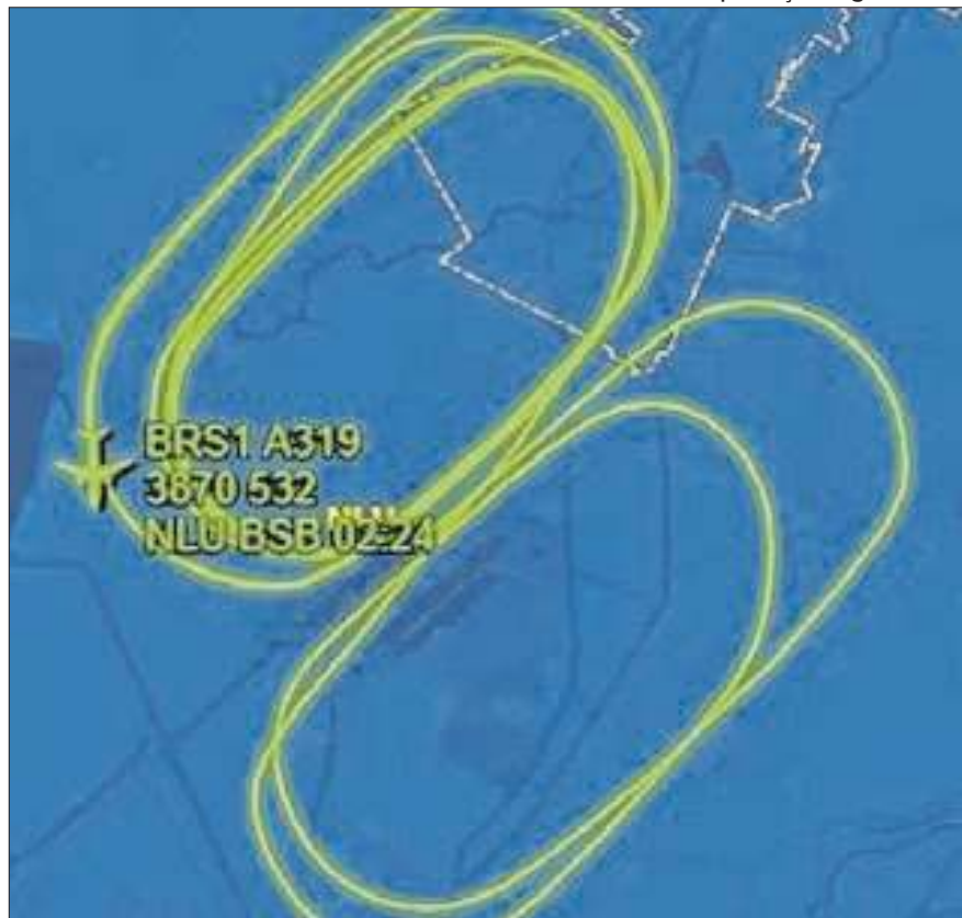
Avião presidencial pousou por volta das 22h19 desta terça-feira

Segundo as informações da Força Aérea Brasileira (FAB), o avião presidencial VC-1 apresentou um problema técnico após a decolagem, na tarde desta terça-feira (1º), e teve de passar por cerca de 5h voando em círculos para despejar combustível, a uma altitude média de cerca de 3,8 mil metros do solo, de acordo com dados da plataforma FlightAware, que mostra informações sobre tráfego aéreo em tempo real. Por volta das 22h19, a aeronave pousou, segundo a plataforma. Na imagem ao lado, uma reprodução em tempo da real da empresa mostrou a rota feita pelo piloto durante o período em que precisava permanecer no ar,