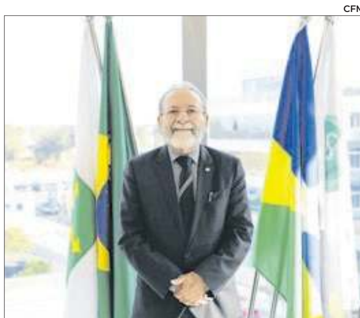
José Hiran Gallo segue à frente do CFM até 2029

“Honrarei os médicos brasileiros, assim como os médicos brasileiros honraram o processo eleitoral, amplamente democrático. Todos aqui foram eleitos pelos seus pares. Todos, sem exceção. E trabalharemos em prol da medicina brasileira”, disse ele, após o anúncio do resultado.