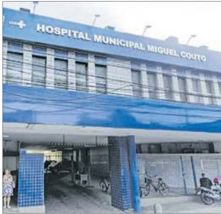
Envenenamento torpe de dois meninos ainda é enigma