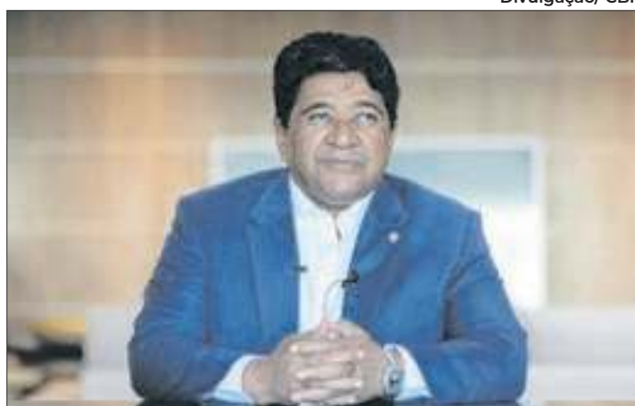
Ednaldo Rodrigues faz gestão turbulenta na CBF