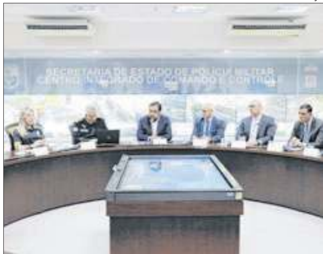
Castro autoriza a convocação de novos policiais