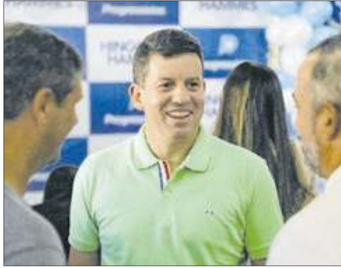
Vídeo publicado distorcia fala do candidato