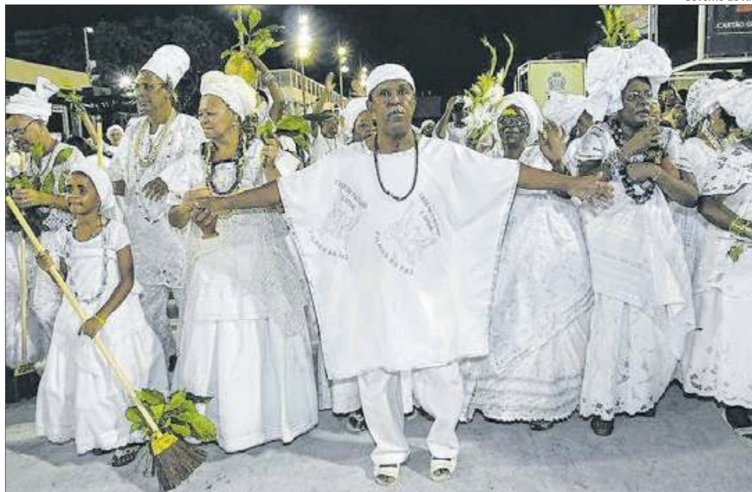
Governo do Rio

Serão quatro editais com mais de 600 vagas para manifestações culturais em todo o estado