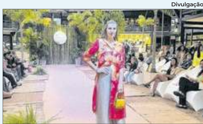
Desfile das treze lojas aconteceu no fim de semana