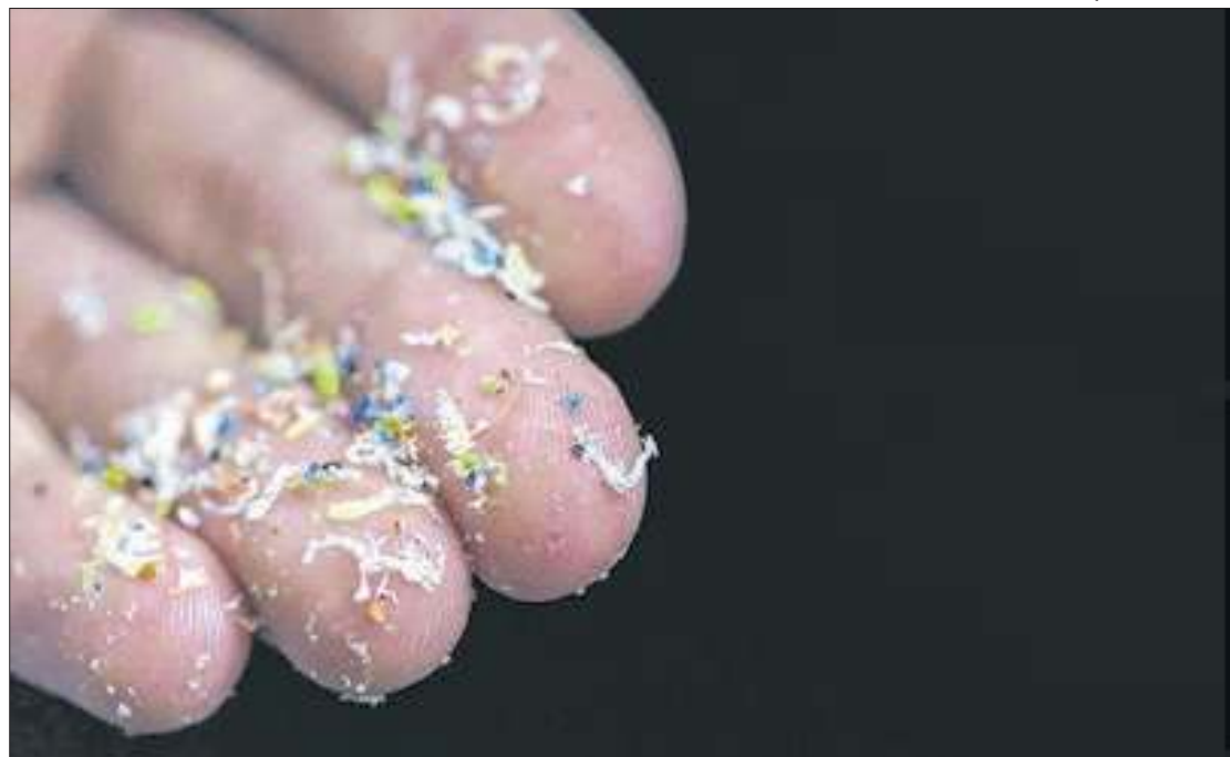
Repleta de microplásticos, endereço turístico não resistiu ao descaso público

Para chegar aos resultados, os pesquisadores fizeram uma coleta em 12 quadrados de 0,25 m 2 , espalhados pelas respectivas áreas de estudo, mediante o uso de peneiras de malhas específicas e água. Em seguida, já em laboratórios, os resíduos de microplásticos foram organiza-