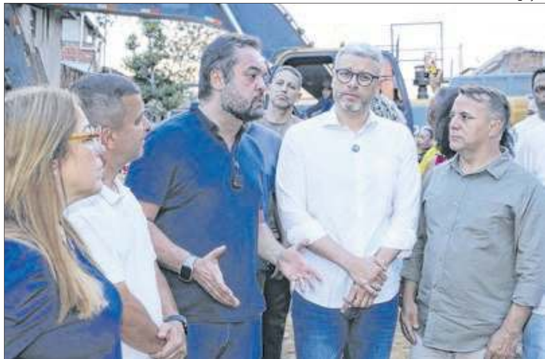
Em Barra Mansa, governador afirma que parceria entre Furlani e Drable é certa

- Resende recebeu investimentos e melhorias fundamentais para seu desenvolvimento, graças à parceria com o Governo do Estado, nos últimos 8 anos. Isto foi possível e seguirá