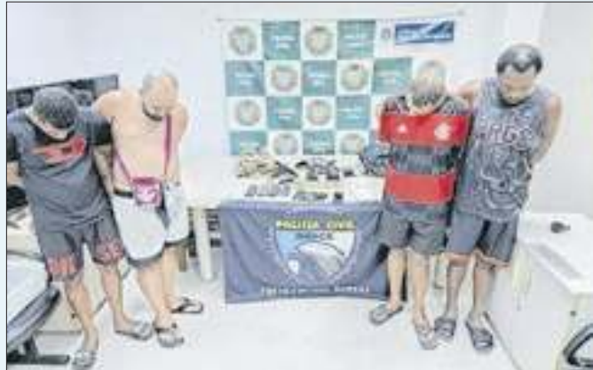
Quadrilha do 'Zinho' é presa pela Polícia Civil na Zona Oeste