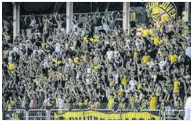
Torcida do Voltaço vibra com vitória do time