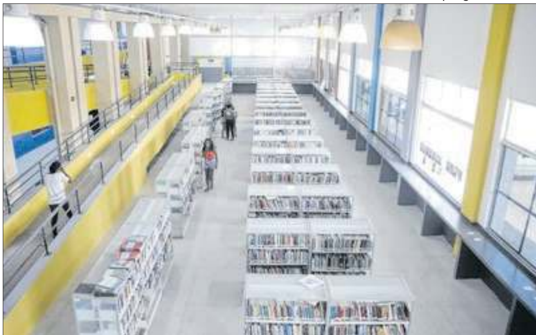
Biblioteca Parque de Manguinhos será entregue na segunda quinzena de outubro

Importante instrumento de transformação dentro de sua comunidade, a Biblioteca Parque de Manguinhos (BPM) passou por reforma nos últimos meses. À primeira vista, as mudanças podem parecer apenas estruturais, mas o impacto que o equipamento cultural exerce sobre as mais de duas mil pessoas que frequentam o espaço mensalmente é ainda maior. As melhorias foram realizadas através de uma parceria entre a