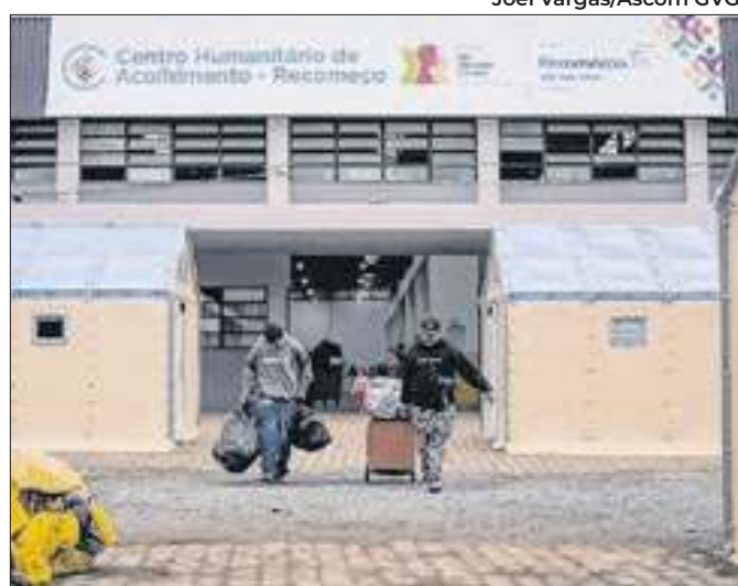
Centros são solução transitória para desabrigados