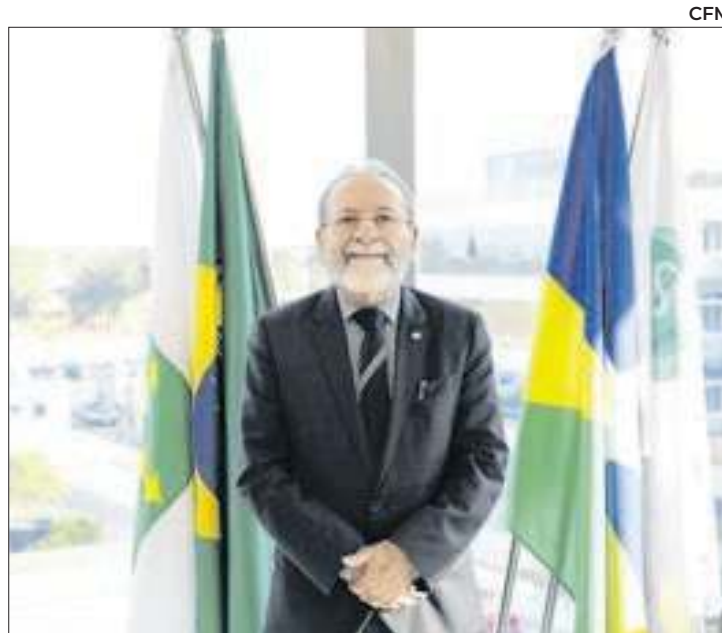
José Hiran Gallo segue à frente do CFM até 2029

"Honrarei os médicos brasileiros, assim como os médicos brasileiros honraram o processo eleitoral, amplamente democrático. Todos aqui foram eleitos pelos seus pares. Todos, sem exceção. E trabalharemos em prol da medicina brasileira", disse ele, após o anúncio do resultado.