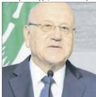
Najib Mikati pediu ajuda à ONU