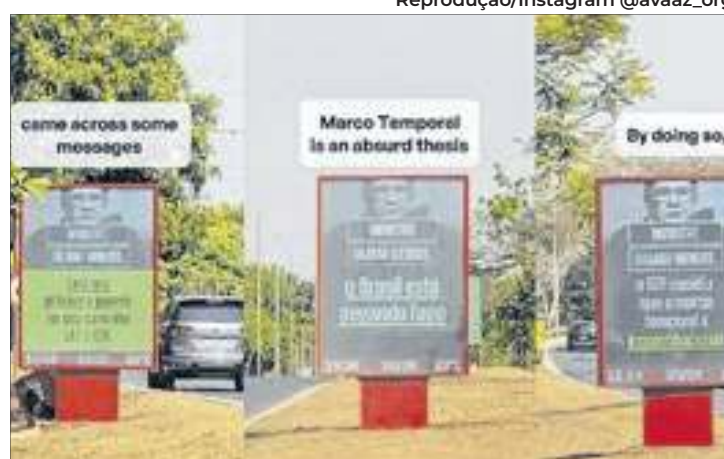
A Avaaz.Org utilizou os painéis de LED do "Metrópoles" para mandar "recadinhos" ao ministro Gilmar Mendes