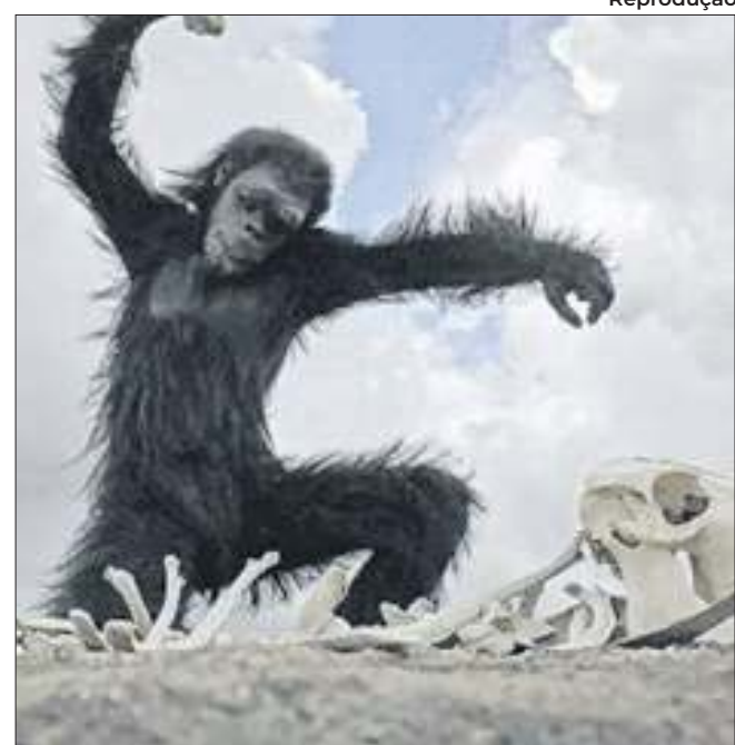
Cena do filme “2001, uma odisseia no espaço”