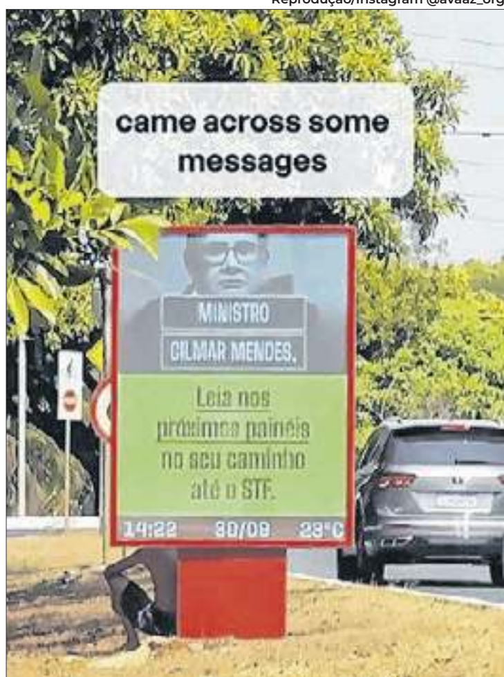
As mensagens foram sequenciais e exibidas ao longo do trajeto do ministro, de casa ao trabalho

A campanha de pressão política feita com os totens foi reproduzida no Instagram da Avaaz.Org, com direito a um vídeo percorrendo o hipotético caminho do ministro, de casa até o Supremo. Nele, uma narradora afirma o seguinte: "O ministro encontrou hoje um recadinho,