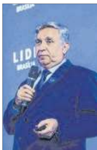
O senador Izalci Lucas enquanto apresentava os principais pontos da Tributária em discussão no Senado