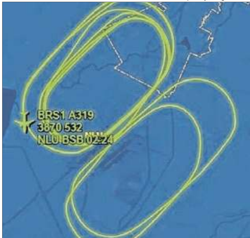
Avião presidencial pousou por volta das 22h19 desta terça-feira

Segundo as informações da Força Aérea Brasileira (FAB), o avião presidencial VC-1 apresentou um problema técnico após a decolagem, na tarde desta terça-feira (1º), e teve de passar por cerca de 5h voando em círculos para despejar combustível, a uma altitude média de cerca de 3,8 mil metros do solo, de acordo com dados da plataforma FlightAware, que mostra informações sobre tráfego aéreo em tempo real. Por volta das 22h19, a aeronave pousou, segundo a plataforma. Na imagem ao lado, uma reprodução em tempo da real da empresa mostrou a rota feita pelo piloto durante o período em que precisava permanecer no ar,