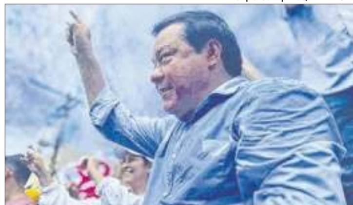
Ex-prefeito tenta concorrer apesar de condenação