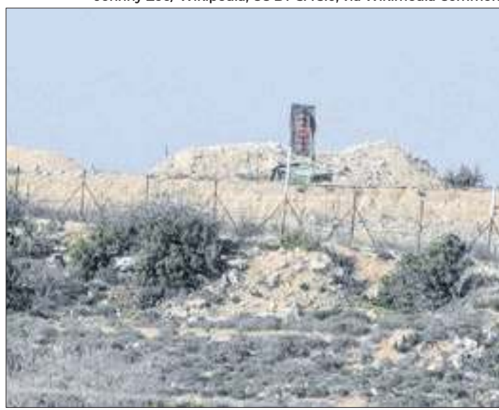
População do Líbano está evacuando o país às pressas