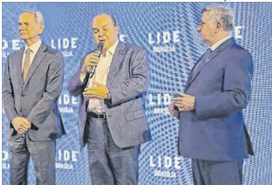
Governador do DF, Ibaneis alertou para risco de queda na renda e consumo

Muito provavelmente, Eduardo Braga, diante do que receberá, fará alterações no projeto que foi aprovado no primeiro semestre na Câmara dos Deputados. Havendo alterações, o projeto terá que voltar para nova