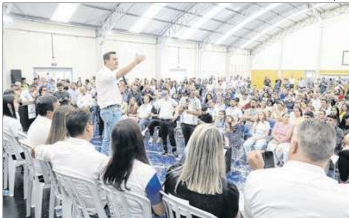
Nova escola vai ofertar ensino integral e Educação de Jovens e Adultos para 240 alunos

"O Paraná hoje é referência em educação pública. Somos primeiro lugar no Ideb, estamos avançando com a contratação de mais 1.100 professores, totalizando 3.500 novos professores que estão entrando para a rede estadual e, automa-