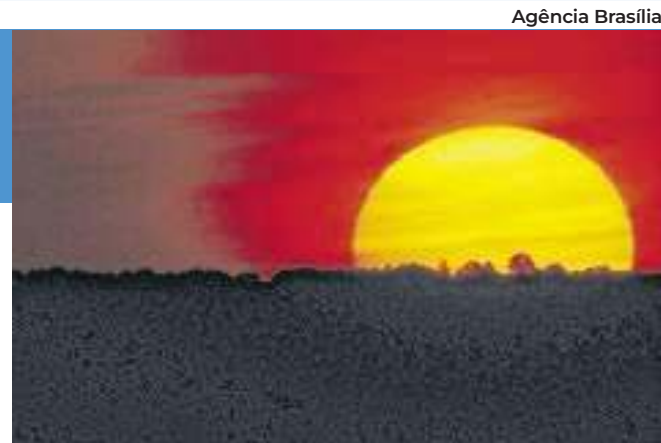
O pôr-do-sol alaranjado é uma das características do inverno, no Distrito Federal

Segundo apurou "Brasilianas", o plano da Metrôpoles Mídia Digital Ltda. – braço do Grupo Metrôpoles que instala os totens pela cidade desde o ano passado –, era chegar ao