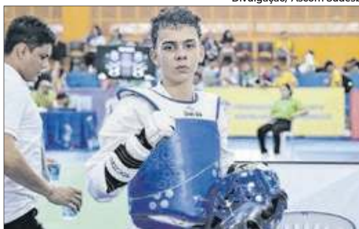
Judô e taekwondo também conquistaram o bronze