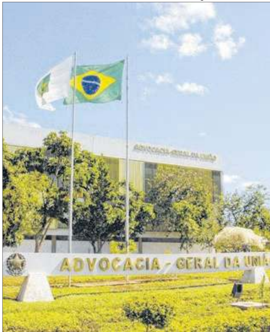
Uma das sedes da Advocacia-Geral da União está próxima da área

Risco de tragédia vaza na Imprensa Nacional e pode atingir os arredores do Setor de Indústria Gráfica