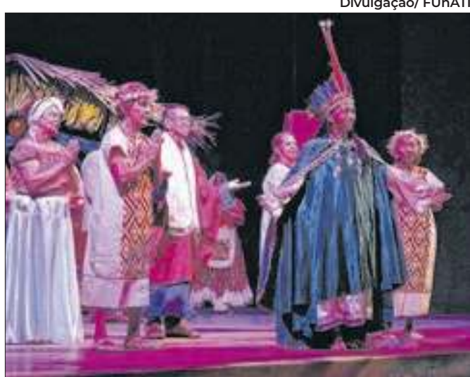
Apresentação destaca histórias e cultura ribeirinha