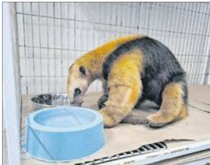
Tamanduá foi atendido e tratado em Ribeirão Preto