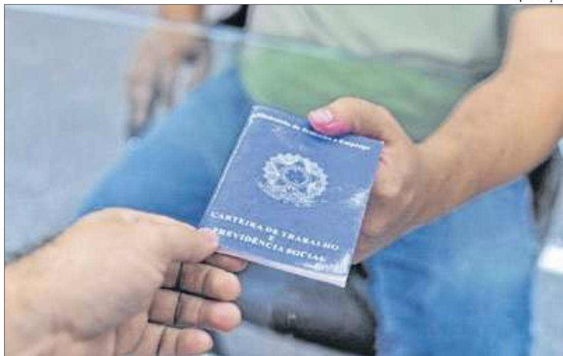
Pernambuco tem maior geração de empregos do Nordeste e terceira maior do Brasil

Os números refletem o fortalecimento da economia local