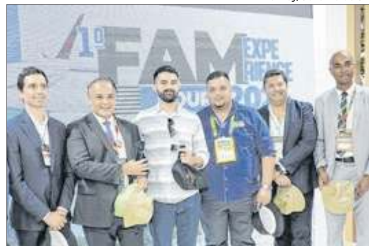
São Paulo aposta no turismo