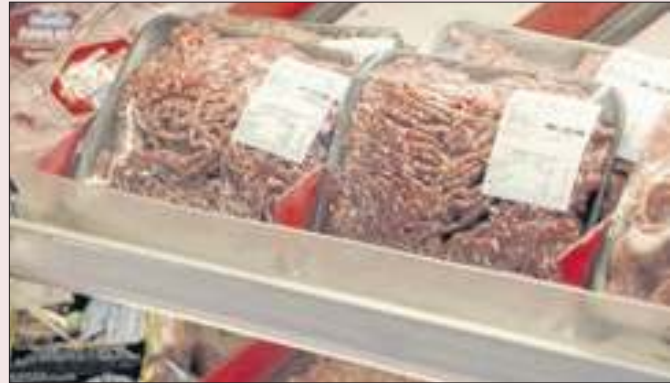
Carne na cesta básica já fez subir alíquota