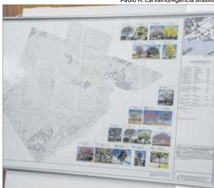
Plano com as árvores que serão plantadas

O presidente do STF, Luís Roberto Barroso, na reunião de acordo, que aconteceu em 25 de setembro, destacou a importância de arborizações pensan-