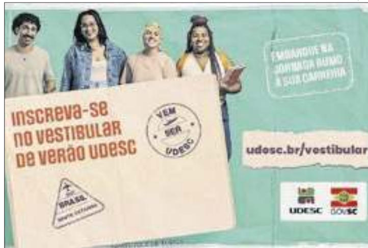
Universidade oferece 1.755 vagas para 2025

A Universidade do Estado de Santa Catarina (Udesc) iniciou, na terça, às inscrições para o Vestibular de Verão 2025. Ao todo, a universidade oferece 1.755 vagas para ingresso no primeiro semestre do próximo ano, em 50 cursos de graduação presenciais e quatro cursos a distância.