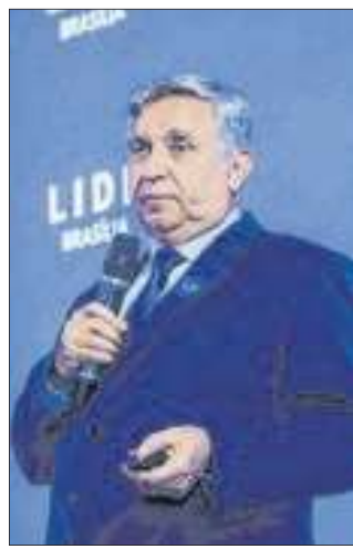
O senador Izalci Lucas enquanto apresentava os principais pontos da Tributária em discussão no Senado