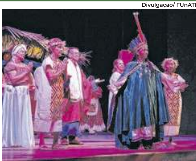
Apresentação destaca histórias e cultura ribeirinha