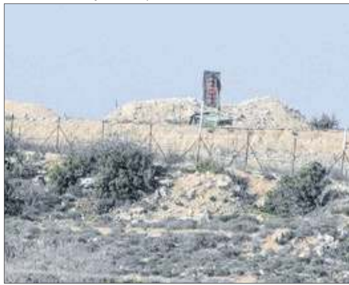
População do Líbano está evacuando o país às pressas