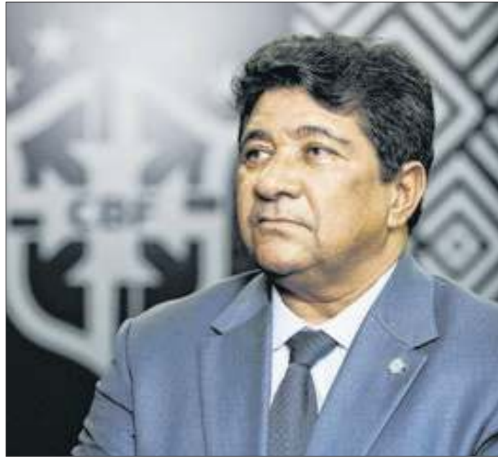
Ednaldo Rodrigues conduziu o caso de forma catastrófica

O problema é que essa mudança de jogos afeta diretamente o calendário do Corinthians, que está na Zona de Rebaixa-