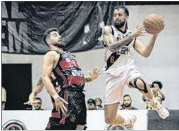
Infraero é a nova parceira do Novo Basquete Brasil Caixa

Liga Nacional de Basquete e Infraero estão juntas novamente. A Empresa Brasileira de Infraestrutura Aeroportuária será parceira oficial do NBB CAIXA 2024/25, que começa no dia 12 de outubro, com o Clássico dos Milhões entre R10 Score Vasco da Gama e Flamengo, no Tijuca Tênis Clube.