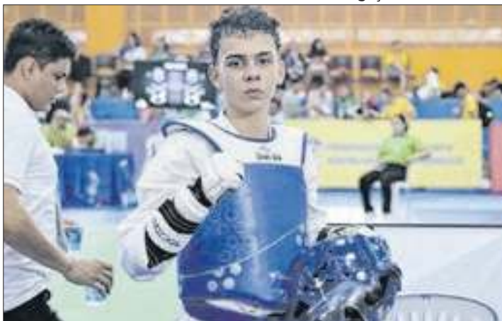
Judô e taekwondo também conquistaram o bronze