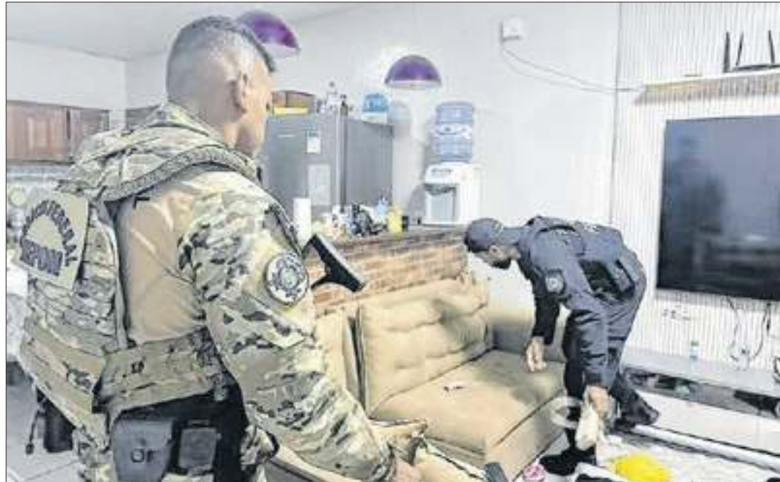
O prefeito da cidade foi afastado do cargo por decisão do TRE-AP.

Na ocasião, foram apreendidos R$ 99,8 mil, que a polícia acredita serem destinados à compra de votos. As investigações estão sendo conduzi-