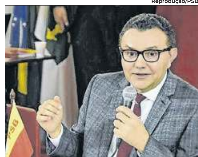
Siqueira afirma que proposta é inaceitável