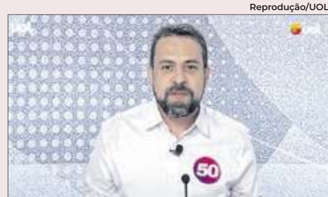
Guilherme Boulos busca eleitores da adversária

O dirigente prevê que o PSB conquistará, “por baixo”, entre 230 e 250 prefeituras (em 2020, foi vitorioso em 252 cidades). “Muita gente diz que vamos ganhar mais prefeituras”, ressaltou. Em Recife, o candidato do PSB à reeleição, João Campos, tem 75% na Quaest.