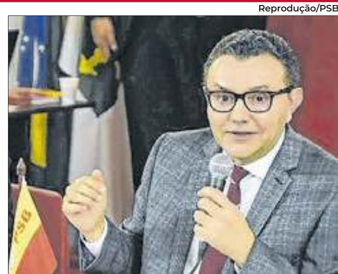
Siqueira afirma que proposta é inaceitável