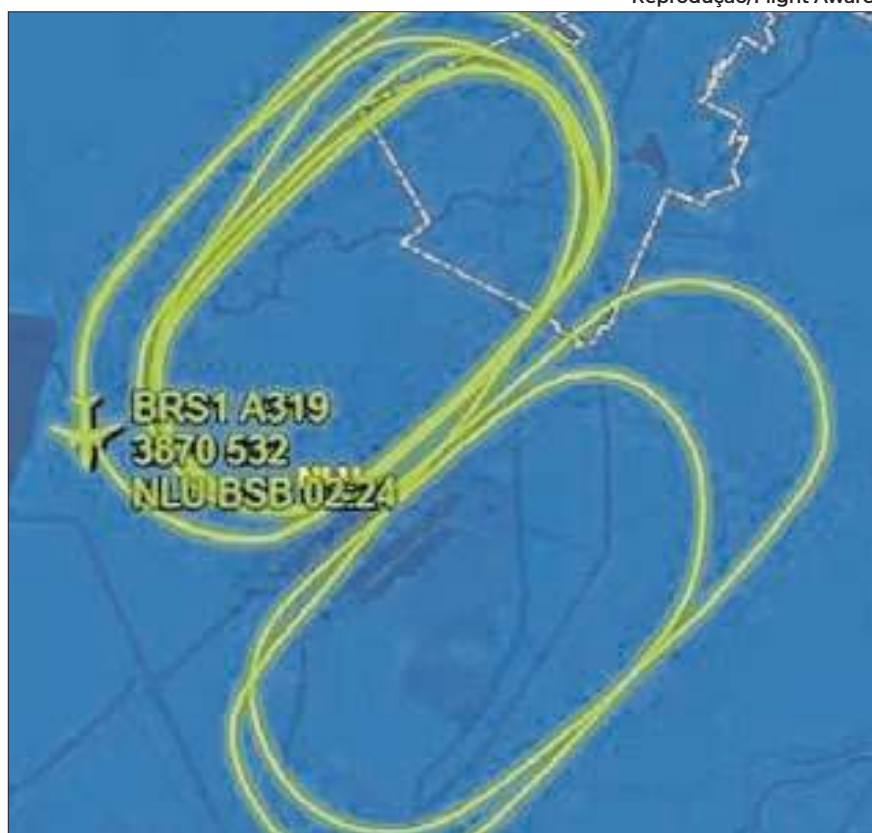
Avião presidencial pousou por volta das 22h19 desta terça-feira

Segundo as informações da Força Aérea Brasileira (FAB), o avião presidencial VC-1 apresentou um problema técnico após a decolagem, na tarde desta terça-feira (1º), e teve de passar por cerca de 5h voando em círculos para despejar combustível, a uma altitude média de cerca de 3,8 mil metros do solo, de acordo com dados da plataforma FlightAware, que mostra informações sobre tráfego aéreo em tempo real. Por volta das 22h19, a aeronave pousou, segundo a plataforma. Na imagem ao lado, uma reprodução em tempo da real da empresa mostrou a rota feita pelo piloto durante o período em que precisava permanecer no ar,