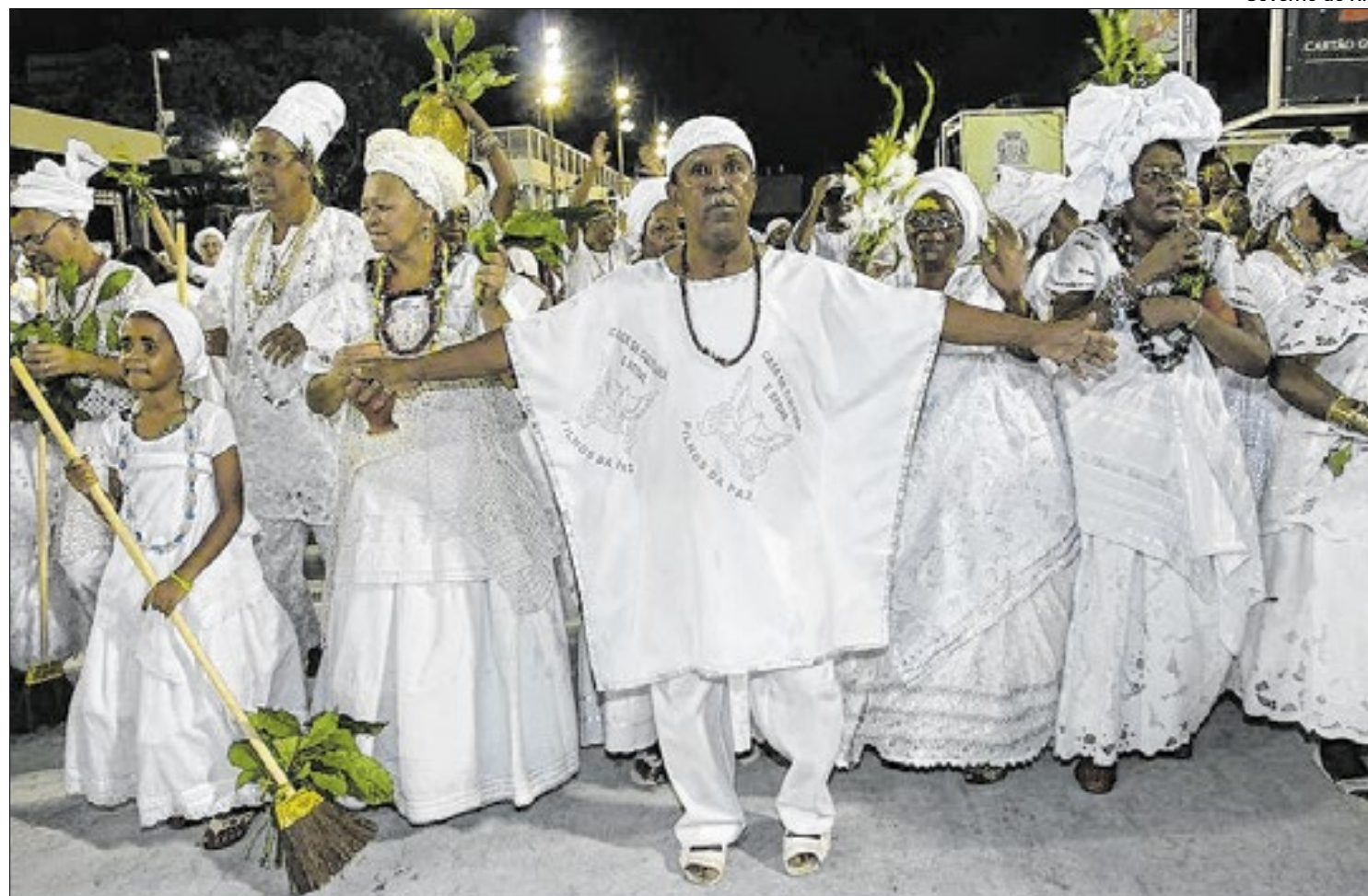
Governo do Rio

Serão quatro editais com mais de 600 vagas para manifestações culturais em todo o estado