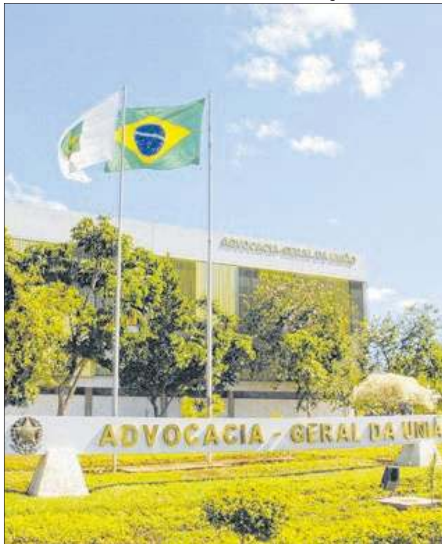
Uma das sedes da Advocacia-Geral da União está próxima da área

Risco de tragédia vaza na Imprensa Nacional e pode atingir os arredores do Setor de Indústria Gráfica