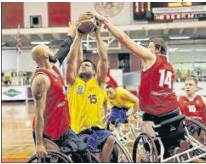
Total de recursos desviados ainda está em apuração