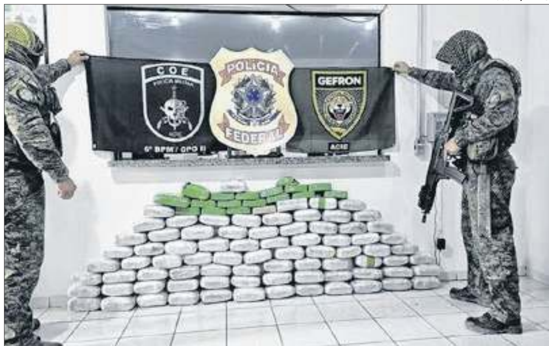
As apreensões de domingo foi uma das maiores dos últimos meses na região

As autoridades informaram que a droga teria um valor estimado de aproximadamente R$ 1,1 milhão. O material foi apreendido como parte da Operação Protetor, uma iniciativa do Ministério da Justiça e Segurança Pública (MJSP) em conjunto com a Secretaria de Estado de Justiça e Segurança Pública (Sejusp) do Acre. A