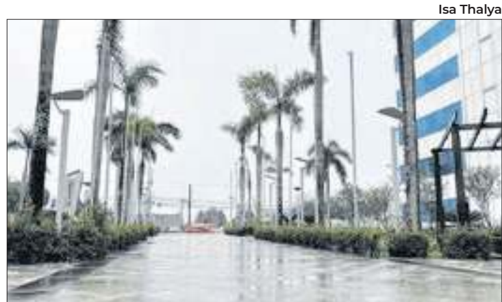
Água veio depois de meses de estiagem extrema

A cúpula de projeções Kwarahy, única no Brasil com temática indígena, simula o céu e apresenta cerca de sete mil estrelas e planetas. Em 2012, o espaço incorporou um centro de ciências com atividades lúdicas nas áreas de Matemática, Física, Química e Biologia.