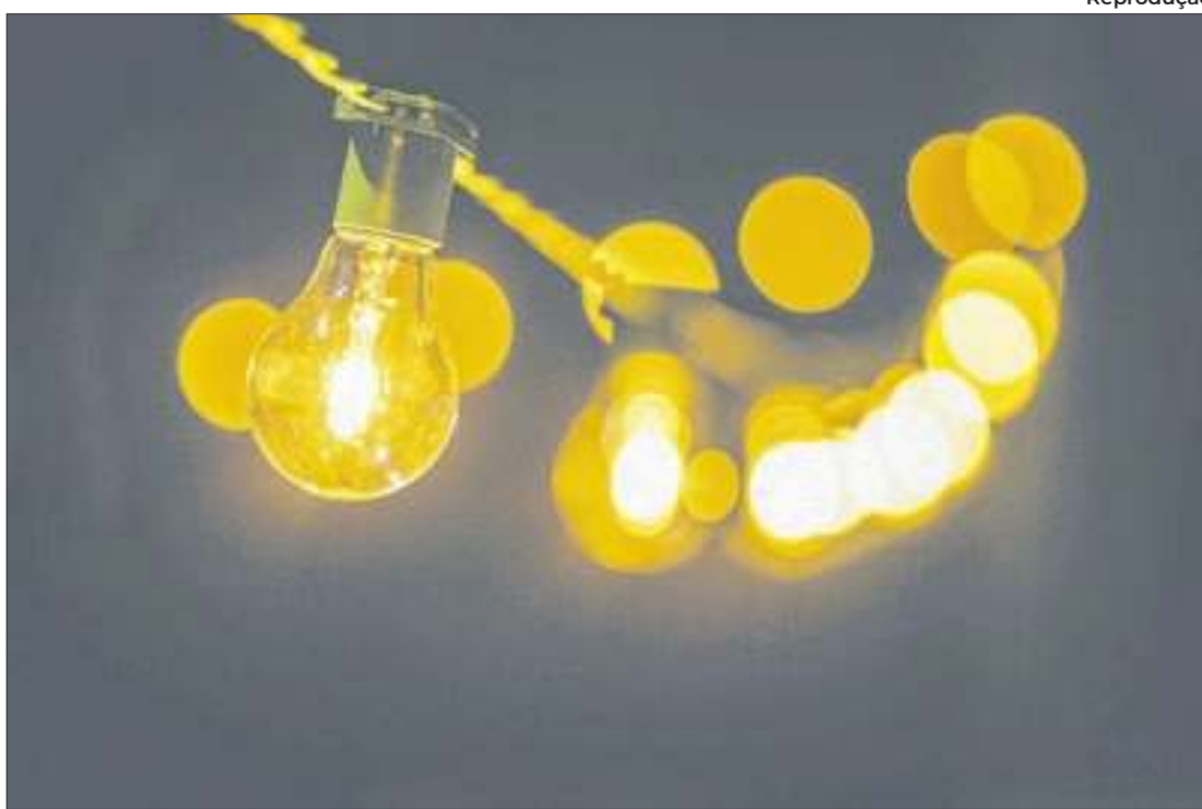
Em setembro, a bandeira tarifária vermelha também foi acionada

Medida foi anunciada pela Agência Nacional de Energia