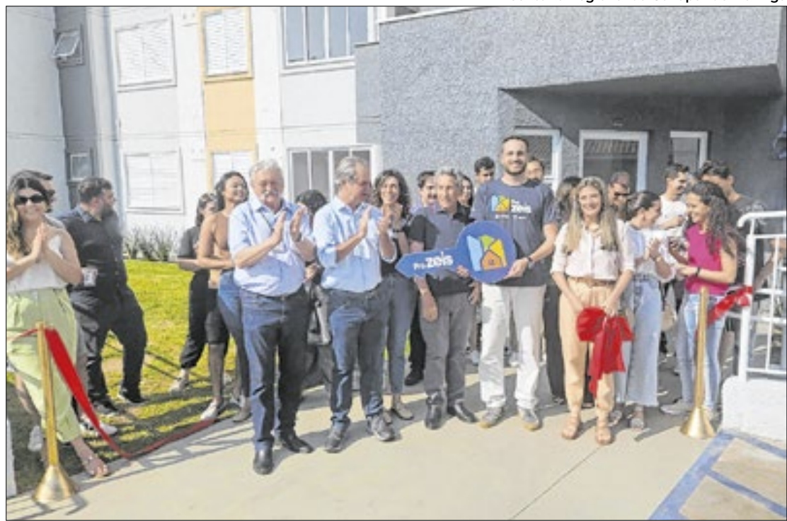
Escritório Regional da Cohapar de Maringá

Os imóveis têm metragens entre 51,72 a 52,01m 2 , com