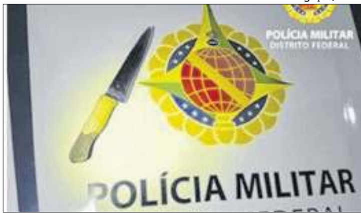
PMDF entendeu que se tratava de um pedido de socorro