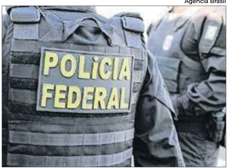
Polícia Federal investiga a Lei de Incentivo ao Esporte

A Polícia Federal (PF) e a Controladoria-Geral da União (CGU) deflagraram, na segunda-feira (30), a Operação Fair Play, com o objetivo de desarticular organização criminosa que desviou recursos da Lei de Incentivo ao Esporte (LIE).