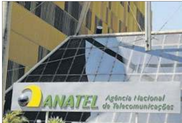
Grupos se reuniram em competição de programadores

A Agência Nacional de Telecomunicações (Anatel) promoveu, em parceria com a Hackaton Brasil, um final de semana de competição de programadores. Cento e quarenta pessoas, entre profissionais e estudantes, analisaram o funcionamento e a programação de aparelhos do tipo TV Box, não certificados.