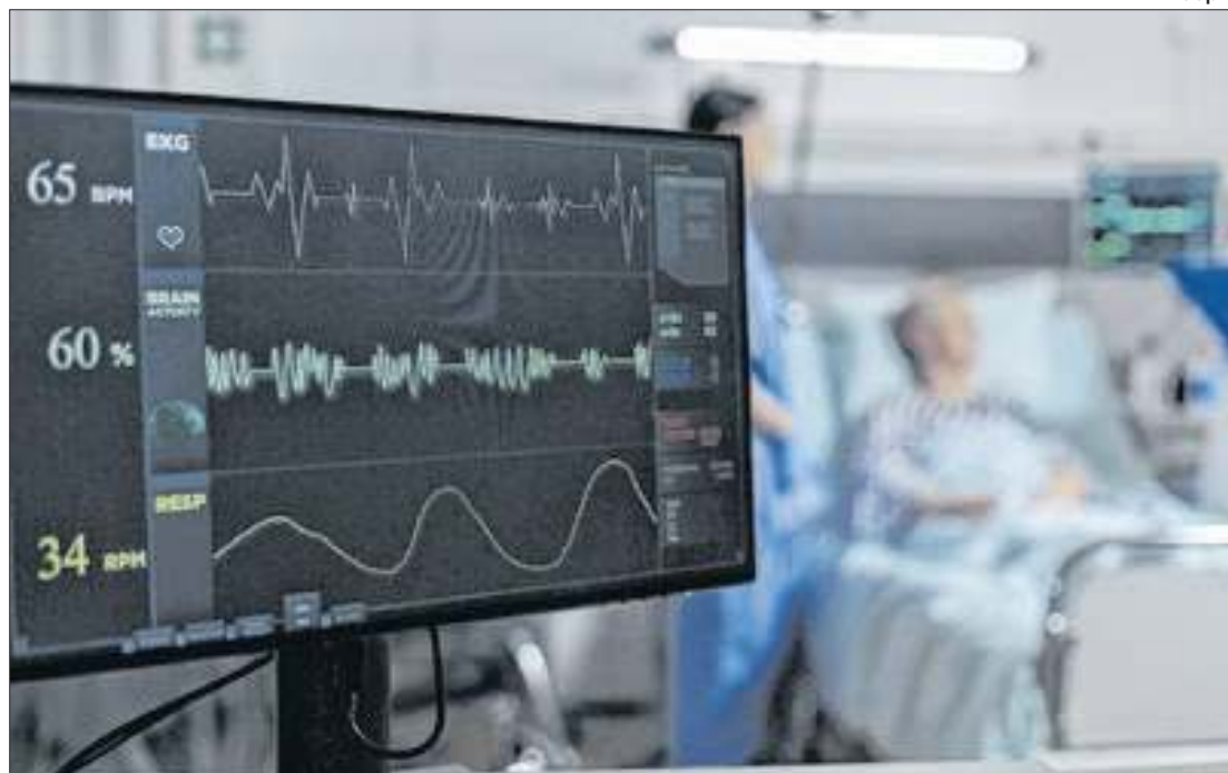
Em 2023, as internações decorrentes desse tipo de quadro totalizaram 641.980.

Ao longo desta semana, a Abramede reúne cerca de 1,6 mil especialistas para tratar do tema durante o 9º Congresso Brasileiro de Medicina de Emergência.