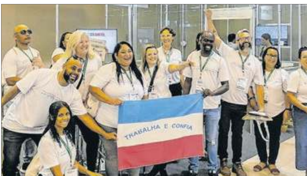
A delegação do Espírito Santo na ABAV visitou o estande do Correio da Manhã e confirmou que estarão com uma grande ação na feira de 2025, no Riocentro