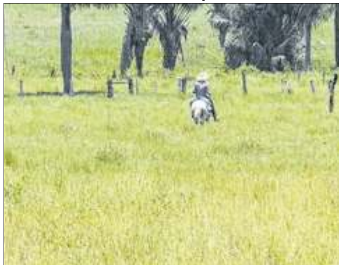
Para veterinário, o bem-estar do animal é a prioridade