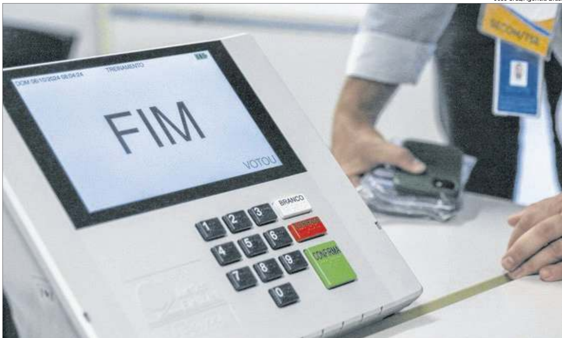
Regras específicas passam a valer até as eleições municipais, que acontecem no país neste domingo, 6 de outubro