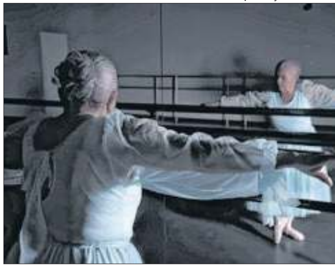
Na melhor idade, ela decidiu realizar sonhos antigos