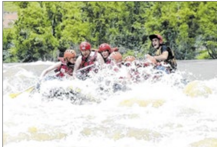
O Dia Mundial dos Rios foi comemorado no domingo

O Dia Mundial dos Rios, comemorado anualmente no último domingo de setembro, celebra a importância dos rios para o nosso ecossistema e, em Santa Catarina, reforça o impacto dos rios no turismo de aventura. Além disso, eles são essenciais para a prática de esportes como o rafting, além de formarem paisagens deslumbrantes no estado.