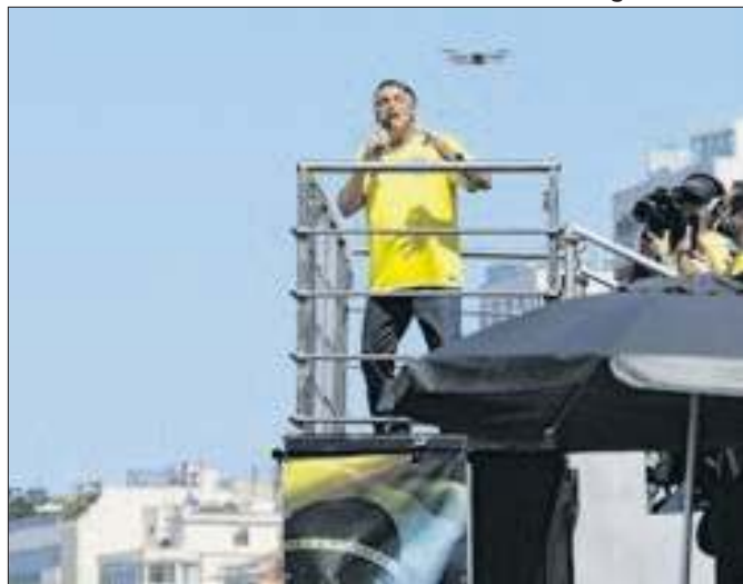
Fora da disputa, Bolsonaro deixa um vácuo