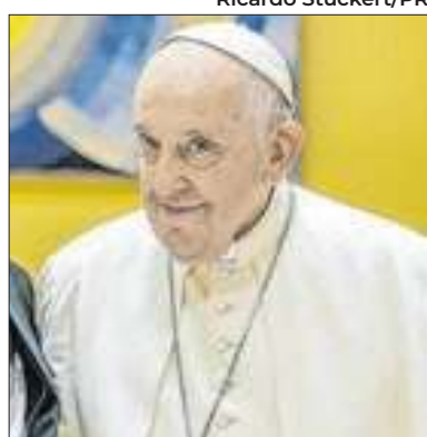
Papa expulsou membros da Igreja

O Papa Francisco segue fazendo justiça à frente da Igreja Católica. Ele expulsou dez membros do movimento Sodalidade de Vida Cristã, do Peru, incluindo o fundador do grupo, após o Vaticano concluir a investigação que chegou a ponto