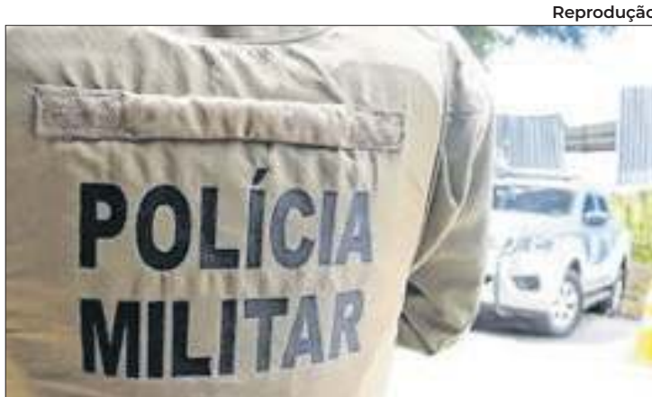
Os dados foram divulgados pelo Instituto de Pesquisa

Os números do Caged abrangem cinco setores da economia: serviços, comércio, construção, indústria e agropecuária. Importante destacar que os empregos públicos não estão incluídos nesse levantamento. Em agosto, todos os setores apresentaram saldo positivo.