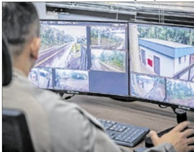
Sala de operações permite o acompanhamento