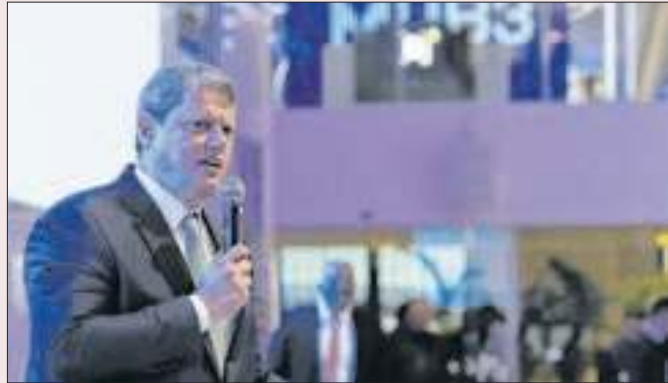
Tarcísio é um dos nomes que tenta ocupar o espaço