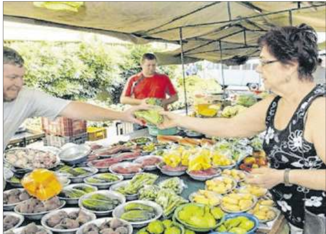
Avanço da Selic pode explicar corte do ciclo de altas do IPCA para este ano

Quanto ao desempenho da economia, o mercado financeiro manteve a expectativa