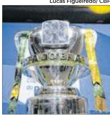
Semifinais estão na polêmica

Após o Corinthians afirmar que buscaria a Justiça Desportiva contra a CBF, foi a vez do Vasco da Gama comunicar que buscaria seus direitos contra a re-marcação dos jogos das semifinais da Copa do Brasil, realizada a pedido de Flamengo e Atlético-MG por conta da Data FIFA. O regulamento do torneio afirma que é proibido solicitar - e atender - re-marcação de partidas em decorrência da Data FIFA. Vasco e Corinthians vão ao STJD.