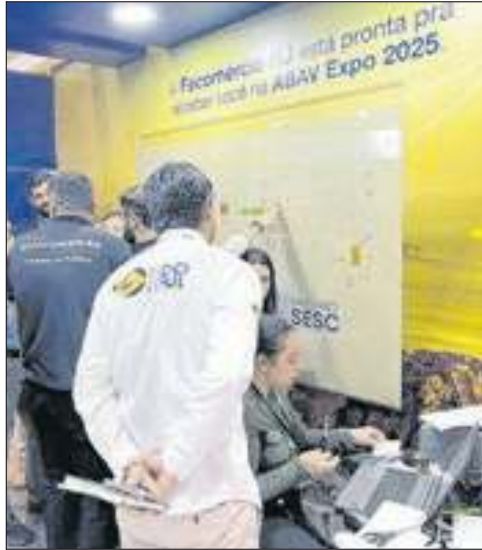
Expositores disputaram os melhores lugares para a edição da feira no Rio, no estande da Fecomércio-RJ na ABAV Expo em Brasília