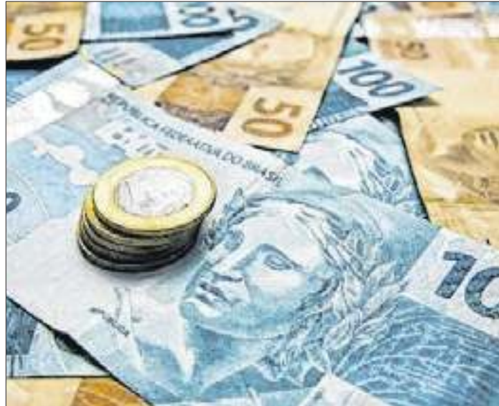
Estoque da DPF cai 1,46% e fecha R$ 7 trilhões em agosto

O estoque da Dívida Pública Federal (DPF) caiu 1,46% em agosto e fechou o mês em R$ 7,035 trilhões. Os dados foram divulgados nesta segunda-feira, 30, pelo Tesouro Nacional. Em julho, o estoque estava em R$ 7,140 trilhões.