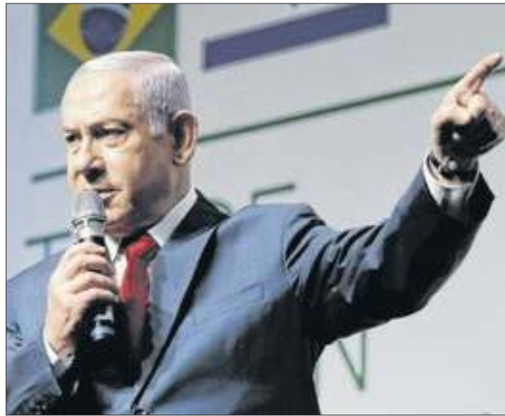
Israel matou duas lideranças inimigas em uma semana

A última vez que o Centro do Líbano havia sido bombardeado foi em 2006. Desta vez, Israel matou três lideranças da Frente Popular para a Libertação da Palestina, uma organização política e militar palestina de orientação marxista-leninista, que luta contra