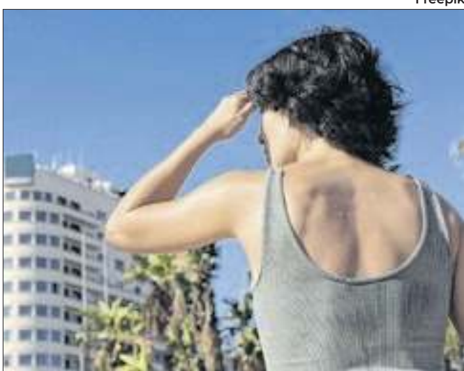
Alerta vale para cinco estados e Distrito Federal