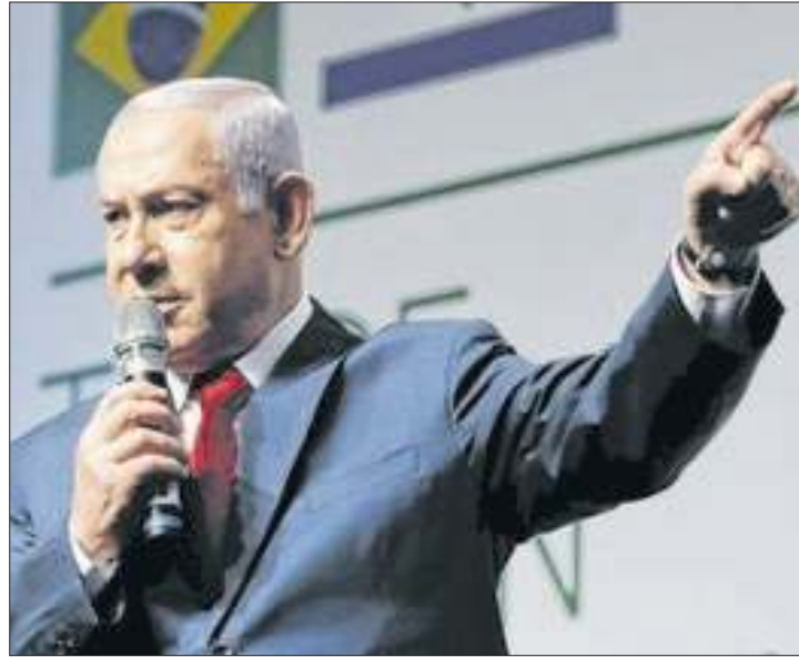
Israel matou duas lideranças inimigas em uma semana

A última vez que o Centro do Líbano havia sido bombardeado foi em 2006. Desta vez, Israel matou três lideranças da Frente Popular para a Libertação da Palestina, uma organização política e militar palestina de orientação marxista-leninista, que luta contra