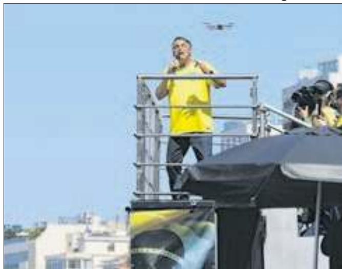
Fora da disputa, Bolsonaro deixa um vácuo