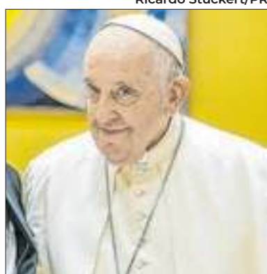
Papa expulsou membros da Igreja

O Papa Francisco segue fazendo justiça à frente da Igreja Católica. Ele expulsou dez membros do movimento Sodalidade de Vida Cristã, do Peru, incluindo o fundador do grupo, após o Vaticano concluir a investigação que chegou a ponto