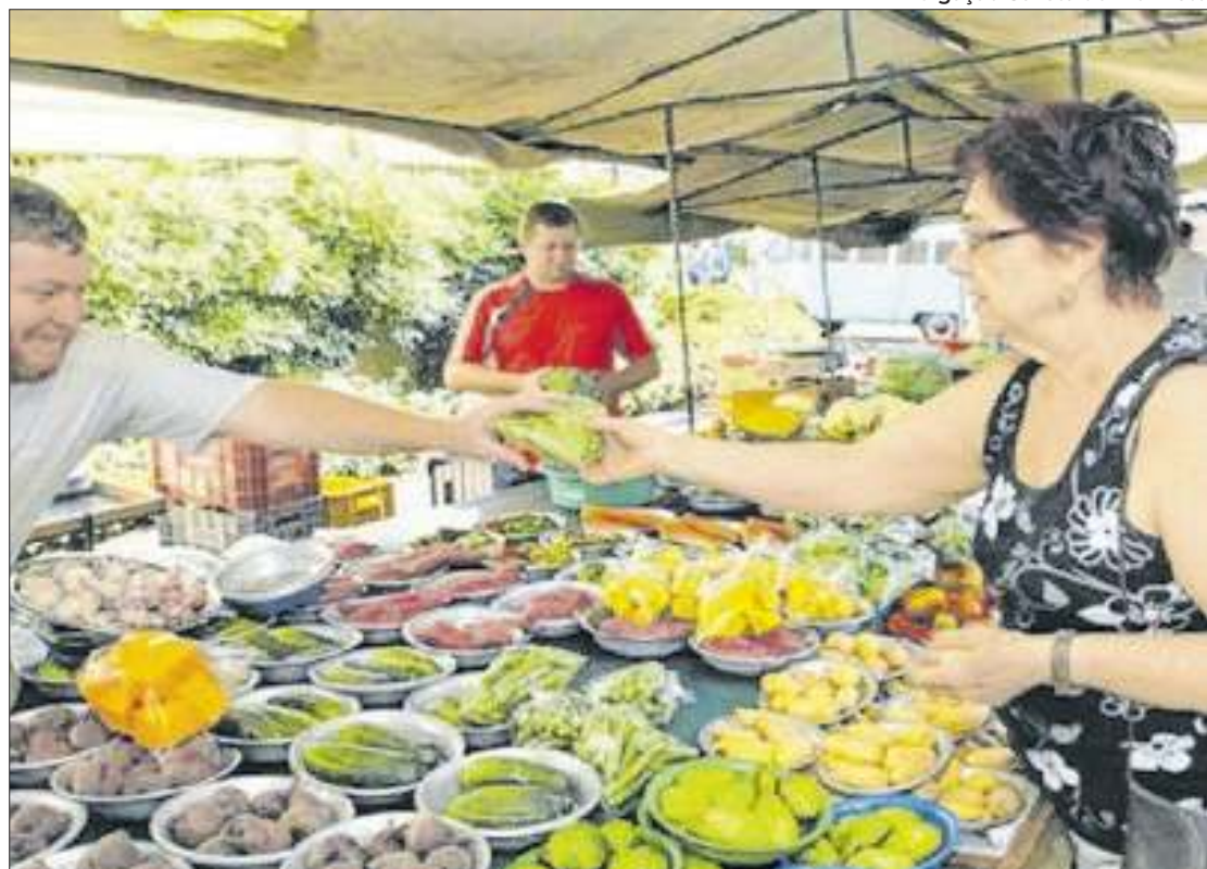
Avanço da Selic pode explicar corte do ciclo de altas do IPCA para este ano

Quanto ao desempenho da economia, o mercado financeiro manteve a expectativa