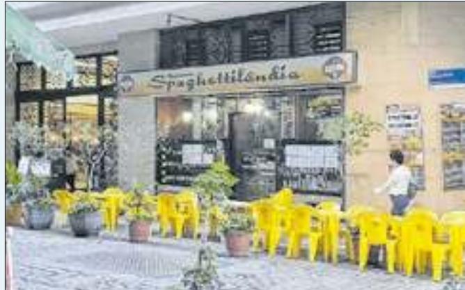
Referência gastronômica, restaurante encerrou atividades