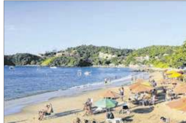
Praia de João Fernandes, em Búzios, na Região dos Lagos