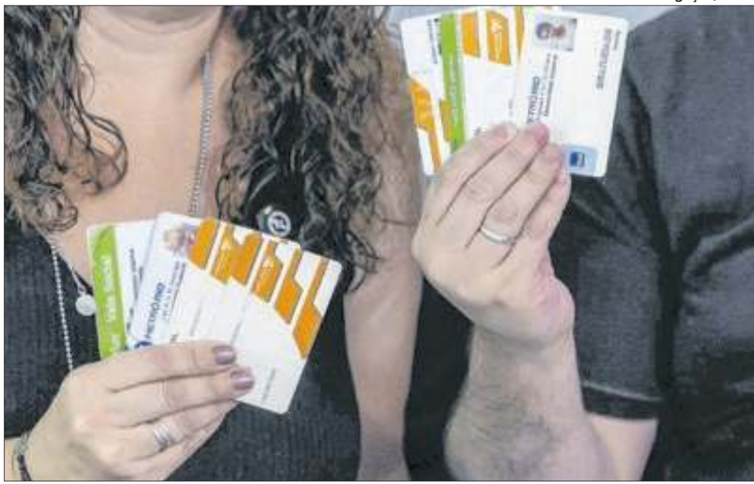
Objetivo é facilitar o embarque de pessoas com deficiência e em tratamento médico