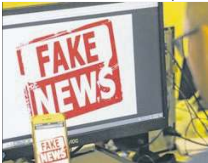
Projeto de lei tramita na Câmara dos Deputados