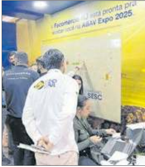
Expositores disputaram os melhores lugares para a edição da feira no Rio, no estande da Fecomércio-RJ na ABAV Expo em Brasília