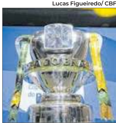
Semifinais estão na polêmica

Após o Corinthians afirmar que buscaria a Justiça Desportiva contra a CBF, foi a vez do Vasco da Gama comunicar que buscaria seus direitos contra a re-marcação dos jogos das semifinais da Copa do Brasil, realizada a pedido de Flamengo e Atlético-MG por conta da Data FIFA. O regulamento do torneio afirma que é proibido solicitar - e atender - re-marcação de partidas em decorrência da Data FIFA. Vasco e Corinthians vão ao STJD.