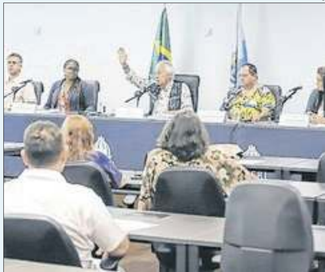
Comissão reunida na Assembleia Legislativa