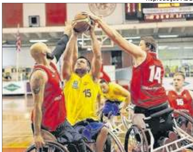
Total de recursos desviados ainda está em apuração