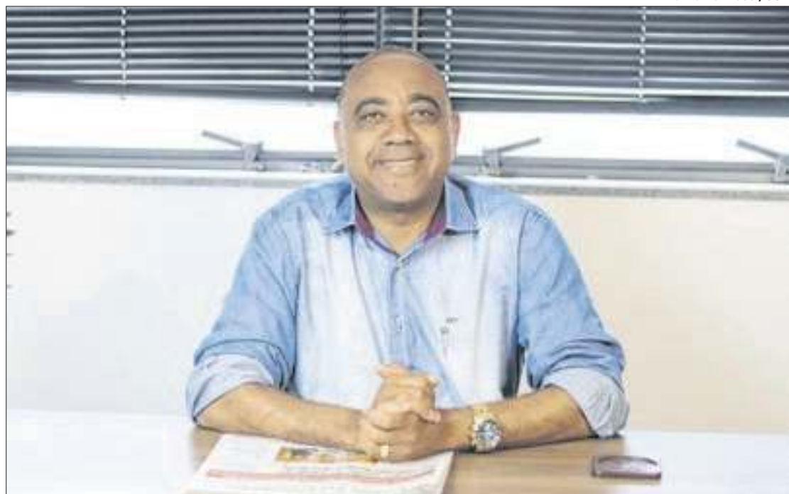
Candidato quer trazer empresas locais para conversa e formar cursos a partir da demanda

Para a educação, o candidato afirma que aposta em creches em tempo integral, com uma equipe técnica de concursados para trazer projetos para a den-