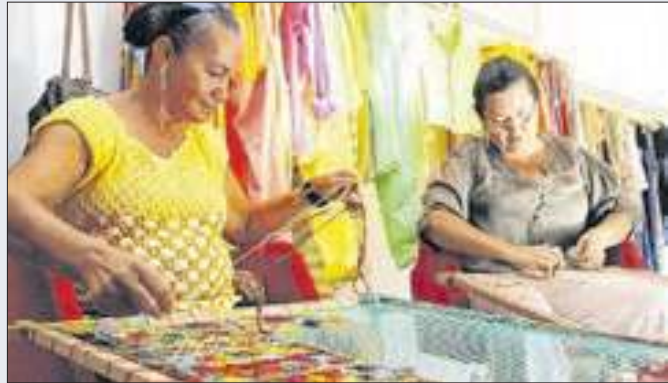
Volume expressivo objetiva incentivar investimentos