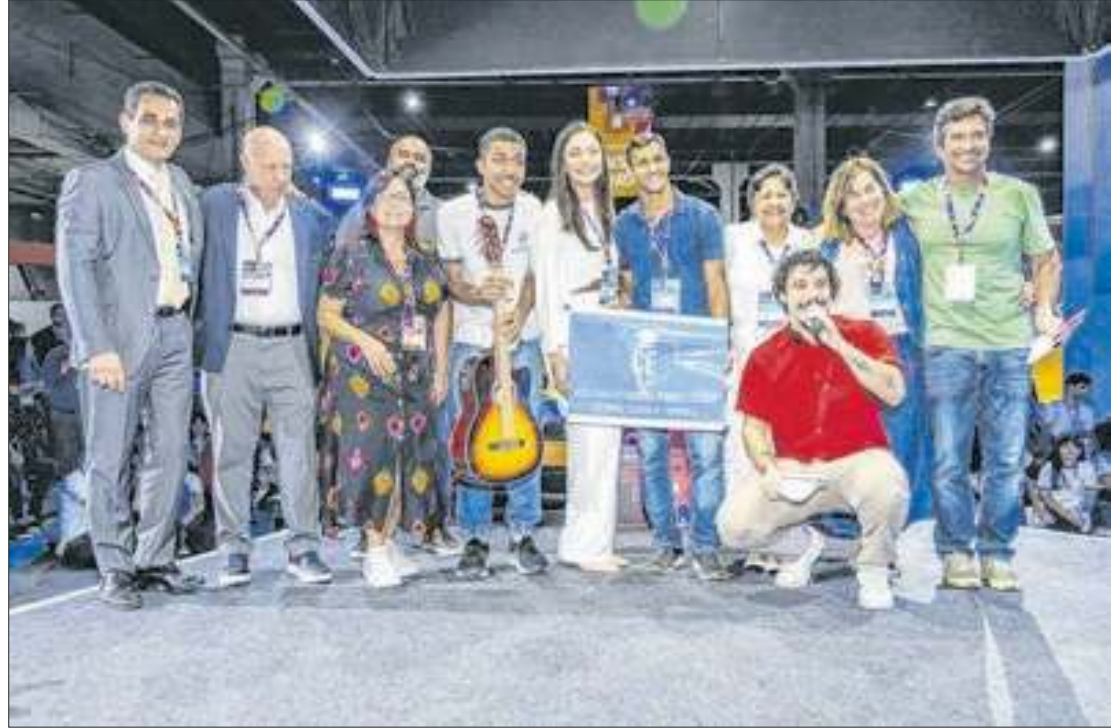
Cerimônia de premiação aconteceu no Senac Rio Summit, na manhã da última sexta-feira (27)

"Estamos muito felizes com o resultado que conseguimos nesta Olimpíada Digital. Hoje, estamos colhendo os frutos de um trabalho que foi realizado em equipe. Merecemos muito