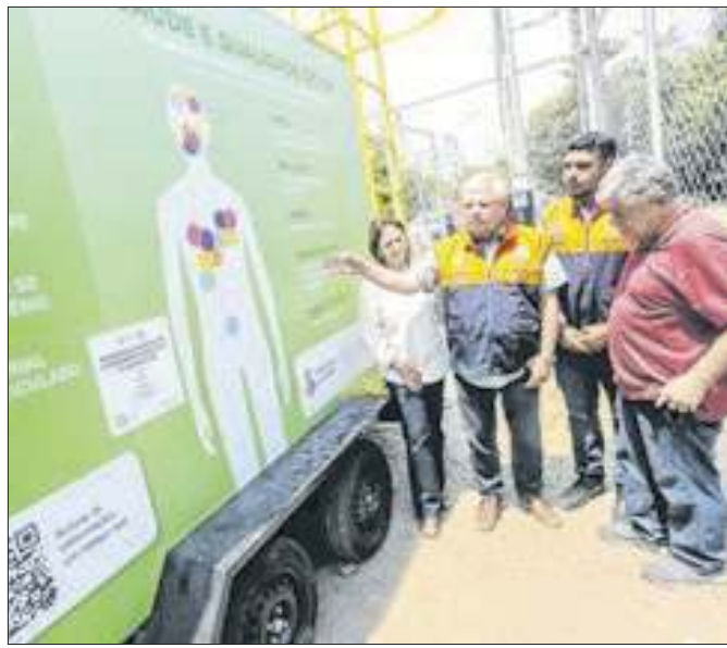
Equipamento foi instalado na Praça Jardim São João