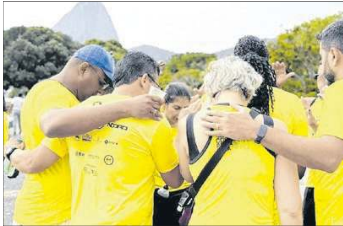
Divulgação campanha 'Setembro Amarelo'

Também mereceram destaque no trabalho os tratamentos de doenças como a depressão e o transtorno de pânico, doenças que, além dos fatores biológicos, decorrente do estresse alimentado por desafios sociais e ambientais, como a recorrente violência cotidiana do Rio.