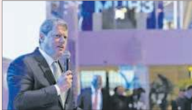
Tarcísio é um dos nomes que tenta ocupar o espaço