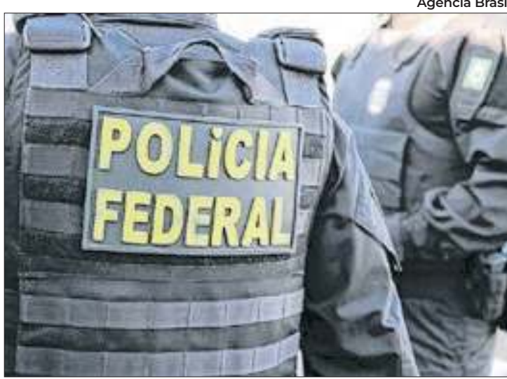
Polícia Federal investiga a Lei de Incentivo ao Esporte

A Polícia Federal (PF) e a Controladoria-Geral da União (CGU) deflagraram, na segunda-feira (30), a Operação Fair Play, com o objetivo de desarticular organização criminosa que desviou recursos da Lei de Incentivo ao Esporte (LIE).