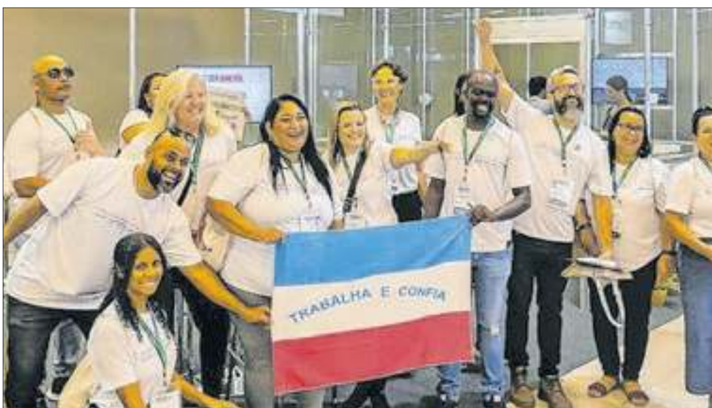
A delegação do Espírito Santo na ABAV visitou o estande do Correio da Manhã e confirmou que estarão com uma grande ação na feira de 2025, no Riocentro