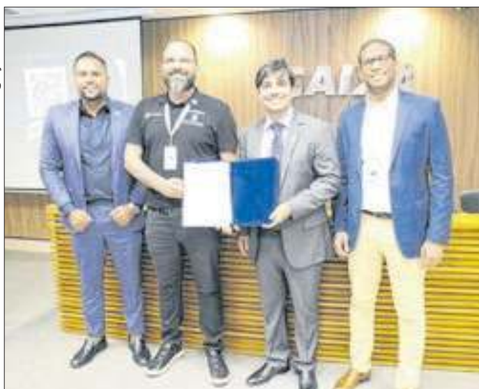
Codin e Conselho de Contabilidade firmam parceria

nadoria do Vale Social, para atender da melhor forma os beneficiários. O processo será iniciado em 1º de outubro, quando os cartões já serão emitidos no novo formato, e finalizado no dia 20 de dezembro.