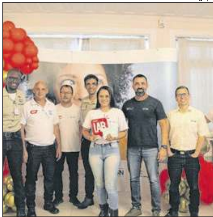
Vinte e duas propostas de colaboradores foram reconhecidas

A CSN realizou nesta segunda-feira (30), no Hotel-Escola Bela Vista, em Volta Redonda, a cerimônia de premiação das melhores ideias do primeiro ciclo de 2024 do programa Lab Ideias. Durante o evento, 22 propostas inovadoras desenvolvidas por colaboradores, foram reconhecidas em uma iniciativa que busca incentivar a inovação no ambiente de trabalho. A cerimônia é parte da Semana Lab, evento que visa estimular a criatividade e a melhoria contínua na Usina Presidente Vargas (UPV).