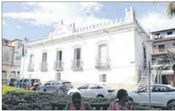
Audiência na Câmara Municipal detalha orçamento