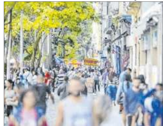
Roubos de rua cresceram 17,4% na capital fluminense