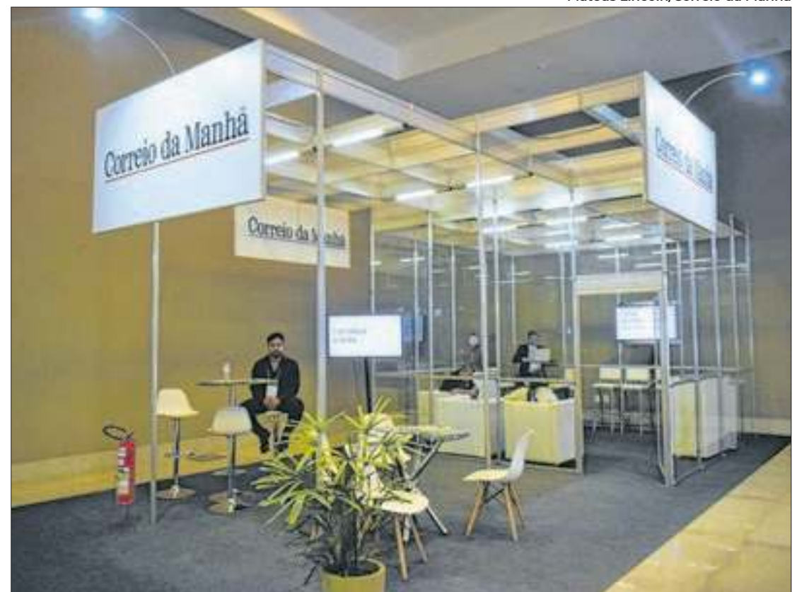
O estande do Correio da Manhã na ABAV Expo: identificação com o setor, apoio e missão

Na cerimônia de abertura, que foi realizada na quarta-feira da semana anterior (25) para convidados, estiveram presentes autoridades como o governador do Distrito Federal, Iba-