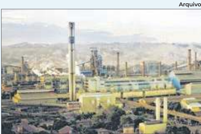
Inscrições podem ser feitas pelo site da companhia

culos para o endereço de e-mail recrutamento@coreeducacao.com.br , com o assunto "Vaga Comercial CNA Resende", e aguardar retorno sobre a possível contratação.