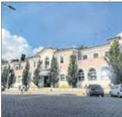
Cidade enfrenta seca

Diante da estiagem que recentemente afeta todo o país, a Prefeitura de Nova Friburgo acionou a concessionária Águas de Nova Friburgo para solicitar informações a respeito de possíveis riscos de desabastecimento. A empresa informou, no entanto, que os sistemas de abastecimento da cidade estão operando dentro do esperado para o período. Caso a redução da oferta de água atinja níveis de alerta, a concessionária possui um plano de contingência.