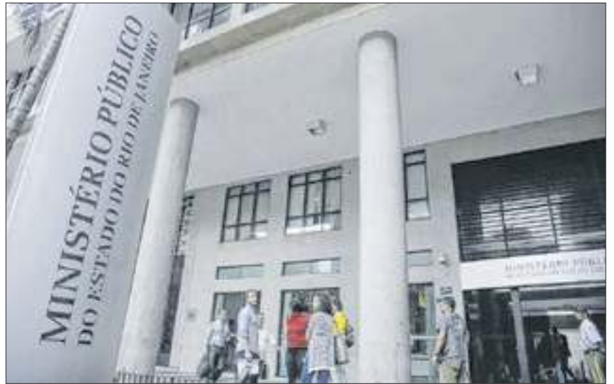
Reunião setorial aconteceu na última quinta-feira (26)

Os encontros, que aconteceram de maneira remota, discutiram ações de planejamento e gestão que estão previstas em Planos de Contingências para a garantia da continuidade e qualidade destes serviços públicos essenciais à luz do diagnóstico da situação monitorada e, bem assim, dos prognósticos de órgãos como o INPE - Instituto Nacional de Pesquisas Espaciais e o INMET - Instituto Nacional de Meteorologia, quanto ao agravamento e duração da estiagem. Dentre os assuntos tratados, também foi levantada a