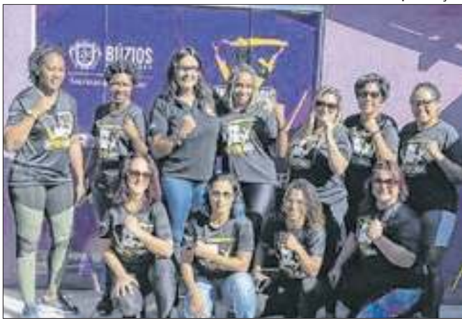
Espaço atende mulheres vítimas da violência