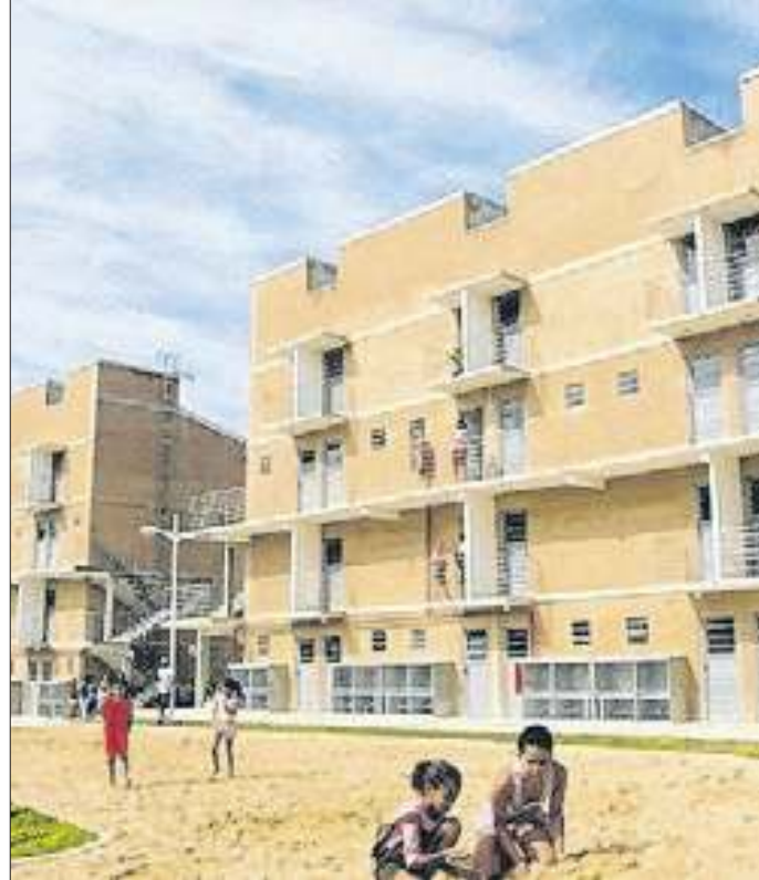
Empreendimentos serão construídos em Santa. Amélia e Mucajá