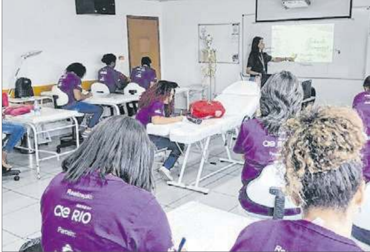
Parceria entre a Águas do Rio e o Senac-RJ está oferecendo cursos gratuitos de beleza

“Tenho três filhas, de 4, 15 e 18 anos, e estou me esforçando para dar uma vida digna para elas.