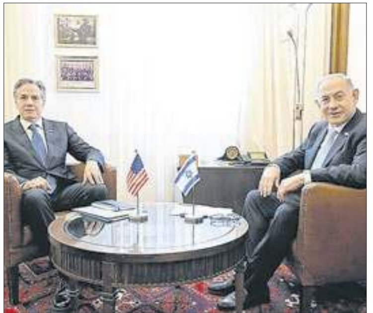
Binyamin Netanyahu falou em discutir o cessar-fogo com Antony Blinken

estrago realmente catastrófico. Para complicar ainda mais, sequer foi confirmado se o líder do Hezbollah, Hassan Nasrallah, estava presente no prédio bombardeado.