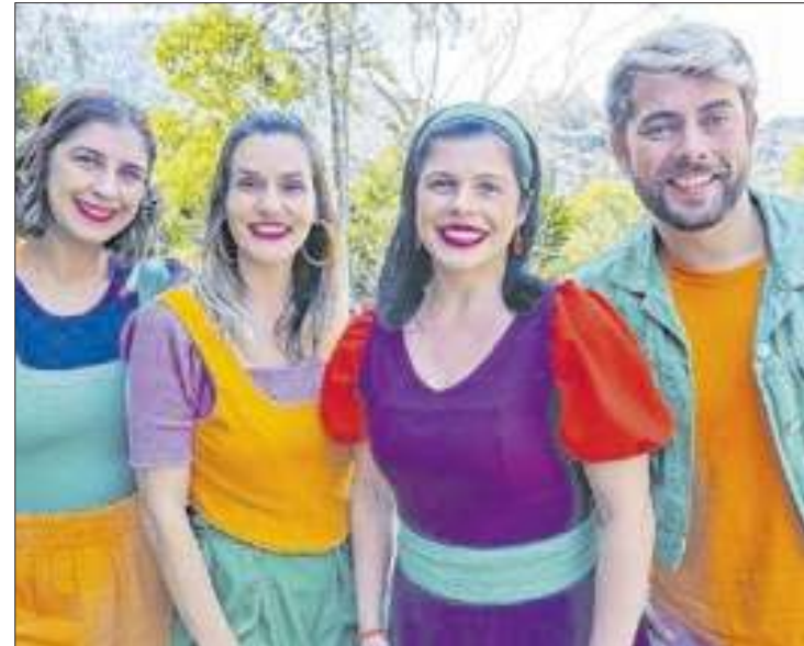
Divulgação grupo Ecoarte

Na Biblioteca Parque, os alunos participarão de uma peça-jogo com dinâmicas de arte e educação. De forma lúdica, o público passará por temas