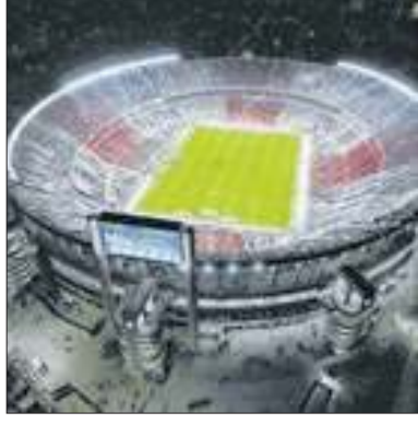
Monumental foi evacuado

O Estádio Monumental de Núñez, casa do River Plate da Argentina e maior estádio da América do Sul, foi evacuado na sexta-feira (27) após uma ameaça de bomba. A Polícia, os Bombeiros e o Departamento Anti-Bombas evacuaram o estádio, mas não encontraram nenhuma bomba. Segundo o Diário Olé, a falsa denúncia de bomba foi feita por alunos de uma escola nas redondezas que queriam cancelar uma prova.