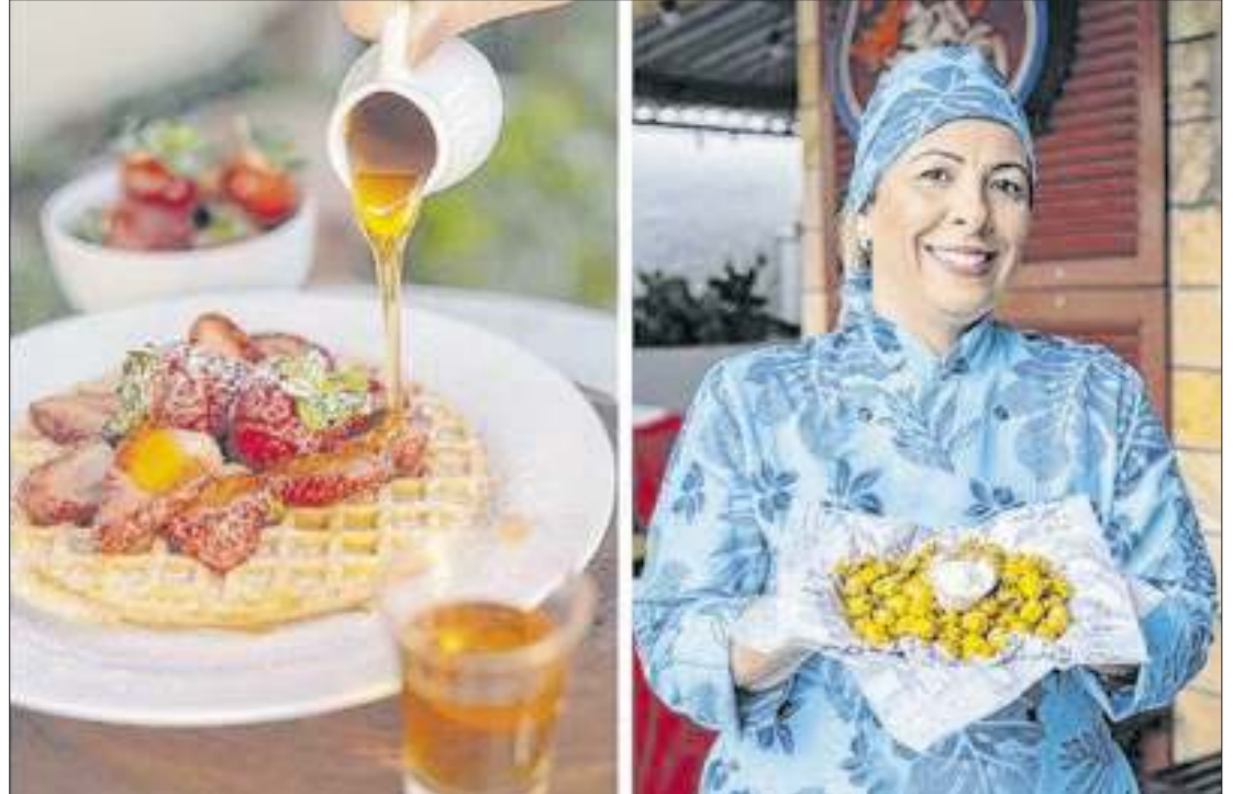
Waffle Primavera (Maria Torta Café) e a Pipoca de Quiabo (Pier 66) são destaques

O evento também mostra que a economia rural de Teresópolis vai muito além das hortaliças: a