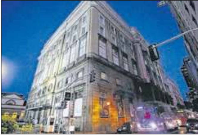
Mostra dá destaque à produção cultural dos anos 80