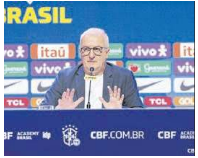
Dorival Júnior convocou os atletas para a eliminatória

Atacantes: Endrick (Real Madrid), Raphinha (Barcelona), Luiz Henrique (Botafogo), Igor Jesus (Botafogo), Savinho (Manchester City), Vinícius Júnior (Real Madrid) e Gabriel Martinelli (Arsenal).