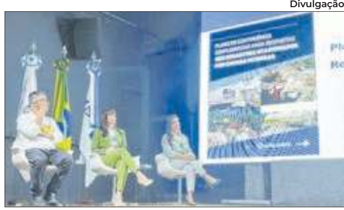
Projeto visa gestão de riscos de desastres na região