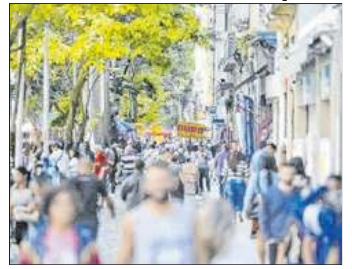
Roubos de rua cresceram 17,4% na capital fluminense