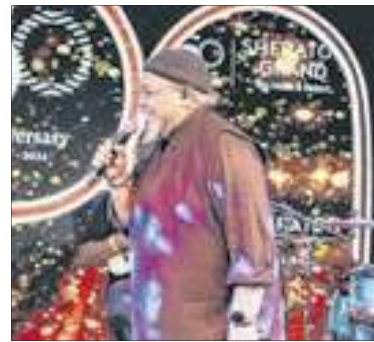
O cantor Jorge Aragão colocou os convidados para sambar, com músicas memoráveis dos seus 40 anos de carreira

forma tributária no grupo especial criado na Comissão de Assuntos Econômicos (CAE) do Senado, Izalci Lucas (PL-DF), estará na terça-feira (1) em almoço no grupo de Lideranças Empresariais do DF (LIDE-DF) para explicar as mudanças que pretende sugerir ao projeto que foi aprovado no primeiro semestre na Câmara.