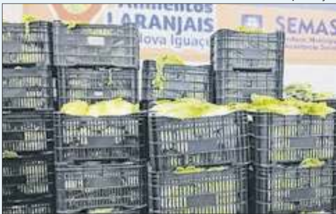
Produtores podem se cadastrar até o dia 07 de outubro