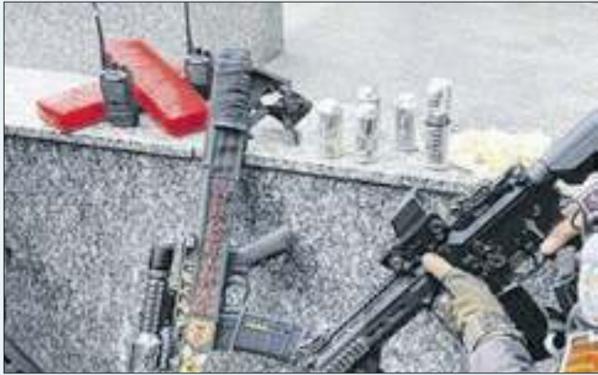
Apreensão abrangeu, fuzil, munições e rádios transmissores