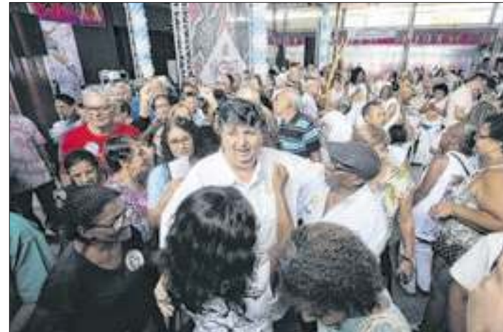
Prefeito Neto se encontra com idosos no Clube Náutico

"Hoje eu só quero agradecer a nossa 'Melhor Idade', pois tudo que Volta Redonda tem deve a vocês que iniciam a cidade e que são um exemplo para toda a população. Quero dizer que eu jamais irei decepcioná-los. Para o meu próximo governo vou continuar com todos os projetos voltados aos idosos, e quero ir além, quero