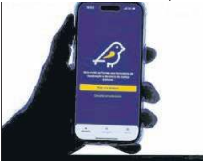
App Pardal recebe pode ser baixado no Android e iOS