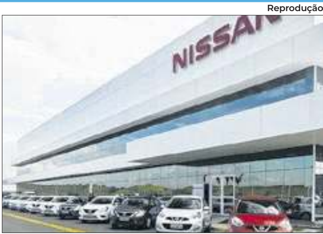
Vaga de Analista Contábil aceita inscrições até o dia 4

Suspeito do crime estava com três armas e R$ 10 mil em espécie