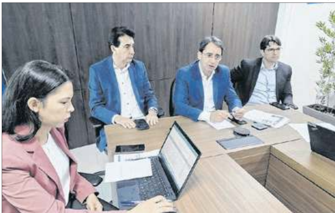
Projeto do Orçamento para 2025 foi apresentado pelo Governo do Estado do Espírito Santo

Projeto foi enviado para apreciação da Assembleia Legislativa