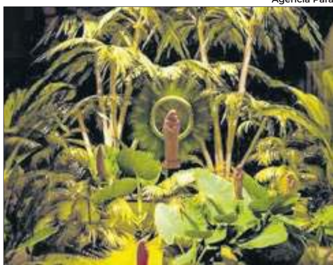
Festa centenária a partir de uma experiência diferente