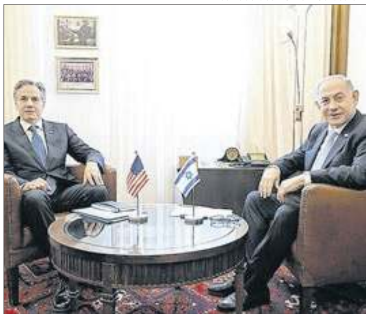
Binyamin Netanyahu falou em discutir o cessar-fogo com Antony Blinken

estrago realmente catastrófico. Para complicar ainda mais, sequer foi confirmado se o líder do Hezbollah, Hassan Nasrallah, estava presente no prédio bombardeado.