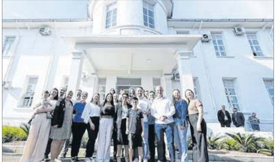
Total destinado à Casa de Saúde pelo Avançar na Saúde alcançará R$ 3,49 milhões

“Cuidado e carinho. Para mim são palavras de ordem na gestão pública. A gente escolhe se colocar na vida pública é para fazer as pessoas a nossa volta mais felizes. O Estado que devia R$ 1,2 bilhão a instituições de saúde, hoje não só quitou esse passivo como já superou esse mesmo valor em investimentos por meio do Avançar”, celebrou Leite. “A estrutura do prédio da unidade de saúde também está inserida no contexto de carinho e cuidado com o paciente, com quem chega aqui no hospital. Por isso, quando a Casa de Saúde apresentou esse projeto, ele entrou nas nossas primeiras etapas do Programa Avançar. Cada sonho que a gente realiza sai da pilha e abre espaço para novos sonhos. Tenho certeza que sonhando sempre em cuidar das pessoas com carinho, com capricho, a gente vai poder fazer muitas coisas boas juntos”