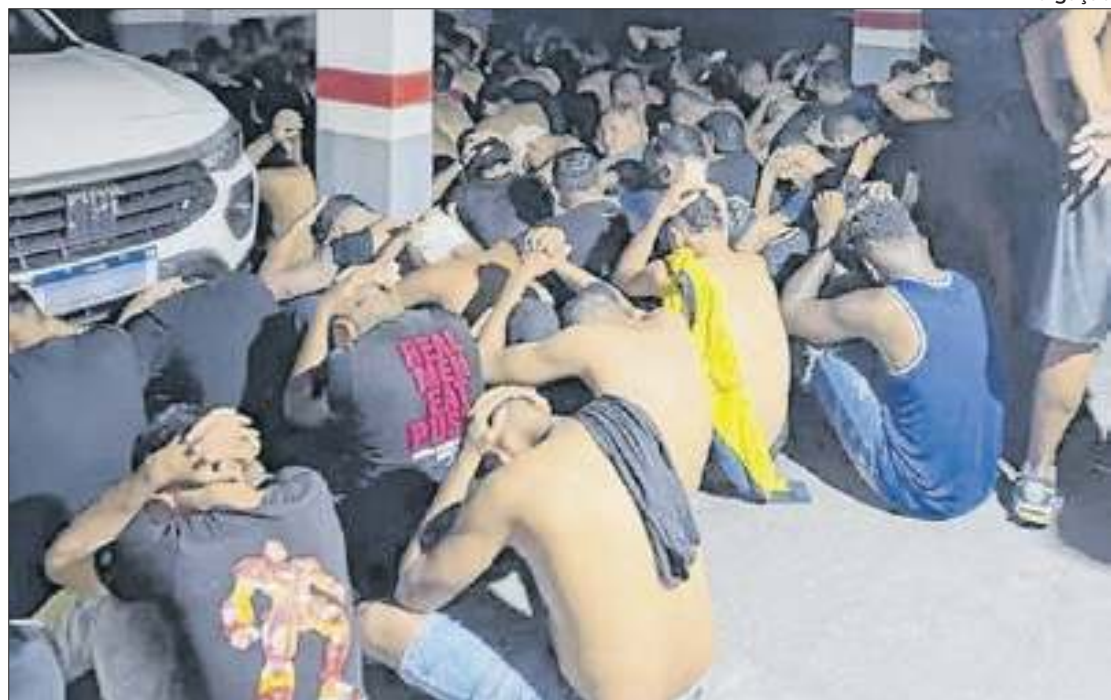
A Delegacia de Proteção ao Torcedor e de Grandes Eventos (DPTGE) investiga o caso.

A DPE apontou que as prisões foram “equivocadas” por diversas razões: ausência de audiência de custódia, superlotação, falta de consideração das circunstâncias pessoais dos detidos e a ausência de individualização das condutas. Muitos dos presos não possuem antecedentes criminais, e não houve distinção entre aqueles envolvidos na briga e os que apenas passavam pelo local.