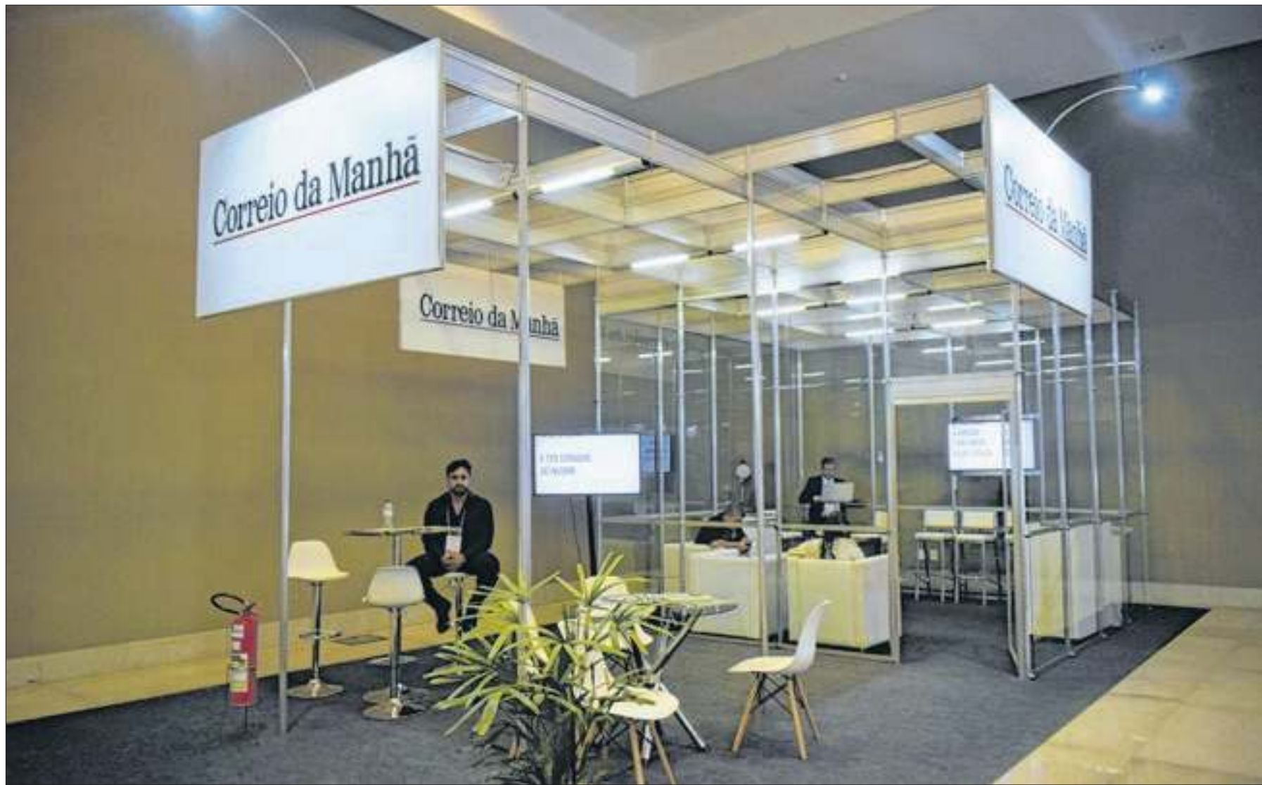
O estande do Correio da Manhã na ABAV Expo: identificação com o setor, apoio e missão

Ao longo dos três dias do evento, foram ofertados 60 treinamentos entre palestras, painéis e capacitações sobre temas do setor. Neste ano, o encontro contou com 198 estandes e aproximadamente 1.500 marcas participantes. Sendo 22 destinos internacionais, 26 unidades federativas e 15 municípios com estandes próprios, 36 empresas no Espaço Operadoras e 120 compradores convidados. Além disso, a convenção abriu para a visitação do público em geral no dia 28. A entrada solidária, no valor de R$ 20, foi totalmente revertida para a organização Médicos Sem Fronteiras.