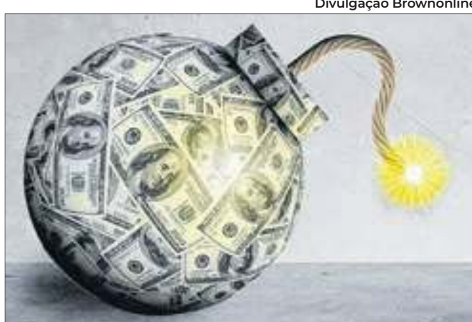
Embora conste da LDO, previsão da dívida não é realista

Previsão sombria do endividamento da União para 2024 foi feita pela Instituição Fiscal Independente (IFI) do Senado, em contraste com a projeção federal, de que isso só ocorreria em 2034.