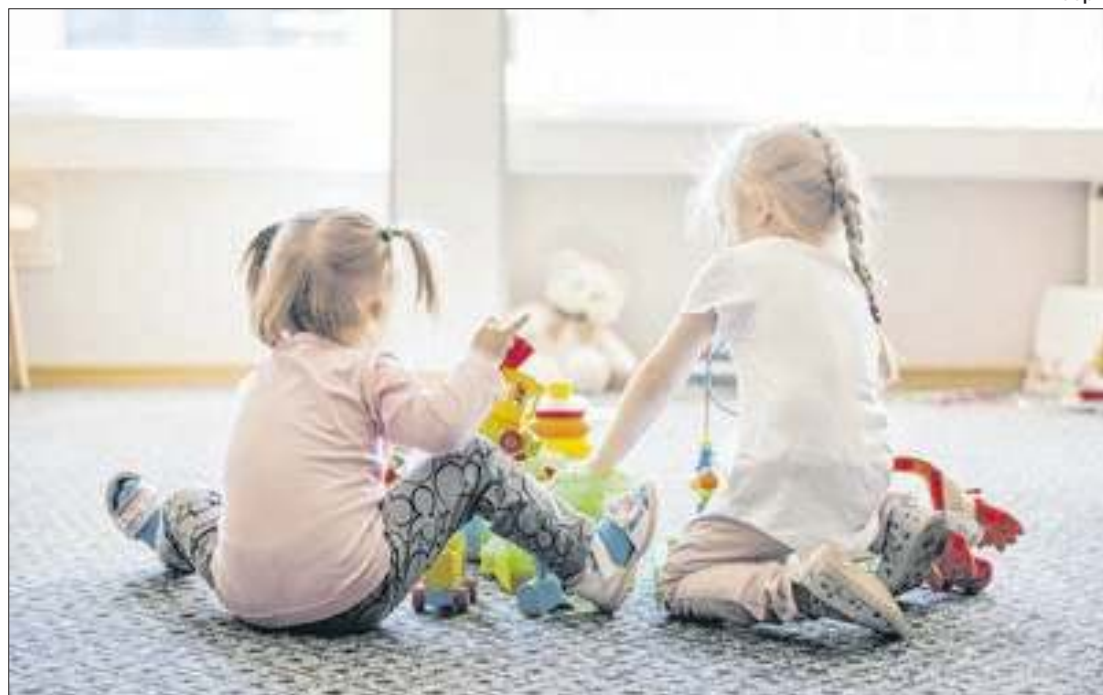
Essas crianças representam 45,9% do total de 9,9 milhões nessa faixa etária

A pesquisa traça um panorama, em todo o país, das condições sociais e econômicas das famílias e das crianças. O INC é calculado em cada estado e em