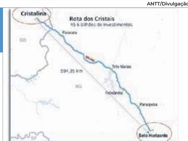
O trecho da BR-040 que liga Cristalina a Belo Horizonte tem quase 600 km e foi concedida por 30 anos

Trecho 3) Rota dos Cristais , com 594 km de extensão de Belo Horizonte (MG) a Cristalina (GO) – licitada semana passada; e Trecho 4) Rota do Pequi , com 315 km de extensão, que incluem o trecho da BR-040 de Cristalina a Brasília, além de segmentos da BR-