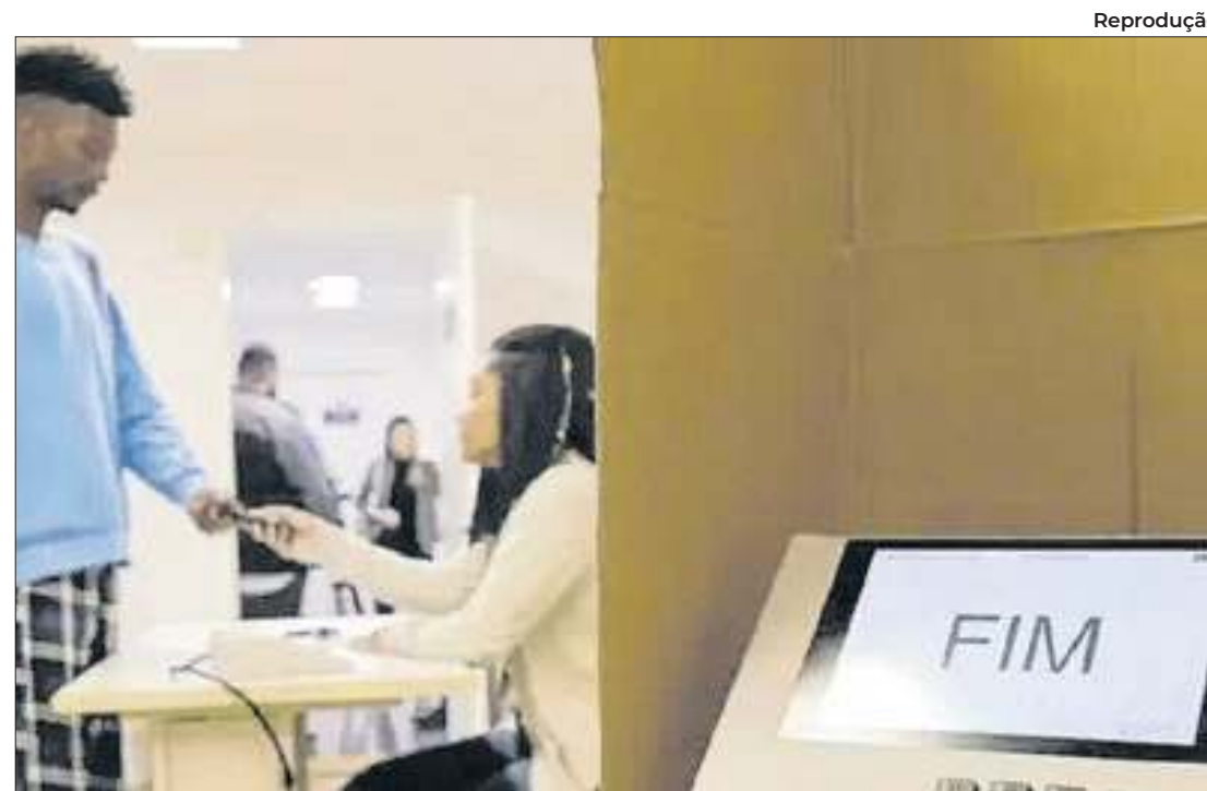
Ceará já tem duas cidades com candidaturas únicas a Prefeitura

O Metrô do Recife funcionará no domingo, 6 de outubro deste ano, data em que ocorrerá o primeiro turno das eleições em todo o Brasil. A informação foi divulgada pela Companhia Brasileira de Trens Urbanos. O Metrô do Recife funcionará no domingo de votação.