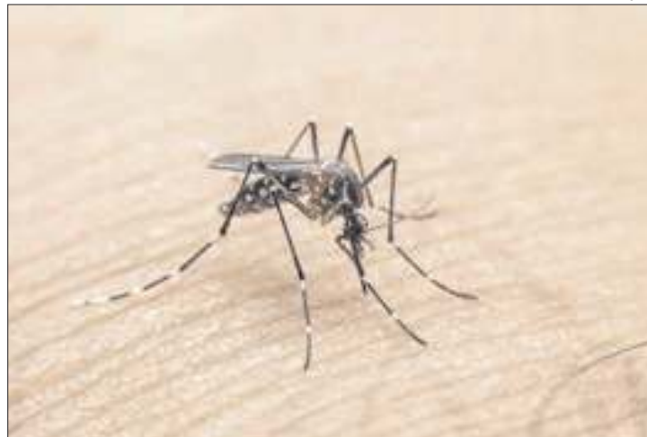
Estratégia visa combater transmissores de arboviroses

Pesquisadores brasileiros desenvolvem estratégia para combater insetos transmissores de arboviroses. O trabalho comprovou que o uso dos mosquitos para "autodisseminar" larvicidas em seus próprios criadouros pode ajudar no controle das doenças transmitidas, sobretudo aquelas levadas pelo Aedes aegypti, como a dengue.