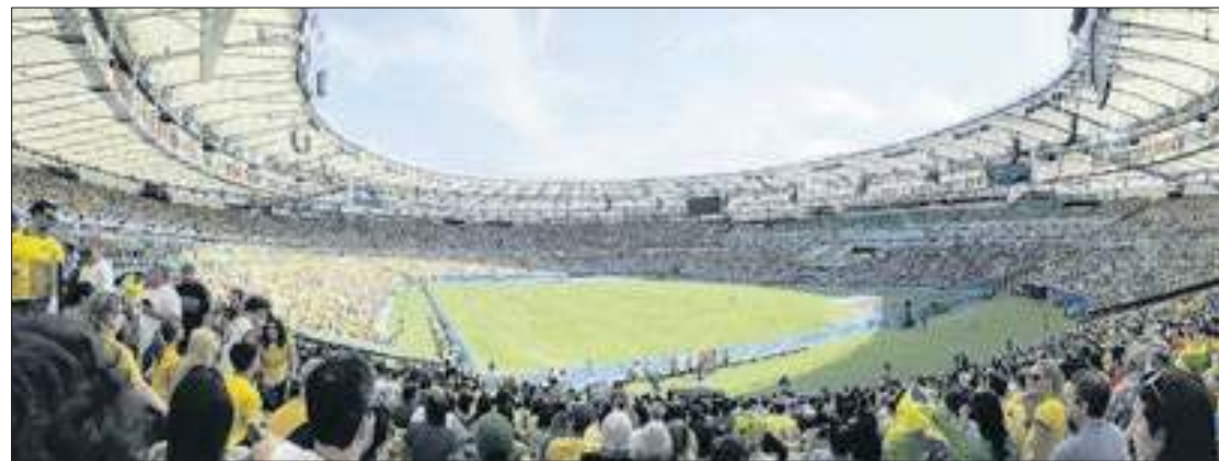
Complexo Maracanã será gerido por Flamengo e Fluminense pelos próximos 20 anos

A partir de agora, o estádio passa a ser gerido por uma Sociedade de Propósito Específico (SPE), a empresa Fla-Flu Serviços S.A, que será responsável pela gestão compartilhada dos clubes. O grupo venceu o processo de licitação com a melhor proposta técnico-financeira no valor de R$ 20.060.874,12.