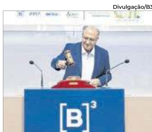
O vice-presidente Geraldo Alckmin participou da sessão que leilou a estrada

060 e BR-153, de Brasília a Goiânia. Esse trecho está com o calendário de concessão atrasado – ainda está na fase de estudos, e tende a ficar para o final do próximo ano ou para 2026.