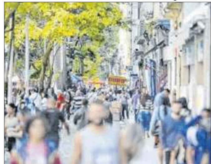
Roubos de rua cresceram 17,4% na capital fluminense