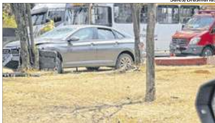
O painel digital do totem acertou em cheio o para-brisas e seus pedaços ficaram jogados ao lado do carro

No momento do acidente, uma viatura da Polícia Militar passava pelo local e parou para auxiliar e fazer o registro do ocorrido. O condutor foi socorrido pelo Corpo de Bombeiros pouco tempo depois, que teve de atuar para liberar o motorista – que ficou preso no interior do veículo. “O solicitante relata que um veículo perdeu o controle, colidindo contra árvores e placas de