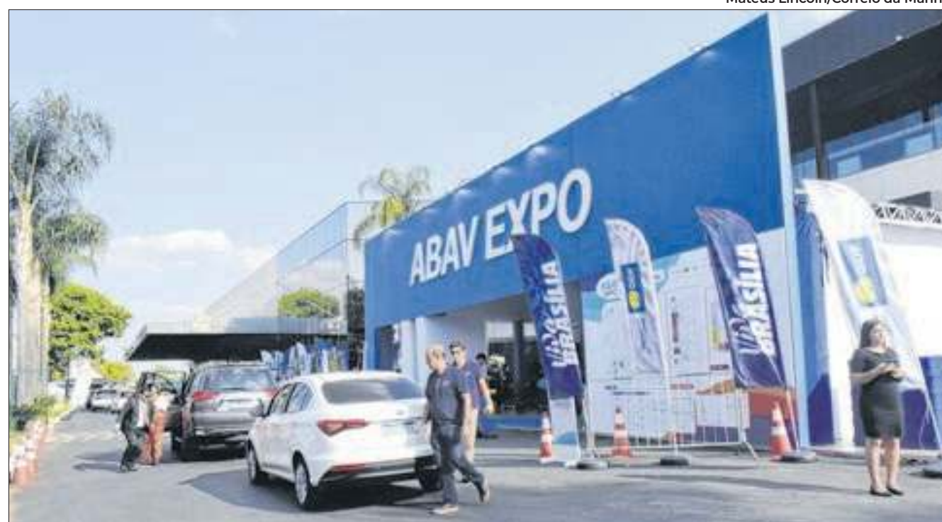
23 mil pessoas passaram pela ABAV Expo nos seus três dias

Além disso, a empresa celebrou os dez anos de parceria com a Air France-KLM — também empresa área, cuja sede fica em Paris, na França.