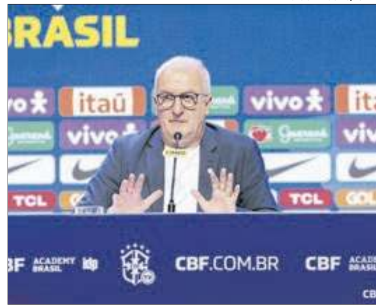
Dorival Júnior convocou os atletas para a eliminatória

Atacantes: Endrick (Real Madrid), Raphinha (Barcelona), Luiz Henrique (Botafogo), Igor Jesus (Botafogo), Savinho (Manchester City), Vinicius Júnior (Real Madrid) e Gabriel Martinelli (Arsenal).