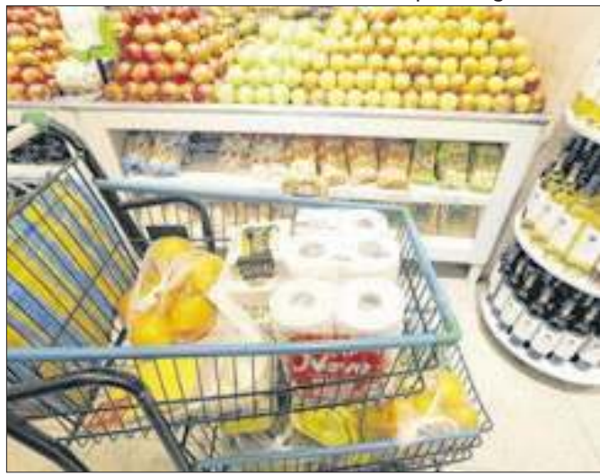
Alimentos: brasileiros sentem alta no bolso