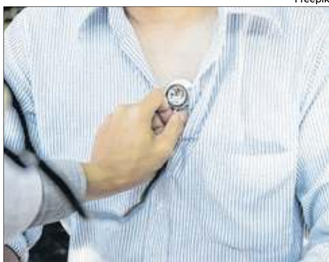
Exames preventivos evitariam 80% dos casos