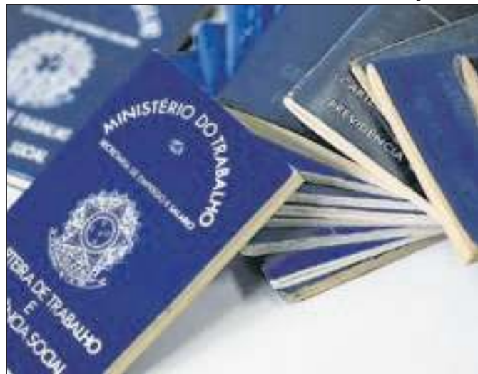
Criação de mais de 18 mil postos de trabalho em agosto