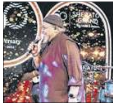
O cantor Jorge Aragão colocou os convidados para sambar, com músicas memoráveis dos seus 40 anos de carreira

da Imprensa Nacional. A área tem duas linhas de 1.000 ampères (NVA) cada uma, só que um dos transformadores antigos está vazando óleo e corre risco de explosão. A suspeita é de que tenham usado como fluido de isolamento o óleo ascarel, pela idade do equipamento. O vazamento e a vaporização de fluidos hidráulicos contendo ascarel de equipamentos dielétricos representam riscos à saúde humana e ao meio ambiente.