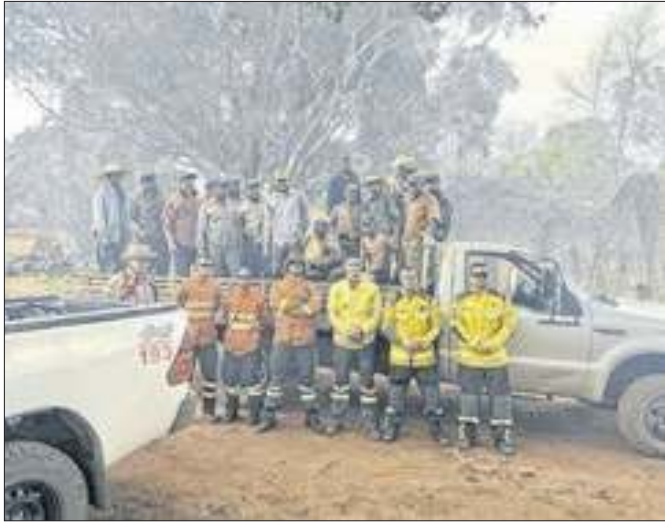
Ação em meio ao combate às chamas no Mato Grosso