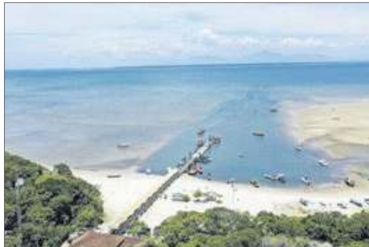
Estado vai investir R$ 14,9 milhões em duas embarcações

A Secretaria de Infraestrutura e Logística do Paraná (SEIL) publicou nesta semana um edital para contratar a elaboração de projetos e fabricação de duas embarcações do tipo catamarã, que serão utilizadas na travessia entre Pontal do Sul, em Pontal do Paraná, e a Ilha do Mel, em Paranaguá, no Litoral. As embarcações vão operar na rota entre o Terminal de Embarque de Pontal do Sul e a comunidade de Nova Brasília, e entre o terminal de Pontal do Sul e a comunidade de Encantadas.