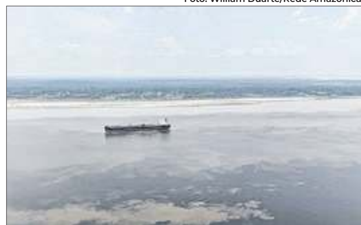
Nível do Rio Negro é o menor em 121 anos

O Governo do Pará, liderado pelo governador Helder Barbalho (MDB) e pela vice-governadora Hana Ghassan (MDB), confirmou a antecipação da primeira parcela do 13º salário dos servidores públicos estaduais, injetando R$ 640 milhões na economia local a partir de outubro. Essa prática, adotada desde 2019, é estratégica, pois coincide com o Círio de Nazaré, um dos maiores eventos religiosos de Belém, que atrai milhares de visitantes. O pagamento, programado para os dias 3 e 4 de outubro, tem como objetivo beneficiar o funcionalismo público e estimular o comércio e serviços, aumentando as vendas e atividades de lazer durante um dos meses mais vibrantes do estado.