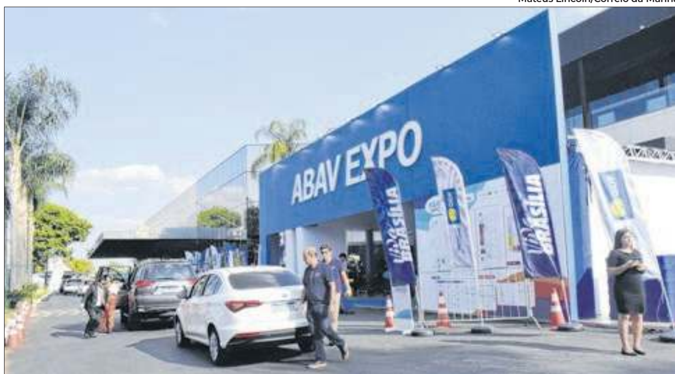
23 mil pessoas passaram pela ABAV Expo nos seus três dias

Além disso, a empresa celebrou os dez anos de parceria com a Air France-KLM — também empresa área, cuja sede fica em Paris, na França.