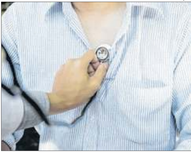
Exames preventivos evitariam 80% dos casos