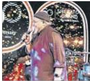
O cantor Jorge Aragão colocou os convidados para sambar, com músicas memoráveis dos seus 40 anos de carreira

forma tributária no grupo especial criado na Comissão de Assuntos Econômicos (CAE) do Senado, Izalci Lucas (PL-DF), estará na terça-feira (1) em almoço no grupo de Lideranças Empresariais do DF (LIDE-DF) para explicar as mudanças que pretende sugerir ao projeto que foi aprovado no primeiro semestre na Câmara.