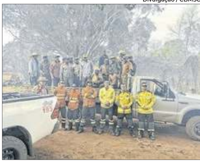
Ação em meio ao combate às chamas no Mato Grosso