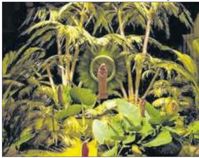
Festa centenária a partir de uma experiência diferente