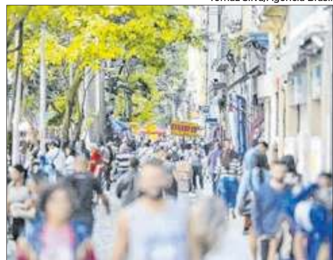
Roubos de rua cresceram 17,4% na capital fluminense