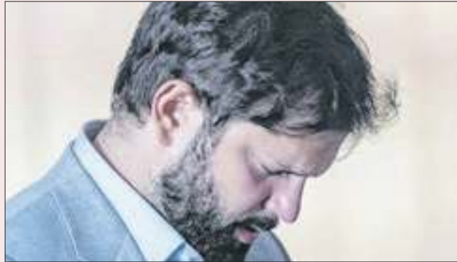
Boric: discurso à esquerda que critica Venezuela