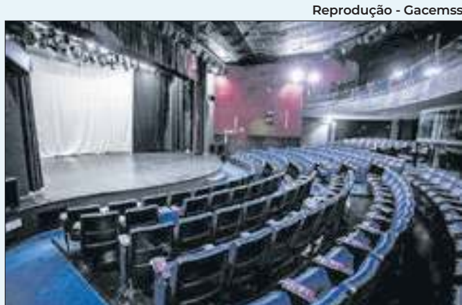
Cinemas exibem obras infantis, animações e outros gêneros

com participação de oito MC's. O evento também servirá como uma seletiva para a rodada estadual da Batalha da Marina, realizada em Niterói, no Rio de Janeiro.