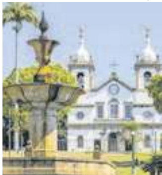
Centro de Vassouras