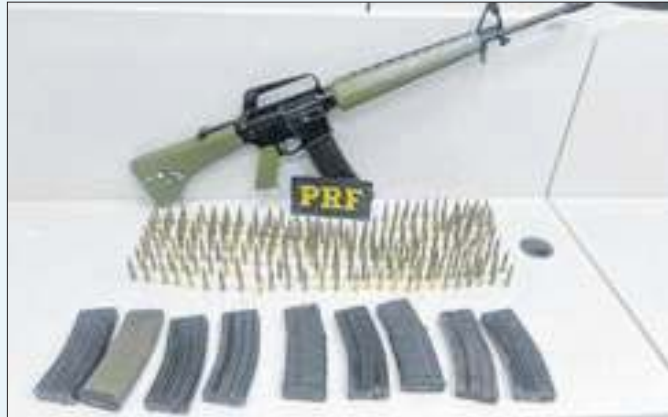
Armamento de guerra foi interceptado na Ponte