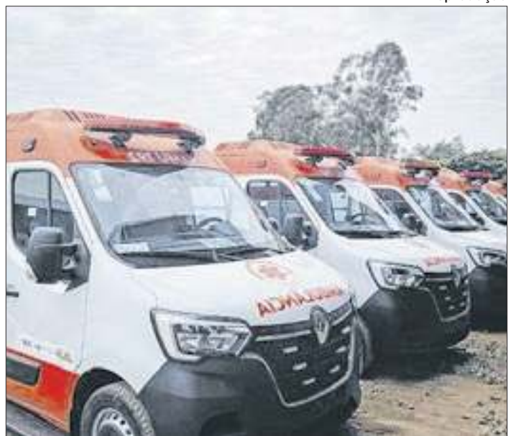
Projetos vão viabilizar políticas públicas em diversas áreas

Em todo o país foram selecionadas 6.778 obras e equipamentos de Estados e municípios que inscreveram as propostas pela plataforma Transferegov, gerida pelo Ministério da Gestão e da Inovação em Serviços Públicos. A cidade terá ainda, uma Escola de Educação Infantil, obra selecionada anteriormente na RESOLUÇÃO CGPAC N° 1, DE 19 DE DEZEMBRO DE 2023.