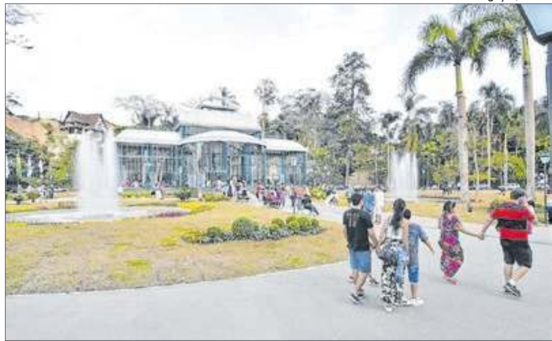
Palácio de Cristal em Petrópolis

Os pontos turísticos históricos seguem com relevância para a atração de turistas e o uso deles em eventos e atra-