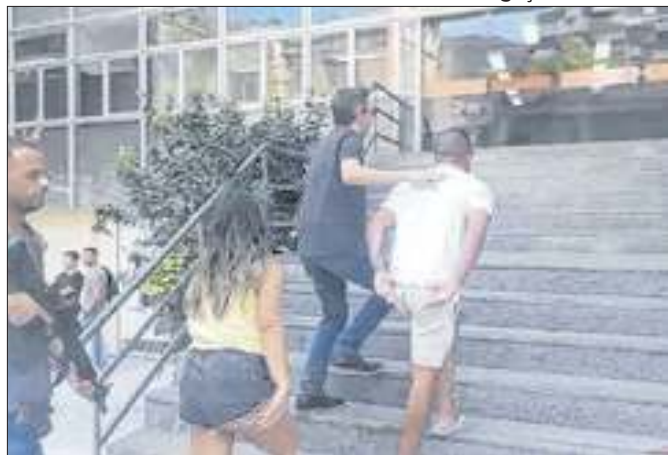
Casal criminoso impôs prejuízo de R$ 20 mil ao hotel