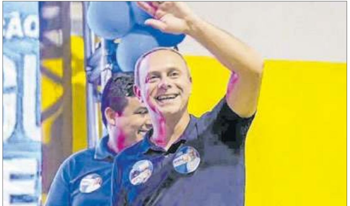
O candidato a prefeito Dudu Reina (PP) lidera a pesquisa de intenção de voto

Uma nova pesquisa de intenção de voto para a Prefeitura de Nova Iguaçu, realizada pelo Ipec (ex-Ibope) e divulgada nesta quinta-feira (26), aponta vitória de Dudu Reina (PP) no primeiro turno. O candidato apoiado pelo prefeito Rogerio Lisboa lidera a corrida eleitoral na cidade com 45%, mais do que a soma de seus adversários. Em relação ao último levantamento, Dudu Reina cresceu um ponto percentual.