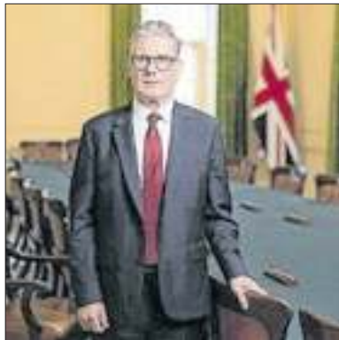
Starmer endossou o pedido

Gabinete do Primeiro Ministro do Reino Unido