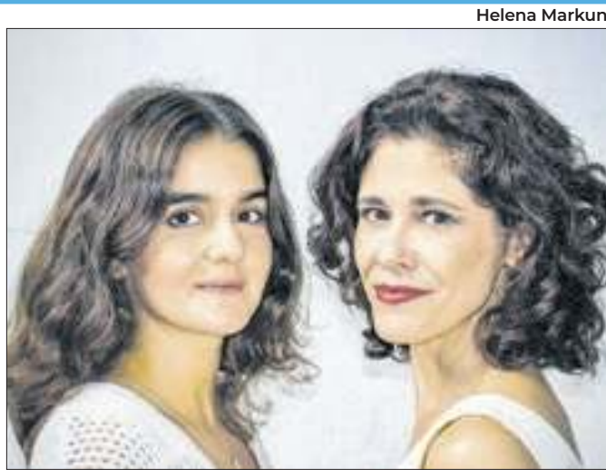
Peça foi um grande sucesso na década de 1990