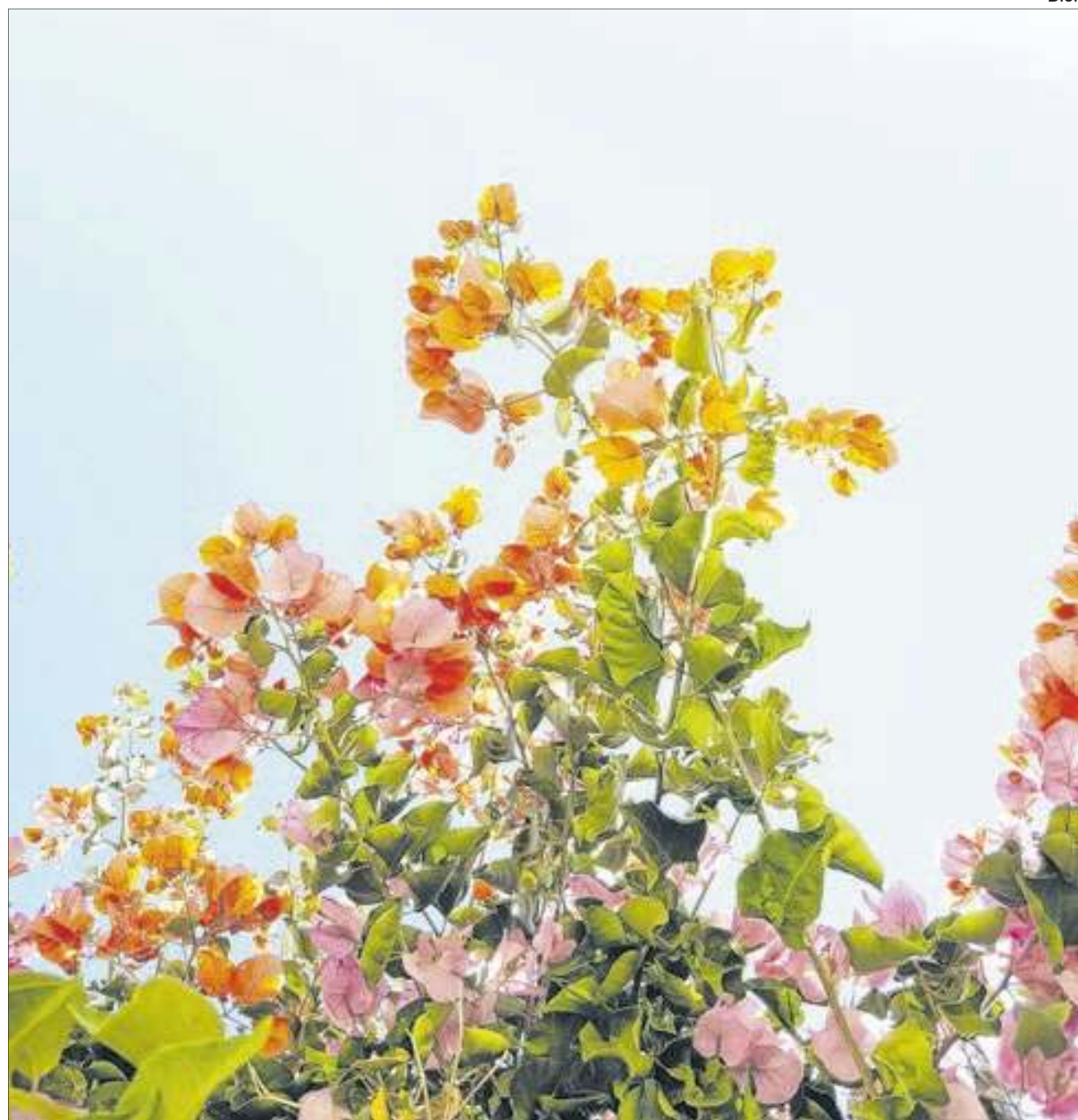
Chegamos a estação das flores, a primavera, e o início das temperaturas elevadas no Rio

Entre as sugestões da casa, estão a Pizza de Burrata (a partir de R$96), com massa de farinha italiana de longa fermentação, molho de tomate pelati, mozzarella, tomate, burrata de búfa-