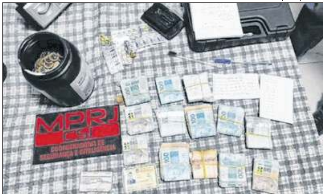
Operação do MPRJ capturou, inicialmente, vários bolos de dinheiro em espécie