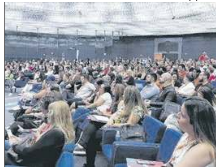
Encontro de profissionais movimentará categoria