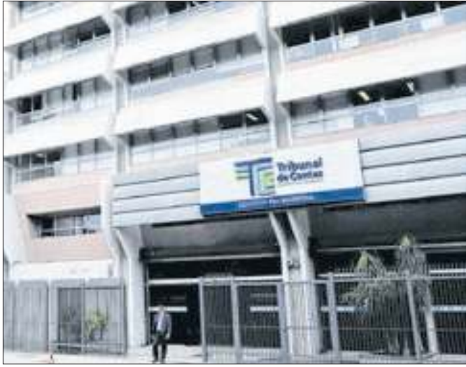
Sede do Tribunal de Contas do Estado do Rio de Janeiro