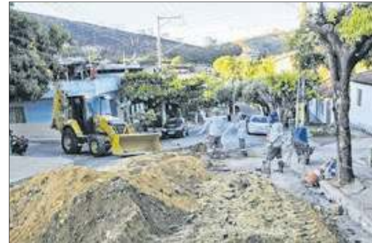
Cerca de 3,3 mil moradores serão beneficiados

A Rio+Saneamento está investindo, constantemente, na expansão do saneamento básico em diversas cidades do interior do Estado do Rio de Janeiro. Na região Norte Fluminense, as ações vêm se intensificando com obras de extensão de redes de água e esgoto, nos municípios de São Fidélis, Carapebus e São José de Ubá. Os investimentos somam mais de R$ 5 milhões e vão beneficiar cerca de 3,3 mil pessoas com mais qualidade de vida.