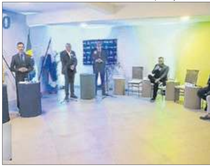
Debate foi promovido pelo Grupo Giro e TV Petrópolis