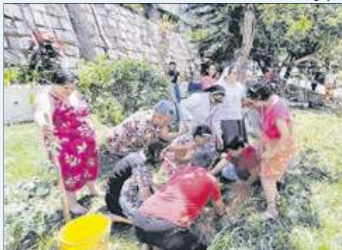
Ação de plantio de mudas pelo Dia da Árvore