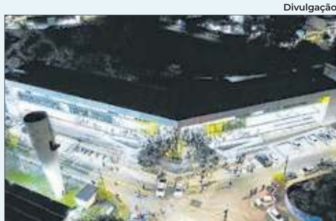
Nova sede da Prefeitura Municipal de Queimados