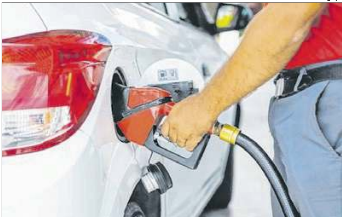
Com recuo, Fortaleza tem a 3ª maior queda nos preços na prévia da inflação

A Região Metropolitana de Fortaleza apresentou, em setembro de 2024, uma deflação de 0,14% no Índice Nacional de Preços ao Consumidor Amplo 15 (IPCA-15), considerado a prévia da inflação oficial. Esse foi o terceiro maior recuo de preços entre as capitais brasileiras. Os dados foram divulgados pelo Instituto Brasileiro de Geografia e Estatística (IBGE) nesta quarta-feira (25).