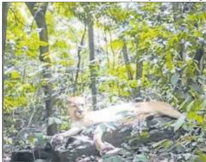
Onça-parda é flagrada por câmera de monitoramento