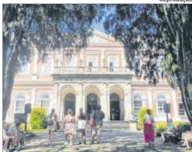
Setor do Turismo é essencial para a economia da cidade