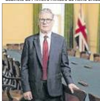
Starmer endossou o pedido

do Conselho de Segurança da ONU. A ideia da reforma do Conselho visa ter mais equilíbrio nas decisões, já que o Conselho atualmente é formado por EUA, Rússia, China, França e Reino Unido, que têm grandes rivalidades.