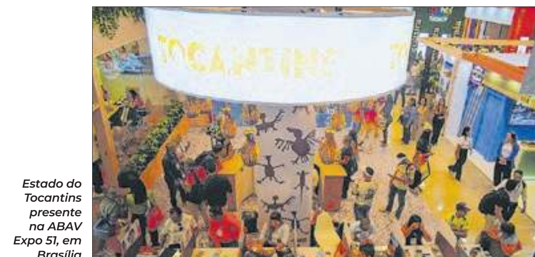
Estado do Tocantins presente na ABAV Expo 51, em Brasília