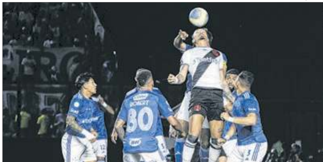
A 29ª rodada do Brasileirão será marcada pela ação "Rodada do Coração"

estão: a exibição de mensagem no Led dos jogos (placa de campo), faixa de capitão de todos os times, moeda dos árbitros, vídeos nos estádios e publicação em colaboração