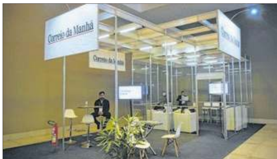
Correio da Manhã com estande na maior feira de turismo da América Latina

“Energia Inteligente: Como Economizar e Ser Sustentável no Seu Negócio”, que enfatizou a importância da transição energética para pequenas empresas e a profissionalização do setor energético. Nesse contexto, a Trilha Solar foi apresentada como uma capacitação para empresas especializadas na instalação de placas solares.