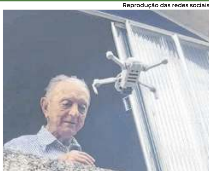
Usuária não esperava o alcance que o vídeo teve

Presidente da CLDF chamou o senador Cleitinho de “cretino”