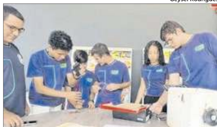
Sistema será útil em cidades que sofrem com enchentes