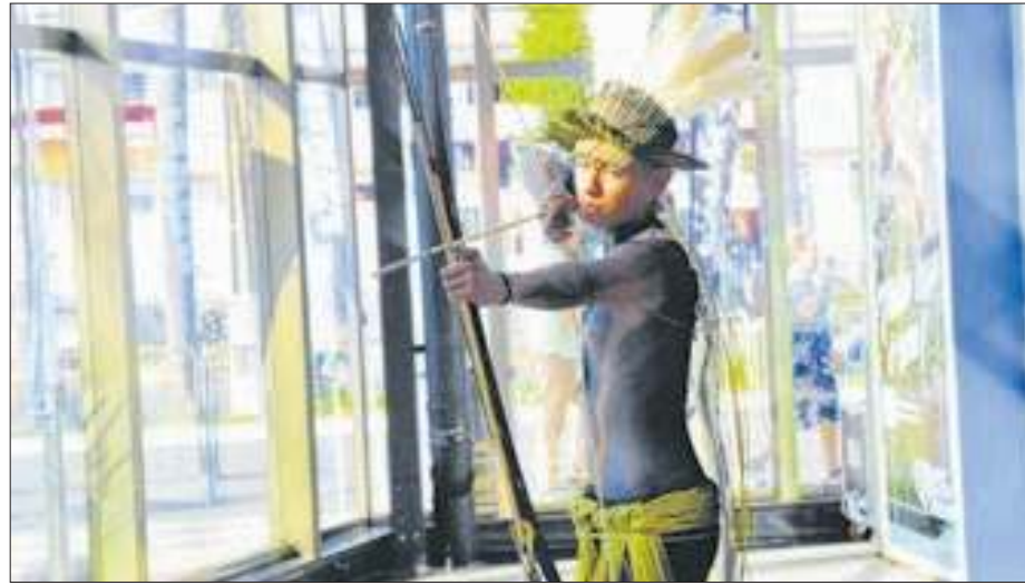
Estande do estado do Mato Grosso traz vivências dos indígenas para o evento

O Serviço Brasileiro de Apoio às Micro e Pequenas Empresas (Sebrae) lançou a palestra “De Olho no Turismo de Experiências – Como Acessar o Turista”, que trouxe estratégias para atrair e engajar visitantes em um cenário turístico em constante evolução. Além disso, foi abordado o tema