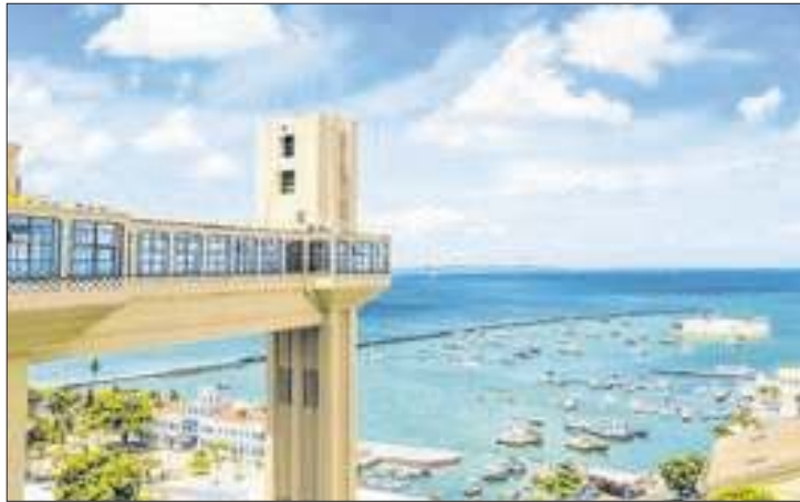
A metodologia foi desenvolvida por Harvard