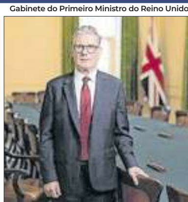
Starmer endossou o pedido

Keir Starmer, primeiro-ministro do Reino Unido, falou na Assembleia Geral da ONU e se juntou ao presidente da França, Emmanuel Macron, para pedir que Brasil, Índia, Japão e Alemanha sejam incluídos nas cadeiras permanentes