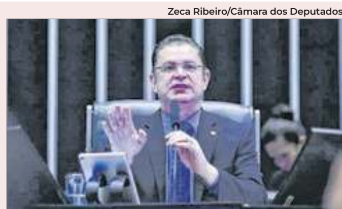
Sóstenes diz sempre votar contra jogos de azar

O ambiente controlado do Assis, afirma, impede o uso de dados falsos que tenham, por exemplo, sido introduzidos num outro sistema para treinamento. Ressalta que no TJRJ, não foi reportado “qualquer erro de alucinação gerado em cima de um processo judicial real”.