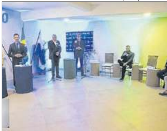
Debate foi promovido pelo Grupo Giro e TV Petrópolis