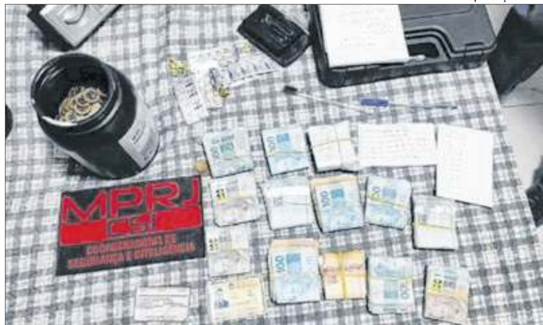
Operação do MPRJ capturou, inicialmente, vários bolos de dinheiro em espécie