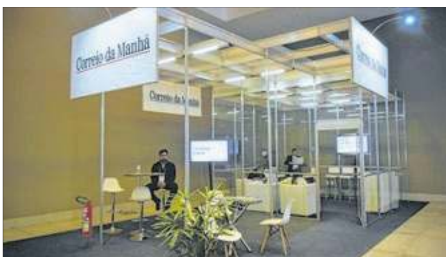
Correio da Manhã com estande na maior feira de turismo da América Latina

“Energia Inteligente: Como Economizar e Ser Sustentável no Seu Negócio”, que enfatizou a importância da transição energética para pequenas empresas e a profissionalização do setor energético. Nesse contexto, a Trilha Solar foi apresentada como uma capacitação para empresas especializadas na instalação de placas solares.