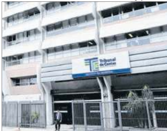
Sede do Tribunal de Contas do Estado do Rio de Janeiro