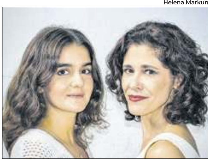
Peça foi um grande sucesso na década de 1990