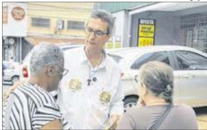
Candidato quer criar um núcleo de desenvolvimento do esporte paralímpico e de inclusão