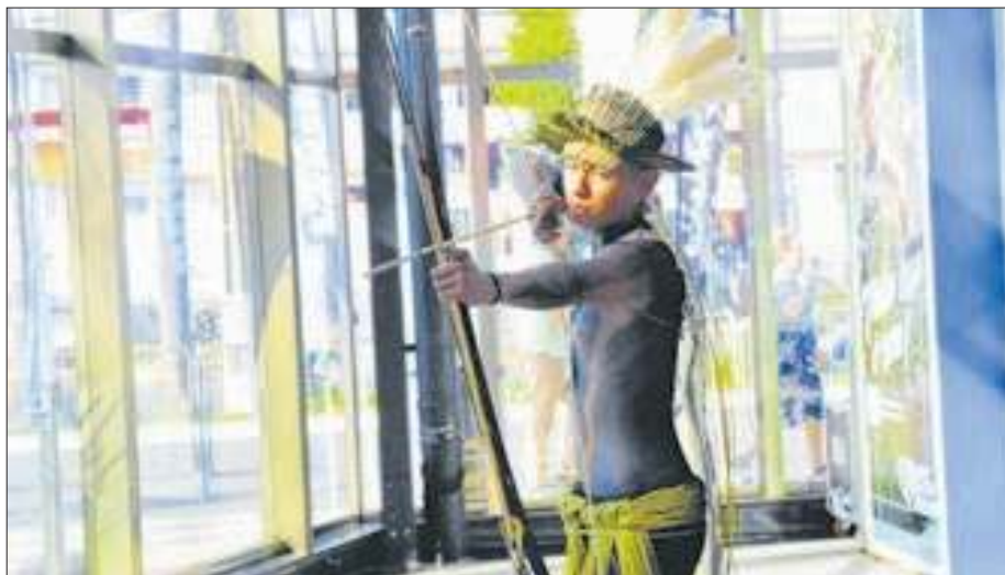
Estande do estado do Mato Grosso traz vivências dos indígenas para o evento

O Serviço Brasileiro de Apoio às Micro e Pequenas Empresas (Sebrae) lançou a palestra “De Olho no Turismo de Experiências – Como Acessar o Turista”, que trouxe estratégias para atrair e engajar visitantes em um cenário turístico em constante evolução. Além disso, foi abordado o tema