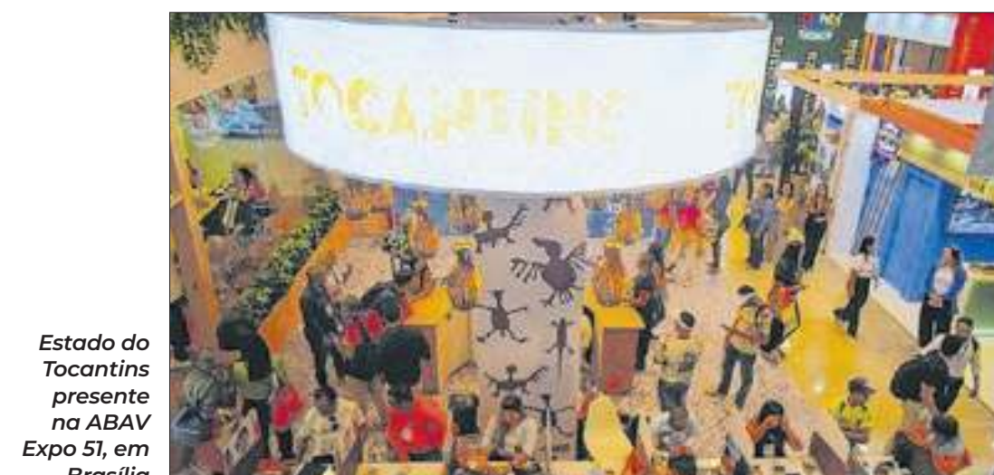
Estado do Tocantins presente na ABAV Expo 51, em Brasília