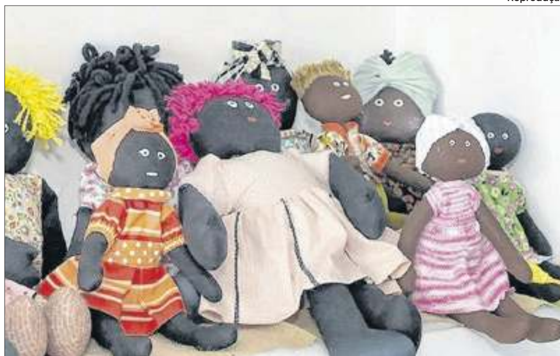
No ano de 2023, a campanha arrecadou 375 bonecas pretas

Projeto distribui brinquedos visando autoestima e igualdade