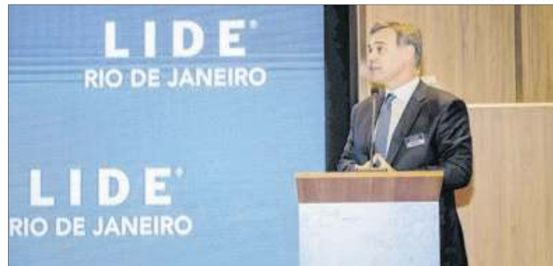
Ministro André Mendonça durante o almoço empresarial