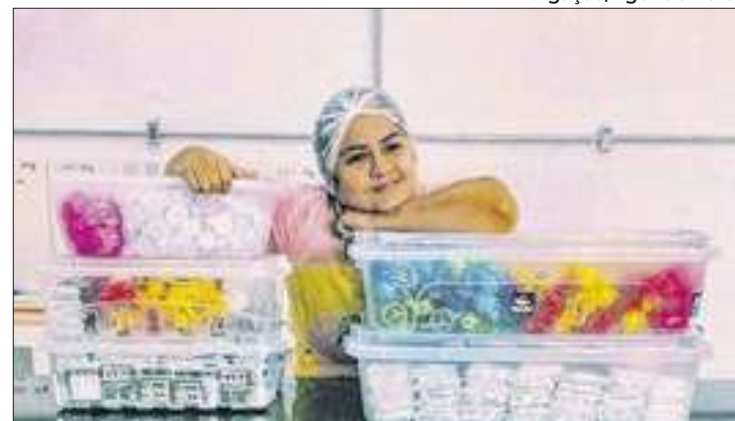
Festival divulga a Amazônia como produtora de cacau