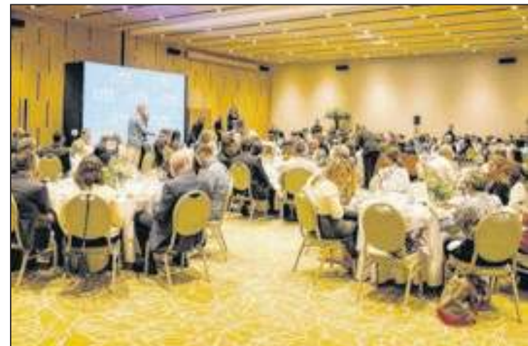
O almoço empresarial foi realizado no salão de eventos do Fairmont Copacabana, na última segunda (23)