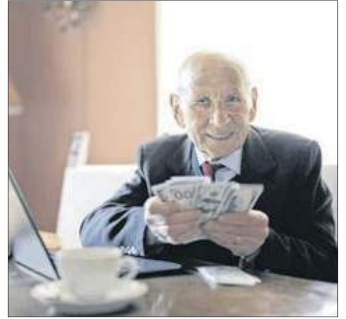
Aposentadoria compulsória merece revisão urgente