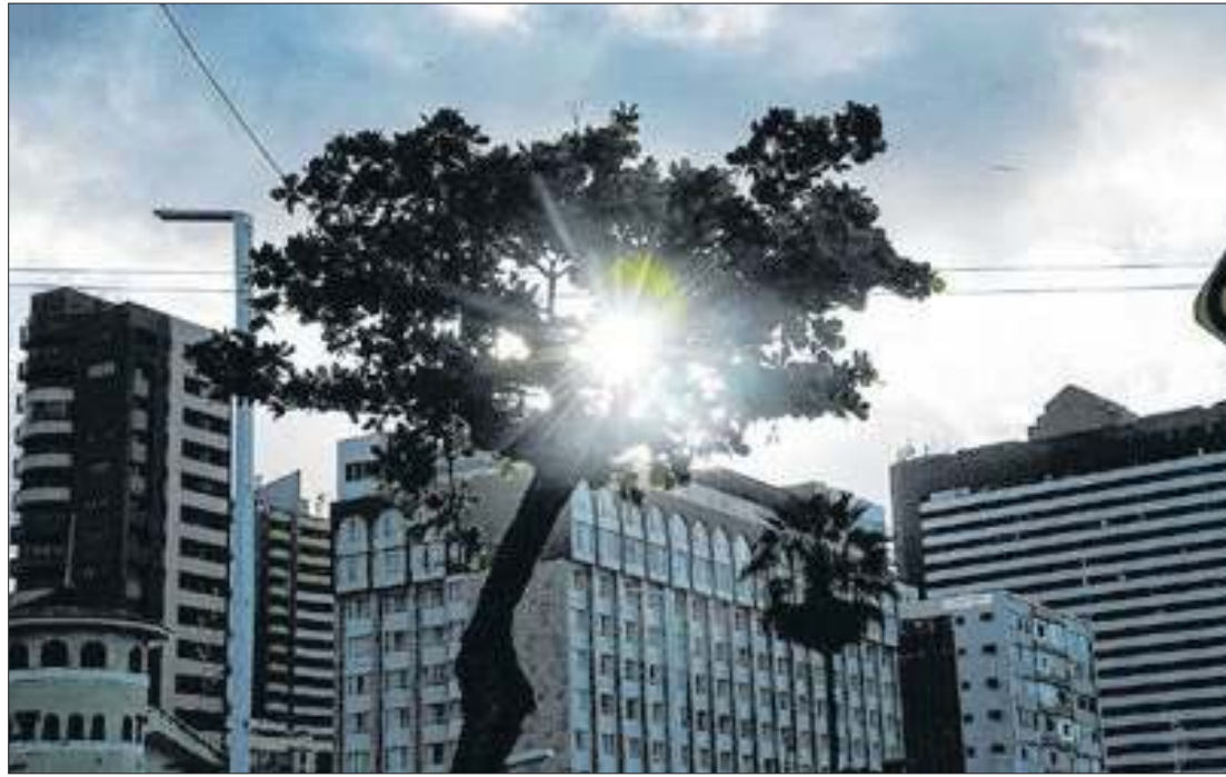
Condições estáveis do sol pedem cuidados extras com a saúde

Na Região Metropolitana, as temperaturas máximas podem atingir 33°C, enquanto as mínimas devem ficar em torno de 24°C. Os dados meteorológicos também indicam que a umidade deve permanecer em níveis baixos, com mínimas em torno de 20% em algumas áreas do centro-sul do estado. Essa