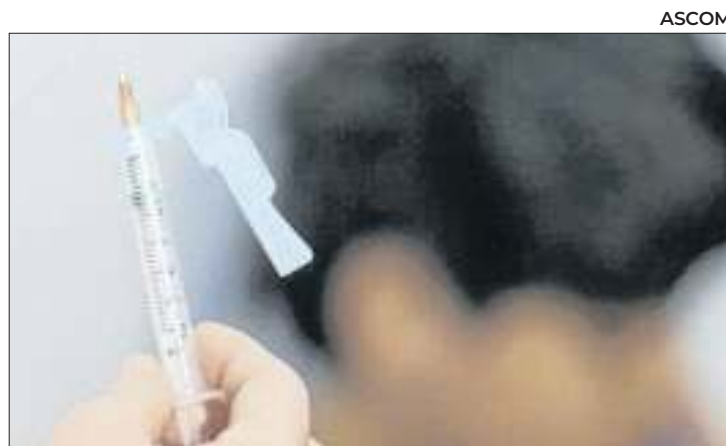
Ministério da Saúde distribuiu 4,7 milhões de doses

A continuidade da fiscalização é fundamental para a proteção do bioma e para a responsabilização dos responsáveis por ações ilegais.