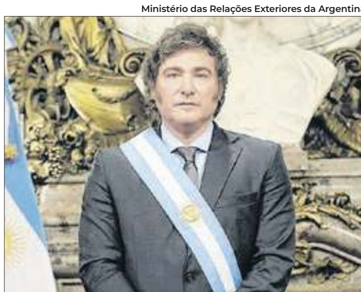
Milei discursou na Assembleia-Geral da ONU pela primeira vez

Segundo ele, trata-se de um "programa supranacional de natureza socialista, que pretende resolver os problemas da modernidade com soluções que atentam contra a soberania