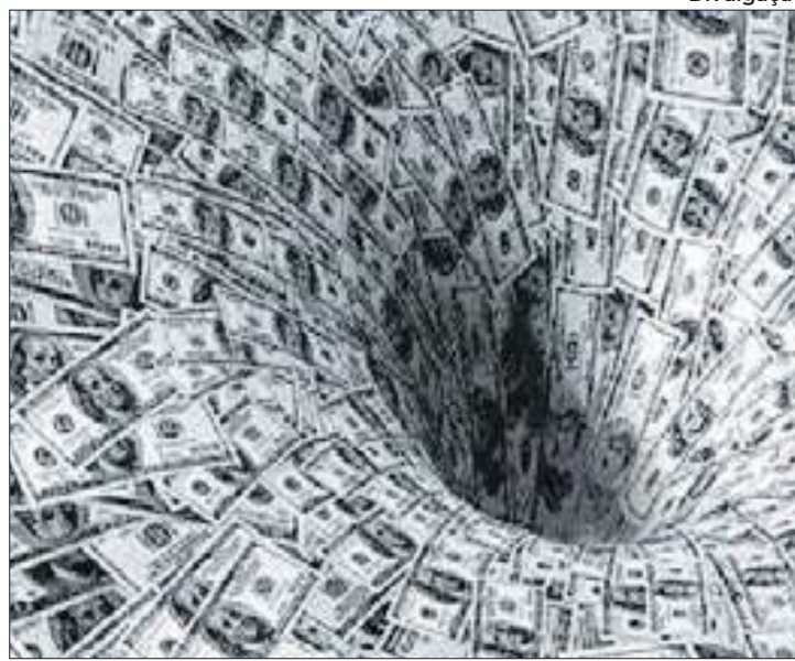
Calamidades acabam sendo pretexto para desajuste fiscal

Apesar de repetir o ‘discurso’ esgarçado de que é factível obter um resultado dentro da meta fiscal (percentual em relação ao PIB), ou seja, um déficit de até R$ 28,8 bilhões, o que implicaria um rombo efetivo de R$ 68,8 bilhões, no segundo ano do governo do ex-torneiro mecânico. A ‘mágica’ fiscal, porém, não evita o crescimento