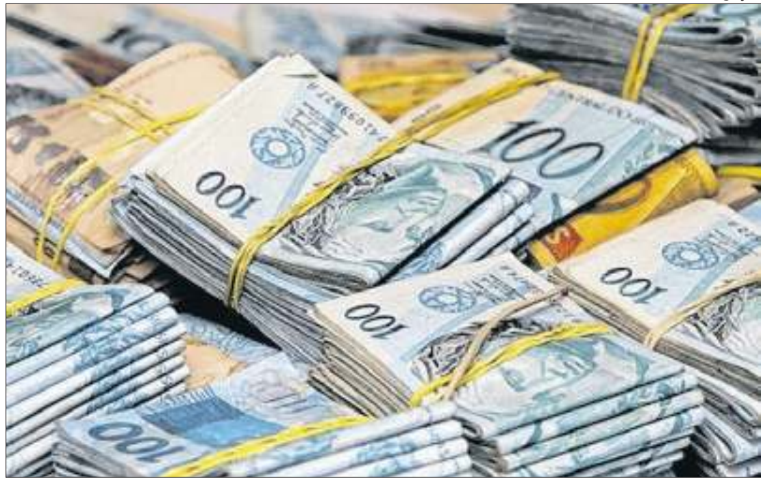
Para ex-secretário, sem corte de gastos, não há como atingir o equilíbrio fiscal

A afirmação de Benevides Filho ganha mais relevância porque vai na contramão da mentalidade perdulária da esquerda, mesmo este tendo sido responsável pelas finanças cearenses na gestão do governador petista, Camilo Santana, atual ministro da Educação. Na ocasião, o então secretário se notabilizou por colocar as contas