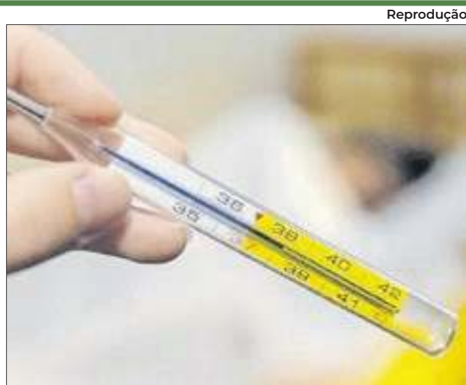
Anvisa oficializou o veto na terça