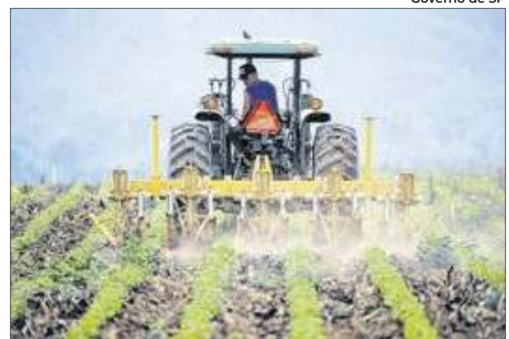
Agro Jovem quer reduzir o êxodo rural da juventude em SP

Para implementar o programa, o Governo de São Paulo pretende se aproximar dessa importante parcela da população. "O primeiro passo é promover eventos de escuta da juventude rural em municípios estratégicos, onde serão coletadas opiniões e necessidades dos jovens do campo. Assim, iremos elaborar uma proposta de trabalho mais eficaz e assertiva e indicar os membros do Con-