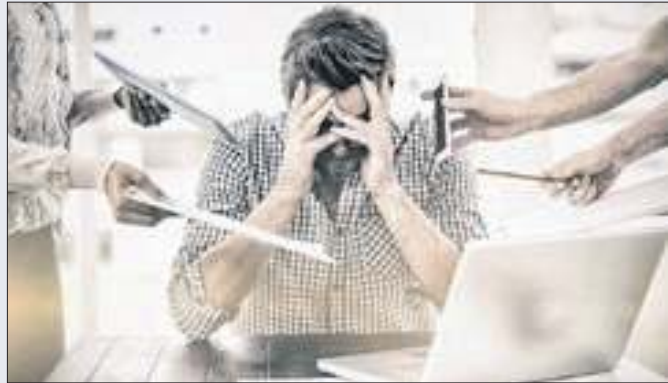
Trabalhador brasileiro está entre os mais estressados