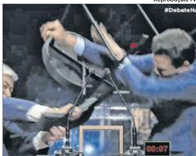
Marçal não previu a cadeirada, mas calculou a reação