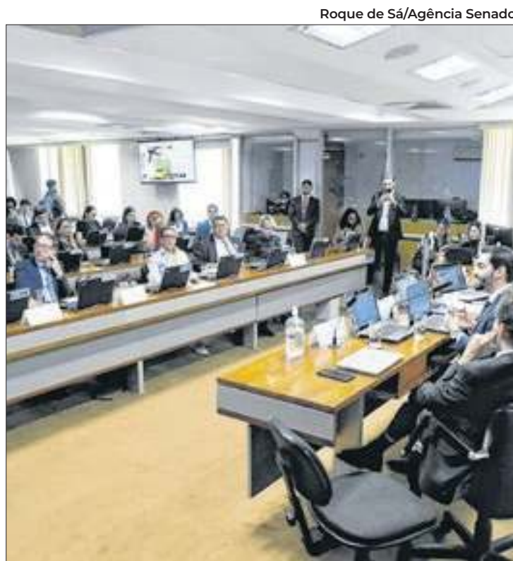
Última audiência da comissão da CAE será nesta terça

A reforma tributária unifica cinco tributos (ICMS, ISS, IPI, PIS e Cofins) cobrados sobre consumo e produção no Imposto sobre Valor Agregado (IVA), que vai incidir no consumo, ou seja, no momento da venda do bem. Será um "IVA dual", composto pelo Imposto sobre Bens e Serviços (IBS) para estados e municípios e a Contribuição sobre Bens e Serviços (CBS), para a União. O PLP 68/2024 implementa os novos tributos IBS e CBS, regulamentando alíquotas e outras questões.