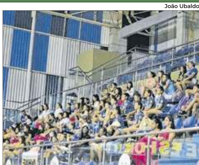
A Bahia contará com doze atletas de quatro clubes