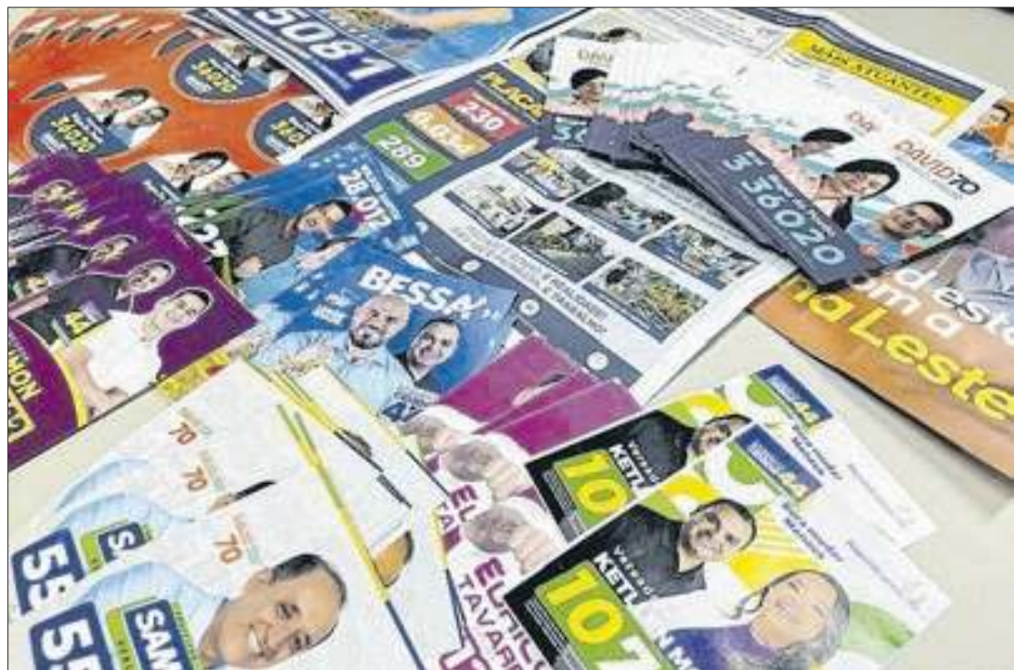
Material de campanha se acumula nas ruas e casas de moradores

Eleitores de diferentes zonas de Manaus relatam a quantidade exagerada de material. Um morador do bairro São José, na zona leste, contou que em pou-