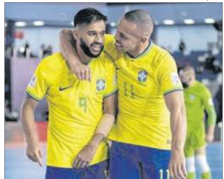
Brasil avançou para as quartas de final da Copa do Mundo

O Brasil segue na Copa para tentar chegar ao sonho do hexacampeonato. Com cinco títulos mundiais, ninguém foi mais vezes Campeão da Copa do Mundo de Futsal que a Seleção Brasileira.