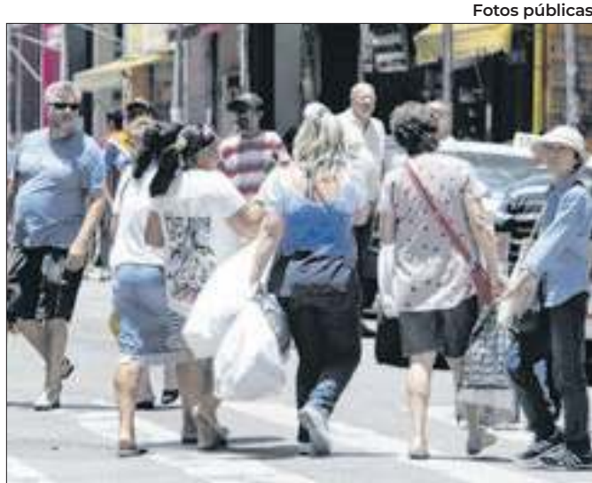
Expectativa positiva no curto prazo pesou no índice

Alerta foi dado pelo deputado de esquerda, Mauro Benevides Filho