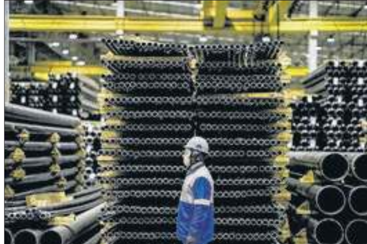
O boletim reúne as mais recentes estatísticas econômicas

O Governo do Estado de Santa Catarina, por meio da