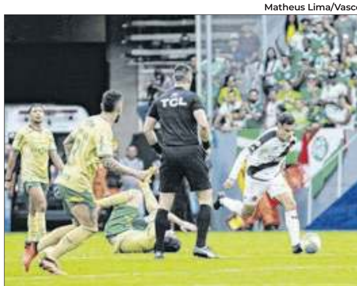
FFERJ criticou a péssima arbitragem de Vasco x Palmeiras

"O Departamento de Arbitragem do Futebol do Rio de Janeiro, com os dados disponíveis e divulgados, analisou o lance polêmico de Vasco x Palmeiras.