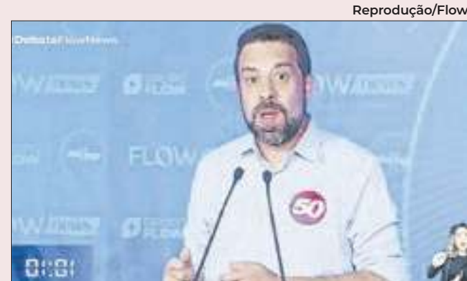
Candidato do PsoL equiparou Marçal a Nunes