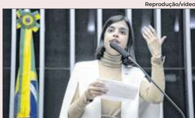
Tábata adota palavrões ao estilo Marçal

Talvez seja mesmo o caso de se questionar se em algum momento Marçal esperava mesmo vir a ser prefeito. Ou se sua intenção era tão somente ganhar o destaque que ganhou. Até por interesses não políticos, como, aliás, denunciou algumas vezes Tábata Amaral (PSB).