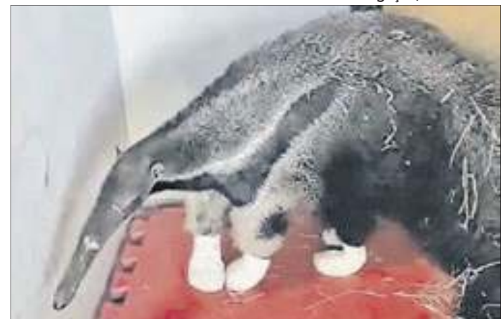
As quatro patas da tamanduá foram enfaixadas para permitir a cicatrização

Tratamento com pele de tilápia - Segundo o Zoo Bra-