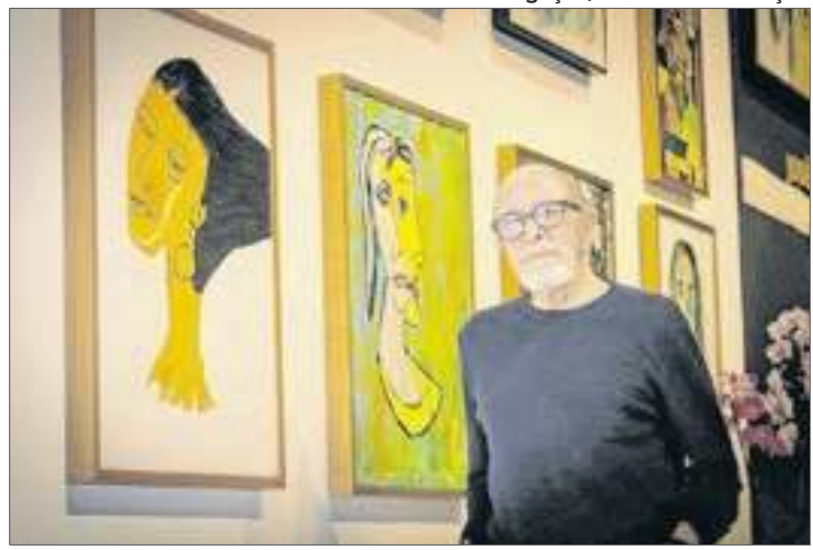
O artista e advogado, em sua galeria particular

Nos últimos anos, suas obras ganharam destaque em espaços renomados, como o Espaço Oscar Niemeyer, a galeria do CasaPark e, atualmente, no Instituto Pernambuco Porto, em Portugal, na exposição “Brasi-