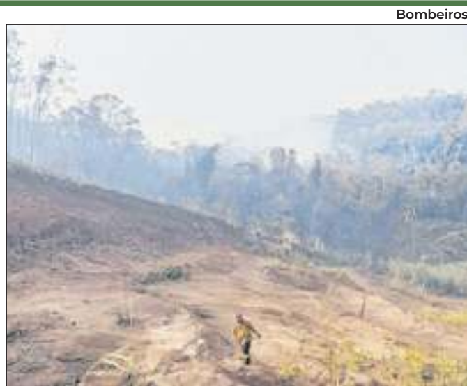
O Paraná registrou 11.927 incêndios florestais em 2024