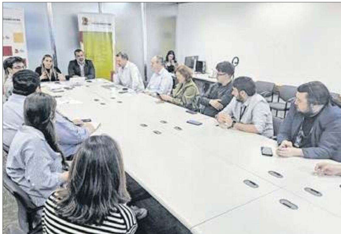
A apresentação dos resultados ocorreu nesta terça (24),

A indústria apresentou retração de 1,7% no segundo trimestre, influenciada pelo desempenho negativo de 6,5%