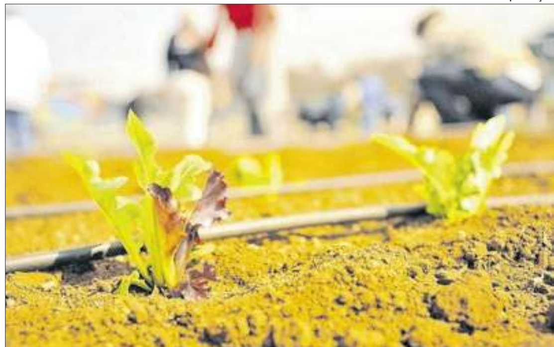
País deixaria de emitir 18 milhões de toneladas de gás carbônico

"As gramíneas representam a base da alimentação mundial humana e animal. São plantas como, trigo, milho, milheto, aveia e diversas outras e são base para a alimentação. Além