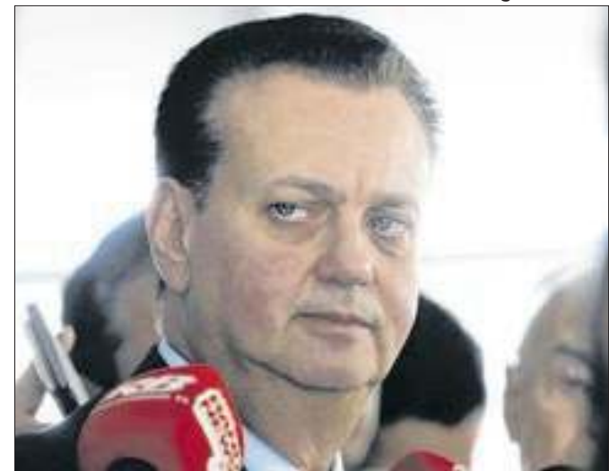
O ex-prefeito paulistano é aliado de Tarcísio de Freitas