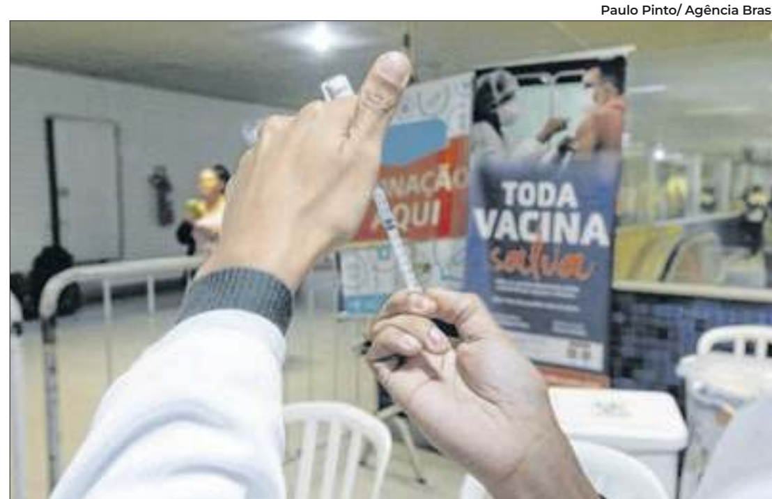
Descuido com vacinação pode ser um dos motivos da volta da covid

Entre as novidades, estão os cursos de engenharia civil em Nova Andradina, fonoaudiologia e terapia ocupacional em Campo Grande.