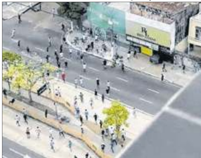
Briga antecedeu partida da série B do Brasileiro.