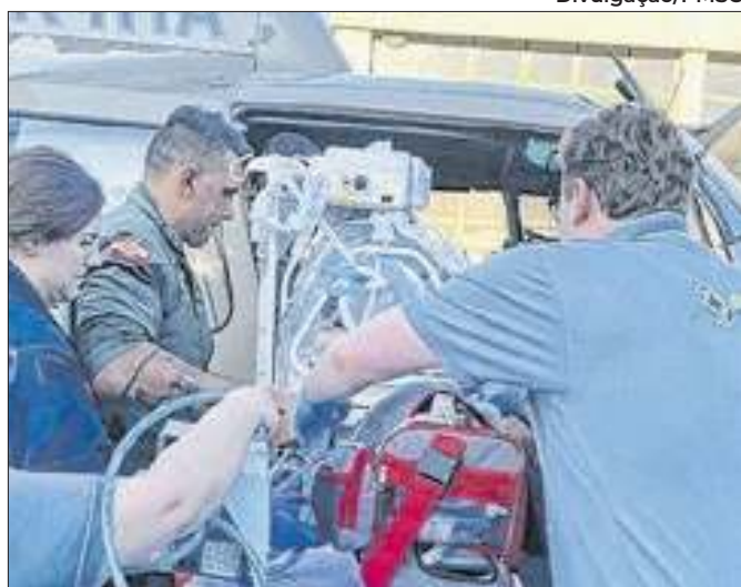
O bebê apresentava insuficiência respiratória