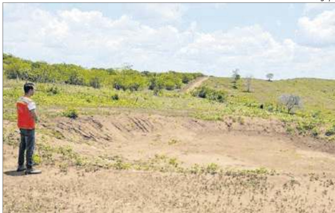
Defesa Civil de Sergipe intensifica ações para combater a seca

Municípios em emergência recebem apoio e capacitação