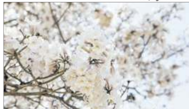
A Primavera indica o fim da estiagem.