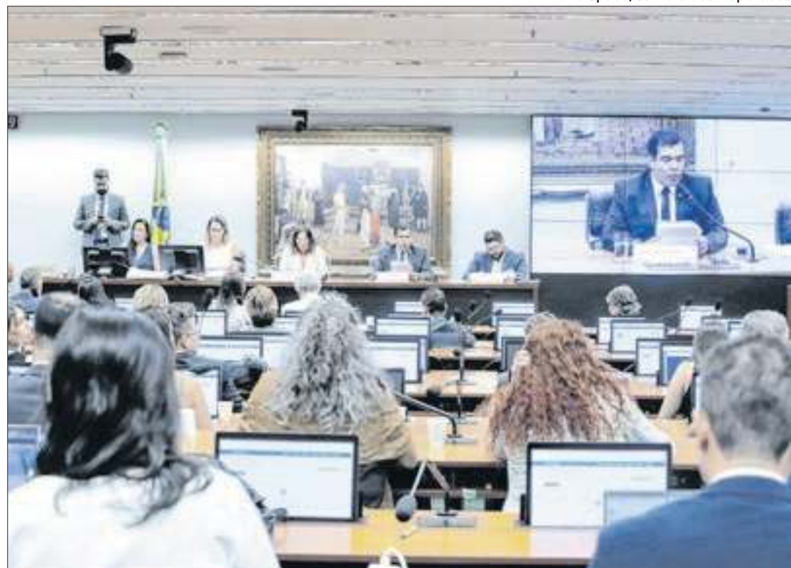
Processo de cassação foi mantido por ampla maioria

O resultado era esperado, visto que a repercussão do assassinato de Marielle teve uma