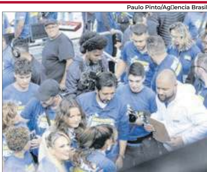
Nunes empata com Marçal em segundo, diz Atlas