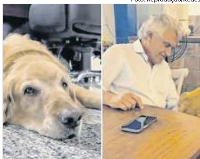
Cão esteve com o governador e família por 12 anos

Descuido com a vacinação e o clima estão entre as explicações