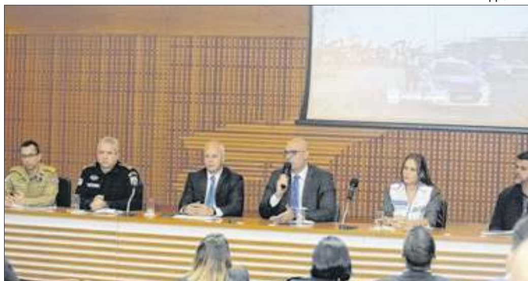
Êxito no esquema operacional consolida a expertise do estado em grandes eventos