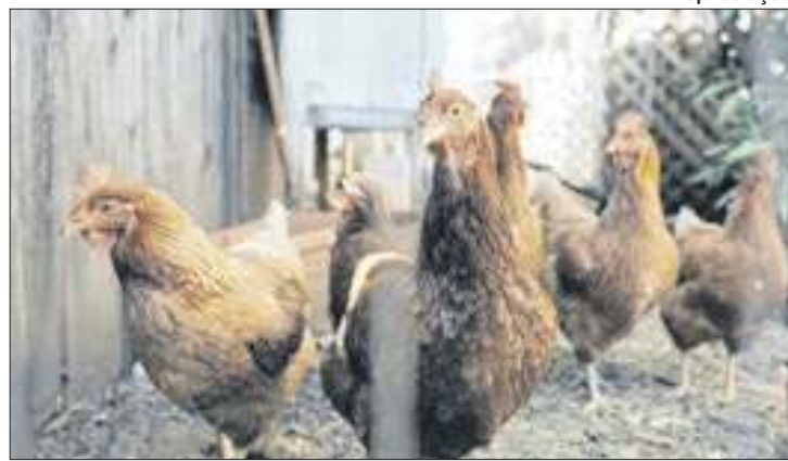
O efetivo dos rebanhos foi contabilizado pelo IBGE