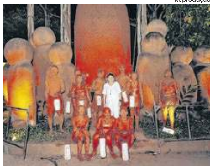
A ideia é criar um novo atrativo na Costa do Cacau