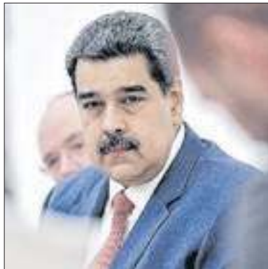
Venezuela tenta normalizar