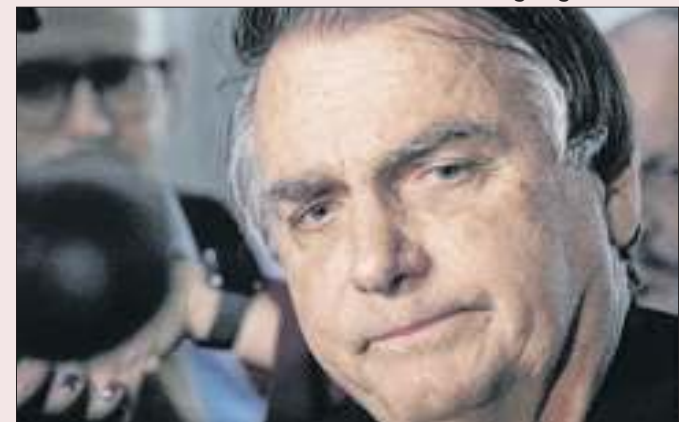
Ex-presidente teme perder controle da direita