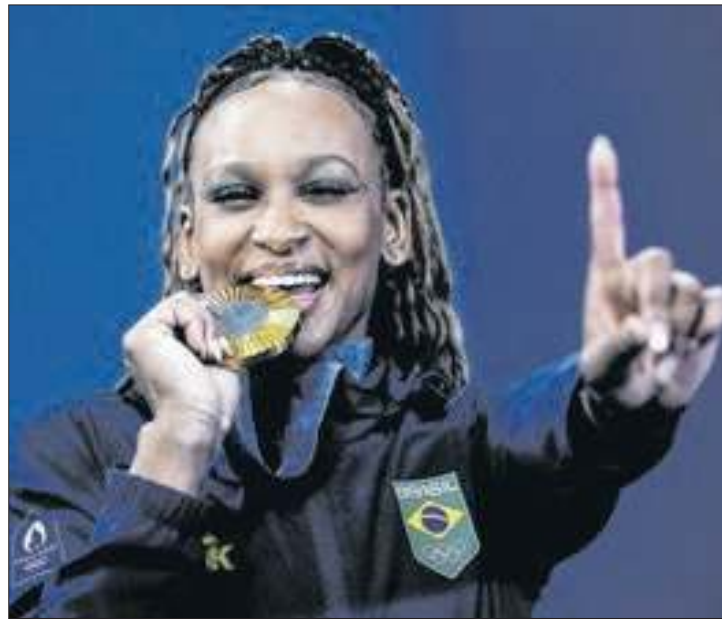
Rebeca Andrade recebe a bolsa de valor mais alto

A portaria ainda definiu que serão excluídos do programa os atletas com "participação comprovada na manipulação de apostas e resultados esportivos". O envolvimento em apostas também impede a solicitação da bolsa.