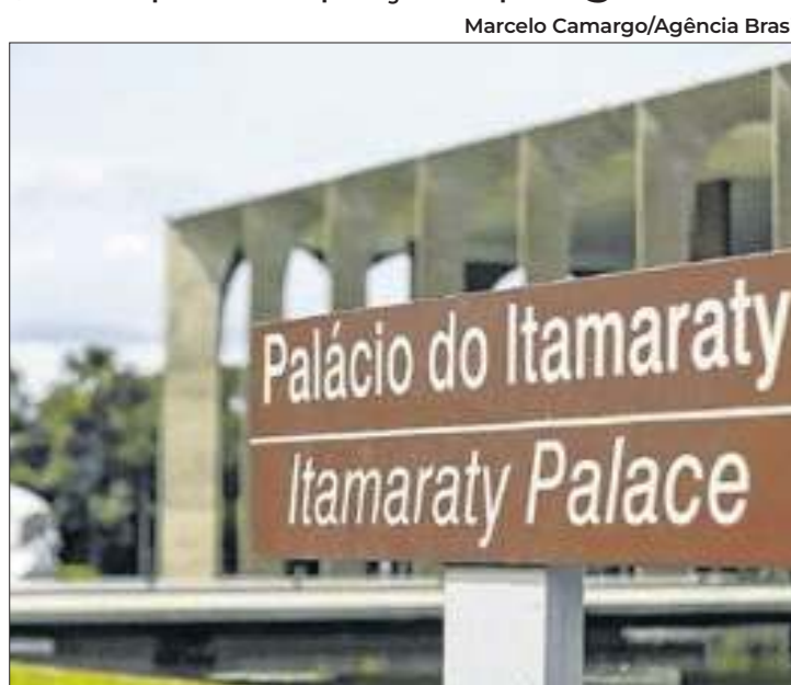
Brasil condenou bombardeios israelenses ao Líbano

Somente hoje, os ataques causaram ao menos 492 mortes e deixaram mais de 1,6 mil feridos. Em nota, o Itamaraty lamentou as declarações de autoridades israelenses em favor de operações militares e da