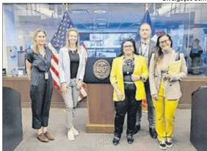
Equipe visita Agência de Gerenciamento de Emergência