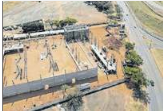
As obras do Atacadão estavam em estágio adiantado e despertaram a ira do governador Ibaneis Rocha

originário do cerrado, aliando infraestrutura, desenho urbano, arquitetônico e paisagístico de modo sintético e sistêmico, condensando as diferentes escalas de Brasília de modo unificado.”