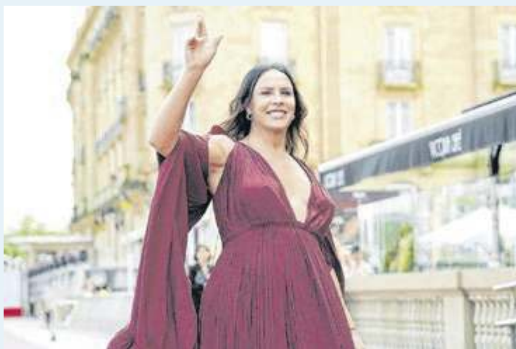
A atriz Karla Sofía Gascón estrela de Emilia Pérez