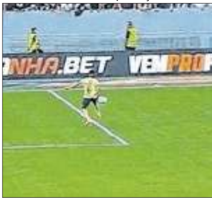
Juiz não deu nem falta no lance

A polêmica vitória do Palmeiras sobre o Vasco, com pênalti claro não marcado a favor do Cruzmaltino, fez o Ge.com realizar um levantamento que aponta que o Vasco é a equipe da Série A do Brasileirão com