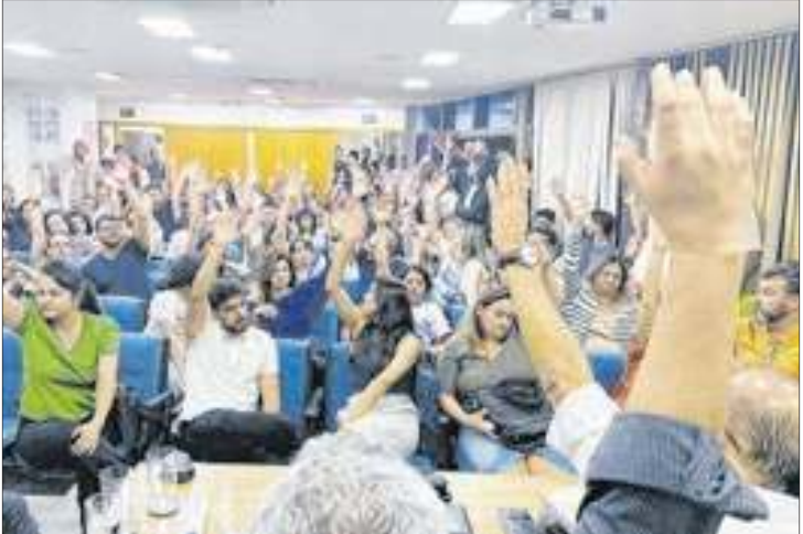
Em assembleia, médicos mantiveram estado de greve

o governo. Na próxima sexta, contradição. E um voto de