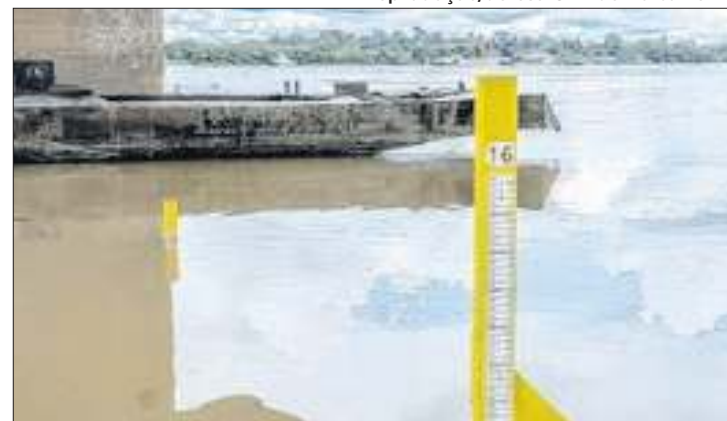
Com a seca, a navegação se tornou perigosa até de dia.