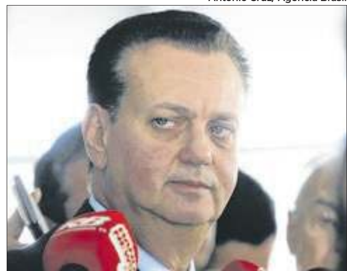
O ex-prefeito paulistano é aliado de Tarcísio de Freitas