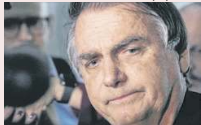
Ex-presidente teme perder controle da direita