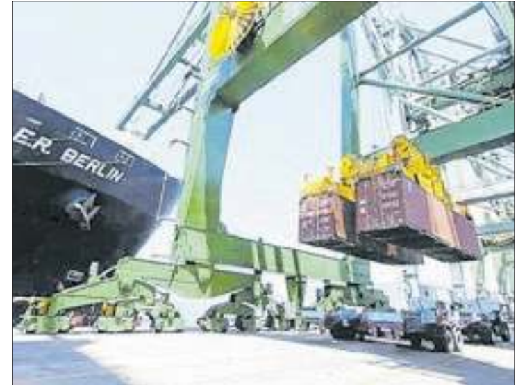
Estado do Rio registrou crescimento de 5,6%