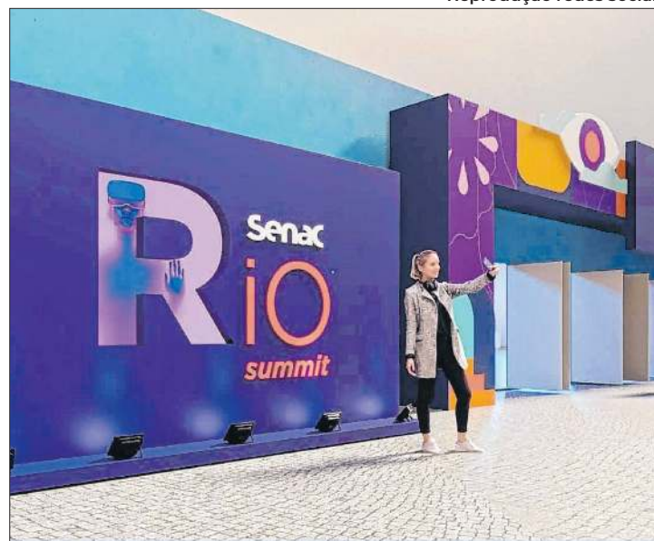
Gratuito, evento vai de 25 a 28 deste mês, no Expomag

Atividades gamificadas, escape room, oficinas de produção de vídeos virais, lambe lambe e slam são algumas das experiências disponíveis para os visitantes da segunda edição do Senac Rio Summit, que a entidade realiza de 25 a 28 de setembro, com entrada gratuita, no Expomag