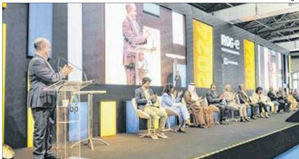
Governador Cláudio Castro participou da abertura do evento, no Pier Mauá