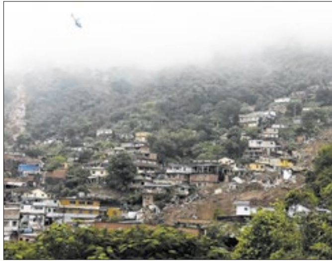
Petrópolis após a tragédia de fevereiro de 2022