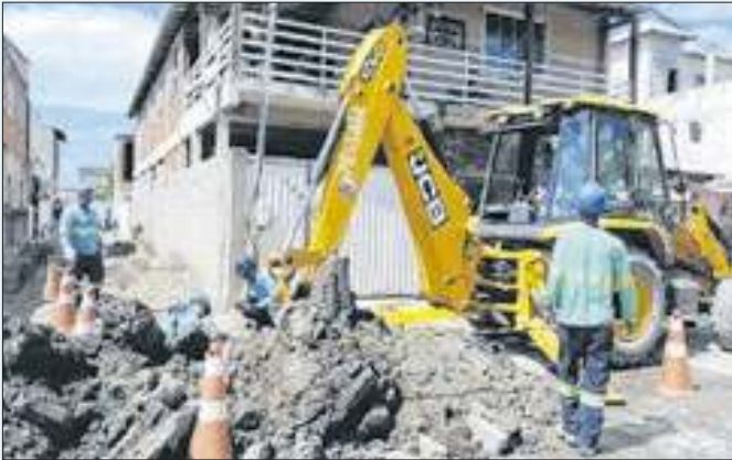
Cerca de 100 imóveis são diretamente beneficiados