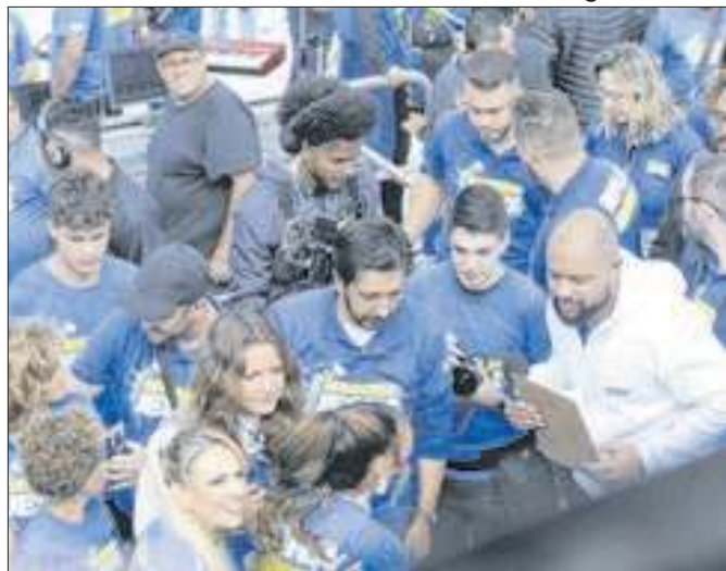
Nunes empata com Marçal em segundo, diz Atlas