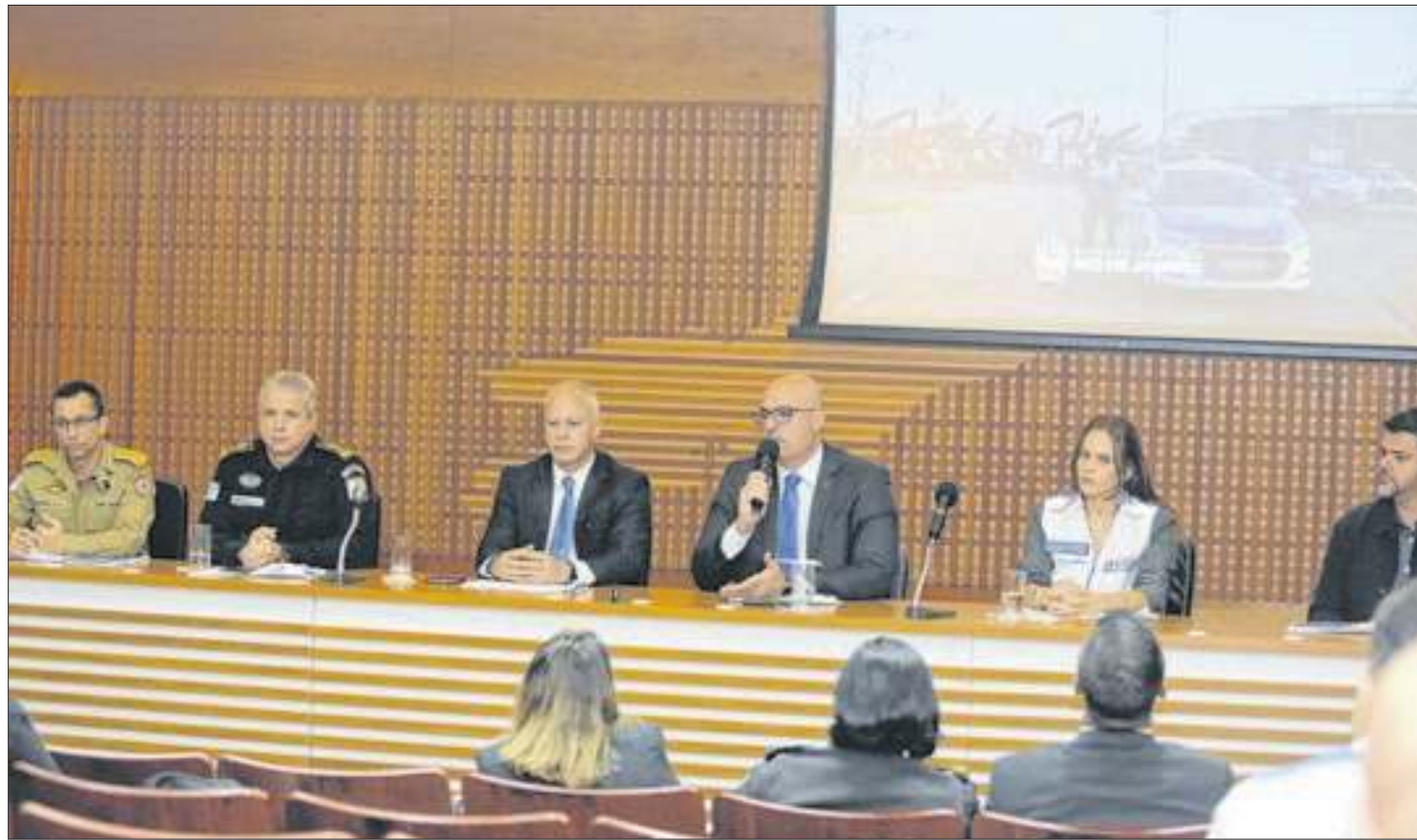
Êxito no esquema operacional consolida a expertise do estado em grandes eventos

“Não tivemos nenhuma intercorrência que atrapalhasse a realização dos eventos. Isso mostra o tamanho da expertise das nossas Forças de Segurança. Garantimos que o morador e o turista, tivessem tranquilidade e segurança. Hoje é dia de agradecer a esses agentes que trabalham dia e noite para proteger cada um de nós”, analisou o governador Cláudio Castro.