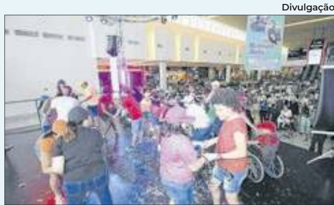
Semana da Luta da Pessoa com Deficiência em N. Iguaçu

de Residência Médica oferecidos por diversas instituições. A Secretaria Municipal de Saúde de Duque de Caxias está entre as instituições associadas ao programa de residência médica da SES RJ 2024/2025. As inscrições devem ser feitas no site www.fundatec.org.br/ .