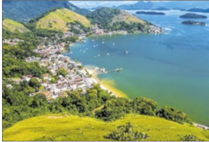
Angra dos Reis será uma das cidades monitoradas