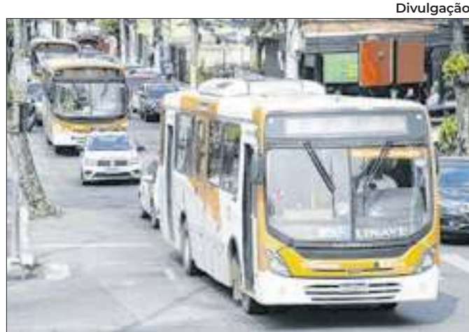
Prefeitura determina tarifa zero no dia das eleições