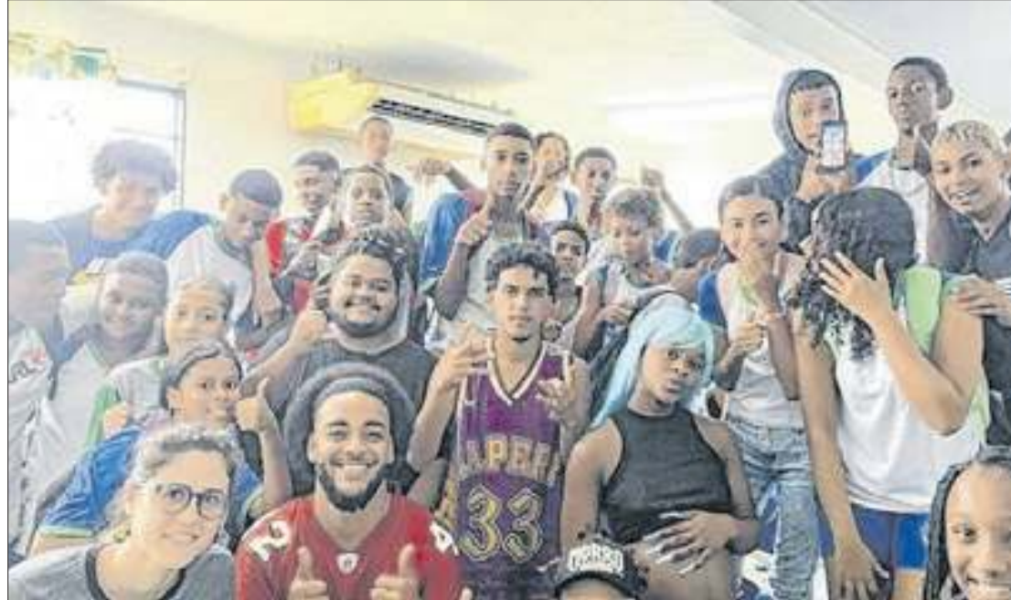
Evento será realizado na Escola Prof. Etienne, em Engenheiro Pedreira