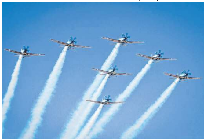
Cariocas 'apreciaram' o evento aeroespacial do ano