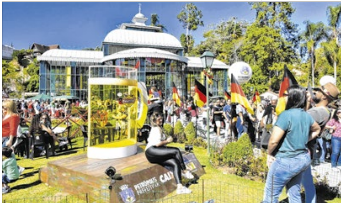
A 35ª Bauernfest aconteceu entre os dias 21 de junho e 7 de julho no Palácio de Cristal

“Eles nunca cumprem o combinado, isso não é novidade, sempre o mesmo desrespeito. Agora, no final de setembro, completam quase três meses das nossas apresentações sem o devido pagamento. Esse atraso é um total desrespeito com os trabalhadores da cultura que se dedicam, investem e se esforçam para entregar um bom trabalho e não tem nem a dignidade de receber o