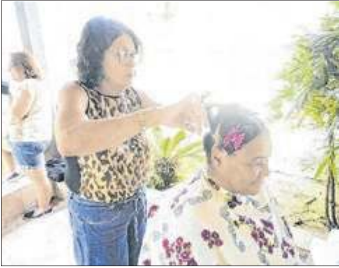
Iniciativa reuniu mais de cem alunas