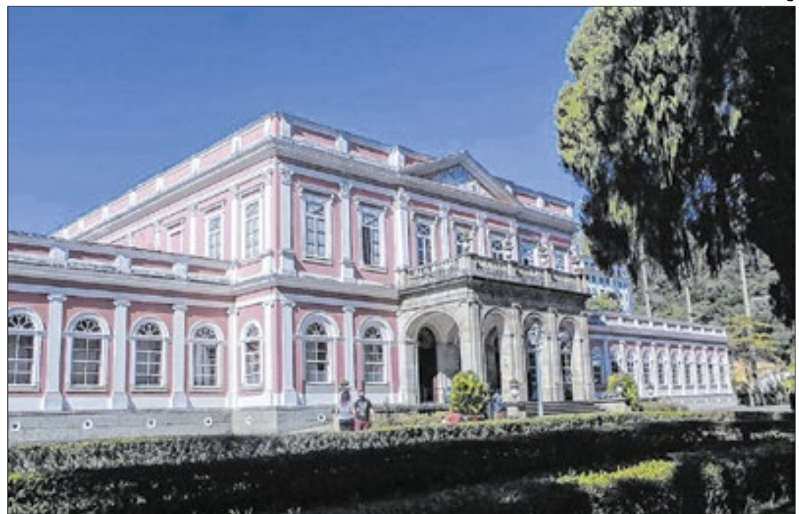
Museu Imperial está com programação especial para o público adulto e infantil

Começou nesta segunda-feira (23) e vai até o dia 29 de setembro, a 18ª Primavera dos Museus, promovida pelo Instituto Brasileiro de Museus (Ibram). Durante esse período estão previstas 2.334 atividades em museus de todo o Brasil, entre exposições, palestras, visitas guiadas e oficinas, que ocorrerão nas 930 instituições participantes.