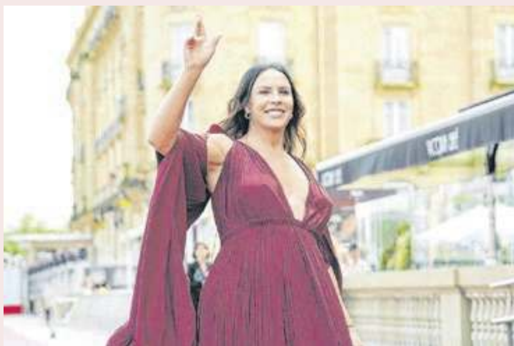
A atriz Karla Sofía Gascón, estrela de Emilia Pérez