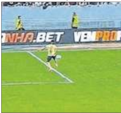
Juiz não deu nem falta no lance

A polêmica vitória do Palmeiras sobre o Vasco, com pênalti claro não marcado a favor do Cruzmaltino, fez o Ge.com realizar um levantamento que aponta que o Vasco é a equipe da Série A do Brasileirão com