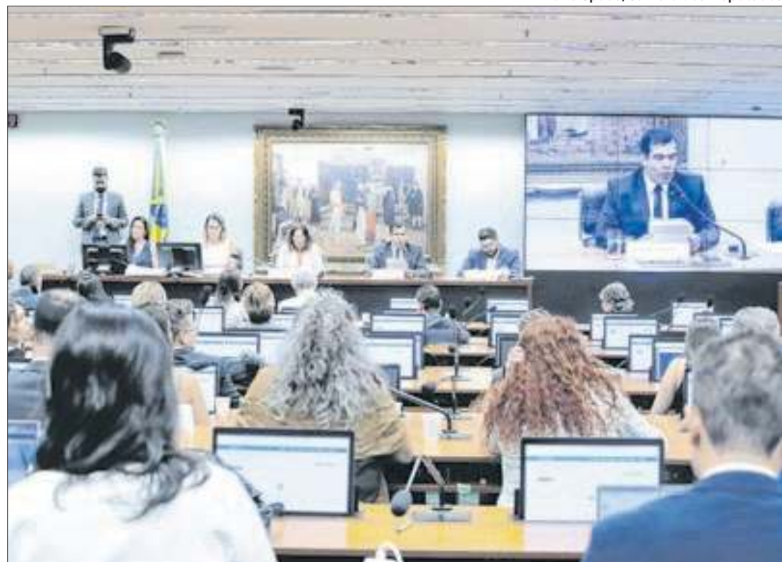
Processo de cassação foi mantido por ampla maioria

O resultado era esperado, visto que a repercussão do assassinato de Marielle teve uma