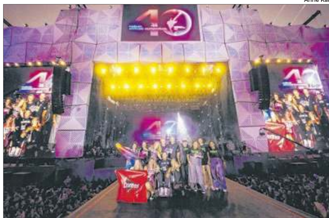
Doritos leva o “Prêmio Atitude Sustentável” do Rock in Rio pela terceira vez consecutiva

“O Rock in Rio é um dos poucos grandes eventos de música no mundo com a ISO 20121 de sustentabilidade. Desde o início, o festival busca ser mais que entretenimento, atuando como motor de mudança para um mundo melhor e sabemos do nosso impacto e como essa influência pode inspirar transformações, tanto na forma como as pessoas pen-