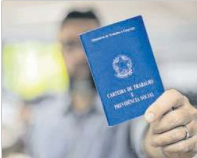
As oportunidades estão distribuídas em todo o estado