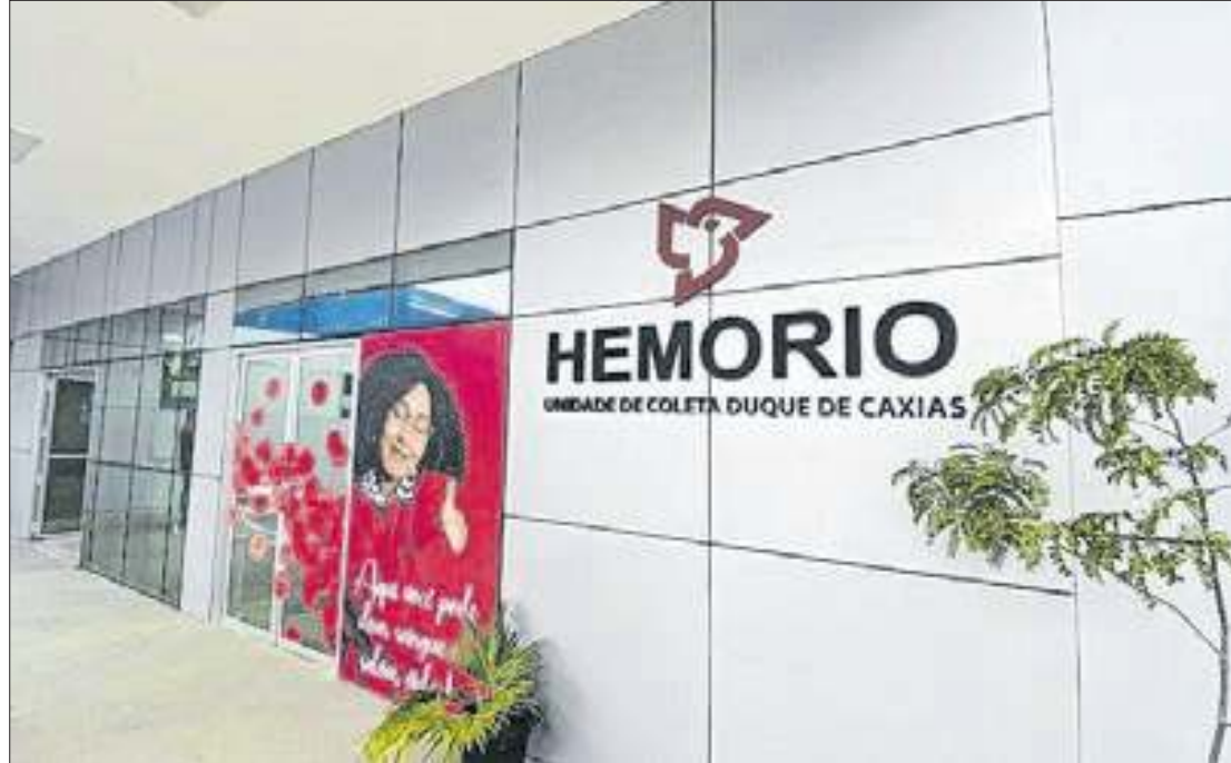
Unidade em Duque de Caxias funciona de segunda a sexta-feira, das 7h às 14h

A instalação do posto avançado no município de Duque de Caxias tem como objetivo facilitar o deslocamento das pessoas que queiram doar sangue e aumentar o número de doadores e de hemocomponentes. No dia 13 de setembro, a Secretaria Municipal de Saúde, através do Departamento de Atenção à Saúde (DAS) e equipe do Hemorio de Duque de Caxias, realizou uma ação educativa nas dependências do HMMRC com o objetivo de conscientizar os usuários sobre a importância de ser um doador.