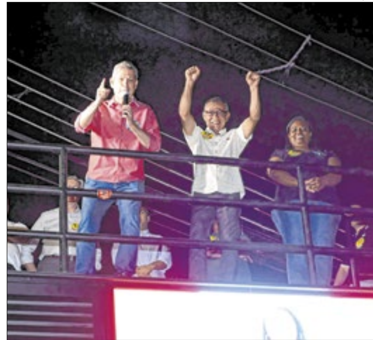
Além de Márcio, outro ex-ministro também compareceu

que tinha um recado do Presidente Lula, lembrando a população de Pinheiral sobre a oportunidade de ter um prefeito que é amigo do Presidente da