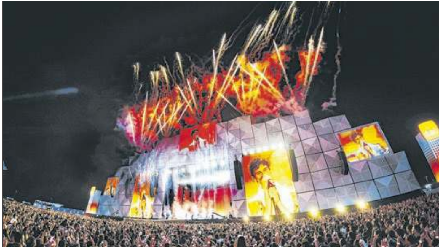
Shawn Mendes encerrou o Rock in Rio 40 anos com o melhor da música pop atual

Em uma edição marcada pela comemoração de 40 anos do festival, o público foi o grande destaque e veio de diversas partes do país e do mundo. Cerca de 46% do público do festival veio de fora do estado do Rio de Janeiro, vindo de 31 países diferentes. Entre as novidades da edição, o aplicativo oficial do Rock in Rio teve 460 mil downloads,