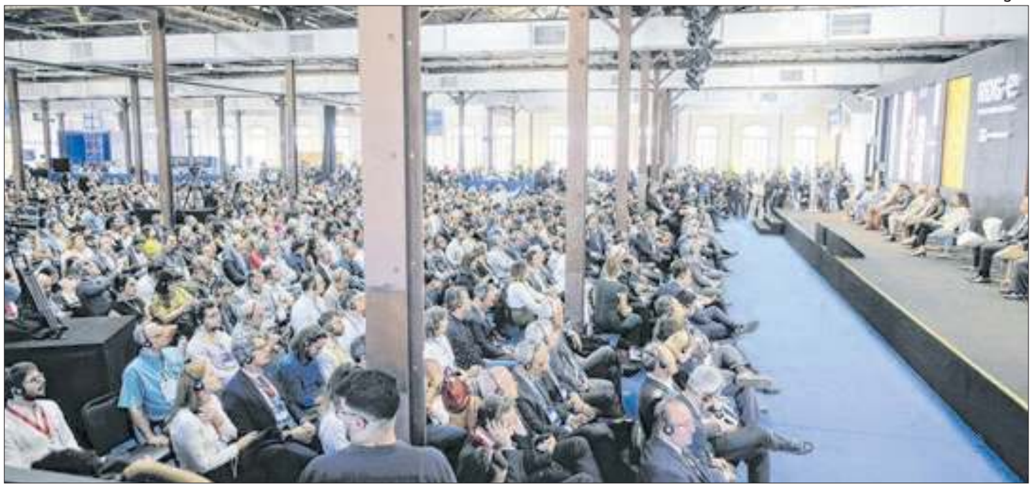
Abertura da Rio Oil &amp; Gas, realizada no Pier Mauá

é uma parceria entre a Águas do Rio e o Senac-RJ, tem como objetivo promover o desenvolvimento econômico nas cidades onde a concessionária atua, capacitando essas pessoas para que possam ser inseridas no mercado de trabalho.