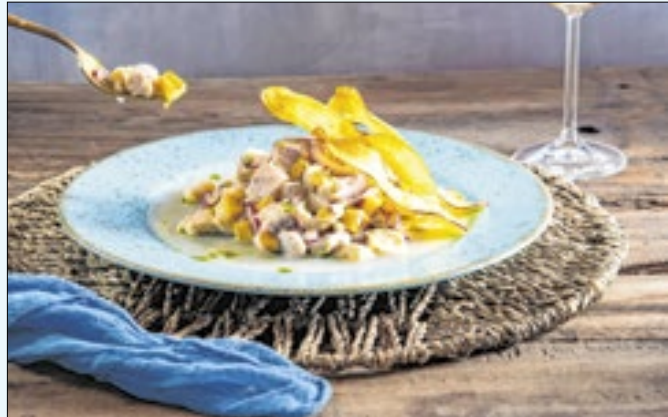
Evento envolve 26 restaurantes da região