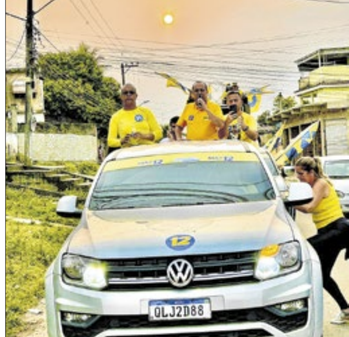
Carreata percorreu as principais ruas de Queimados