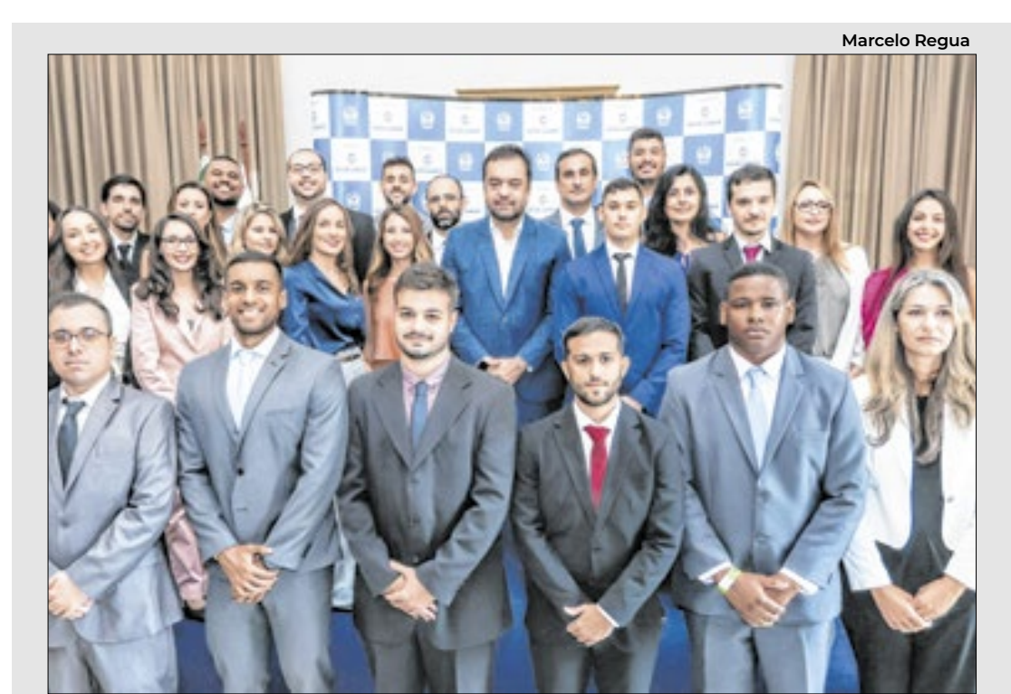
O governador do Rio, Cláudio Castro, com os novos auditores fiscais

A Operação atua desde o primeiro dia do festival com efetivo de 600 agentes entre policiais destacados para fiscalização e agentes em ações educativas no Parque Olímpico.