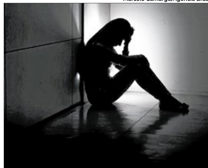
Entre os sintomas, está a perda do prazer na vida cotidiana

"Um dia, durante o 5º ano, passei a cobrir meus cabelos com a touca do moletom do casaco da escola, todo dia antes de ir para aula, passou a ser automático. No outro dia, já não falava com muitas pessoas da