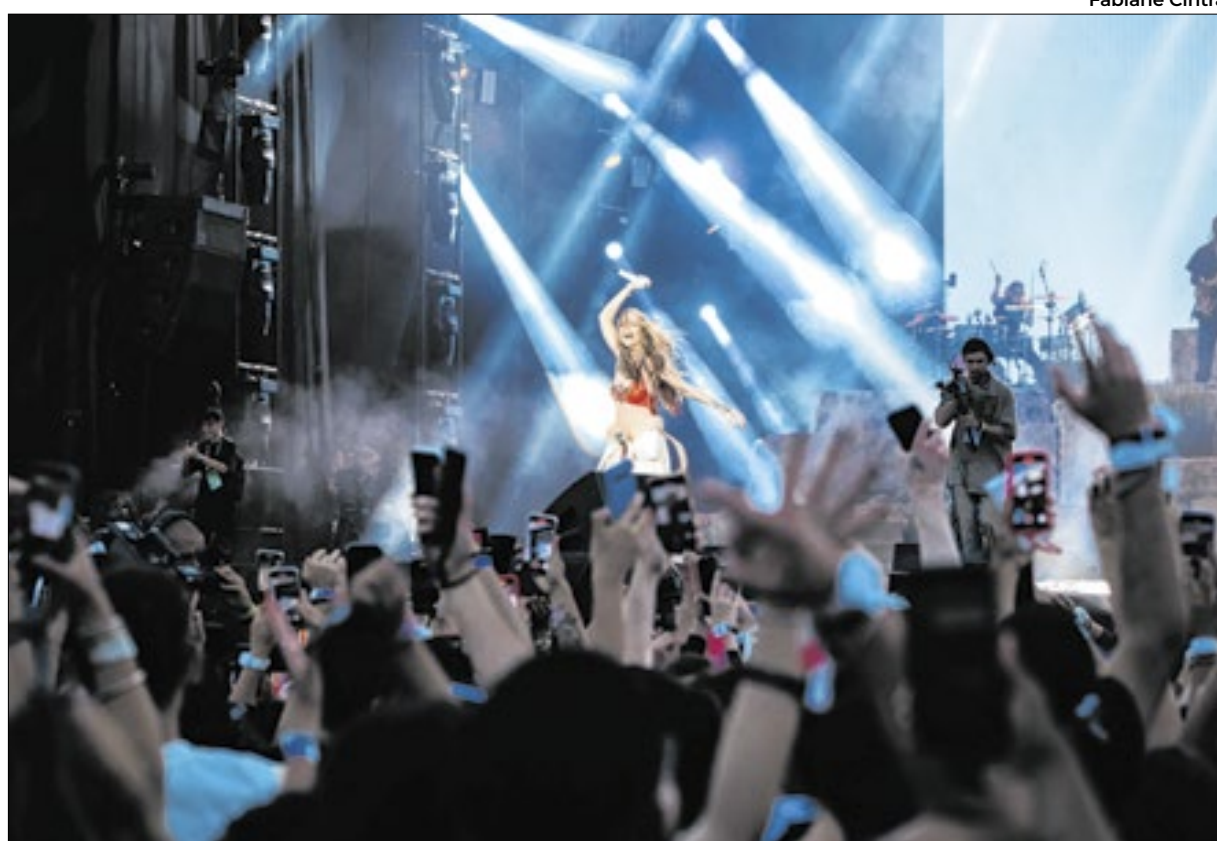
Luísa Sonza abriu as atrações do Palco Mundo no domingo, que teve Shaw Mendes fechando o Rock in Rio 40 anos