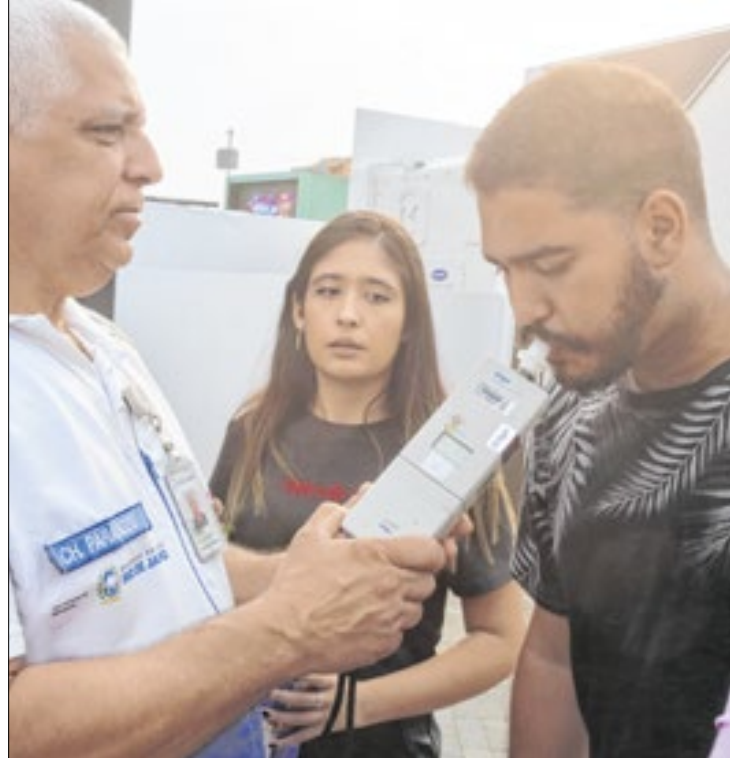
Operação Lei Seca esteve presente no Rock in Rio

Do total de pessoas que estiveram no espaço, 2.410 pessoas fizeram teste do bafômetro e 3.330 fizeram circuito com os