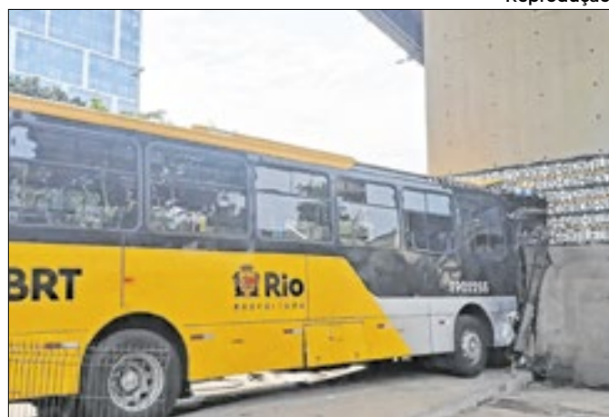
Causa do acidente com o BRT está sob investigação