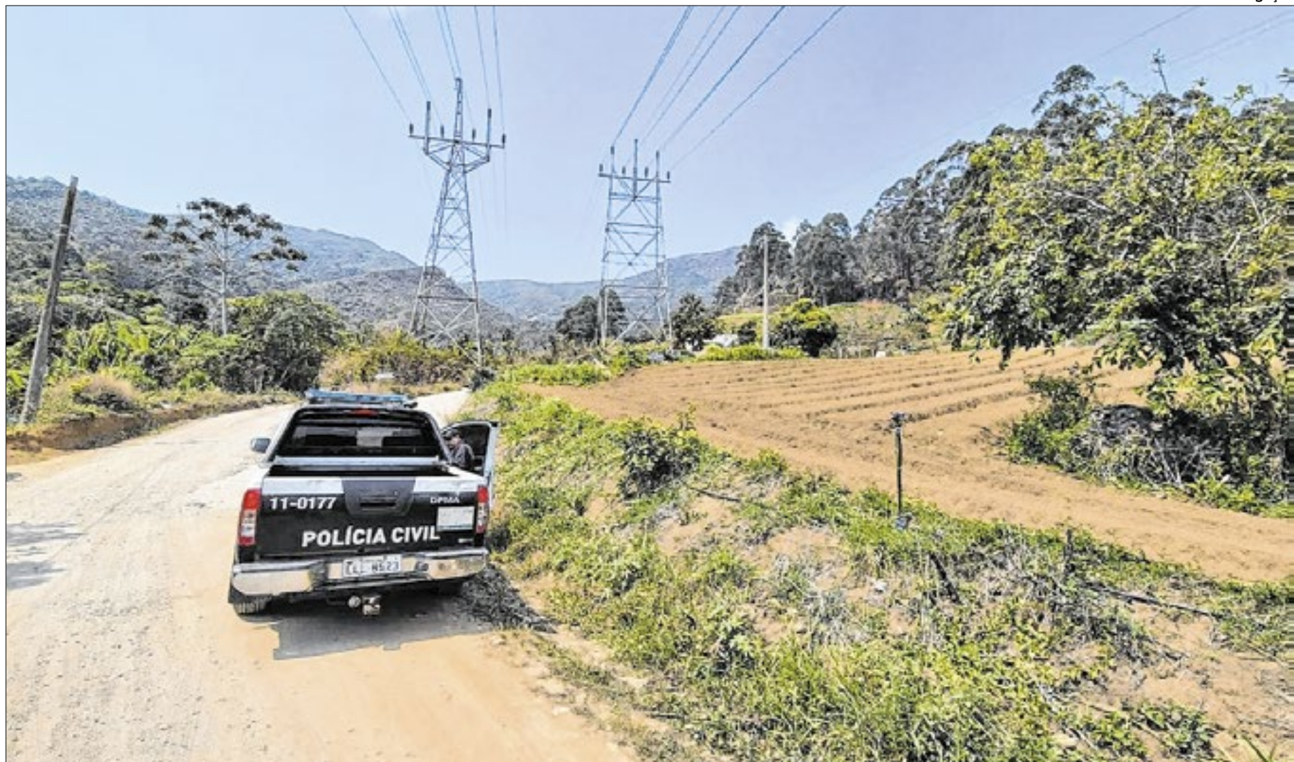
Uma ação integrada resultou na captura de um homem de 61 anos em Valença

“O custo para recuperar esses ecossistemas é incalculável. Não temos, por exemplo, como colocar preço na vida de