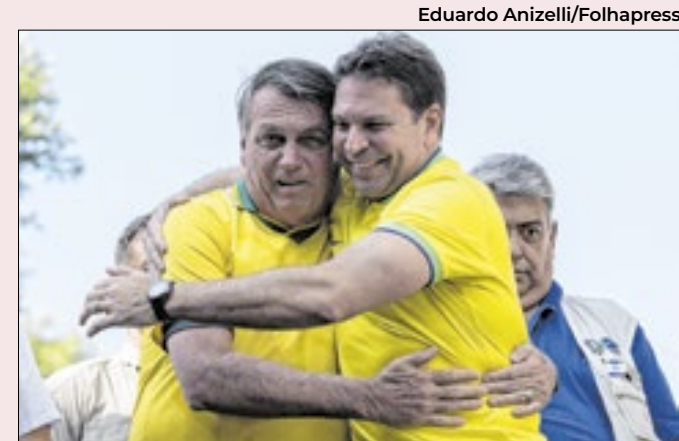
Bolsonaro leva votos e rejeição para aliado

O tema da vacina será bem explorado pelo psolista: pesquisas qualitativas detectaram uma rejeição às novas falas do prefeito. Boulos também vai insistir na suposta violação doméstica cometida por Nunes: percebeu que ele fica tenso quando o tema é abordado.