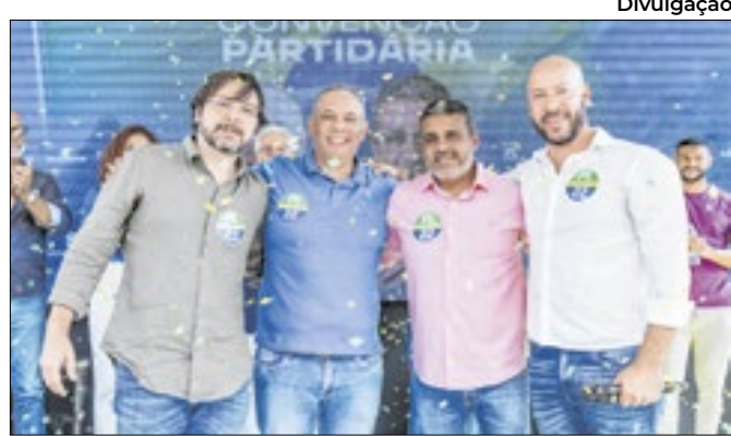
Proposta do candidato visa a construção de 10 unidades