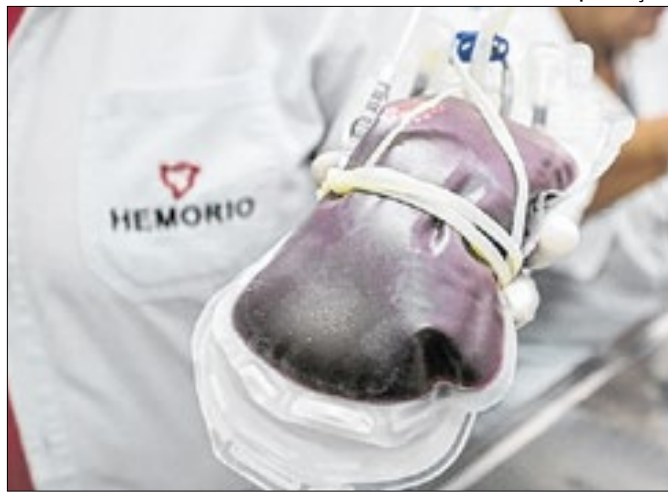
Estado passa a contar com Banco de Sangue Itinerante