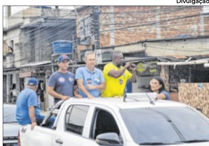
Reina lidera a coligação "Fé, Trabalho e Humildade"