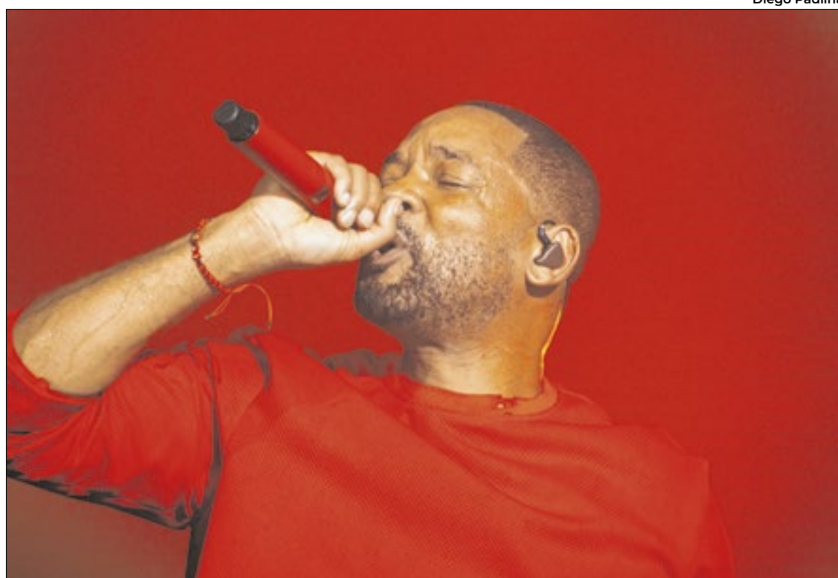
Ator Will Smith fez uma aparição surpresa no Palco Sunset na quinta-feira (19)