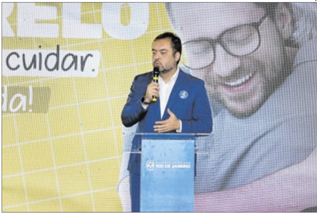
Governador Cláudio Castro durante o lançamento do "Pacto Pela Vida: Olhar, Ouvir e Cuidar",