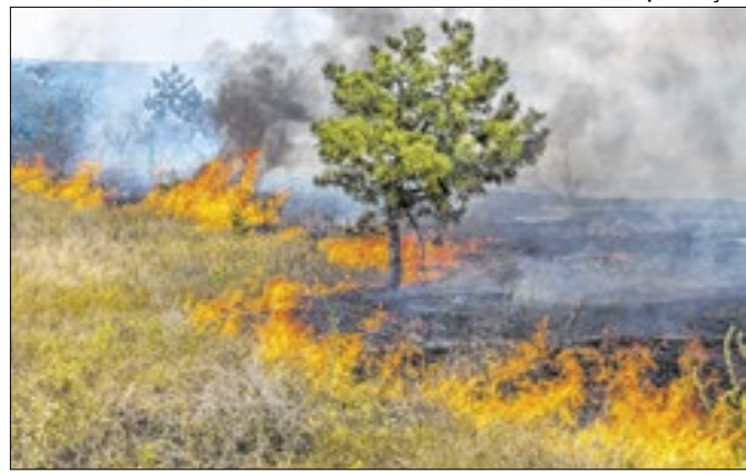
O Piauí ocupa a 13ª posição no número de queimadas