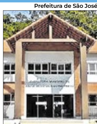
Prefeitura de São José

Em São José do Vale do Rio Preto, a Comissão Permanente de Saúde, Meio Ambiente e Defesa do Consumidor, enviou um requerimento na última sexta-feira (13), a Prefeitura para que o Executivo encaminhe informações e certidões de teor de diversos processos, após flagrar possíveis ilegalidades no procedimento licitatório em desacordo com o Plano Plurianual e Lei Orçamentária anual. A justificativa da comissão foi divergências na análise dos documentos.