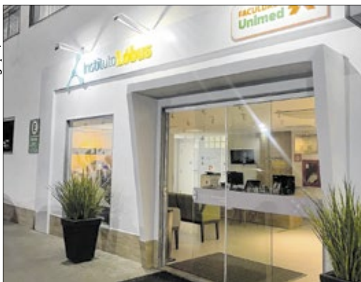
Polo funciona no interior do Rio de Janeiro