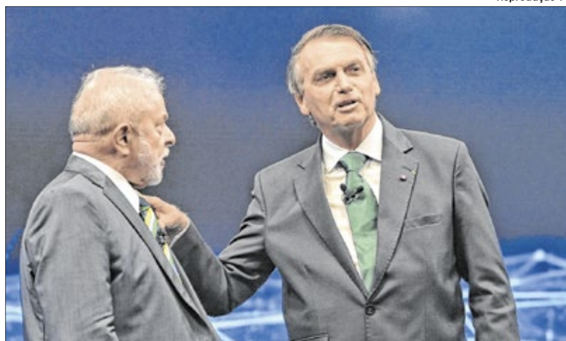
Lula e Bolsonaro buscam votos em seus berços eleitorais

Veja abaixo como está a disputa em cada capital: