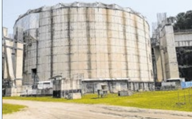
Central nuclear receberá missão internacional