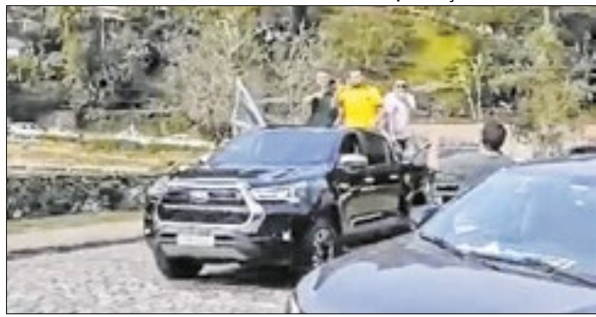
Flávio Bolsonaro esteve em carreta na última quinta