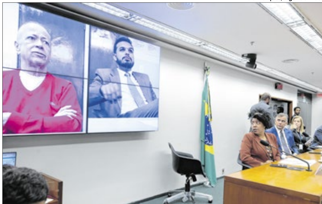
Tendência é que CCJ rejeite o recurso de Chiquinho Brazão

Apesar da semana estar parada no Congresso, a Comissão de Constituição e Justiça (CCJ) da Câmara dos Deputados ana-