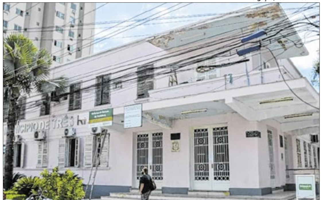
Pagamentos estariam infringindo a Lei de Responsabilidade Fiscal, aponta investigação

Segundo o MPRJ, os Jetons eram pagos com verbas provenientes do repasse de royalties do petróleo, de modo a burlar