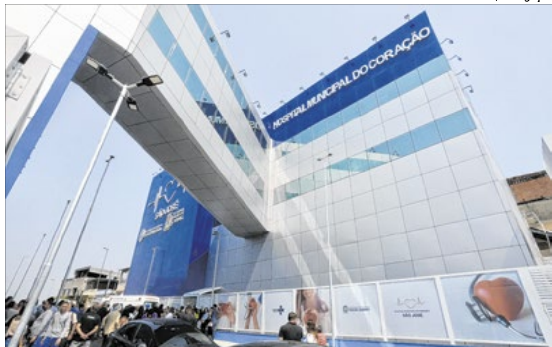
Hospital do Coração São José, em Duque de Caxias, foi inaugurado no último sábado (21)

Com capacidade de oferecer até 123 leitos, entre CTI, enfermaria, salas de pré e pós-procedimentos, o Hospital do Coração terá atendimento 24 horas e servirá a todos os municípios da Baixada Fluminense. A unidade ainda conta com 6 centros cirúrgicos. A previsão é de que sejam realizados 60 procedimentos de cateterismo por dia, podendo chegar a 22 mil cirurgias por ano.