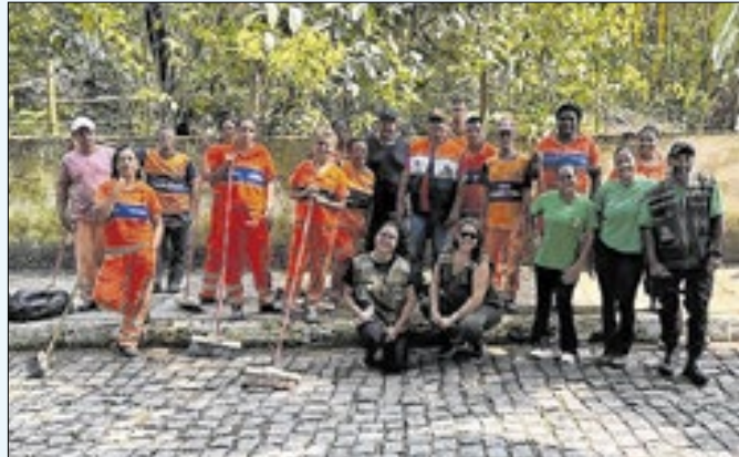
Ação foi nas cachoeiras do Silvado e do Espriado