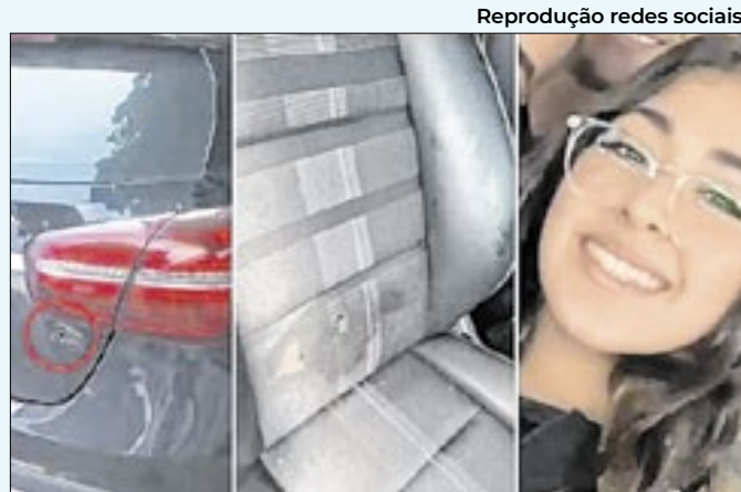
Mesmo voltando a andar, a jovem está em observação

de unidades de Benfica, Vila Isabel e Ramos, com apoio do Samu. Segundo a Mobi-Rio, foi adotado o sistema 'siga e pare' naquele trecho do corredor, mas a estação Into foi interditada (sentido Gentileza) às 8h, até a normalização dos serviços, às 13h.