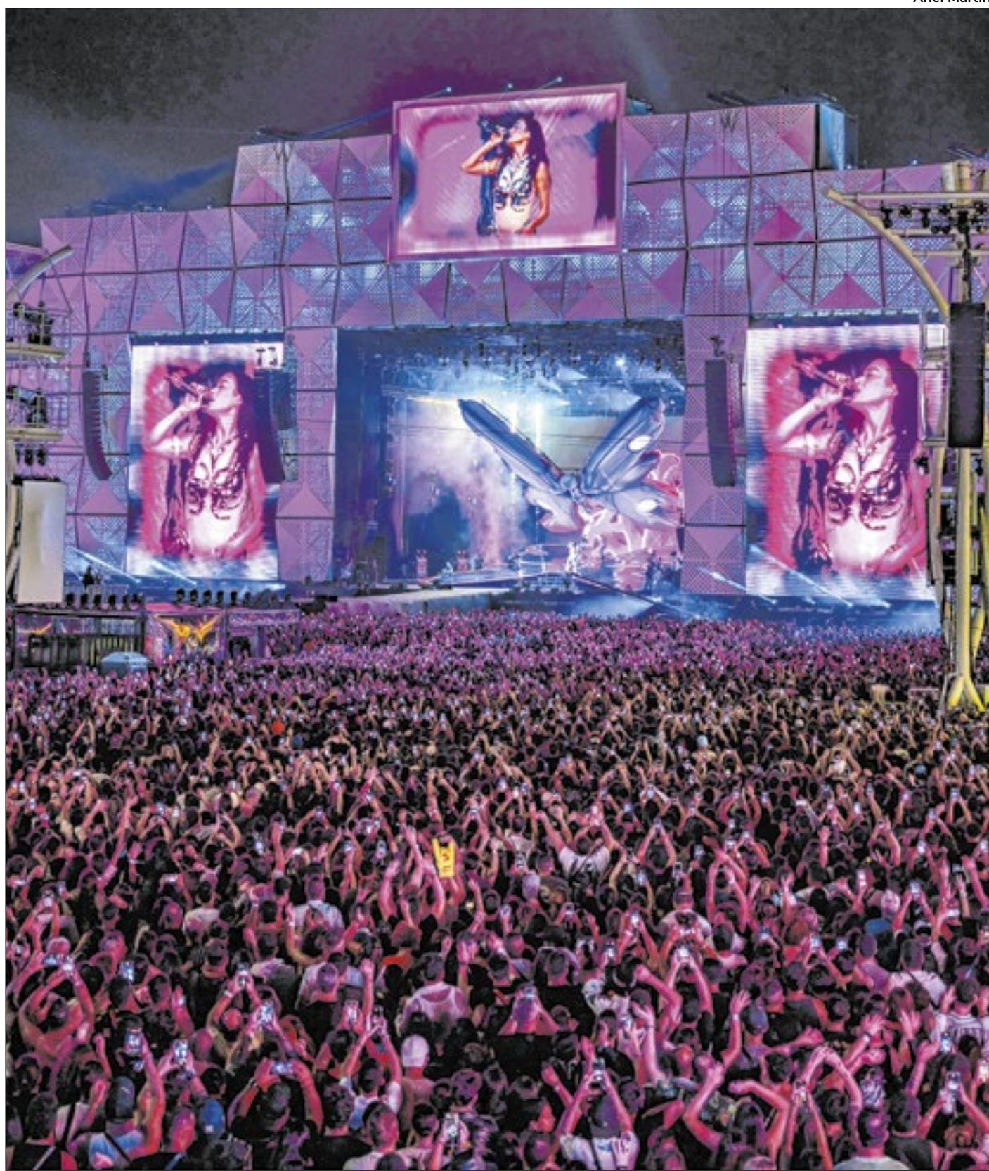
Katy Perry fez um show arrebatador, encerrando o sábado (20), o "Dia Delas", em grande estilo