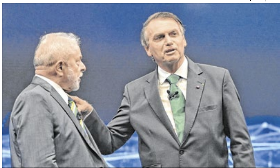
Lula e Bolsonaro buscam votos em seus berços eleitorais

Veja abaixo como está a disputa em cada capital: