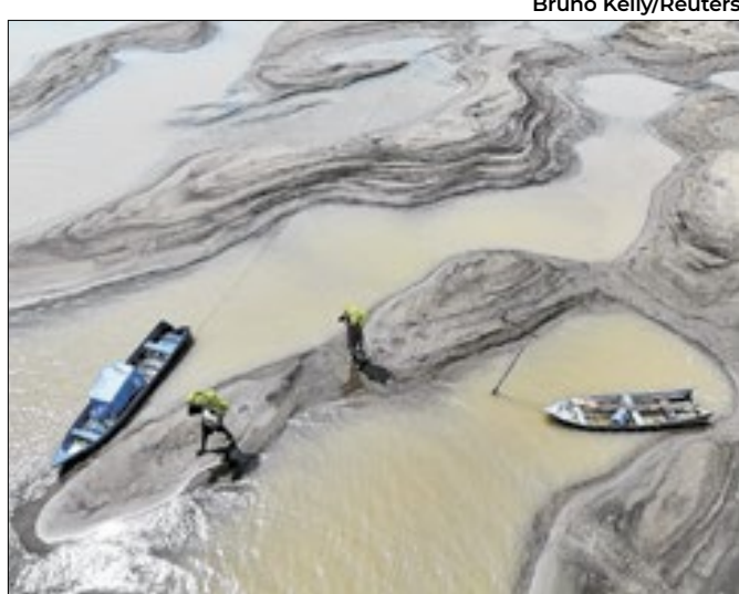
Estiagem no Rio Solimões, em Manacapuru (AM).