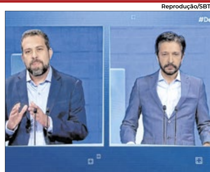
Apoio do ex-presidente será mais citado depois