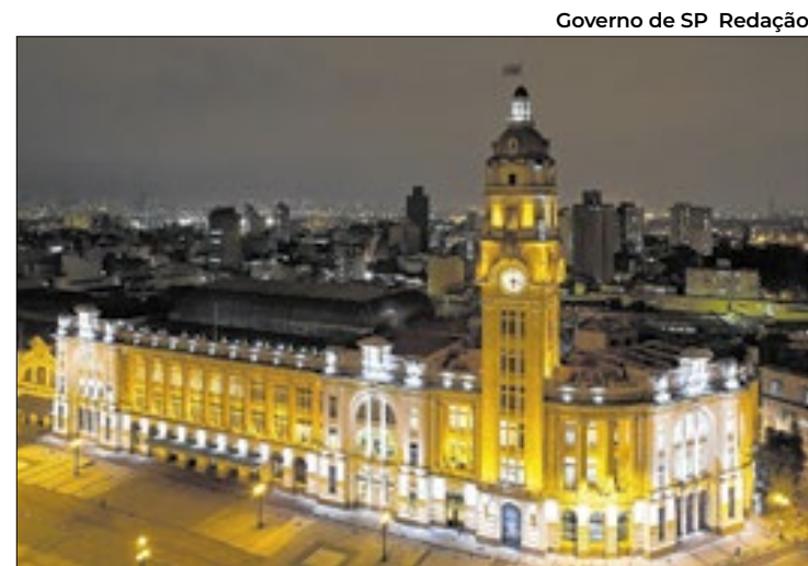
Projeto visa também a instalação de uma atração turística

A iniciativa de requalificação prevê também soluções habitacionais para famílias que hoje residem no espaço, que serão acolhidos em lares dignos, como é a marca do atendimento da CDHU e da secretaria. Para concretizar essa missão, o repertório das soluções habitacionais é vasto – Carta de Crédito Individual, Carta de Crédito Associativo, Apoio ao Crédito em parceria com os programas federais e Auxílio-Moradia Provisório. Na semana passada, a CDHU lançou um chamamento ao mercado para financiar 5,8 mil imóveis prontos, em construção ou ao menos que já tenham projeto aprovado – desse total, 2,5 mil serão em bairros da região central da cidade.