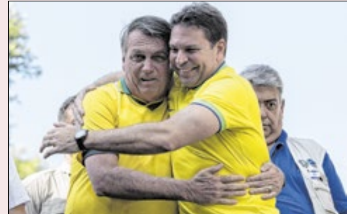
Bolsonaro leva votos e rejeição para aliado