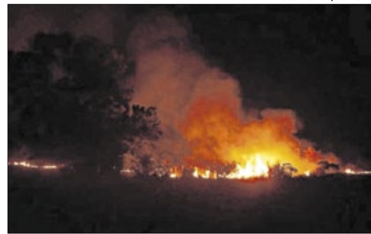
O estado tem até 30 dias para entregar um relatório.