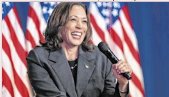
Kamala: produto de democracia multirracial