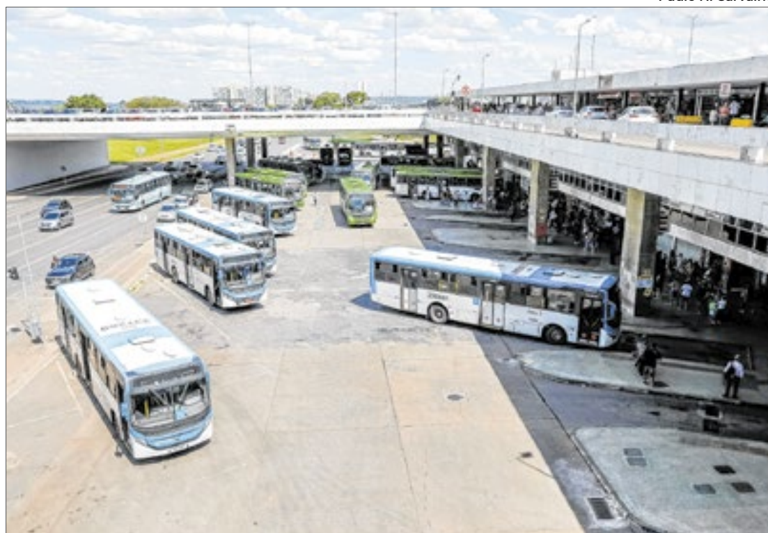
Consórcio terá seis anos para executar investimentos

O governador de Brasília, Ibaneis Rocha, assinou a Lei Distrital que permite a concessão em 19 de janeiro deste ano. O valor estimado do contrato é de R$ 119,8 milhões (data base dez/2019), que corresponde ao total dos investimentos estimados para execução das obrigações contratuais.