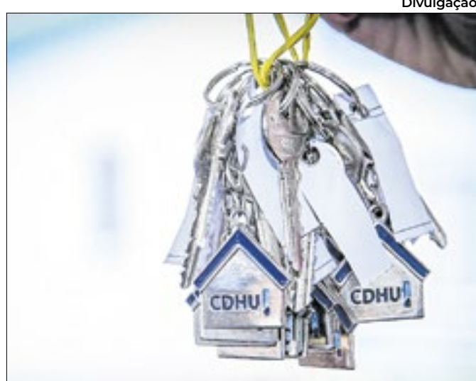
O financiamento dos imóveis será feito pela CDHU