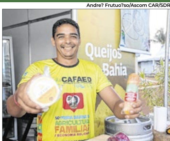
Andre? Frutuo?so/Ascom CAR/SDR

A feira reúne os resultados da agricultura familiar