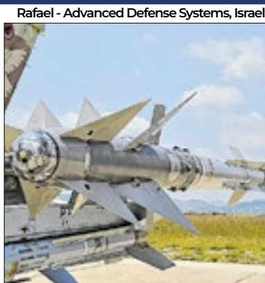
130 mísseis foram lançados

Alegando estar mirando lançadores de foguetes do Hezbollah, Israel lançou dezenas de mísseis contra o território do Líbano, que está no centro da guerra após as explosões de paggers e walkie-talkies na última semana. De acordo com o