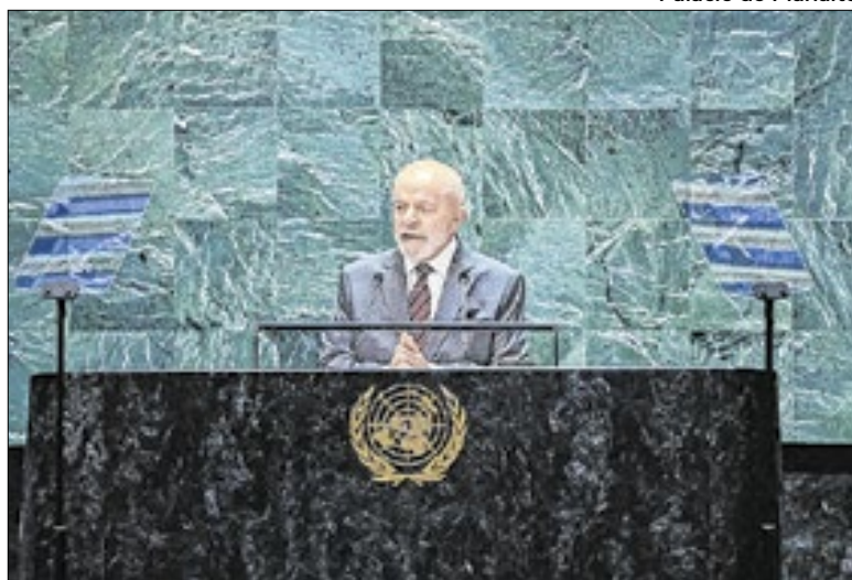
PÁGINA 5 Lula durante a Sessão de Abertura da Cúpula do Futuro

Em meio a uma semana pouco movimentada no Congresso Nacional devido às eleições municipais, o presidente Luiz Inácio Lula da Silva (PT) seguirá com uma agenda de compromissos internacionais. Nesta terça-feira (24), ele discursará na abertura da 79ª Assembleia Geral da Organização das Nações Unidas (ONU), em Nova York, nos Estados Unidos.