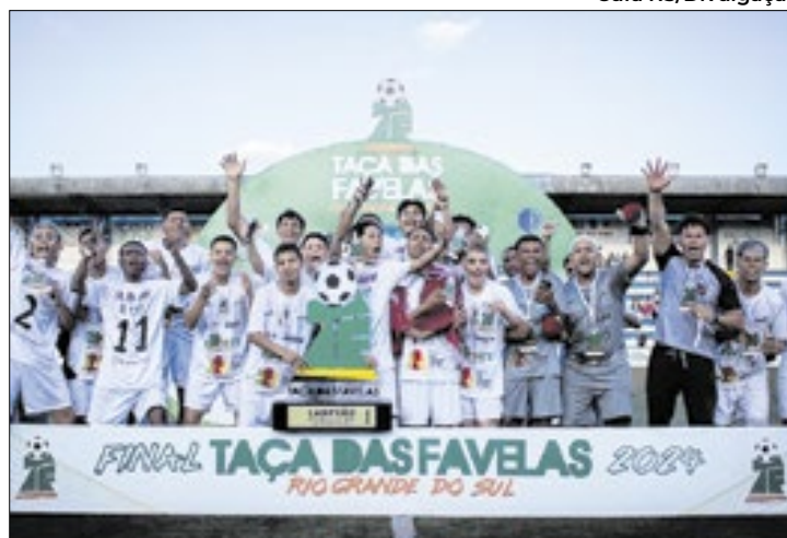
No masculino, o Bom Jesus superou o Municipal

Os campeões da segunda edição da Taça das Favelas RS foram conhecidos no sábado, em Porto Alegre. Na disputa feminina, venceu o Piratini, de Alvorada, e, no masculino, ganhou o Bom Jesus, de Porto Alegre. As finais aconteceram no estádio Passo D'Areia.