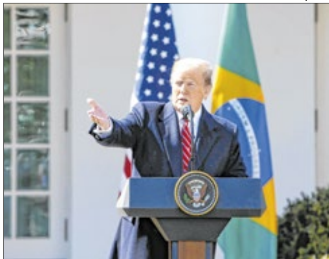
Trump segue ameaçando democracia nos EUA