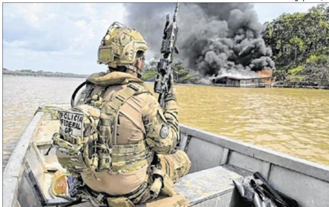
Operação da PF para destruir dragas usadas na extração ilegal.

A produção de ouro nos garimpos brasileiros sofreu uma queda de 84% desde 2023, segundo dados divulgados pelo Instituto Escolhas. A redução ocorreu após a implementação de medidas de controle no setor, como parte do combate à mineração ilegal. O estudo, intitulado "Ouro em Choque: medidas que abalaram o mercado", destaca que as novas regras alteraram a dinâmica da extração e comercialização do metal no Brasil, afetando diretamente a produção e as exportações.