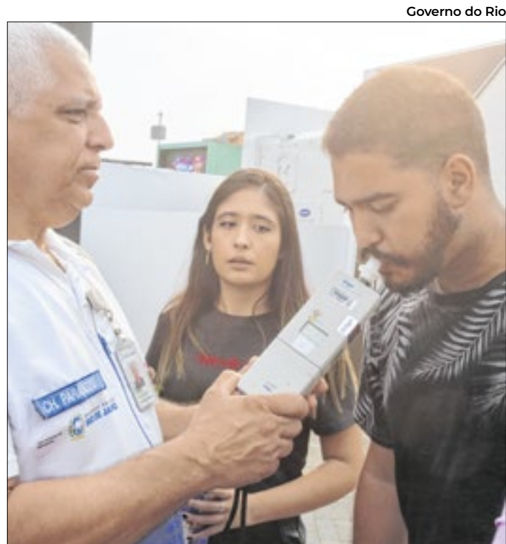
Operação Lei Seca esteve presente no Rock in Rio

Do total de pessoas que estiveram no espaço, 2.410 pessoas fizeram teste do bafômetro e 3.330 fizeram circuito com os