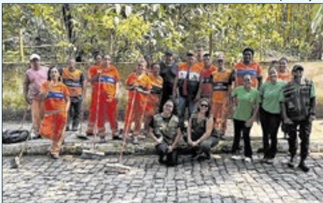
Ação foi nas cachoeiras do Silvado e do Espriado