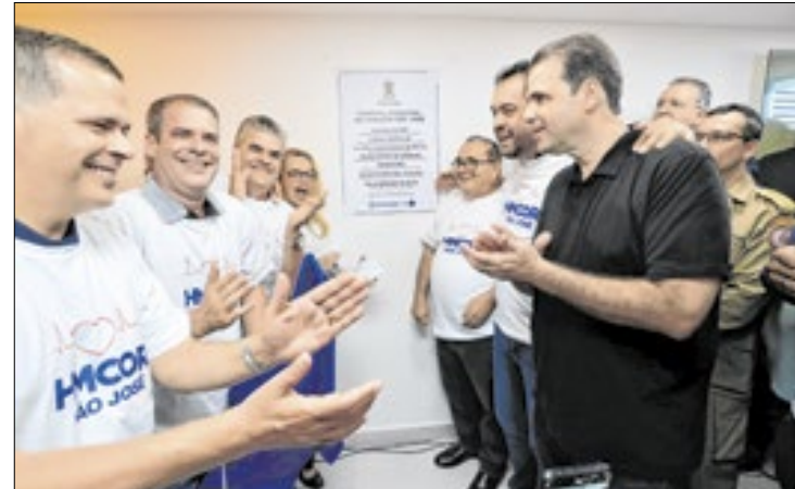
O governador Cláudio Castro, ladeado por autoridades