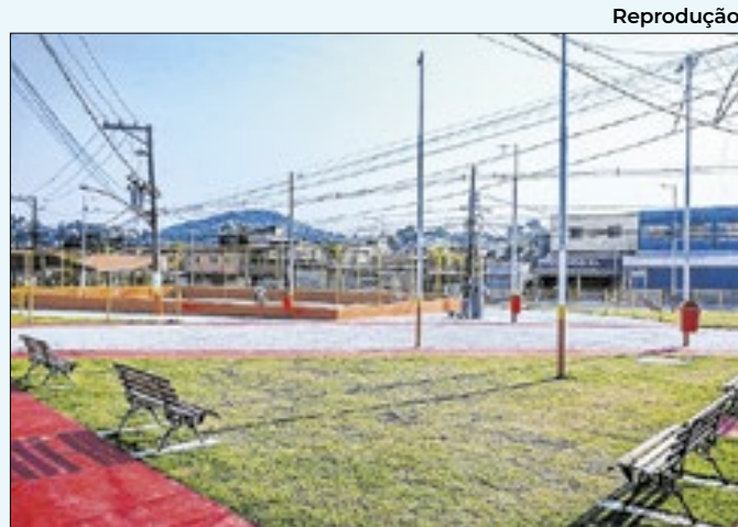
B. Roxo inaugurou a 52ª praça da atual administração