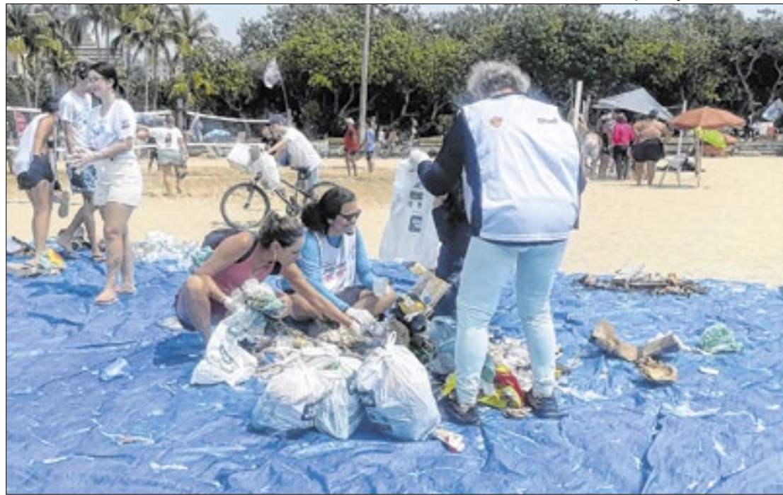
Ironia social: os mais jovens é que ensinam os mais velhos a 'cuidar de nossa casa'

teve uma surpresa apropriada aos voluntários que recolheram uma quantidade maior de lixo, pois fizeram jus a bolsas de estudo para o curso de Formação em Líderes em Sustentabilidade para a Década do Oceano, oferecido pelo Instituto Aqualung.