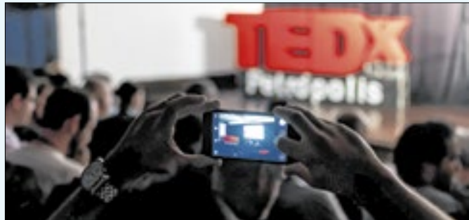
Evento retorna para sua quarta edição na cidade