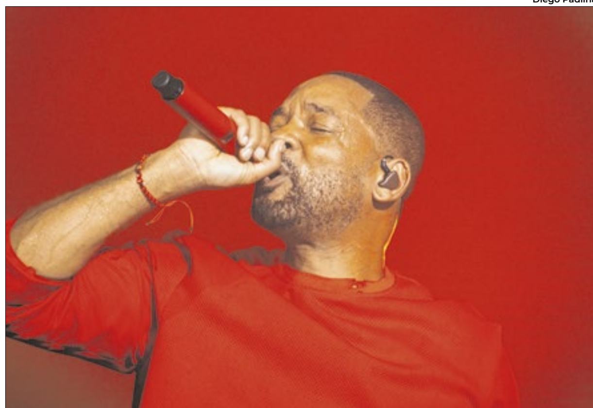
Ator Will Smith fez uma aparição surpresa no Palco Sunset na quinta-feira (19)