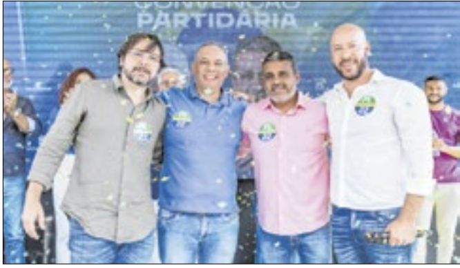
Proposta do candidato visa a construção de 10 unidades