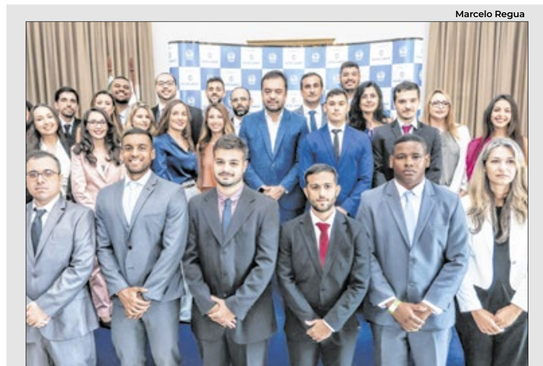
O governador do Rio, Cláudio Castro, com os novos auditores fiscais

A Operação atua desde o primeiro dia do festival com efetivo de 600 agentes entre policiais destacados para fiscalização e agentes em ações educativas no Parque Olímpico.