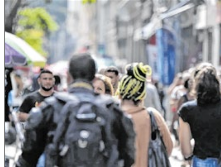
Desigualdade salarial entre eles e elas só cresce

Especialistas defendem ações dos municípios para mitigar essa desigualdade. Além