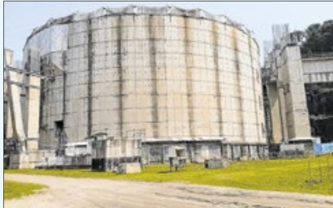
Central nuclear receberá missão internacional