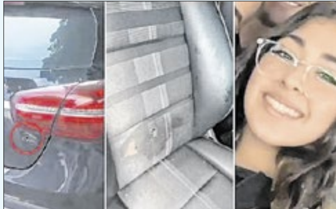
Mesmo voltando a andar, a jovem está em observação