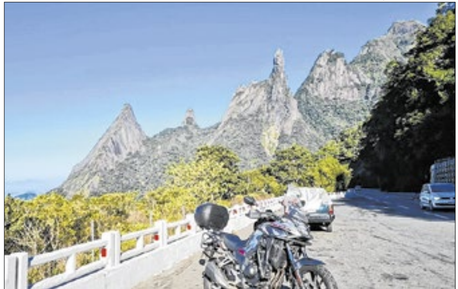
Dedo de Deus em Teresópolis, Região Serrana do Rio de Janeiro

Acontece nesta terça-feira, 24, o "Negócios e Turismo", que reúne os conventions bureaux de Petrópolis, Teresópolis, Nova Friburgo e Guapimirim. Nesta terceira edição, na Granja Brasil, em Petrópolis, o foco estará em como os títulos de "capital" das cidades da Serra Verde Imperial podem ser usados como estratégias para fortalecer o turismo na região. O encontro, já com lotação esgotada, busca traçar caminhos para aumentar a visibilidade e atratividade da região para visitantes de todo o Brasil.