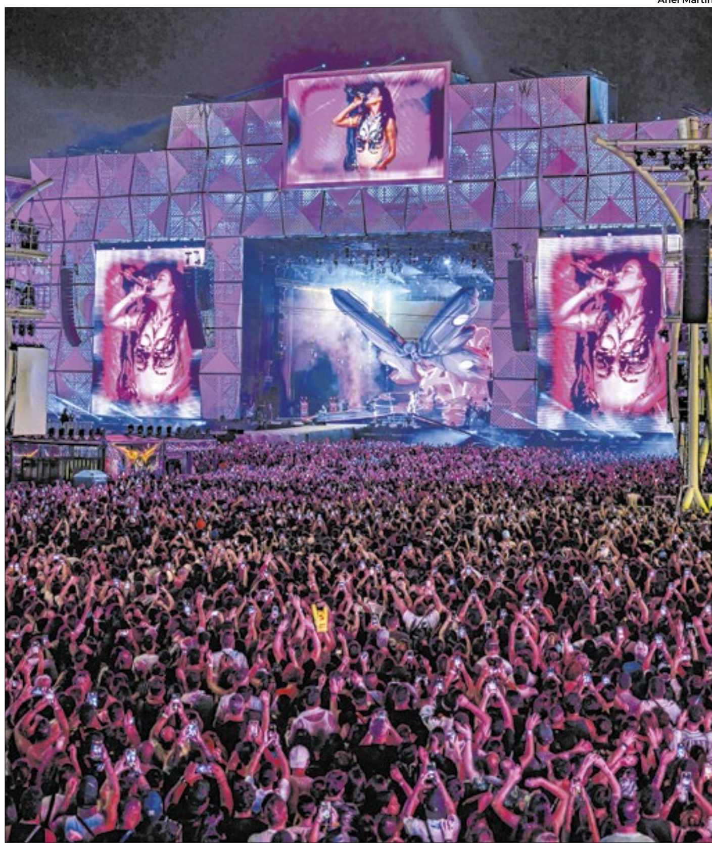
Katy Perry fez um show arrebatador, encerrando o sábado (20), o "Dia Delas", em grande estilo

A abertura do Palco Mundo foi a maior reunião do trap brasileiro da história, com a presença de MC Cabelinho, Kayblack, Matuê, Orochi, Filipe Ret, Wiu e Veigh. Essa foi a primeira vez que todos esses grandes nomes se reuniram no mesmo palco. Quem produziu