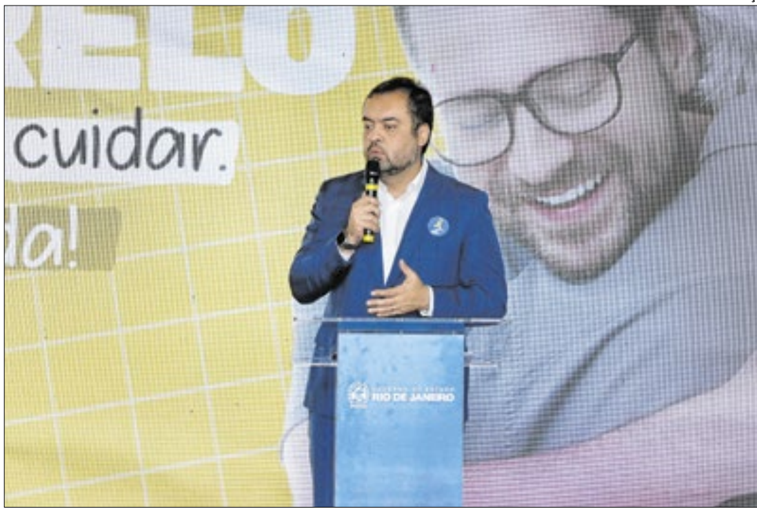
Governador Cláudio Castro durante o lançamento do “Pacto Pela Vida: Olhar, Ouvir e Cuidar”,