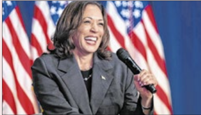
Kamala: produto de democracia multirracial