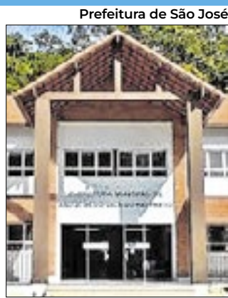
Prefeitura de São José

A Secretaria Municipal de Saúde de Nova Friburgo, informou que a Sala de Vacina da Unidade Básica de Saúde de São Geraldo estará fechada temporariamente, para manutenção corretiva da câmara de armazenamento de