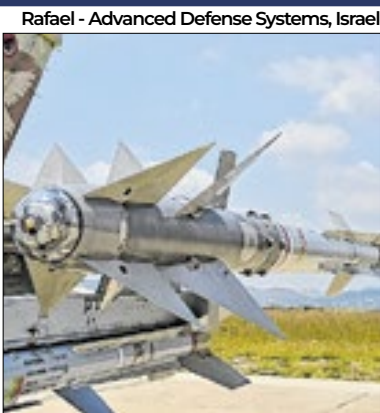
130 mísseis foram lançados

Alegando estar mirando lançadores de foguetes do Hezbollah, Israel lançou dezenas de mísseis contra o território do Líbano, que está no centro da guerra após as explosões de pagens e walkie-talkies na última semana. De acordo com o