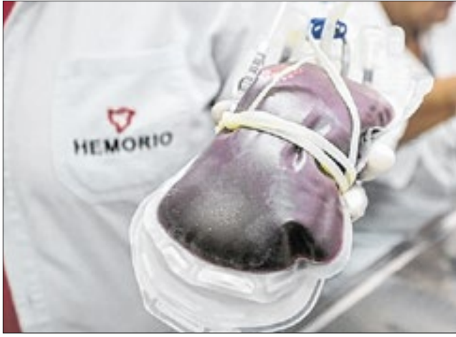
Estado passa a contar com Banco de Sangue Itinerante