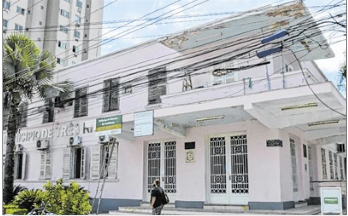
Pagamentos estariam infringindo a Lei de Responsabilidade Fiscal, aponta investigação

Na última sexta-feira (13), o Poder Judiciário do Estado do Rio de Janeiro concedeu a liminar requerida pelo Ministério Público do Estado do Rio de Janeiro (MPRJ), para o cumprimento de uma medida de busca e apreensão no gabinete e secretarias da Prefeitura Três Rios, devido a supostas irregularidades administrativas, cometidas entre os anos de 2022 e 2024, investigadas pelo MPRJ.