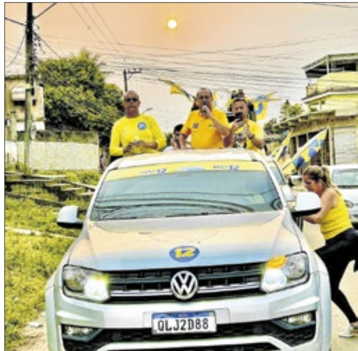
Carreata percorreu as principais ruas de Queimados