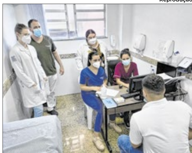
Aumento pode influenciar na qualidade