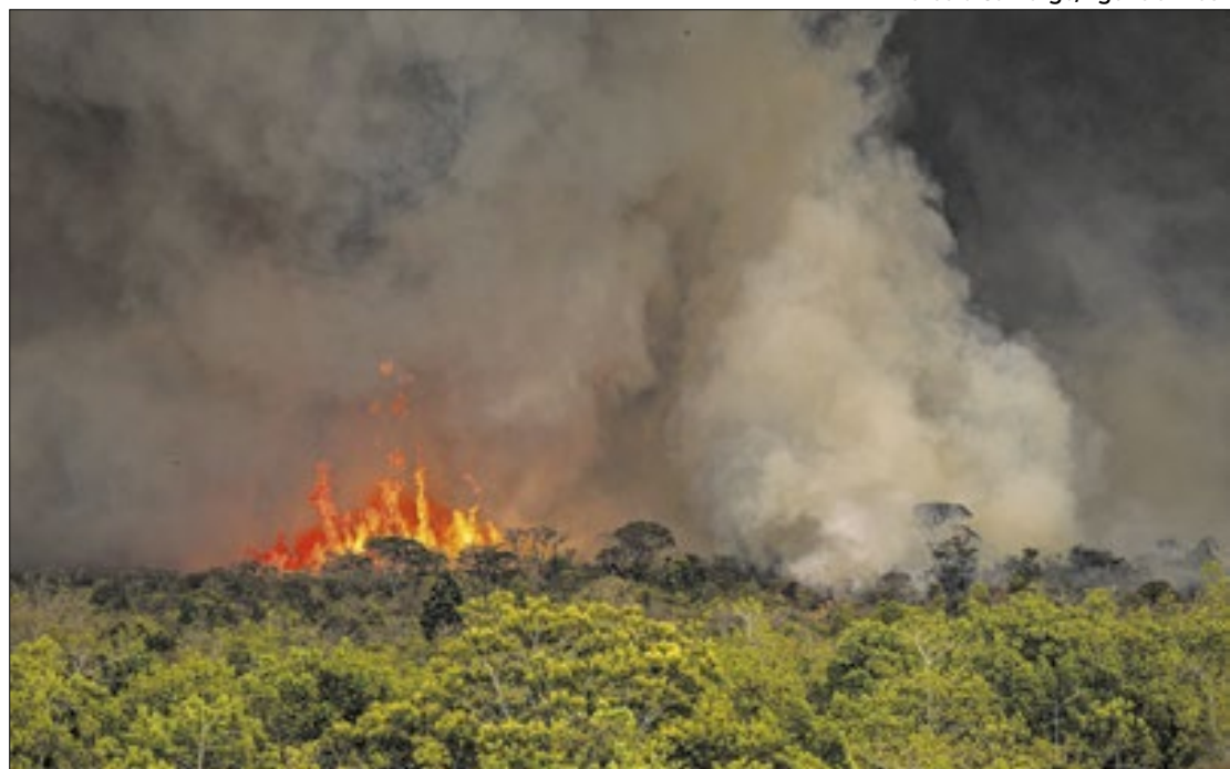
A ministra reforçou que qualquer incêndio florestal se caracteriza como criminoso

De acordo com a ministra, das 27 unidades da federação, apenas Rio Grande do Sul e