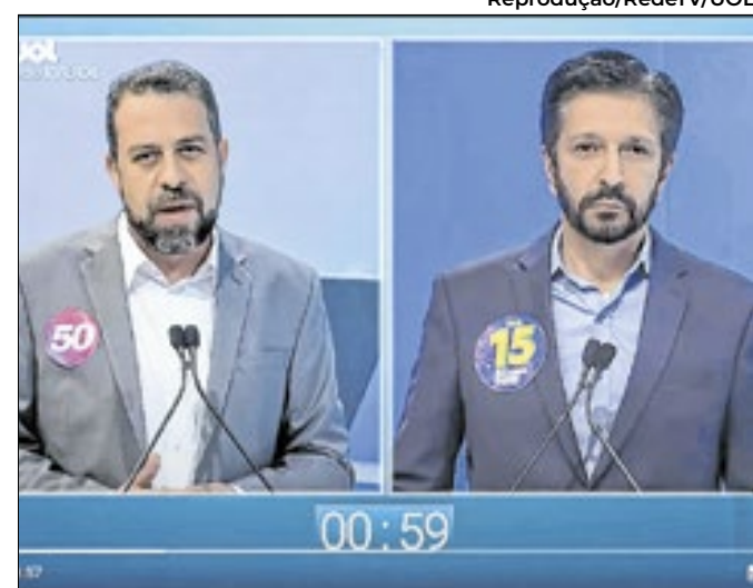
Boulos e Nunes não fizeram perguntas ao coach