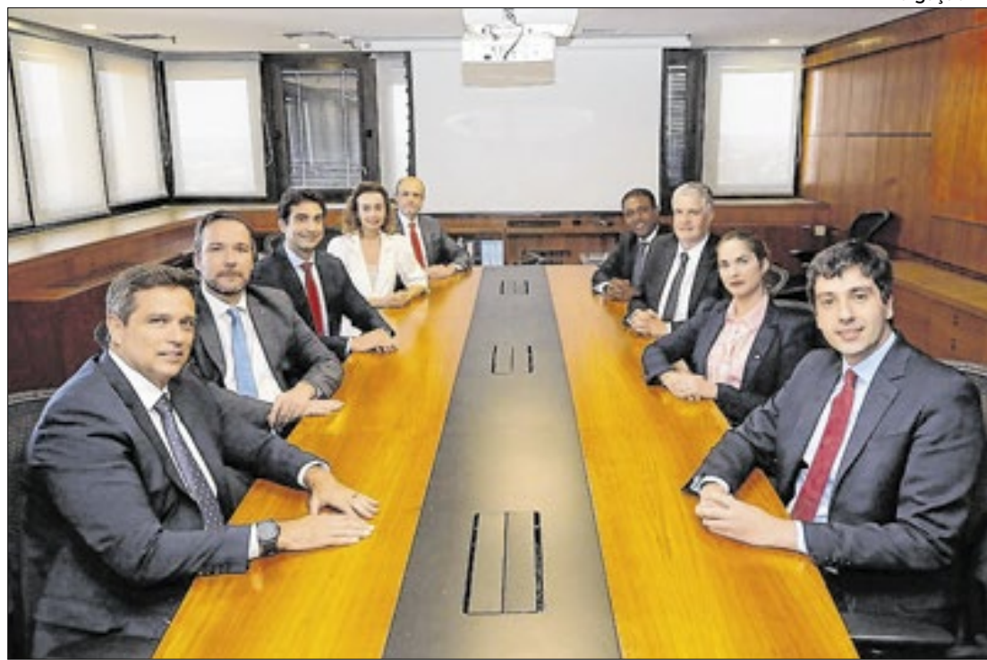
Pressão da inflação deve fazer Copom retomar aperto monetário

Mediante uma reunião incomum – com a presença de 'dois' presidentes, ao mesmo tempo – o comitê deverá elevar a Selic, ante evidências incontestáveis de 'descolamento' das expectativas de inflação em relação à meta. Pela projeção dessa semana do boletim Focus – consulta às 100 maiores instituições fi-