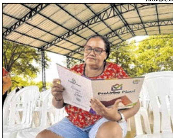
O programa permite a aceleração da regularização