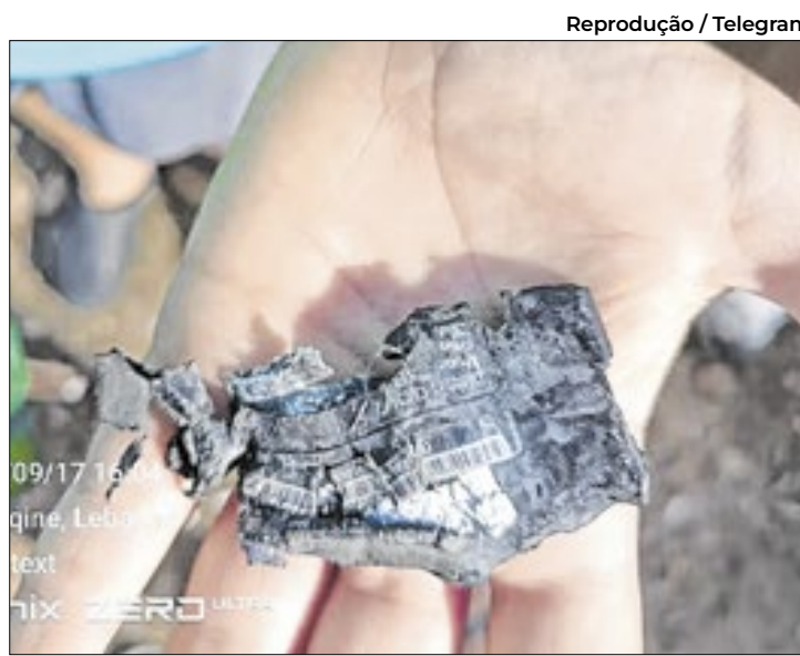
Beirute acusou Israel de envolvimento na ação explosiva

Ao menos 2.750 pessoas ficaram feridas em várias cidades, afirmou o ministro da Saúde do Líbano, Firass Abiad. Aproximadamente 200 foram hospitalizadas em estado grave. Explo-