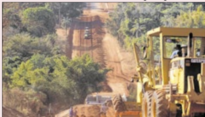
Por que esconder a destinação para uma obra?