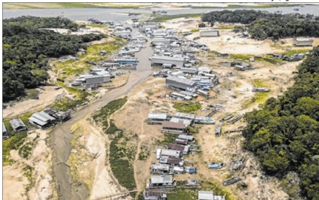
Beneficiários de municípios em emergência receberão acesso antecipado ao benefício

O calendário unificado é aplicado em três estados da Região Norte: Amazonas, Acre e Roraima. Por exemplo, todos os 62 municípios do Amazonas receberão uma quantia superior a R$ 485 milhões, beneficiando 656,13 mil famílias impactadas pela estiagem. O Acre, igualmente afetado pela estiagem,