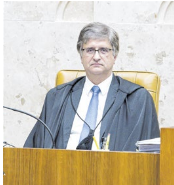
Primeira acusação de Gonet trata de orçamento

individuais, também conhecidas como "emendas Pix", até que o Congresso Nacional e o governo federal cheguem a um acordo para dar maior transparência às destinações.