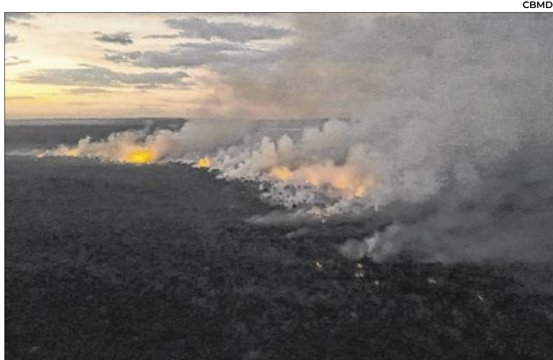
Autoridades investigam suspeita de incêndios criminosos no DF

Três homens, de 25 a 34 anos, foram presos em Tangará da Serra, MT, suspeitos de provocar um incêndio em uma área de mata no domingo (15). Segundo a Polícia Militar, o grupo foi flagrado queimando vegetação perto da ponte do Rio Sepotuba, na MT-480.