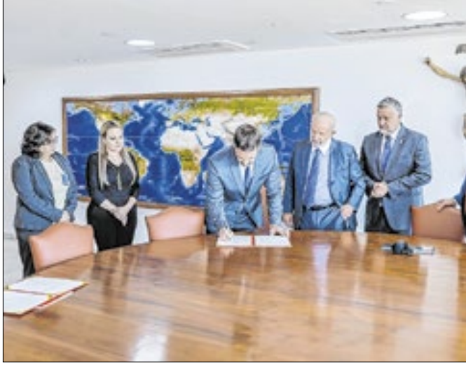
Os recursos financiarão a contenção de cheias