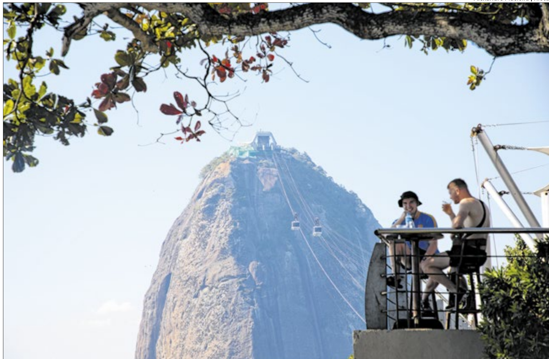
O estado do Rio de Janeiro foi de onde partiram a maioria das viagens de lazer, segundo a pesquisa