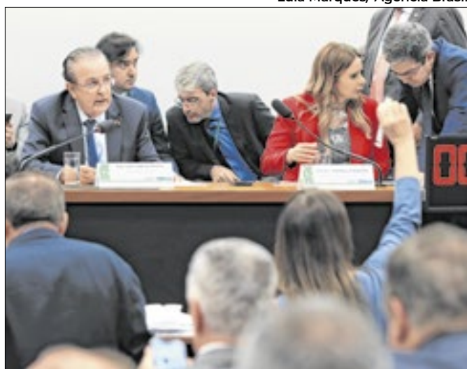
Comissão pode virar palco de novo escândalo