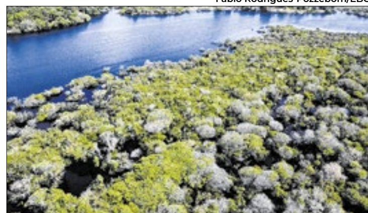
Infrações foram registradas unidade de conservação no PA