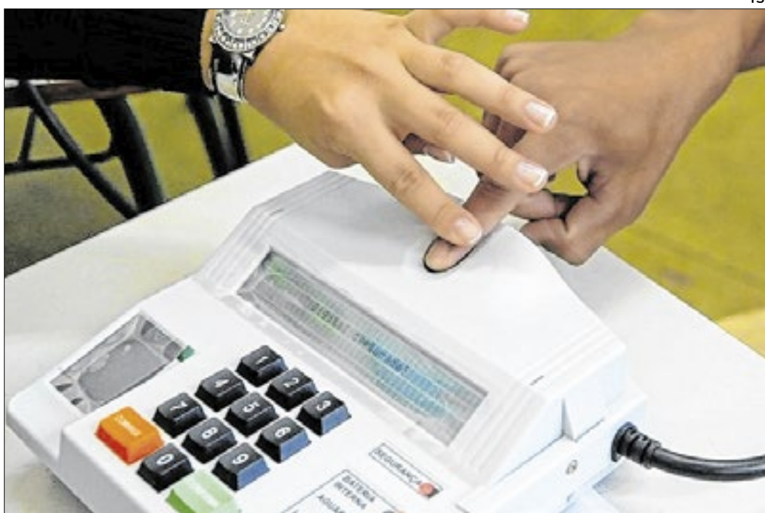
A biometria consiste em características físicas ou biológicas únicas

Embora não obrigatória, o sistema aumenta a segurança