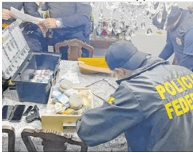
'Operação Vagus' visa combater lavagem de dinheiro