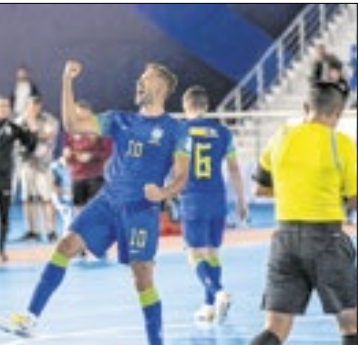
Brasil se classificou no mundial de futsal

O último compromisso da equipe canarinho na fase de grupos será contra a Tailândia, a