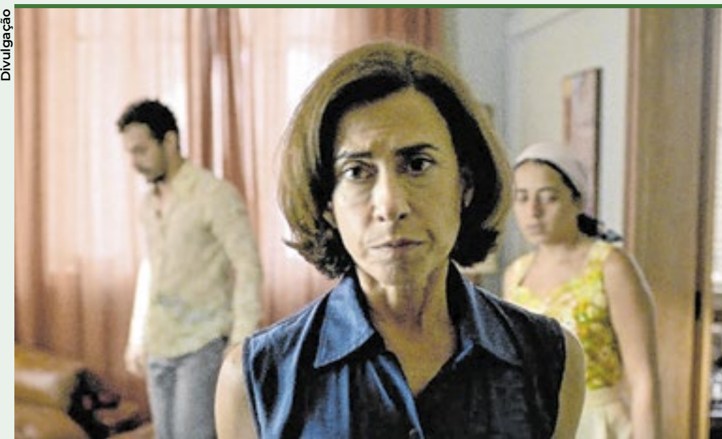
O longa conta a saga de Eunice Paiva que busca o corpo do marido desaparecido

O cineasta Miguel Przewodowski mergulhou no universo das escolas de samba o doc. 'Não Vamos Sucumbir'. Em entrevista ao Correio, ele destaca a potência de nossa maior manifestação popular