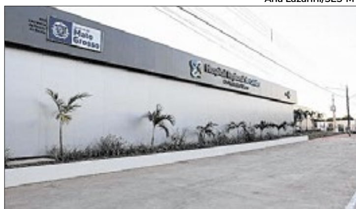
Decisão por quebra de normas de segurança em hospital