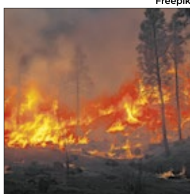
Sete pessoas já morreram

Três bombeiros morreram na terça (17) enfrentando os incêndios florestais de grandes proporções que atingem as regiões Norte e Central de Portugal há quatro dias, e o governo em Lisboa decretou estado de emergência em todos os 25 municípios afetados pelo fogo. Com isso, sobem para sete o número de mortos até aqui —um deles foi um brasileiro de 28 anos que tentava recuperar ferramentas da empresa onde trabalhava em Albergaria-a-Velha.