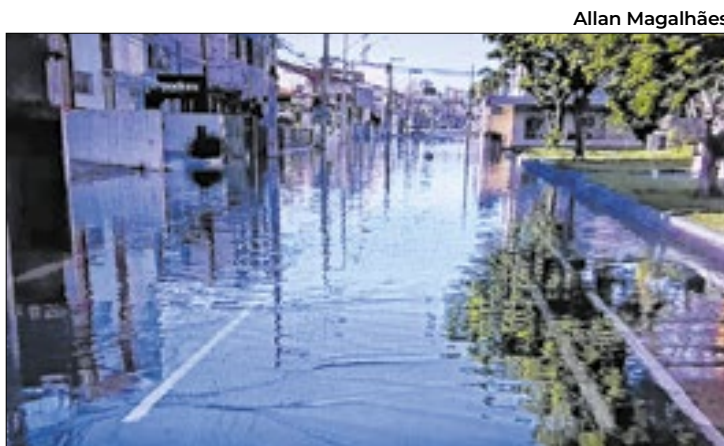
Maré Alta no Bairro 16 de Julho, em Aracaju

Para aqueles que desejarem realizar o cadastramento biométrico, o procedimento continua disponível nos cartórios eleitorais e postos de atendimento até as vésperas do fechamento do cadastro eleitoral, que ocorre meses antes das eleições. A biometria vem sendo implementada gradualmente no Brasil desde 2008 e, até o momento, mais de 119 milhões de eleitores já passaram pelo processo de coleta de dados.