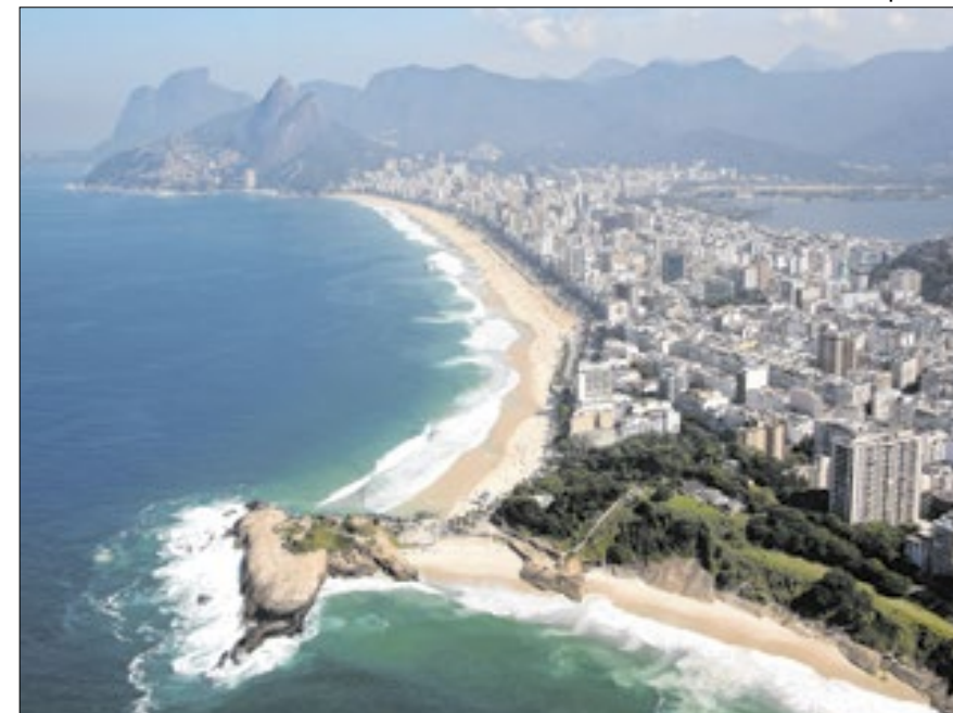
Além de Salvador, a cidade do Rio de Janeiro conhecida como ‘Cidade Maravilhosa’, também concorre ao título

A Argentina foi o principal emissor de viajantes ao território nacional (1,8 milhão), seguida dos Estados Unidos (668,4 mil), do Chile (458,5 mil), do Paraguai (424,4 mil) e do Uruguai (334,7 mil). As