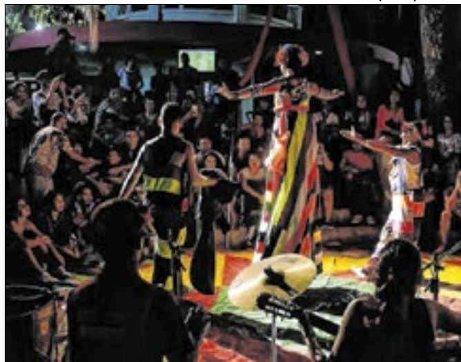
Evento trará apresentações e oficinas gratuitas