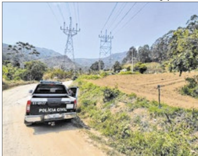
Mais de 20 pessoas suspeitas foram identificadas