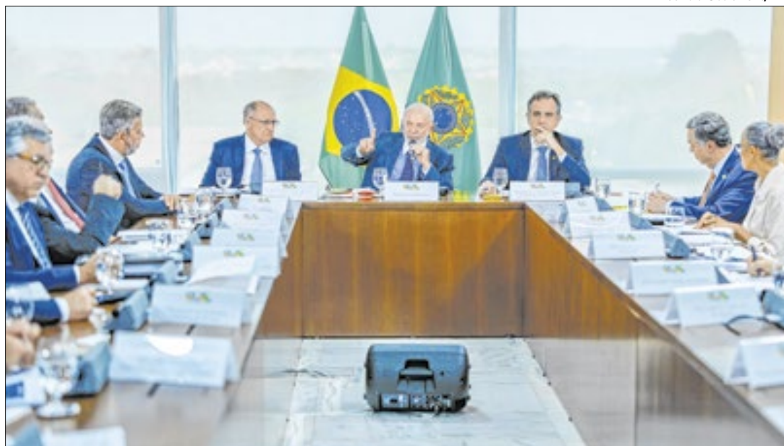
Lula e demais presidentes dos poderes desconfiam de ações de organizações criminosas

Participaram da reunião os presidentes da Câmara dos Deputados, Arthur Lira (PP-AL); do Senado, Rodrigo Pacheco