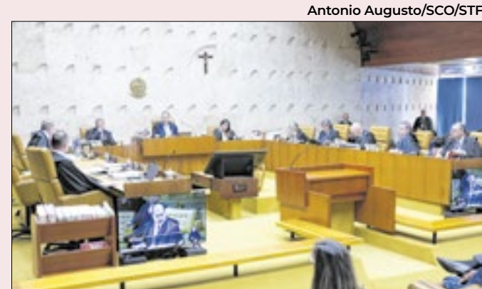
STF fixou limite de 40 gramas de maconha

A presença de Marçal em debates poderia ser barrada pelas TVs e por outros candidatos — dois terços destes precisam aprovar o convite ao representante de partido sem representante no Congresso. Mas os adversários temem que ele use a medida para se vitimizar.