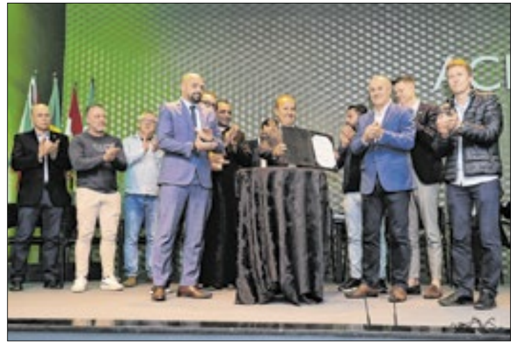
O governador Jorginho Mello anunciou a novidade

O governador Jorginho Mello e o secretário de Estado da Saúde, Diogo Demarchi, assinaram a autorização para a habilitação estadual em Unidade de Assistência de Alta Complexidade Cardiovascular para o Hospital Dom Joaquim, em Sombrio.