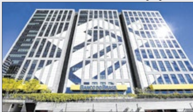
BB cria vantagens para os microempreendedores