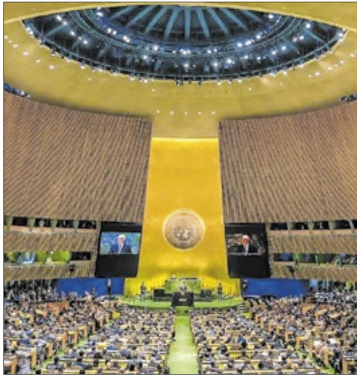
Presidente também participará da Cúpula do Futuro