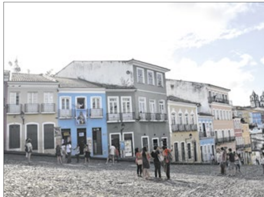
Capital baiana, Salvador está entre os concorrentes ao título ‘cidades mais desejadas’

Em 2023, mais de 91.000 leitores participaram das votações que teve o Brasil como o país mais dese-