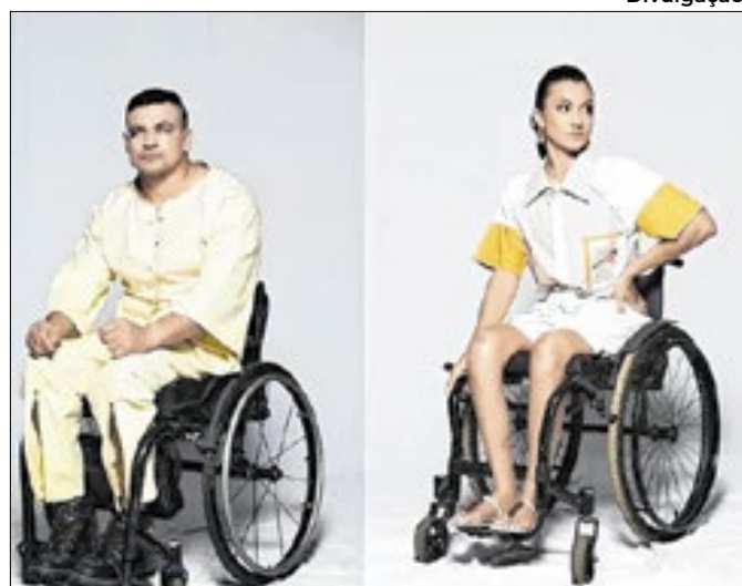
Evento gratuito promove a inclusão em Campo Grande

Estiagem prolongada atinge 148 dias e intensifica problemas