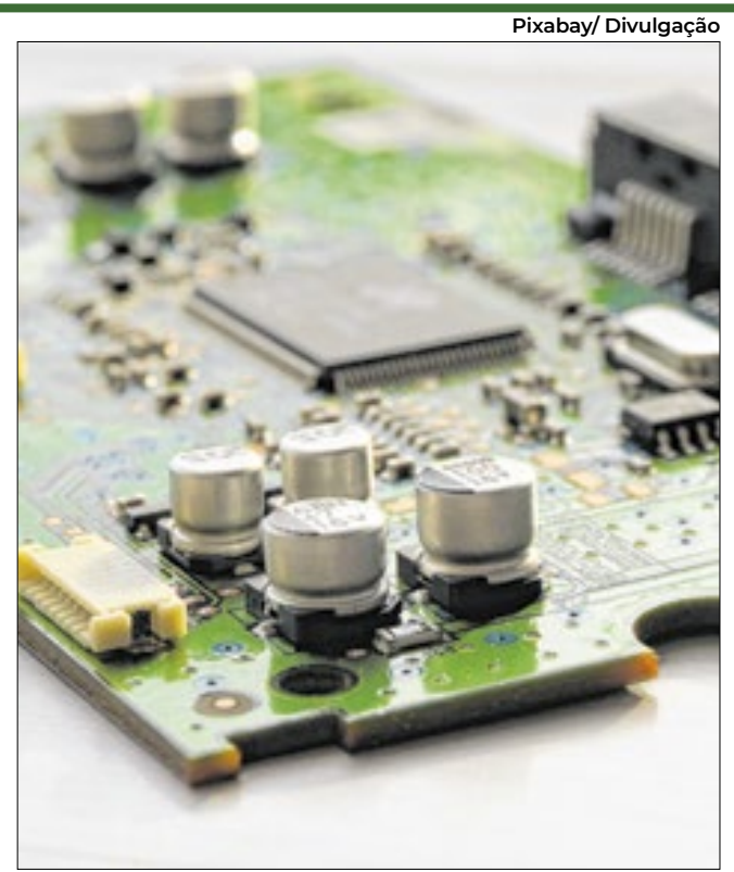
O “escudo de silício” da Ásia aplicou com sabedoria