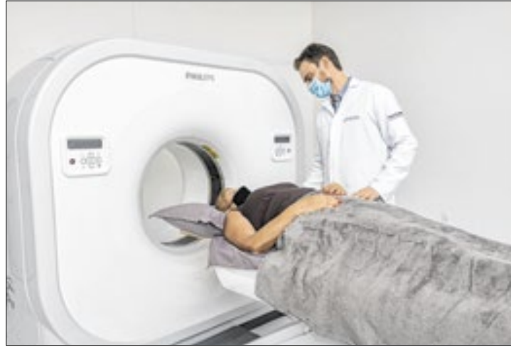
Tipo de câncer mais ligado à exposição é o de pulmão

O alerta da especialista aponta o caminho para evitar o surgimento de casos. “A melhor prevenção contra o câncer é a eliminação da exposição. Se cessar o quanto antes, a gente pode prevenir muitos casos no futuro.”