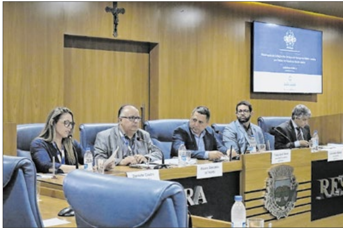
Detro-RJ e Setram concluem rodada de audiências públicas para apresentar a licitação

O Departamento de Transportes Rodoviários do Estado do Rio de Janeiro (Detro-RJ) e a Secretaria de Estado de Transporte e Mobilidade Urbana (Setram) concluíram a rodada de audiências públicas que apresentou à sociedade fluminense o modelo proposto para a licitação das linhas de ônibus intermunicipais de todo o estado. A última reunião, realizada na Procuradoria Geral do Estado, na segunda-feira (16), sucedeu