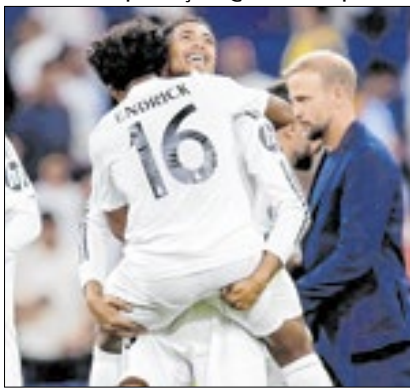
Endrick marcou na Champions

O menino Endrick, grande promessa do futebol brasileiro, enfim estreou na Champions League com a camisa do Real Madrid e já viu sua estrela brilhar. O garoto marcou o último gol da vitória por 3 a 1