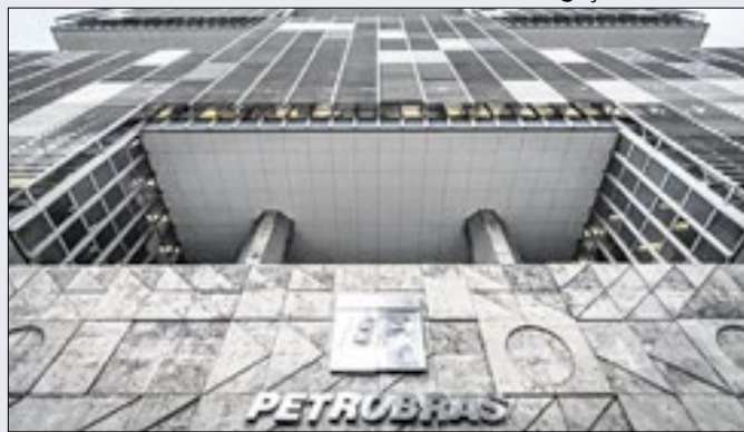
Emissão bilionária teve boa classificação de risco