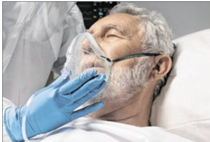
Crianças e idosos precisam de atenção especial