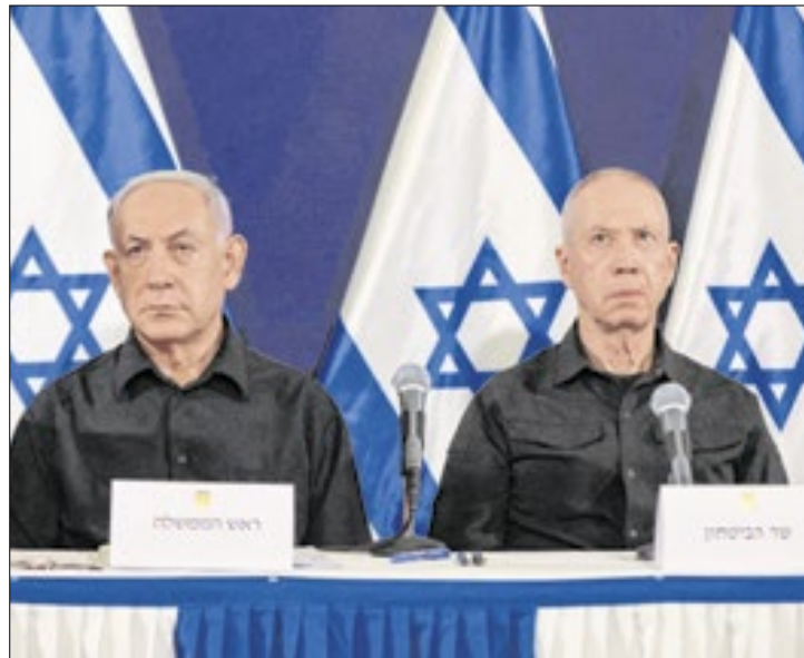
Yoav Gallant está sendo 'frito' em Israel e deve ser demitido

Gallant, militar aposentado, é rival de Netanyahu no Likud, e divergências entre os dois vem aumentando nos últimos meses. O ministro pressiona o governo a aceitar um