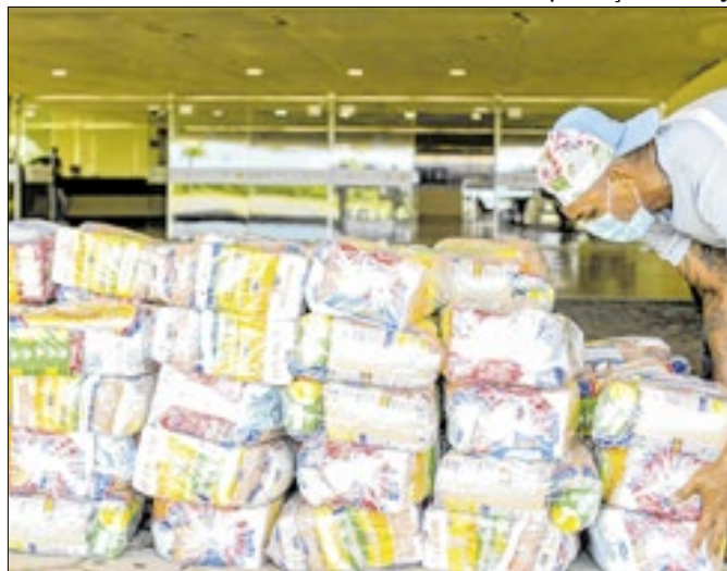
Cesta fluminense se aproxima do salário mínimo