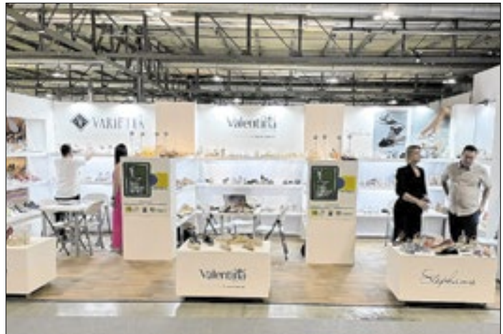
Empresas de calçados gaúchas fazem parte do espaço

Novo Hamburgo é a capital nacional do calçado. O setor calçadista é muito forte no Rio Grande do Sul, tanto que de janeiro a maio de 2024, o Estado foi o maior exportador de calçados do Brasil, com a comercialização de 13,15 milhões de pares, que geraram US$ 201 milhões. O destaque do setor calçadista no Estado colocou a Micam Milano, uma das principais feiras de calçados do mundo, no âmbito do Programa de Apoio à Participação de Empresas Gaúchas em Feiras Internacionais, coordenado pela Secretaria de Desenvolvimento Econômico (Sedec), desde 2023.