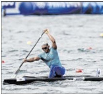
Isaquias levou seis ouros no Brasileiro

O medalhista olímpico Isaquias Queiroz encerrou a participação no Campeonato Brasileiro de Canoagem Velocidade com a conquista de seis medalhas em seis finais disputadas na competição realizada em Lagoa Santa (MG). Após brilhar na prova dos C1 1000 metros na última quinta (16), o baiano subiu no pódio nas provas dos 200 metros e dos 500 metros tanto no C1 quanto no C2, além dos C2 1000 metros do C1.