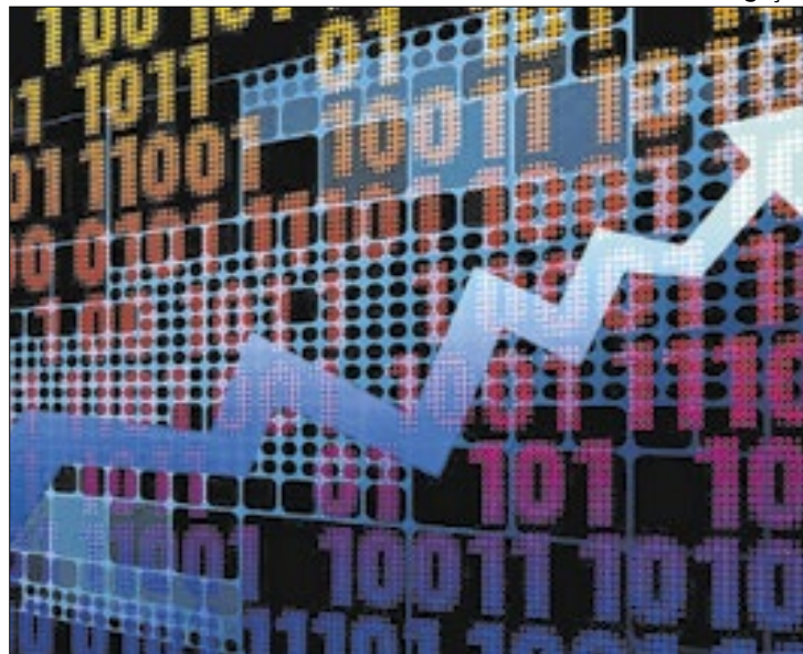
Petroleira turbinou reação positiva da bolsa brasileira

Em que pese a expectativa crescente do mercado quanto à definição dos juros básicos (Selic) pelo Comitê de Política Monetária (Copom) na quarta-feira (18) próxima, o avanço dos papéis da Petrobras forneceu a senha para a alta de 0,17% (a 135.118 pontos) do Ibovespa, na sessão dessa segunda-feira (16), mesmo ante às fortes perdas apuradas pela Embraer.