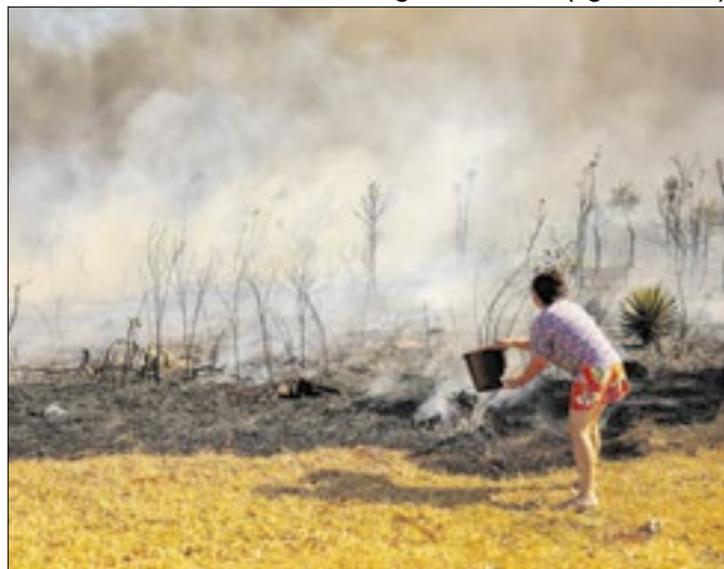
Incêndios são provocados por humanos, diz ministro

Fabio Rodrigues-Pozzebom (Agência Brasil)