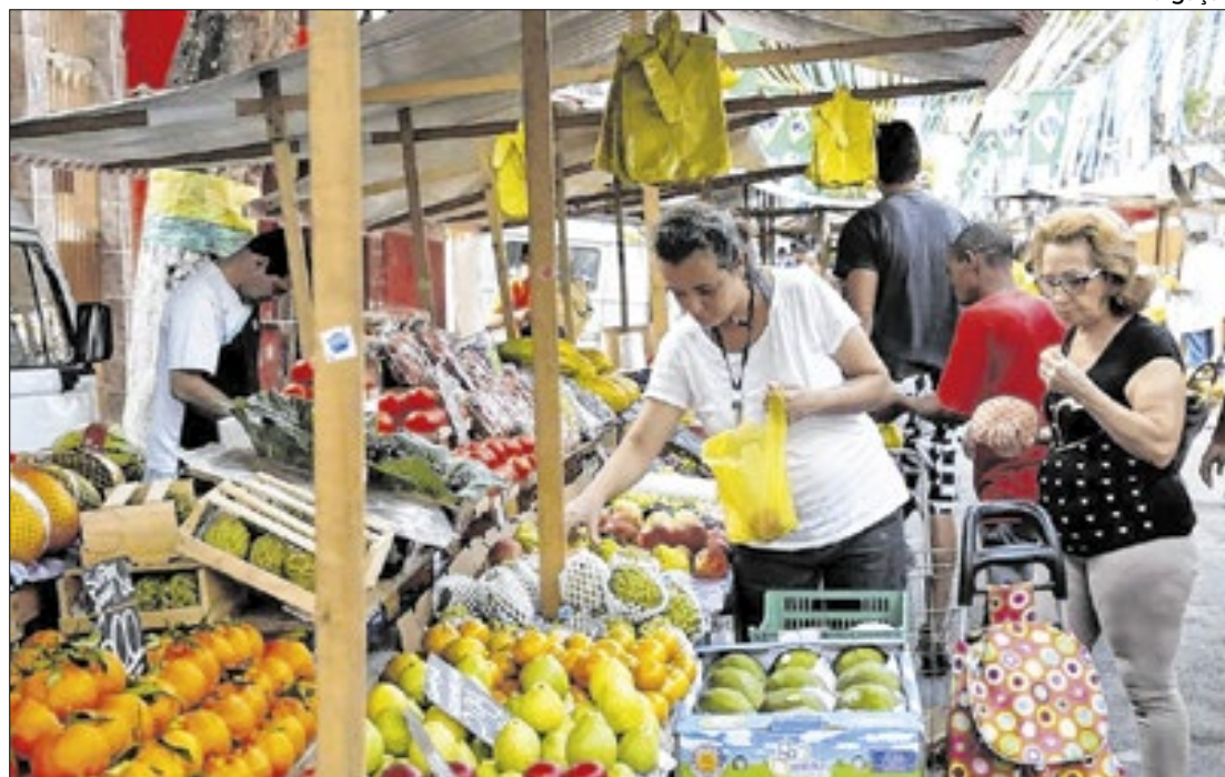
Enquanto o Focus projeta avanço da economia, a inflação também 'não dá trégua'

O mercado manteve a aposta de crescimento da economia, com alta do PIB, de 2,68% para