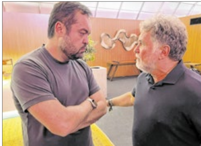
Durante conversa na área VIP, o governador do Rio, Cláudio Castro, e o ator Marcos Frota

Confira mais fotos do primeiro fim de semana na área VIP da histórica edição de 40 anos do Rock in Rio