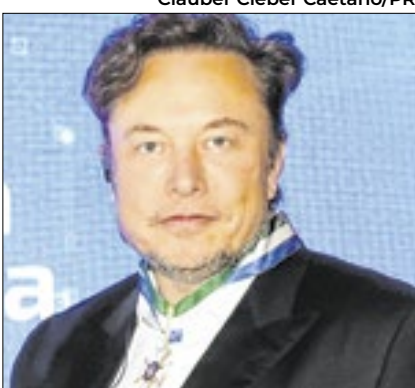
Elon Musk foi repreendido nos EUA

A Casa Branca criticou uma postagem de Elon Musk em que ele questionava o motivo de Kamala Harris e Joe Biden não terem sofrido nenhuma tentativa de assassinato, ao contrário de Donald