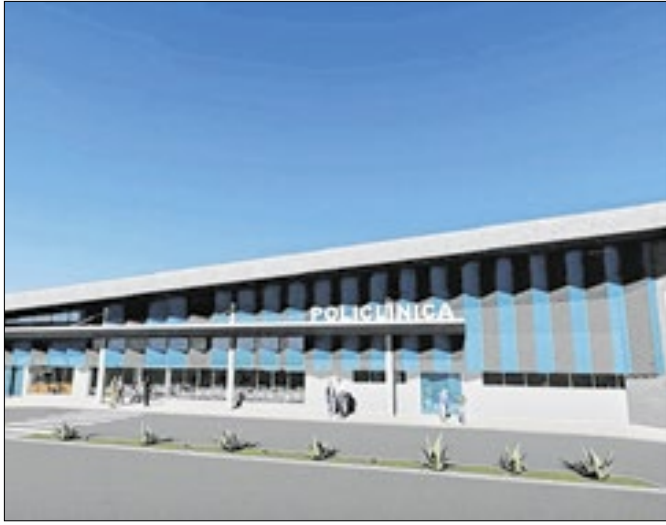
projeto foi protocolado junto ao Ministério da Saúde