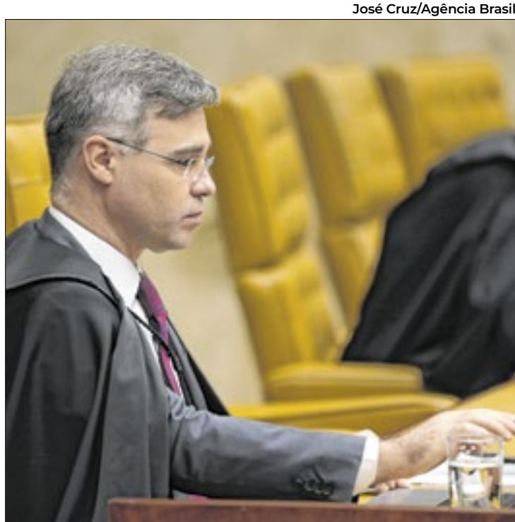
Pedido de vista de André Mendonça adiou o julgamento

“O padrão é o esvaziamento das ideias e a inclusão da política nesse universo virtual, transformando a realidade em cortes virais que possam gerar aumento de popularidade, números e, para alguns grupos, retorno financeiro”, completou Calmon.