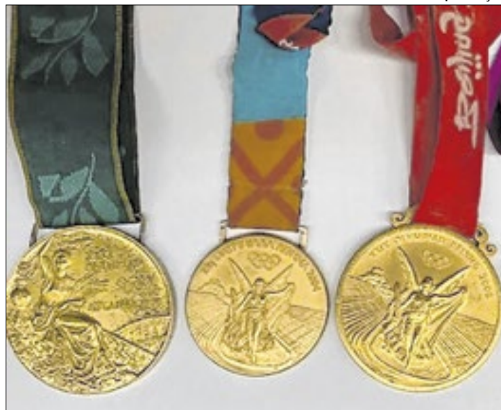
As medalhas de Drew Ginn estavam no carro, em Melbourne

“É um pedaço de metal, mas para mim é uma sensação terrível pensar e imaginar que as medalhas podem não estar na minha família. Gosto da