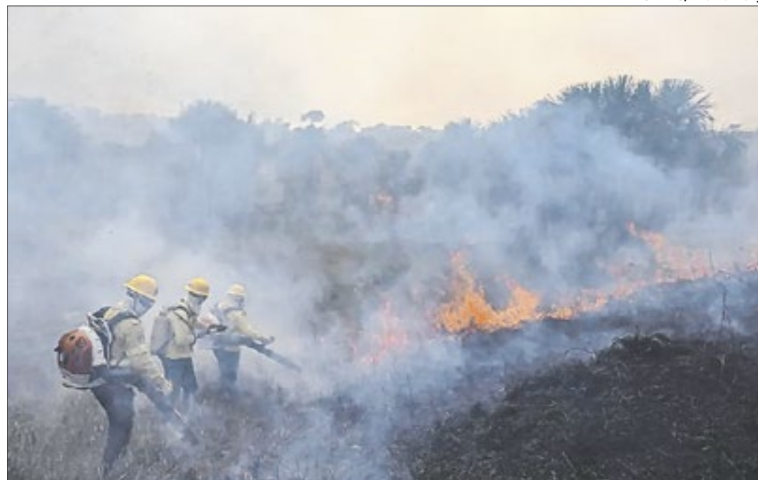
Brigadistas do Ibama tentam controlar queimada durante incêndio na Amazônia

O histórico de focos de queimadas no Amazonas durante setembro mostra variações significativas: 261 focos no dia 1º, 540 no dia 2, e 930 no dia 12.