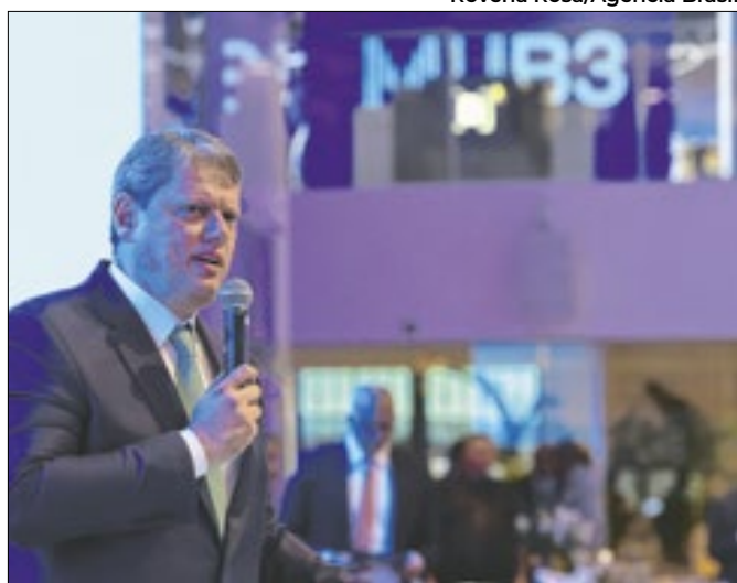
Tarcísio tem chance de atrair o MDB?