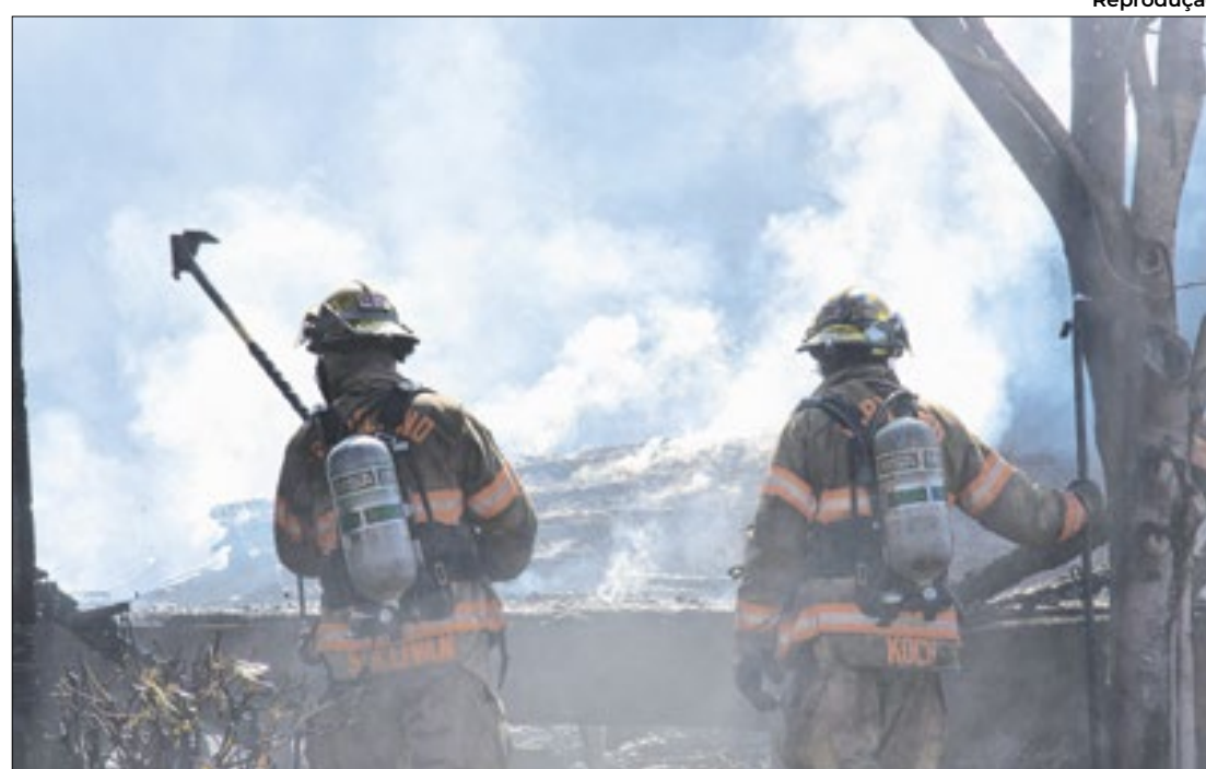
O estado, que ano passado era o 2º em queimadas no país, este ano está em 6º

O Corpo de Bombeiros reforçou as equipes locais nas cidades