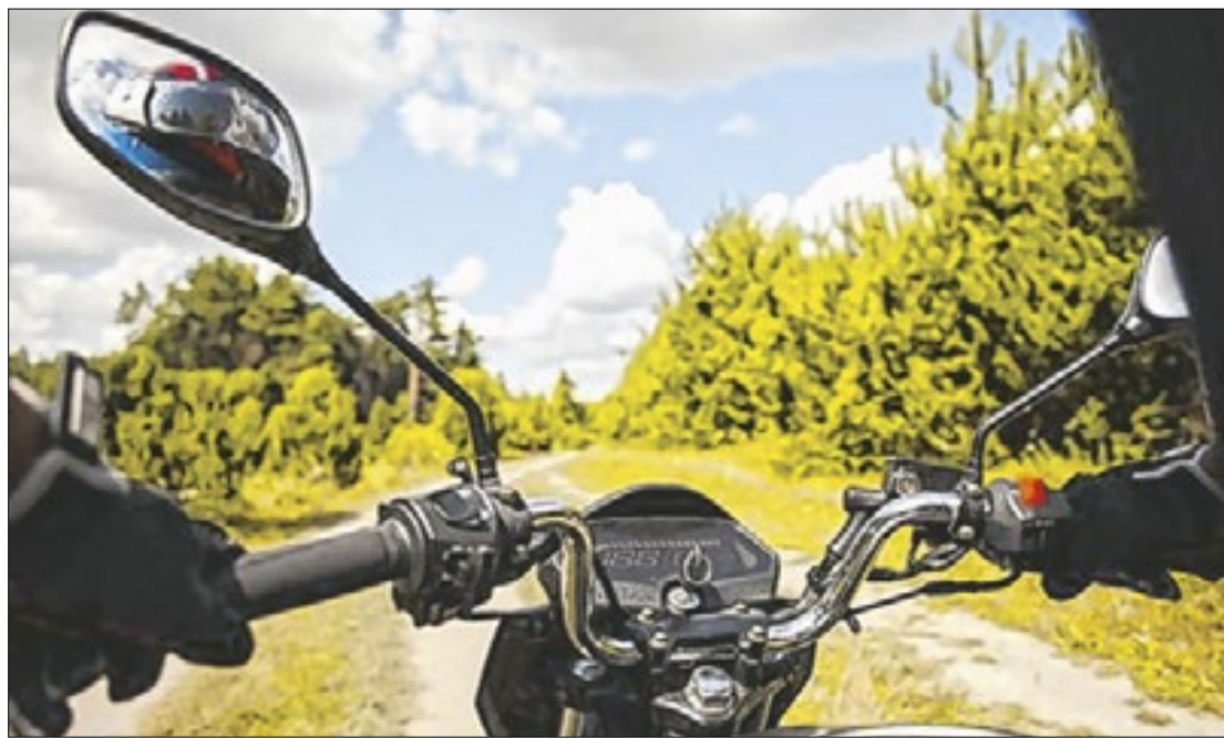
A pesquisa Senatran revela mudanças na dinâmica da mobilidade urbana

A pesquisa Senatran revela mudanças na dinâmica da mobilidade urbana, dificuldade de acesso à carteira de motorista por par-