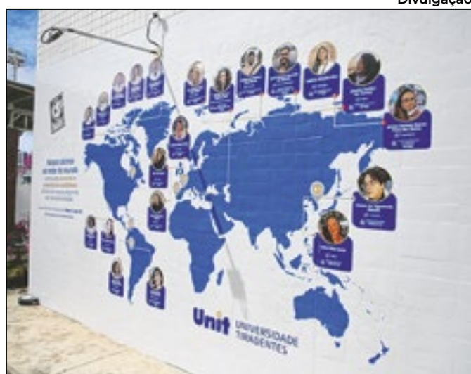
Estudantes orientam colegas de outros países