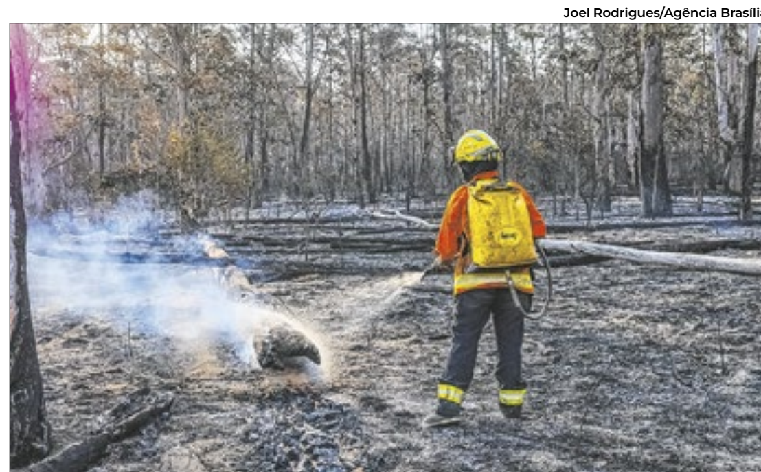
A grave seca somada à fumaça das queimadas provoca náuseas e vômito

O Distrito Federal registra uma média de seis mortes de motociclistas por mês, com 38 fatalidades no primeiro semestre de 2024, conforme o Detran-DF. Especialistas destacam a alta vulnerabilidade dos motociclistas e recomendam medidas para reduzir riscos.