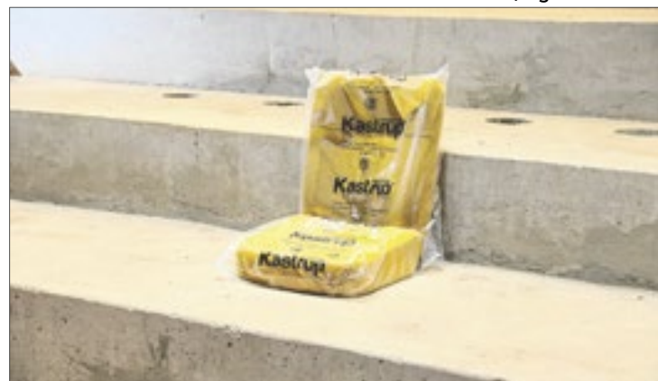
Os novos assentos seguem padrões de conforto, mas com materiais e segurança contra incêndio

mento possível, para tornar a Villa Lobos "a melhor sala de espetáculos do país", segundo Fernando Leite.