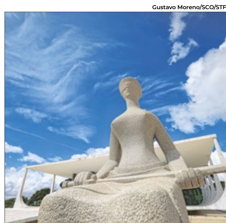
Plenário virtual do STF julga o caso do jogador Robinho

Além disso, seguem as discussões sobre o primeiro texto da regulamentação da reforma tributária (PLP 68//2024) na Comissão de Assuntos Econômicos (CAE) da Casa. Nesta quarta-feira (18), a CAE realizará mais uma audiência pública para discutir o tema, dessa vez com foco nos impactos da regulamentação da reforma tributária na infraestrutura brasileira – como por exemplo ferrovias, rodovias e aeroportos.