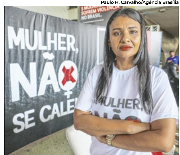
Apenas 11% das mulheres acham ruas de Brasília seguras

O estudo, realizado entre 21 de junho e 11 de julho de 2024, envolveu mais de 4 mil mulheres que utilizam diferentes meios de transporte. Além de Brasília, o levantamento também abrangeu outras oito capitais: Belém, Belo Horizonte, Fortaleza, Porto Alegre, Recife, Rio de Janeiro, Salvador e São Paulo. Os resultados evidenciam um padrão preocupante de violência enfrentada pelas mulheres.