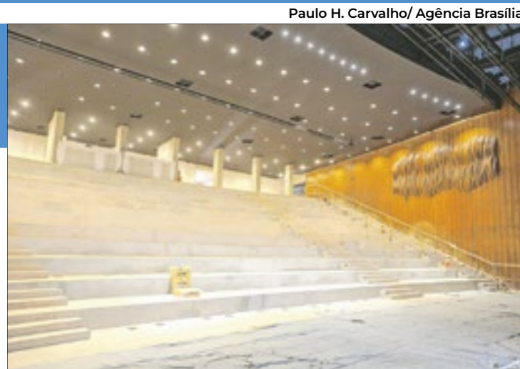
O espaço terá 488 novas cadeiras, desenhadas de acordo com a estética original esboçada por Sérgio Rodrigues

Isso tudo sem contar em equipamentos de som e de mecânica, nas coxias, para a troca de cenários. Tudo será trocado e receberá o melhor equipa-