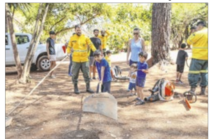
As crianças manusearam equipamentos usados pelos brigadistas no combate aos incêndios florestais

"Com a quantidade de queimadas que a gente está