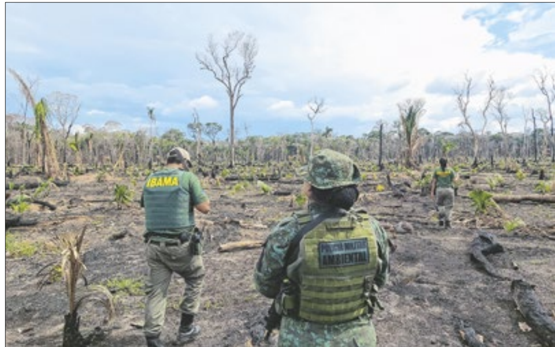
Depois de SP, equipes seguem para o Acre, Amazonas e Rondônia

da Saúde, Nísia Trindade, e a ministra do Meio Ambiente e Mudança do Clima, Marina Silva, participaram de reunião com o governador de São Paulo, Tarcísio de Freitas, para tratar da crise climática que atinge o estado.