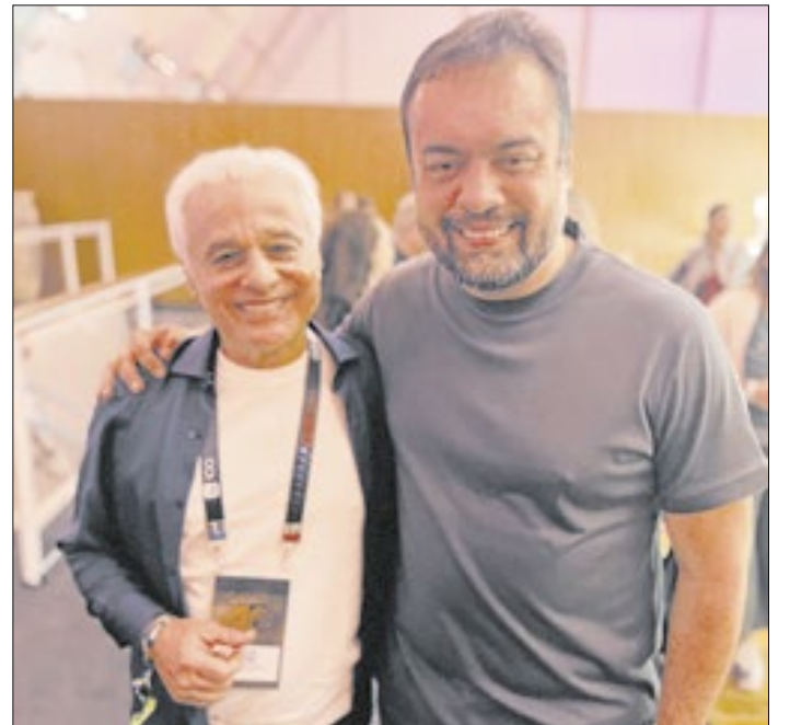
O grande anfitrião e criador do Rock in Rio, Roberto Medina, com o governador do Rio, Cláudio Castro, na área VIP do festival