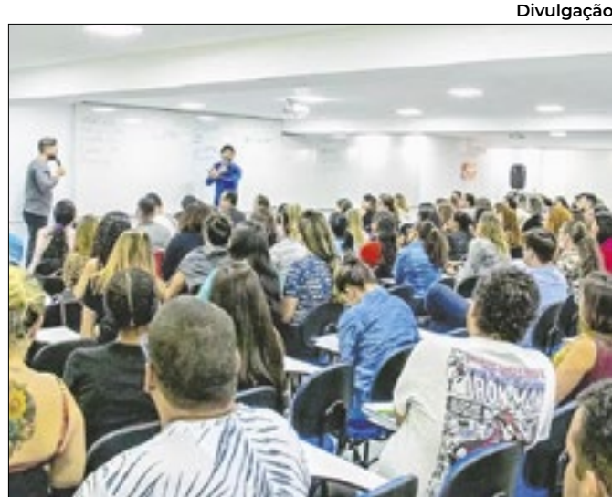
Curso oferece 300 vagas para qualificação em Brasília

Atendimentos na rede pública aumentaram 99% e preocupam