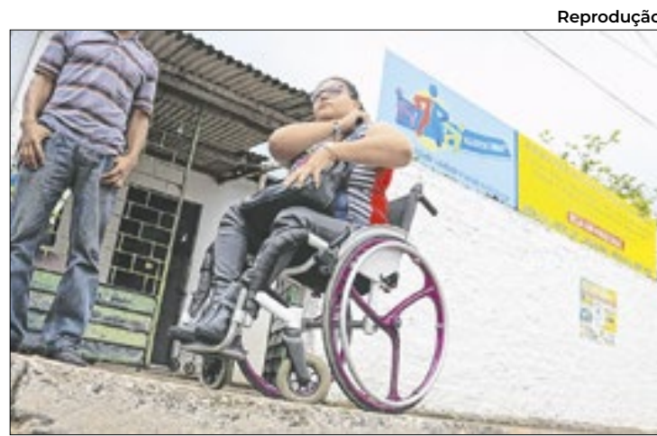
Calçadas representam grandes obstáculos

Além do combate direto aos incêndios, a operação tem promovido ações de conscientização junto às comunidades sobre os riscos e as consequências das queimadas irregulares, além de fiscalizações em áreas suscetíveis a incêndios. Segundo o tenente-coronel José Lisboa, oficial de Informação da operação, a ação tem sido eficiente tanto no controle quanto na prevenção de novos focos. Ele destacou que a resposta rápida e a mobilização contínua das equipes têm sido fundamentais para a redução do impacto ambiental das queimadas no estado.