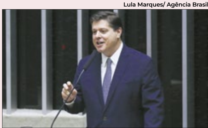
Baleia deve manter MDB com Lula

Assim, segundo a avaliação de emedebistas ouvidos pelo Correio Político, não há hoje hipótese de o partido vir a deixar Lula. A não ser que uma catástrofe torne hoje o atual presidente completamente inviável. O MDB não abandonou seu tradicional pragmatismo.