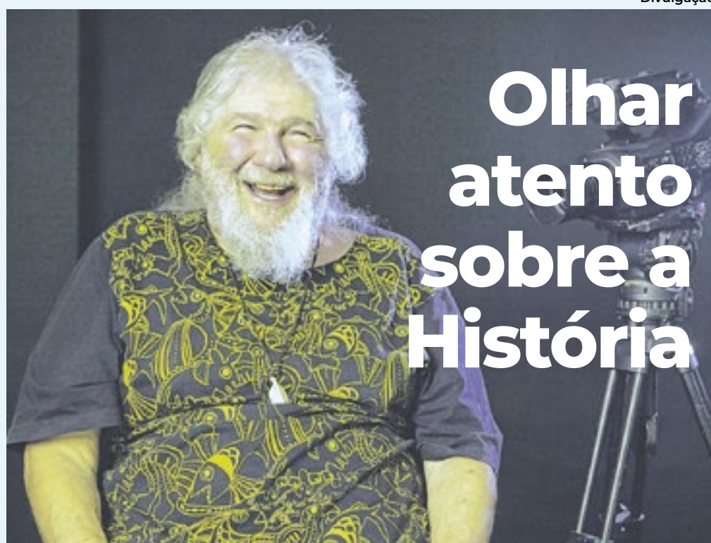
Após sofrer parada cardíaca, Tendler se reinventa com novo .doc e curadoria

Realizador de sucessos como 'Anos JK' e 'Jango', Silvio Tendler, o documentarista de maior bilheteria no Brasil, prepara documentário sobre Leonel Brizola e assume a curadoria de mostra na Casa de Rui Barbosa