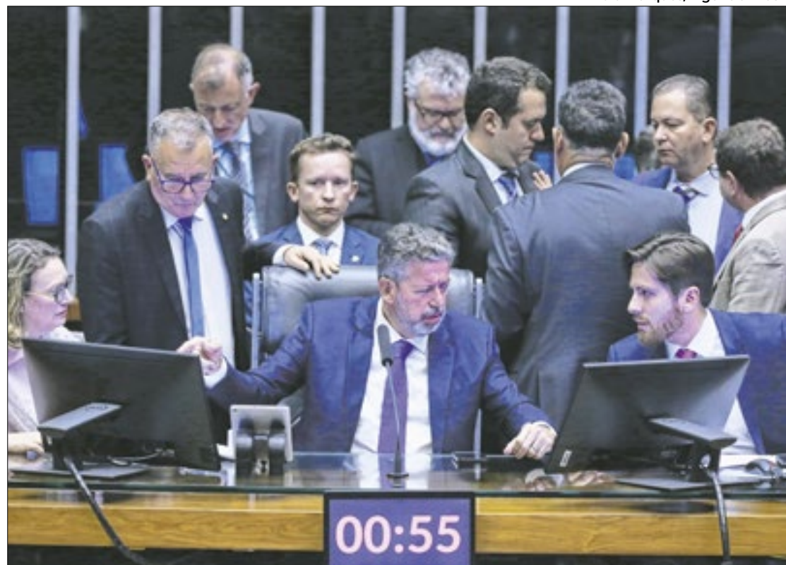
Lira no comando do Centrão. O bloco racha na disputa pela Câmara?

Essa divisão quanto aos candidatos à presidência da Câmara leva ao questionamento se a candidatura de Hugo Motta