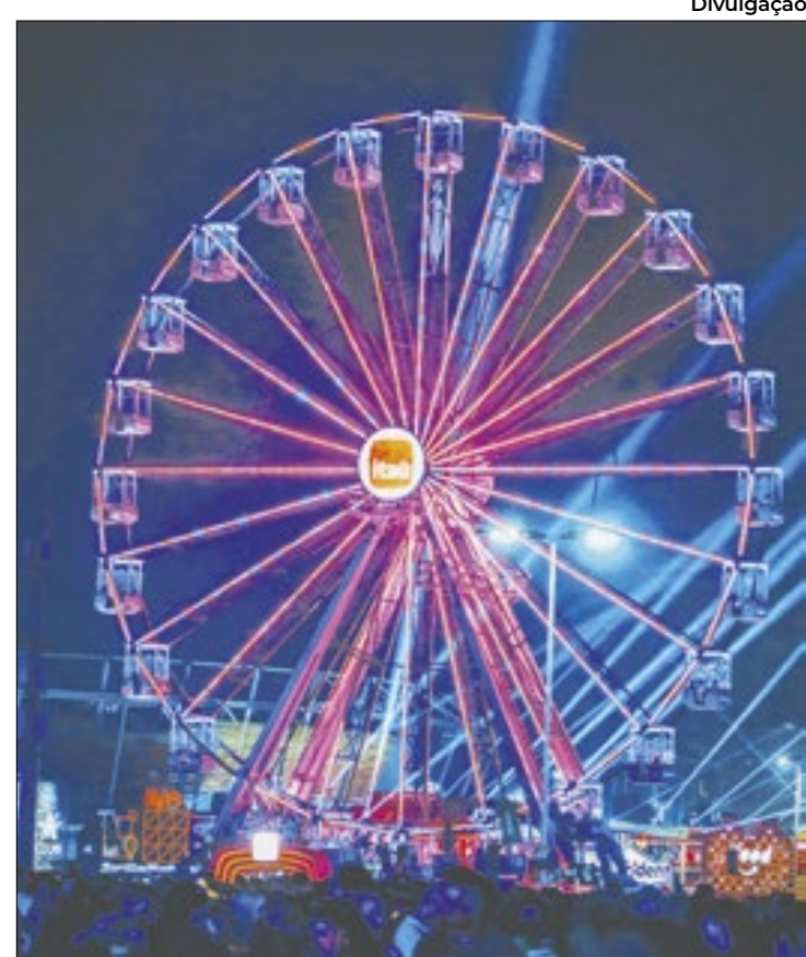
Roda Gigante sendo mais uma vez o cartão-postal do RiR