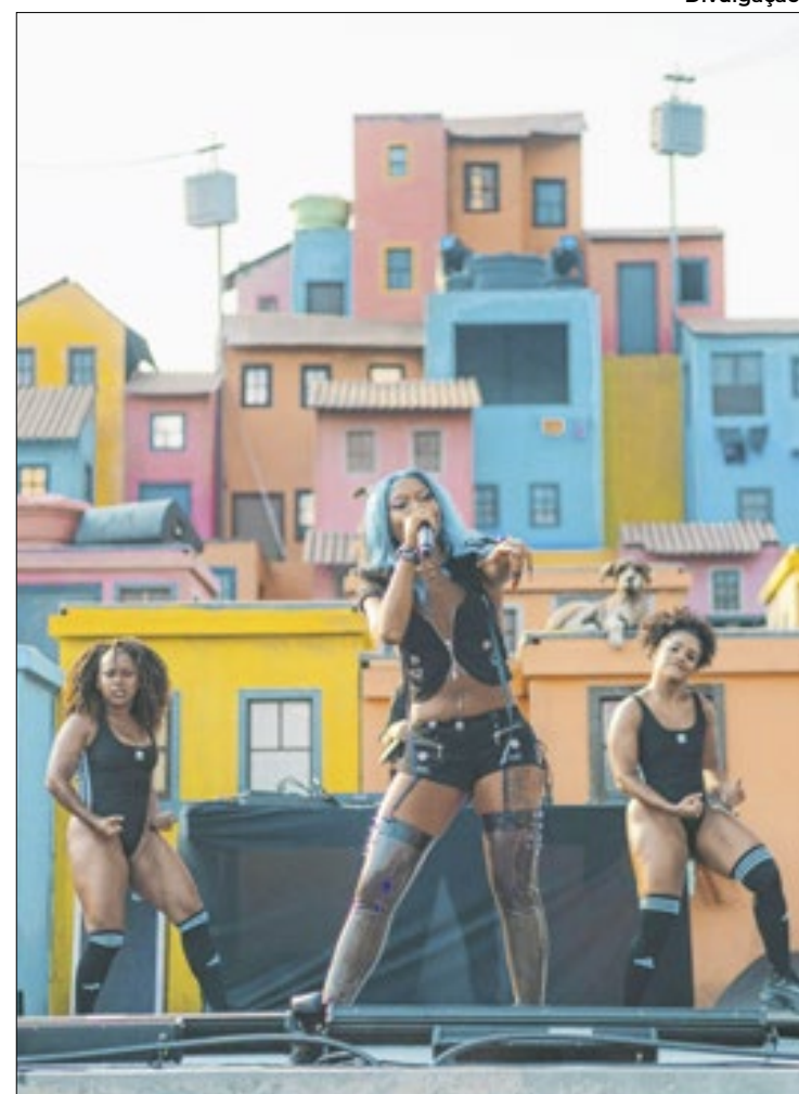
Palco Favela, muita cultura dando voz à periferia