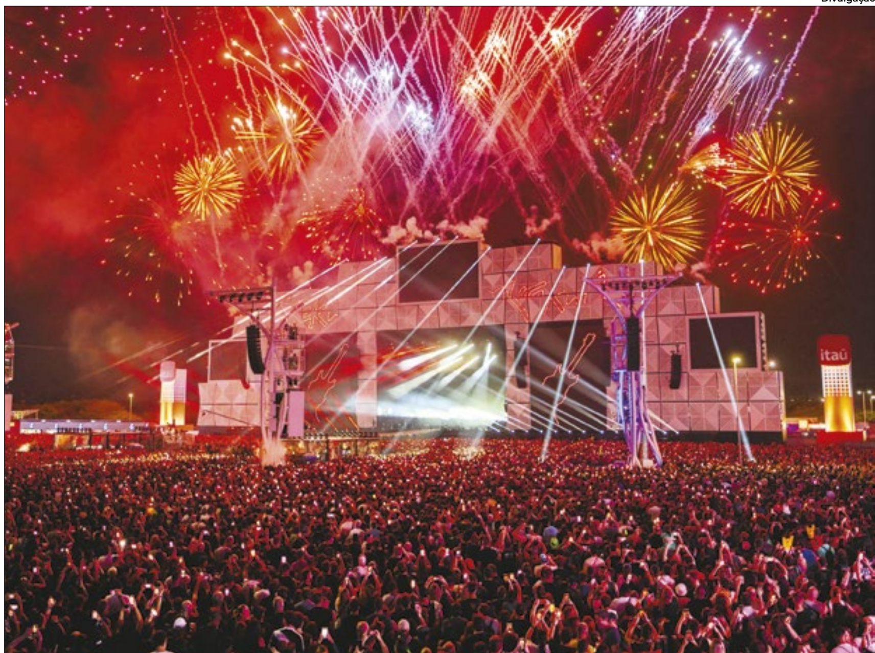
Um mar de gente esteve em frente ao palco Mundo para conferir os icônicos shows