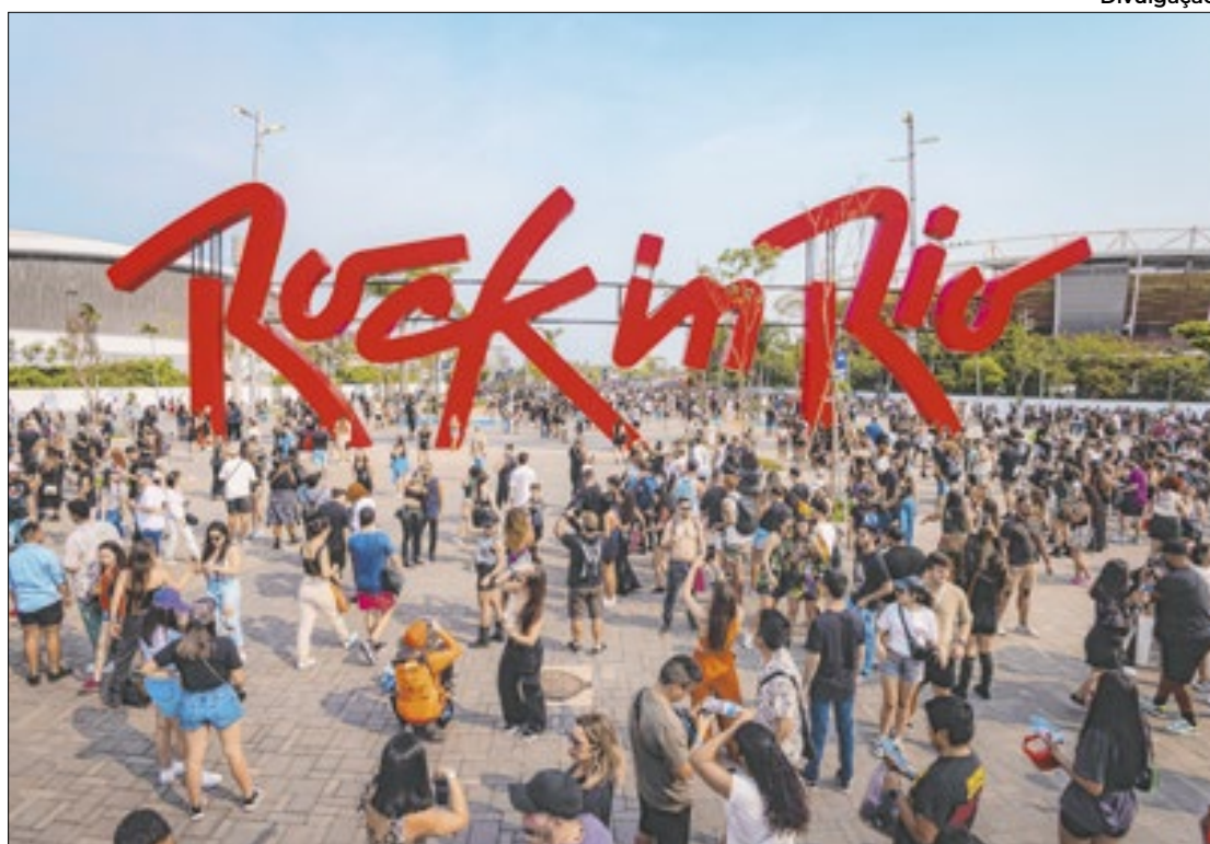
Mais de 67% do público avaliou entre 9 e 10 o primeiro dia do festival