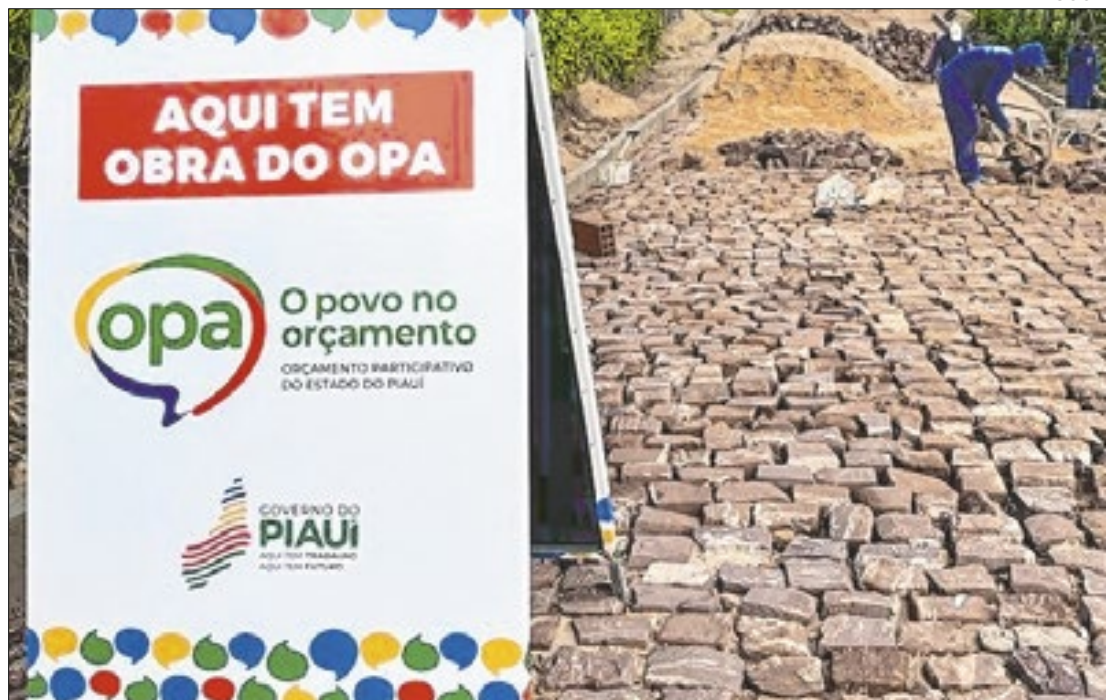
A academia é resultado da escolha direta da população

Outra comunidade beneficiada com pavimentação em paralelepípedo é o Assentamento El Shaday. Com uma