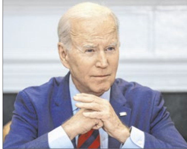
Biden, porém, não sancionou o setor petrolífero do país

"A Venezuela rejeita, nos termos mais enérgicos, o novo crime de agressão cometido pelo governo dos Estados Unidos da América contra a Venezuela [...] em um ato grosseiro, que busca se congruar com uma classe política que lançou mão de práticas fascistas e violentas para derrubar, sem sucesso, a democracia