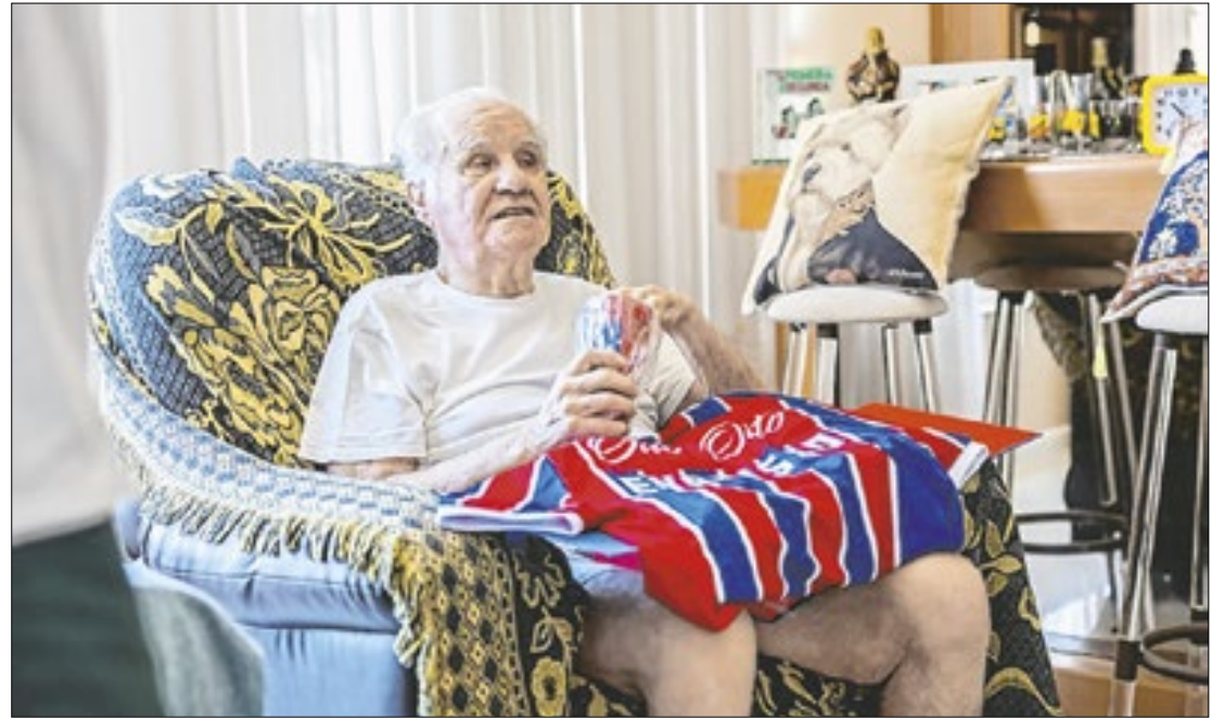
Evaristo de Macedo atravessou gerações, 'furo a bolha' e agora é 'Web-Celebridade'

-Negro, foi tricampeão carioca em 1953, 1954 e 1955 e, posteriormente, ganhou mais um Estadual em 1965. Conquistou também a Taça dos Campeões Estaduais Rio-São Paulo, em 1955. Também foi treinador do Fla em três oportunidades, entre meados da década de 90 e de 2000.