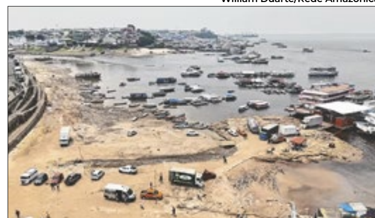
Decreto de 180 dias visa mitigar impactos da estiagem