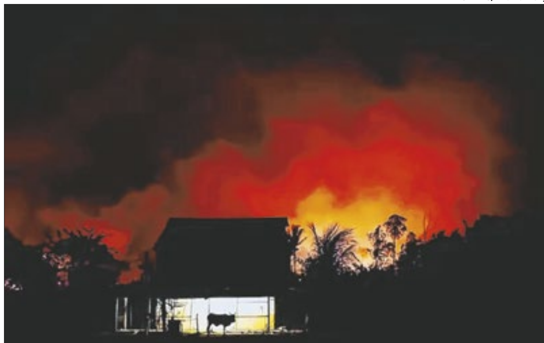
Fazenda perto de um incêndio florestal na Rodovia Transamazônica

Entre 1º de janeiro e 9 de setembro de 2024, a Amazônia registrou mais de 82 mil focos de incêndio, o dobro dos casos em 2023 e quase alcançando o recorde de 85 mil focos de 2007.