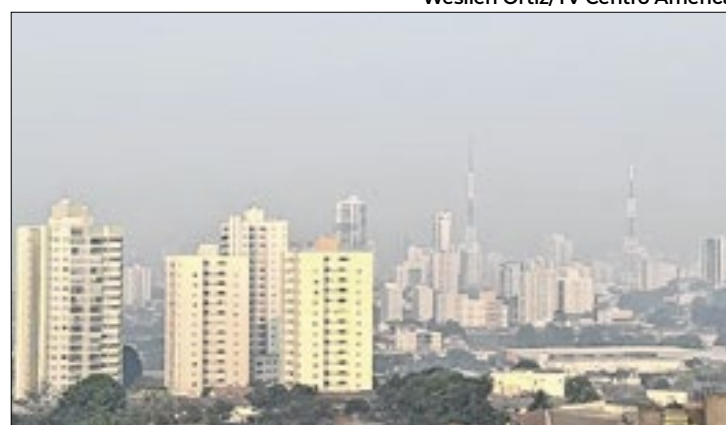
Céu de Mato Grosso na manhã de quinta-feira (12)