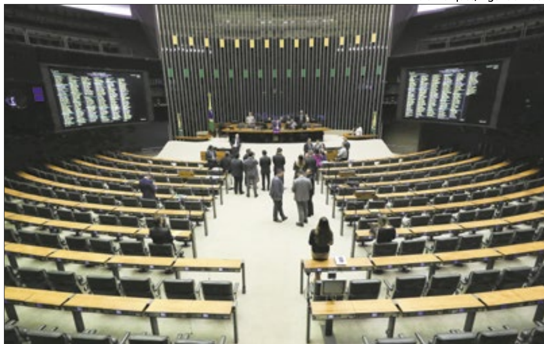
Em sessão esvaziada, deputados concluíram a votação da reoneração da folha

Quando o Congresso resolveu manter este ano a desoneração da folha de pagamento dos 17 principais setores da economia e acrescentou também municípios ao projeto, o Supremo