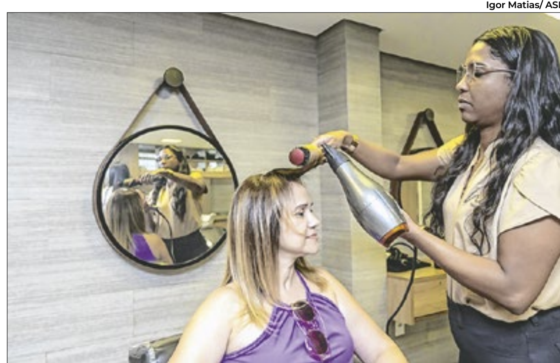
O acumulado no ano apontou aumento de 11,1%, e nos últimos 12 meses

O governo do Maranhão, por meio do Departamento Estadual de Trânsito do Maranhão, realiza na sexta-feira (13) o projeto Direção Certa, no Centro de São Luís. A ação será promovida pela Coordenadoria de Educação para o Trânsito, com o Batalhão de Polícia Rodoviária.