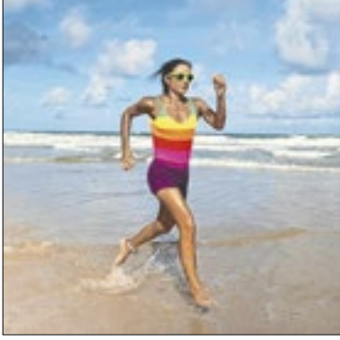
Keller vai para o Hall da Fama

Fernanda Keller, 60, é a pessoa brasileira mais vitoriosa na história do triatlo. A triatleta agora se torna também a primeira da América Latina a ter seu nome incluído no Hall da Fama do Ironman mundial. "Foi como um sonho", disse Fernanda.