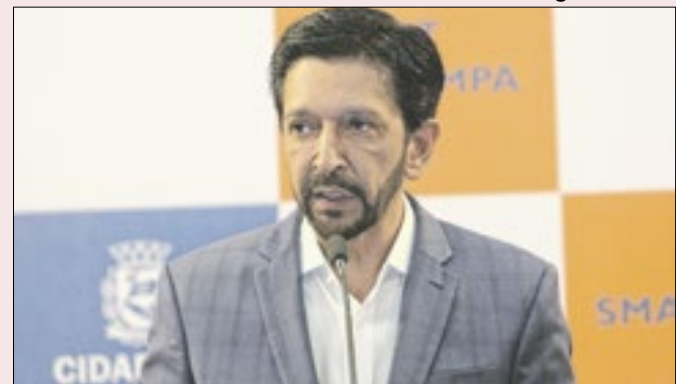
Prefeito tenta se afastar da polarização