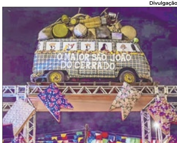
Evento se estende pelo final de semana