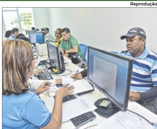
O Mutirão prossegue por toda semana, até o dia 20

A região ficou entre os quatro estados com maior variação