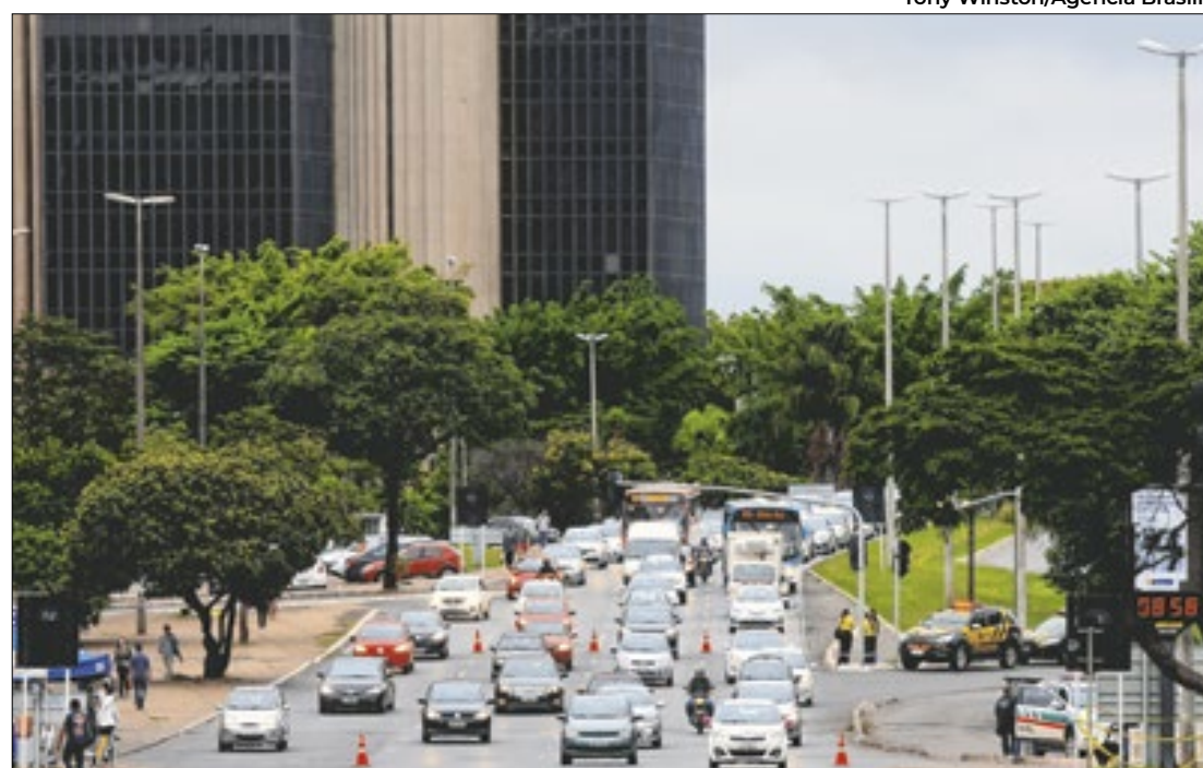
Número de carros pode provocar gargalo no trânsito de Brasília

Crescimento na frota de veículos traz desafios à mobilidade