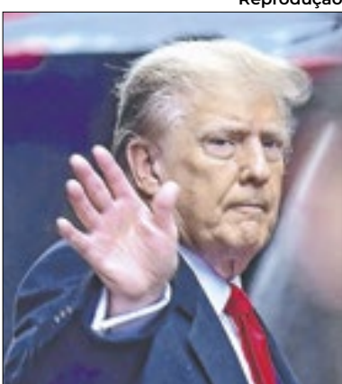
Trump não irá a mais debates

Donald Trump anunciou nesta quinta-feira (12) que não participará de um novo debate contra a sua rival do Partido Democrata, Kamala Harris.