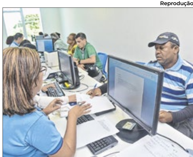
O Mutirão prossegue por toda semana, até o dia 20

A região ficou entre os quatro estados com maior variação