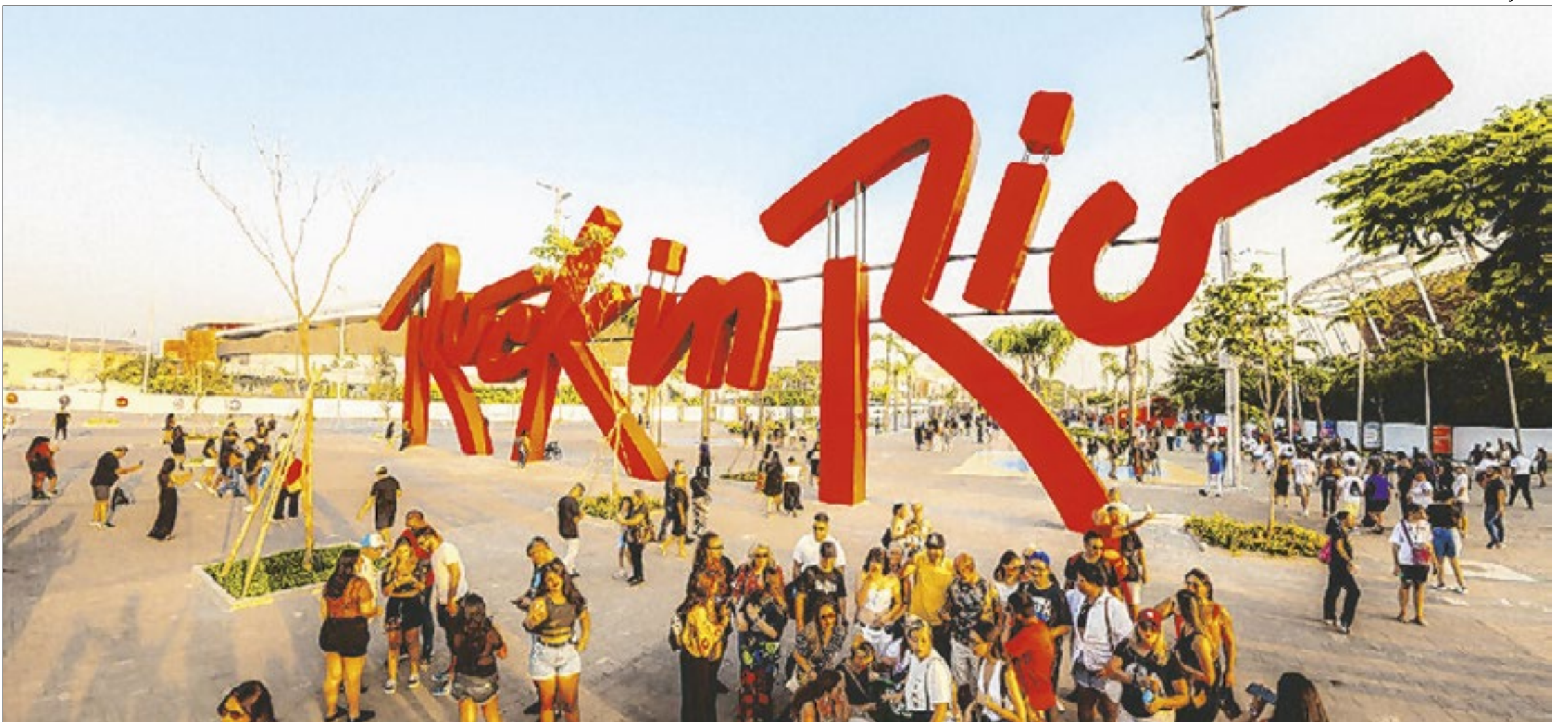
Festival contará com diversos pontos de hidratação e áreas de refresco para o público; além de muita música e entretenimento para todos

Confira guia completo para os fãs aproveitarem ao máximo as 500 horas de experiências