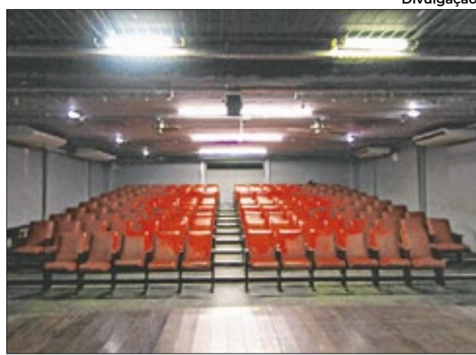
Centro de Cultura Raul de Leoni em Petrópolis