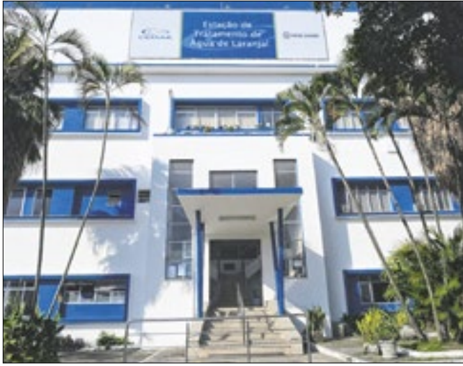
Força-tarefa consiste em obras emergenciais

Estação de Tratamento Imunana-Laranjal (Carlos Magno)