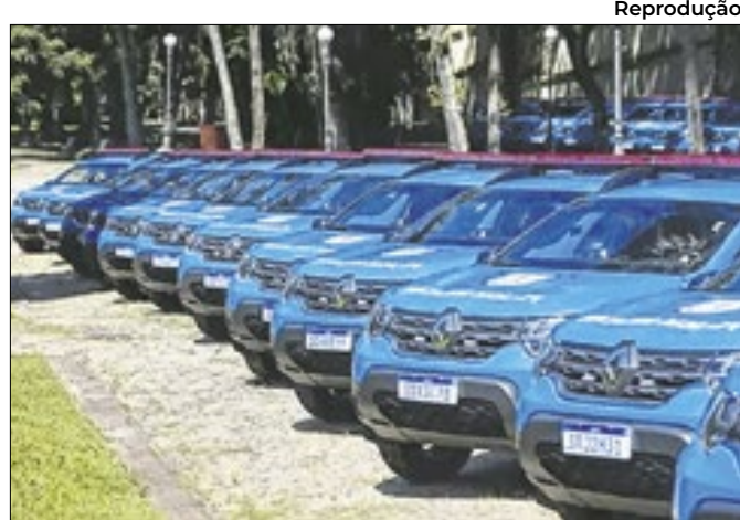
Reprodução Diligências visam reduzir a criminalidade