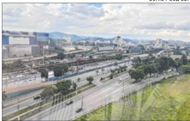
CSN consegue prorrogar o TAC por mais dois anos