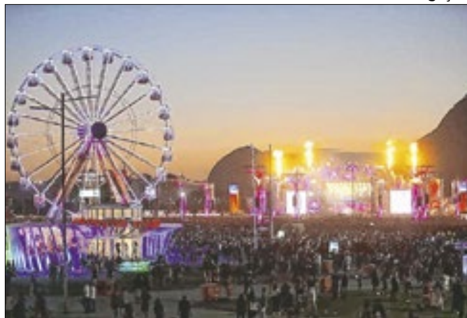
Acesso principal do festival será pelo BRT e Metrô