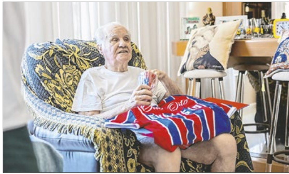
Evaristo de Macedo atravessou gerações, 'furo a bolha' e agora é 'Web-Celebridade'

-Negro, foi tricampeão carioca em 1953, 1954 e 1955 e, posteriormente, ganhou mais um Estadual em 1965. Conquistou também a Taça dos Campeões Estaduais Rio-São Paulo, em 1955. Também foi treinador do Fla em três oportunidades, entre meados da década de 90 e de 2000.