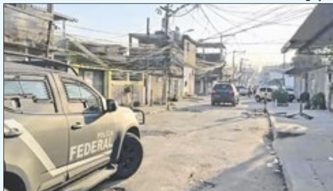
Líderes do grupo criminoso ocuparam cargos públicos