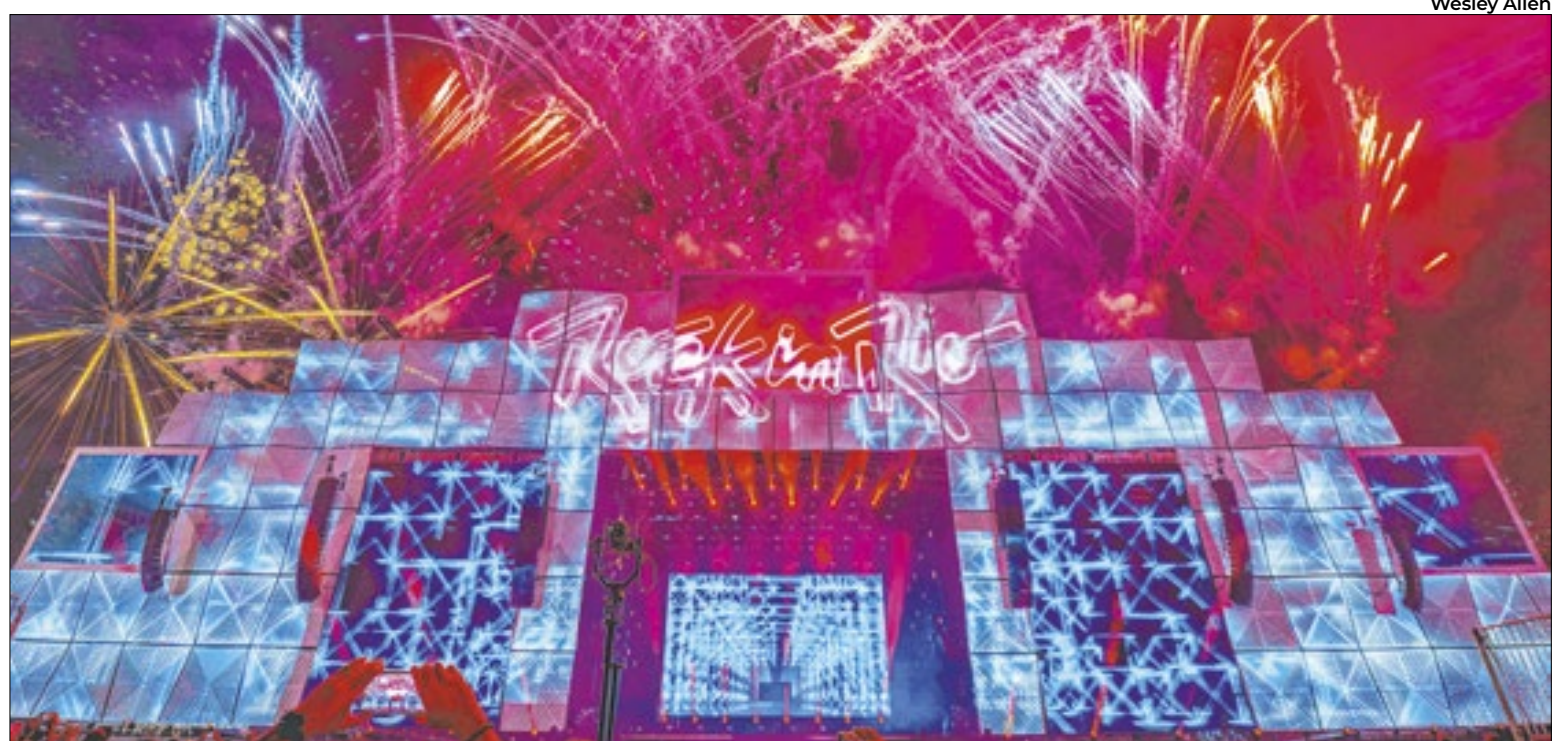
Principal palco do festival, Palco Mundo está preparado para receber grandes artistas nacionais e internacionais

todos os palcos. A plataforma também conta com uma contagem regressiva para cada atração, auxiliando os usuários, por meio de notificações, a não perder nem um minuto dos shows programados em suas agendas. Também será por meio do aplicativo que o agendamento dos brinquedos será feito de forma inovadora, que usará a geolocalização do usuário para liberar os horários de agendamento de brinquedos quando o fã estiver dentro da Cidade do Rock, sem necessidade de ficar em fila para garantir seu lugar.