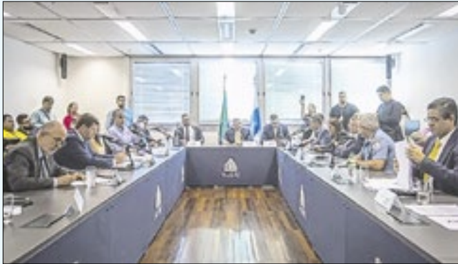
Comissão Parlamentar de Inquérito (CPI) da Transparência