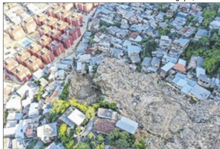
Petrópolis enfrenta desafios frente às mudanças climáticas

Entre as ações estão programas específicos para a inserção das vítimas de tragédias climáticas no mercado de trabalho, es-