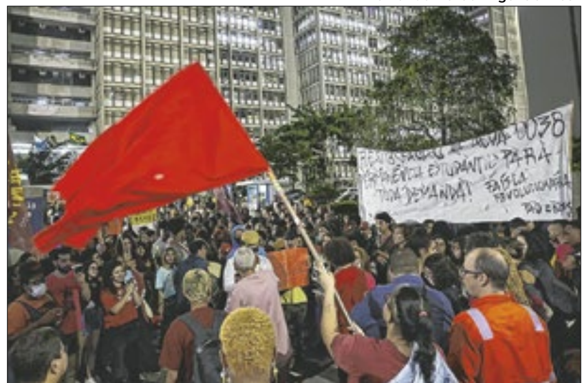
Pedido de desocupação acirra crise entre reitoria e estudantes

Em mais um round do impasse que tomou conta da UERJ (Universidade do Estado do Rio de Janeiro), por conta da intolerância da diretoria da instituição, no sentido de retomar os critérios anteriores, para concessão de bolsas e auxílios de assistência estudantil, as lideranças da paralisação na – em nome de seus mais de 38 mil estudantes, sem contar, 3 mil professores e 5 mil técnicos administrativos – convocaram nova manifestação, nessa quinta-feira (12), no campus do Maracanã, Zona Norte, como forma de resistência, ao pedido de desocupação integral da universidade, vencido às 10h, desse mesmo dia.