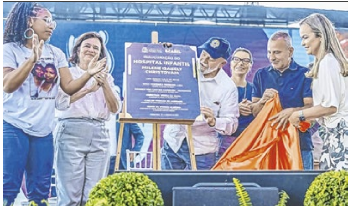
Lançamento da Rede Alyne e inauguração do Hospital Milene Isabely Christovam

Um programa que assegure às gestantes uma gravidez tranquila e um parto saudável para a mãe e o bebê. Que esteja atento às desigualdades étnico-raciais e regionais e que, em última instância, seja capaz de reduzir a mortalidade materna, principalmente os óbitos observados em mães pretas, cujas taxas aumentaram consideravelmente nos últimos anos. Foi com esse objetivo que o presidente Luiz Inácio Lula da Silva participou, nesta quinta-feira, 12 de setembro, em Belford Roxo, no Rio de Janeiro, da cerimônia de lançamento da Rede Alyne de cuidado integral a gestantes e bebês, além da inauguração do Hospital Milene Isabely Christovam, com foco na medicina infantil. O novo hospital conta em sua estrutura com 21 leitos, seis consultórios, dois centros cirúrgicos e espaços dedicados à criança, como brinquedoteca e sala colorida de assistência psicológica.