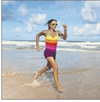
Keller vai para o Hall da Fama