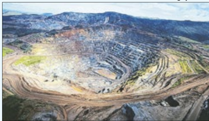
Casa de Pedra, em Congonhas, preocupa moradores