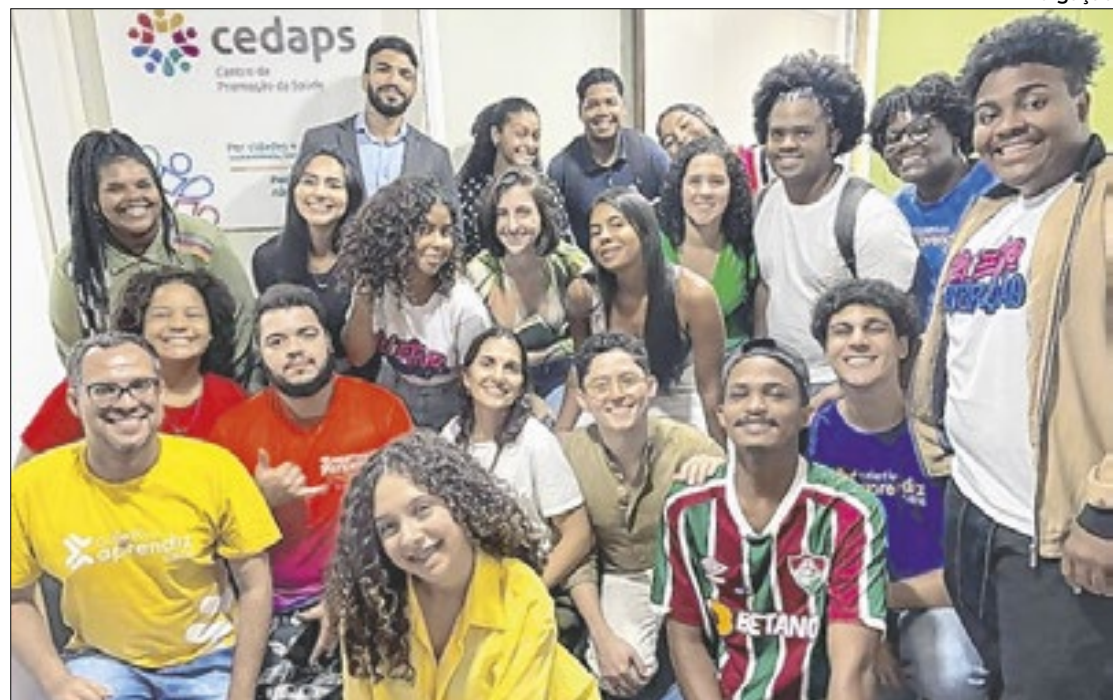
Inclusão social de jovens é o tema central de projeto, de cunho internacional

Para ilustrar a gravidade da situação, basta citar a Pesquisa Nacional por Amostra de Domicílios Contínua (Pnad) – divulgada em março deste ano,